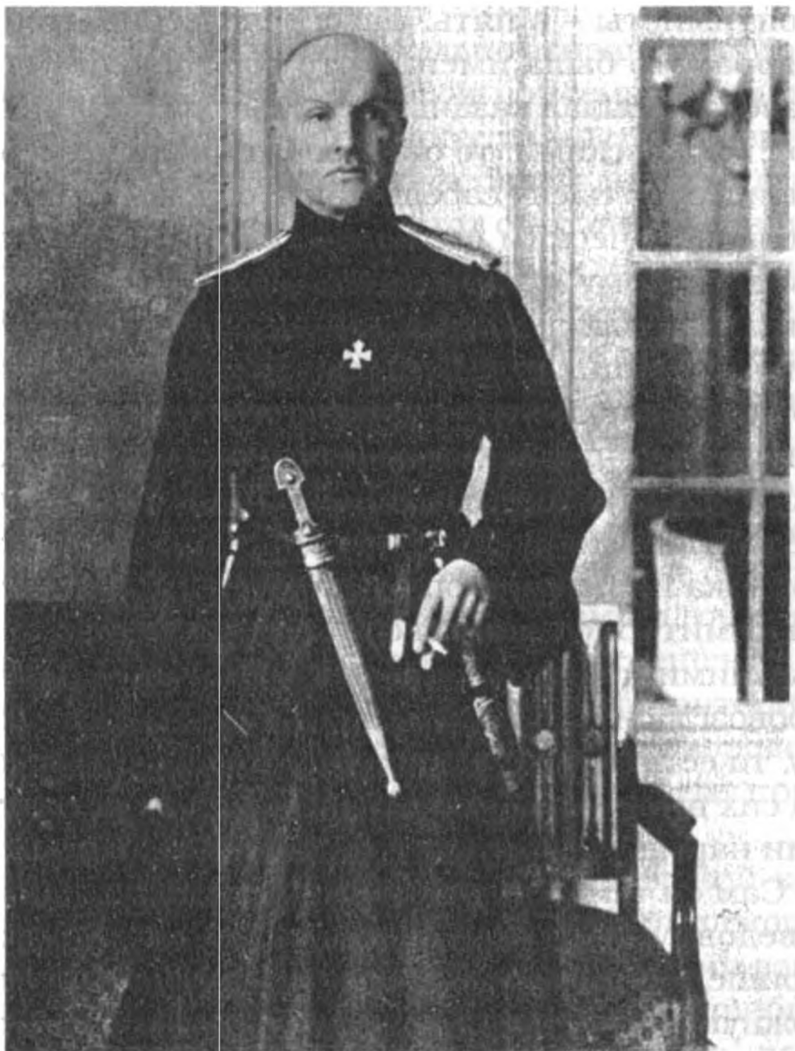
Гетман П. П. Скоропадский