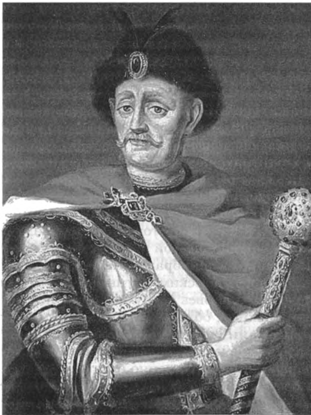
Портрет Ивана Мазепы