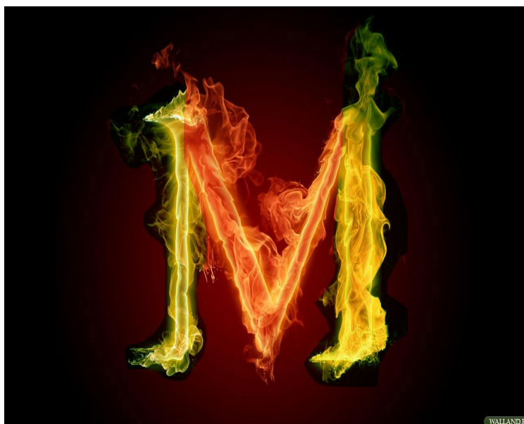
Рис.3. Буквы V и M: корень и плод

Таким образом, код Леонардо — не М, но V, Центр ее: не Мать-портрет, Это глаз как Познания нуль, иММанентность, по Брауну, — но Мать-То, Глубь, Трансценденция: Жена как Суть, Лоно — Мир, нас влекущий в Себя самое. Буква V — Глуби имя: предлог В, V' нутри, лат. in: Иное — Глубь, Суть под коркою; Глуби муж — инок: То в Сем как в ларце золотой. V и M в связи их — глубь и зримость, причина и следствие, корень и плод (рис. 3).