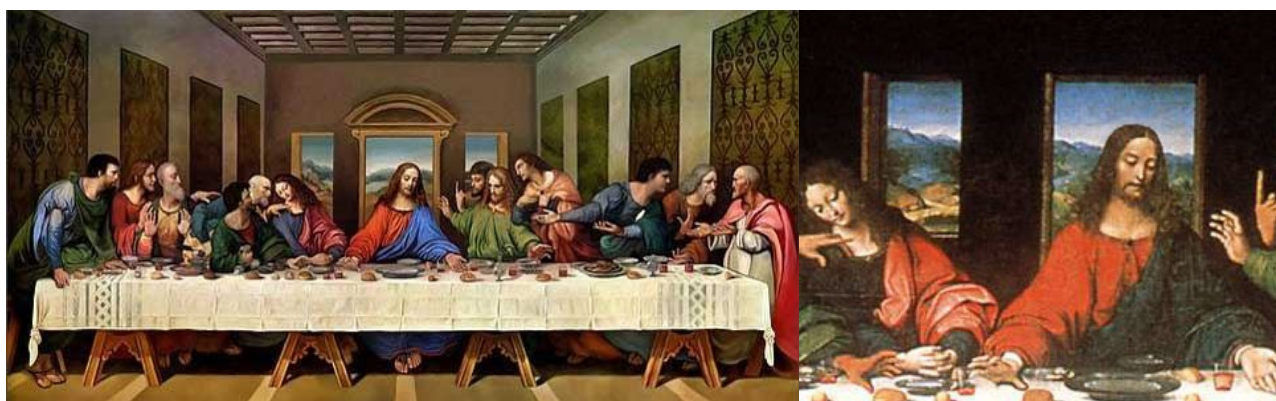
Рис.2. Просвет меж Христом и Марией — V, Вино, Суть V'ѣчери

О Вине, V, рек Браун, не зря буквы сей, как о Чаше, из коей Христос поил бывших на V'ѣчере. Чаша на фреске — разъем меж Христом и Марией, Жены печать: Мать как Vagina, ПрОВАЛ, сверх числ Ноль (рис.2).