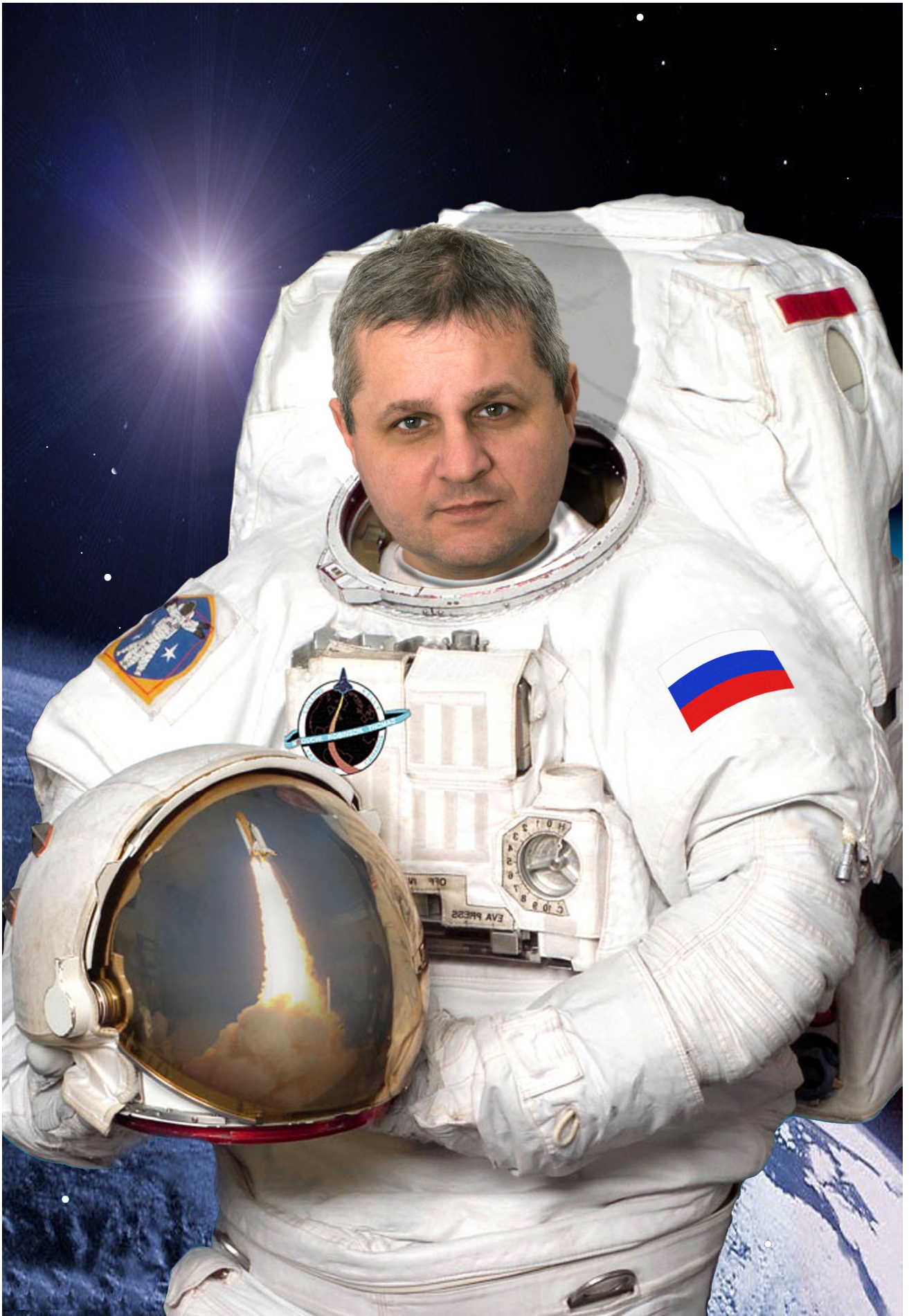
L una * O leg * V ladimirovich * E rmakov