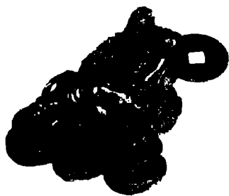
Рис. Трехлапая жаба

тех пор Жаба расплачивается за причиненные, неприятности, выплевывая золотые монеты. Обычно фигурку Трехлапой жабы ставят возле входной двери так, чтобы создавалось впечатление, будто она впрыгивает в дом. Еще Жабу можно поместить в фонтан с движущейся водой, это также будет увеличивать вашу денежную удачу. В китайской культуре Жаба символизирует богатство и бессмертие.