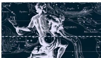
Рисунок Яна Гевелия из «Атласа созвездий»

Губернатор Приморского края Владимир Миклушевский не допустит бесхозяйственности, т.к. он по знаку Зодиака Дева (родился 15 сентября 1967 года 24 ). А поскольку он по тотему Вепрь , то обладает умением сочетать силу и разум. При разумном руководстве нашего губернатора, а также благодаря соединению в Деве (в соляре г. Владивостока) Юпитера с Восходящим Узлом , который добавит ему энергии, Приморский край и г. Владивосток в 2016 году выйдут на новый уровень общественных, экономических и международных отношений. В частности, 18 сентября 2016 года пройдут выборы 7 созыва в Госдуму от Приморья, которые будут весьма успешны – колесо Фортуны в 29 0 Девы (XI дом – доме сотрудничества в соляре Владивостока).