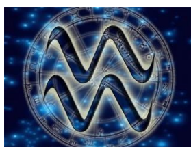
Живая и мертвая вода