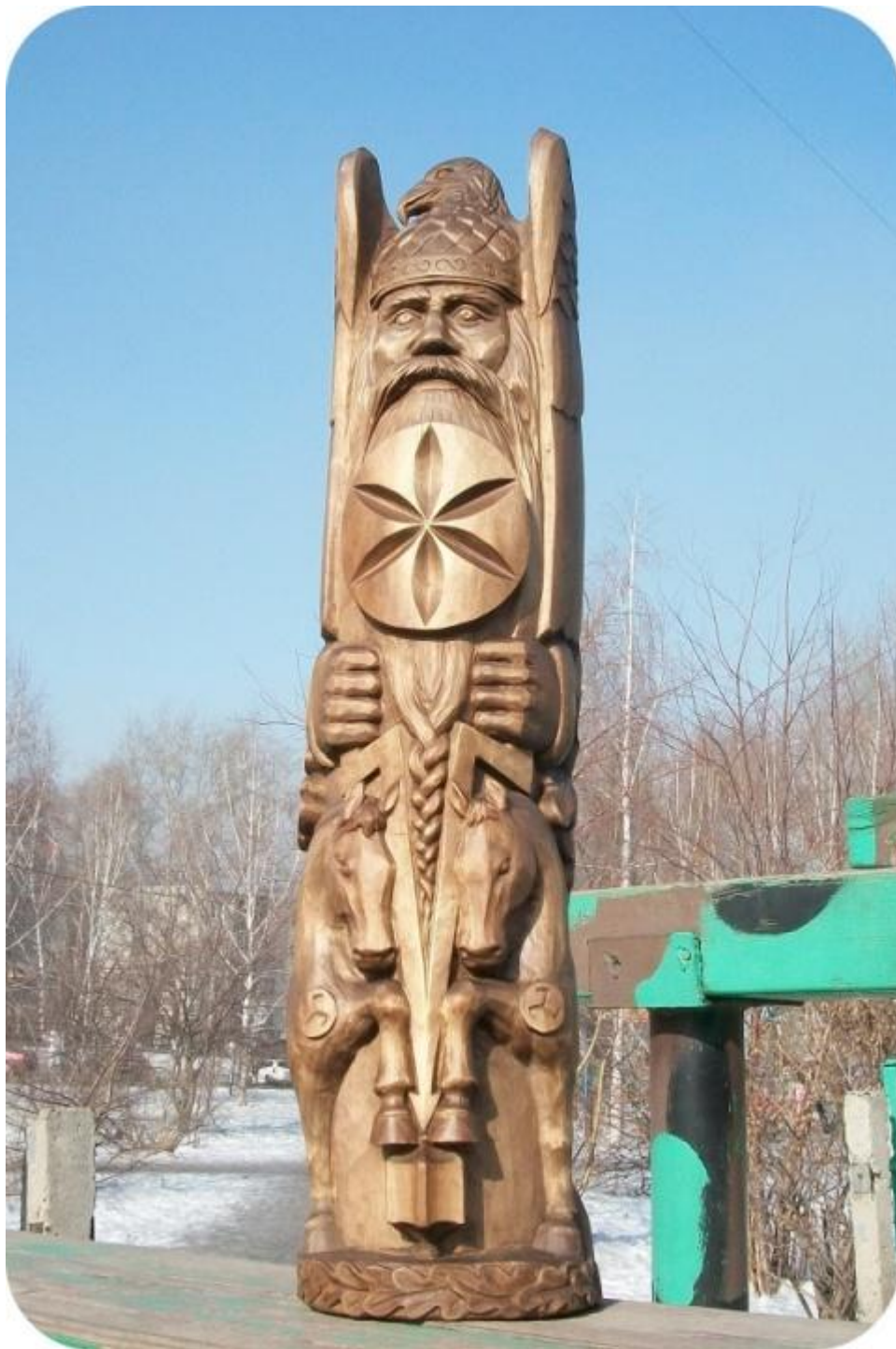
7. Чур Перуна для московских жрецов-родноверов. Весна 2011.