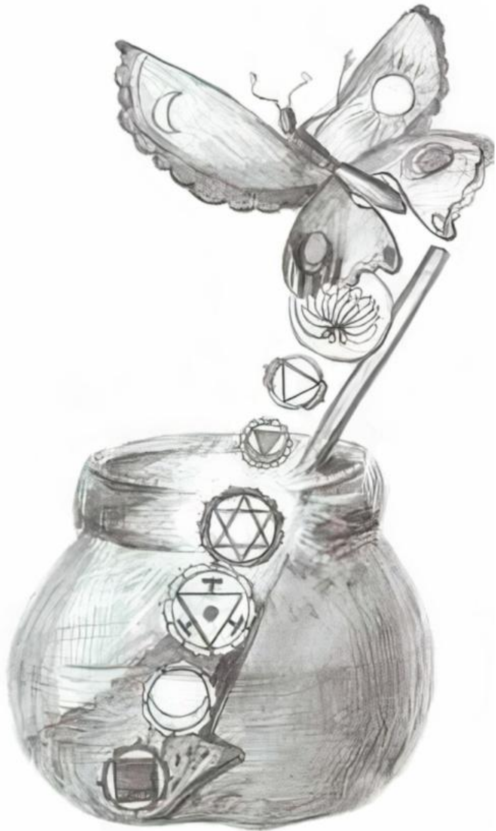
8. Гусеница-калебасница. Весна 2011. Автор рисунка – Ульяна И.