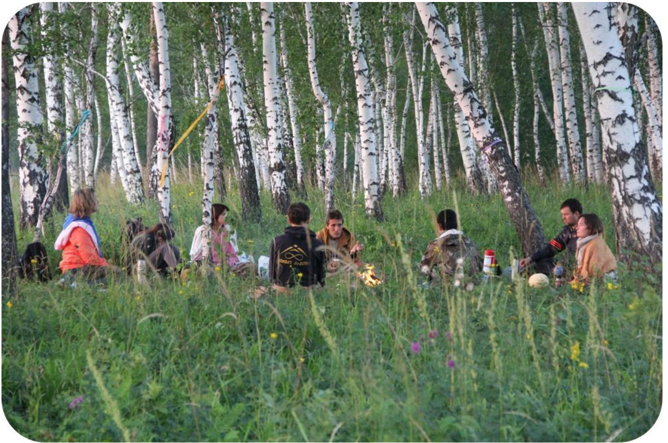
14. Сибирские йоги. Лето 2013.