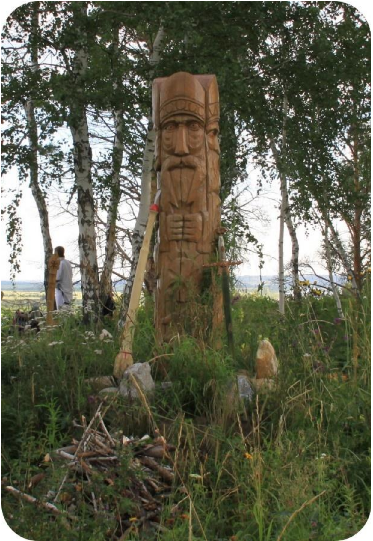
5. Лик Перуна на чуре Световита. Перед церемонией Перуна. 24 июля 2011.