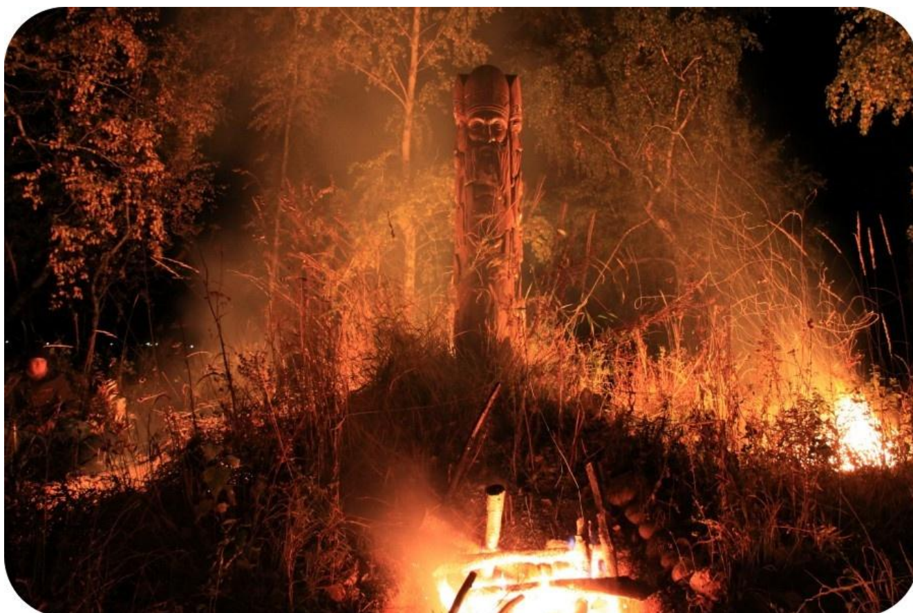
11. Огненная церемония Световита. 26 сентября 2014. 49