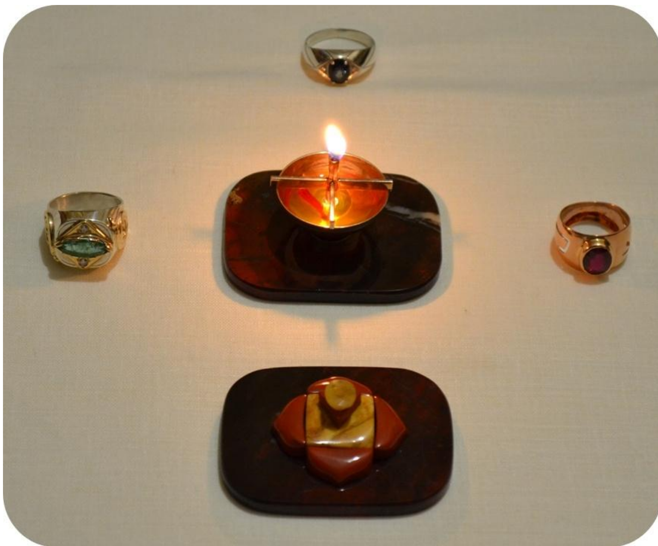
3. Мандалы Муладхары и Хары. Кольца-талисманы с изумрудом, сапфиром и рубином.