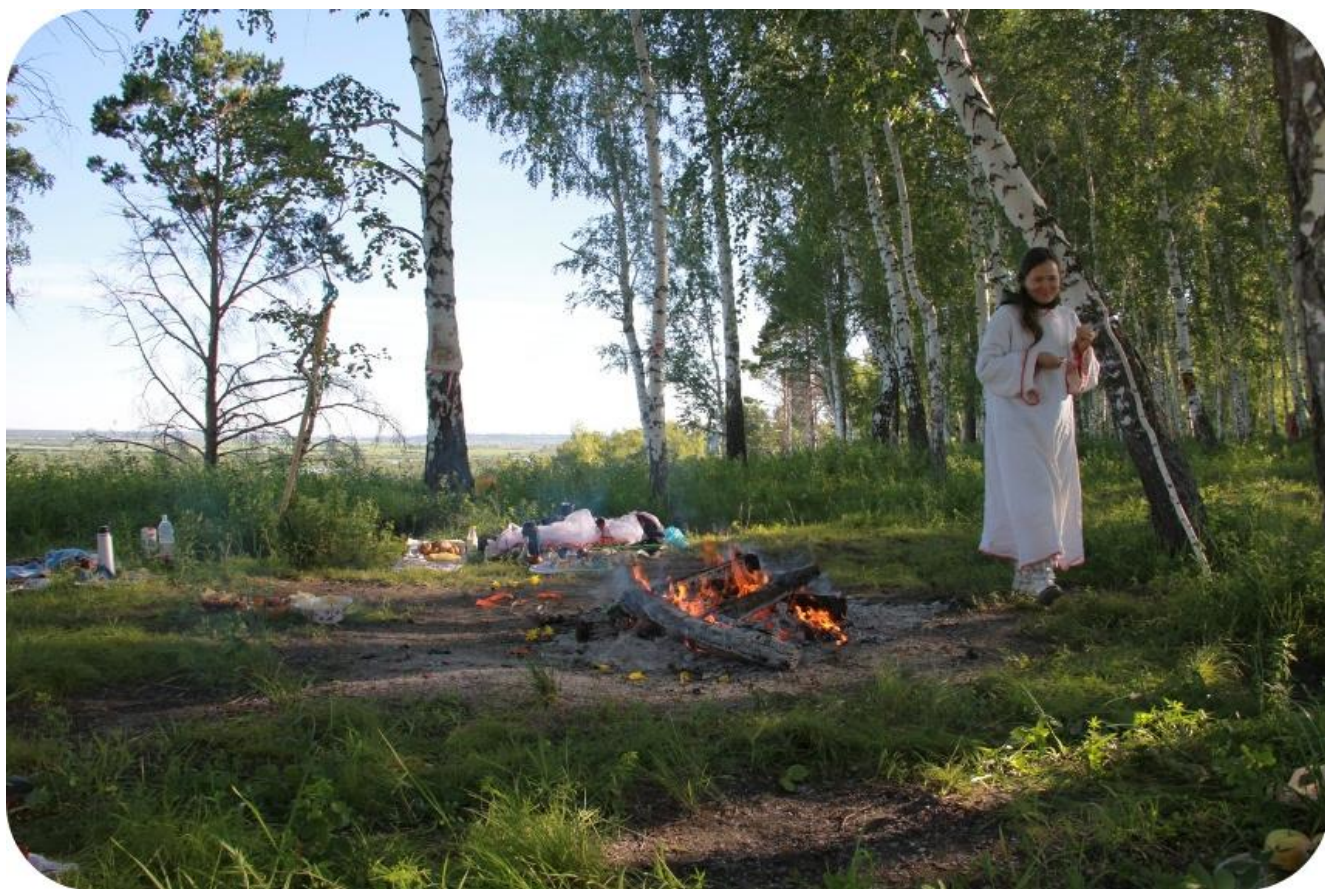
13. После церемонии Дажьбога. Утро 22 июня 2015.

Тонкость, лёгкость, счастье, радость, сноп Света, весна, радуга, Русь (не та, которая была, но которая будет, и будет она отличной от прежней, и боги ещё добавятся новые), и все сто процентов людей – вот это мой Переход!