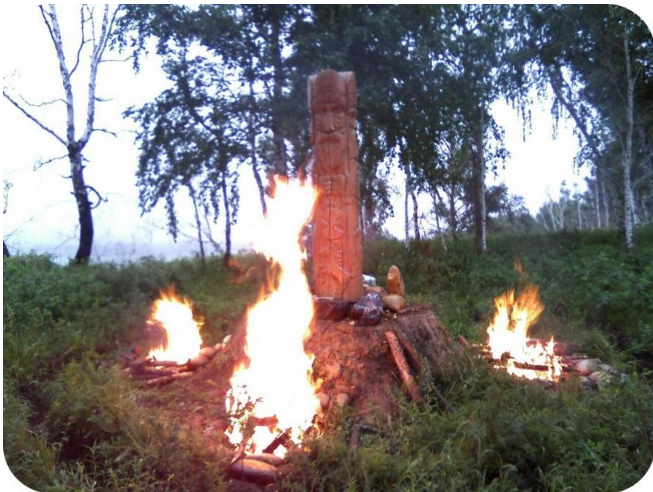
10. Огонь Перуна. Лето 2010.