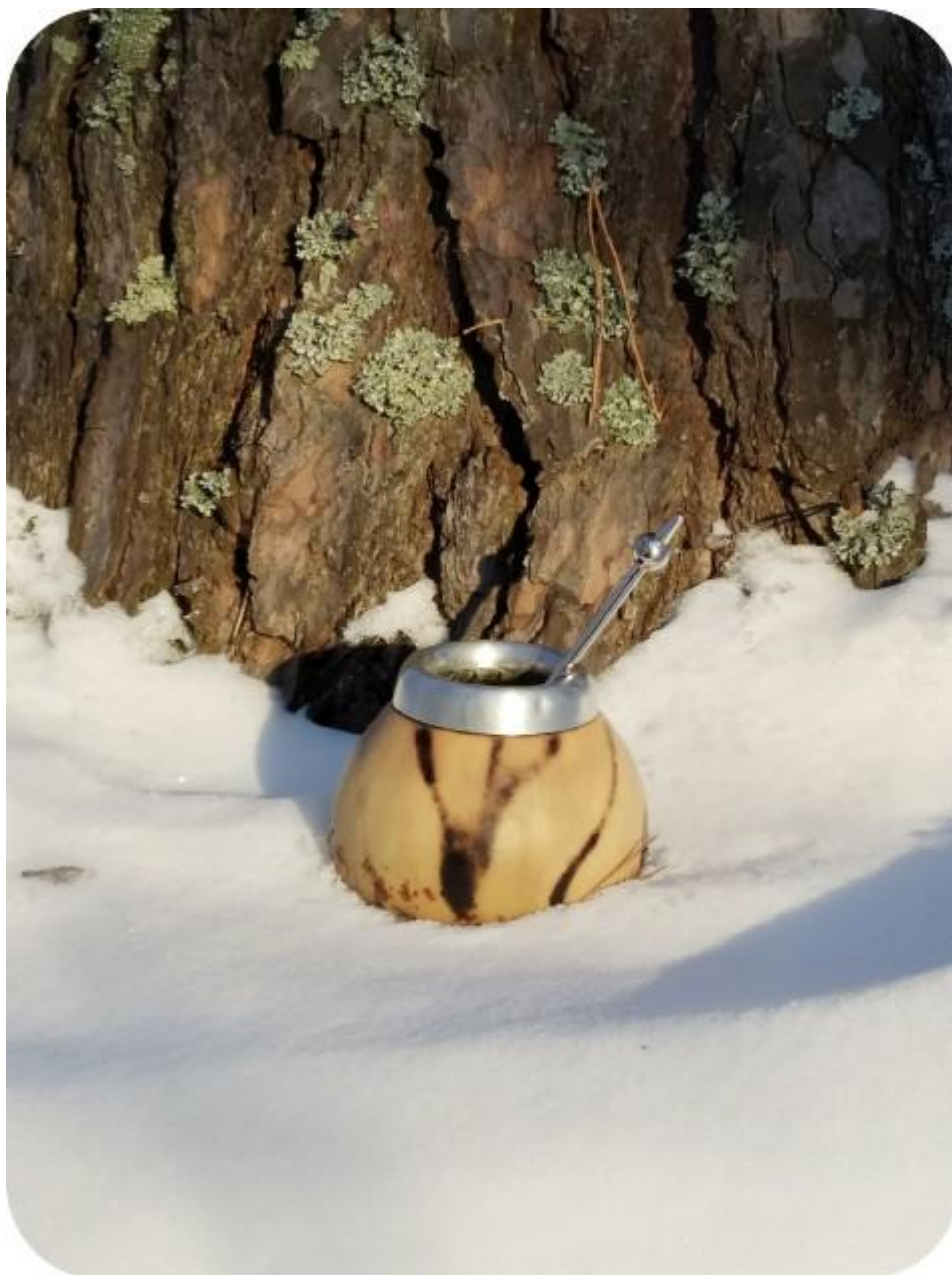
12. Калebas с бомбильей из платины. 13 марта 2021.

16.11.2012. Основной интерес, который движет мной сейчас в том, чтобы продолжать эти свои записи, не связан уже с группой, с фиксацией значимых интересных событий, и даже с ростом своего собственного сознания в качественном смысле. Я пишу, чтобы не спать, чтобы ни в коем случае не дать сознанию погрузиться в сон, или сладкую дрему под воздействием растущих вибраций, новых энергий, и своих собственных новых умений. Я стараюсь найти и использовать сейчас любую возможность, чтобы по максимуму бодрствовать именно в этом смысле.