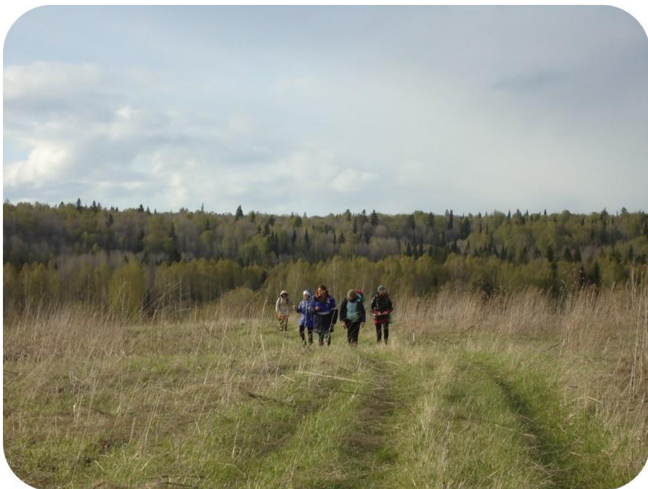
9. Сибирские йоги в Сухоречье. 25 мая 2014.

что отстающих не ждут впереди идущие, и т.п. Но ни в чём не было случайности, и всё, что делалось, делалось в итоге на благо. Важно отказаться от своих форм и представлений, как есть "хорошо", и что "должно" быть. Особенно в таких местах. Такие походы, в таких местах и в такое время, дают очень многое на всех уровнях, до какого уровня дотянешься сознанием, то и возьмёшь. Обнажается многое скрытое в себе, "автоматическое" в себе, не освещённое светом Сознания. Можно многое изменить, видя это, заложить фундамент для будущего. Плюс сам этот поход, он очень интересен как репетиция перехода в "четвёртую плотность" ещё. Такого мини-человечества, устоявшегося коллектива, со своим полем сознания, эгрегором, духом, верхними и нижними планами, традицией, формами работы, и т.п. Как оно всё пройдёт? Что получится? Как и в какую сторону раскроется каждый, и общество в целом. Такой эксперимент для Высших, результаты которого также пойдут в обработку и будут приняты во внимание.