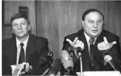
Егор Гайдар и Анатолий Чубайс

Но, возможно, процесс, растянутый во времени, легче переносился бы обществом, не приспособленным к радикальным ломкам. В какой-то мере это так. Люди, способные адаптироваться к переменам, начали бы хватать удачу за хвост, а закоренелые «совки» еще долго тешили бы себя мыслью, что стоит немного потерпеть, и старые времена вернуться. Психологически каждый нашел бы для себя относительно комфортную нишу и существовал бы в ней, глядя в глаза реальности или, напротив, абстрагируясь от нее. Субъективно так было бы легче.