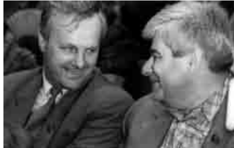
Анатолий Собчак и Гавриил Попов

Но с другой стороны, постепенно выяснилось, что сидеть на двух стульях — генсека и президента — не слишком удобно. Падать — не падаешь, однако работать толком не можешь. Все силы уходят на сохранение равновесия. Любые