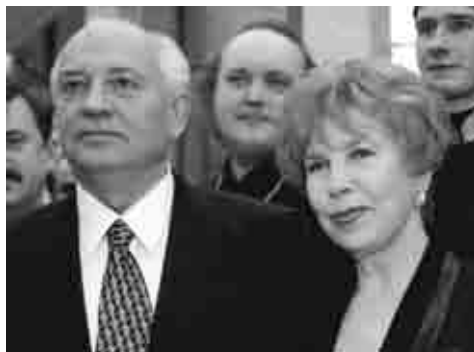
Михаил и Раиса Горбачевы

Во-вторых, у Михаила Сергеевича с Раисой Максимовной рано проявилась тяга к заграничным путешествиям, которым они посвящали отпускное время. Таким образом, в середине 80-х гг. они знали свободный мир отнюдь