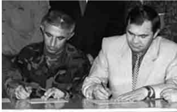
Александр Лебедь и Аслан Масхадов

Удержать от экстремизма клановое общество, имеющее давние набеговые традиции, можно было только авторитарным путем. Судьба дала Москве фигуру, способную говорить с ней на одном языке, но Кремль, в конечном счете, предпочел развязать не подготовленную толком войну и, провалившись, решил ухло-