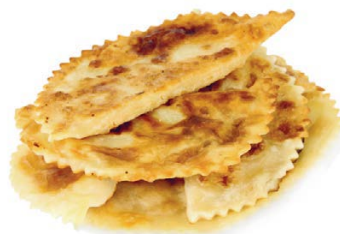
Рис отварите. Мясо и лук измельчите. Соедините, посолите, поперчите, добавьте 50 г нарезанного сала. В муку добавьте яйца и воду, замесите тесто. Раскатайте в тонкий пласт, нарежьте круги диаметром 10 см, разложите начинку, защипните края. Жарьте в оставшемся растопленном сале по 7 минут с каждой стороны.

3 стакана муки • 150 мл воды • 3 яйца • 3 ст. ложки риса • 450 г баранины • 1 головка репчатого лука • 500 г курдючного сала • перец и соль по вкусу