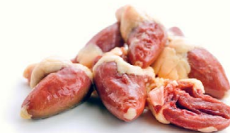
Рис опустите в кипяток и варите с солью до готовности около 15 минут. Сердечки очистите от лишнего жира, порежьте. Очищенный и измельченный лук жарьте 5 минут на масле. Добавьте подготовленные сердечки, тушите под крышкой 15 минут. Добавьте протертые через сито помидоры, влейте сливки. Приправьте солью и перцем, тушите 15–20 минут. За 2 минуты до окончания приготовления добавьте резаную зелень и пропущенный через пресс чеснок. Подавайте с рисом.

500 г куриных сердечек • 2 головки репчатого лука • 1 варочный пакетик пропаренного риса (100 г) • 3 помидора • 200 мл сливок • 2 ст. ложки растительного масла • 2 зубчика чеснока • зелень • черный молотый перец • соль