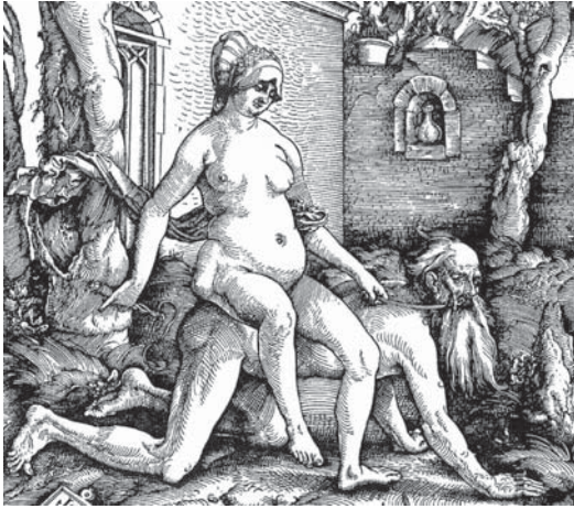
В тихой пристани его жизни она была начальником лодочной станции. Фрагмент гравюры Ганса Бальдунга «Аристотель и Филлис» (1513)

Выстрел незнакомой губной помады через полтора часа привёл к смерти гражданина К* во время семейной ссоры.