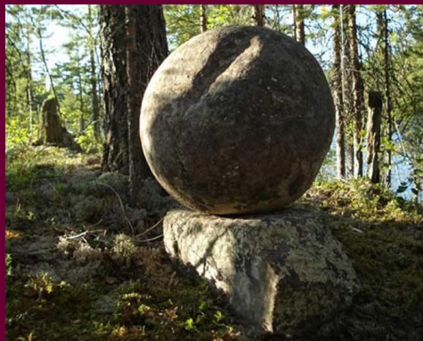
Фото. Сейд, менгир северян

Что есть область сия? В ней Земля и Луна, Ложь и Истина слиты ма'caus' ка к ма|куш|ке ; единство их — сейд ло парей , людей Севера , ма'cou' ки глаз: мен|гир|Мен|ы , Луны, камень на камне как Вечность на брени, Луна на Земле, Шар на куб|е , гнезде ( куб|ло — укр.) бранных, над тьмой Огнь ( см. ).