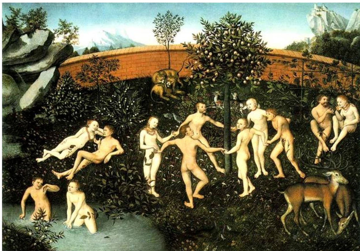
Лукас Кранах Старший. Золотой Век.

лучшей религией. Это лучшая религия лишь в обстоятельствах железного века, традиция, более приспособленная к крайне распущенной эпохе, где человечество потеряно в материальной хаосе и «царстве количества».