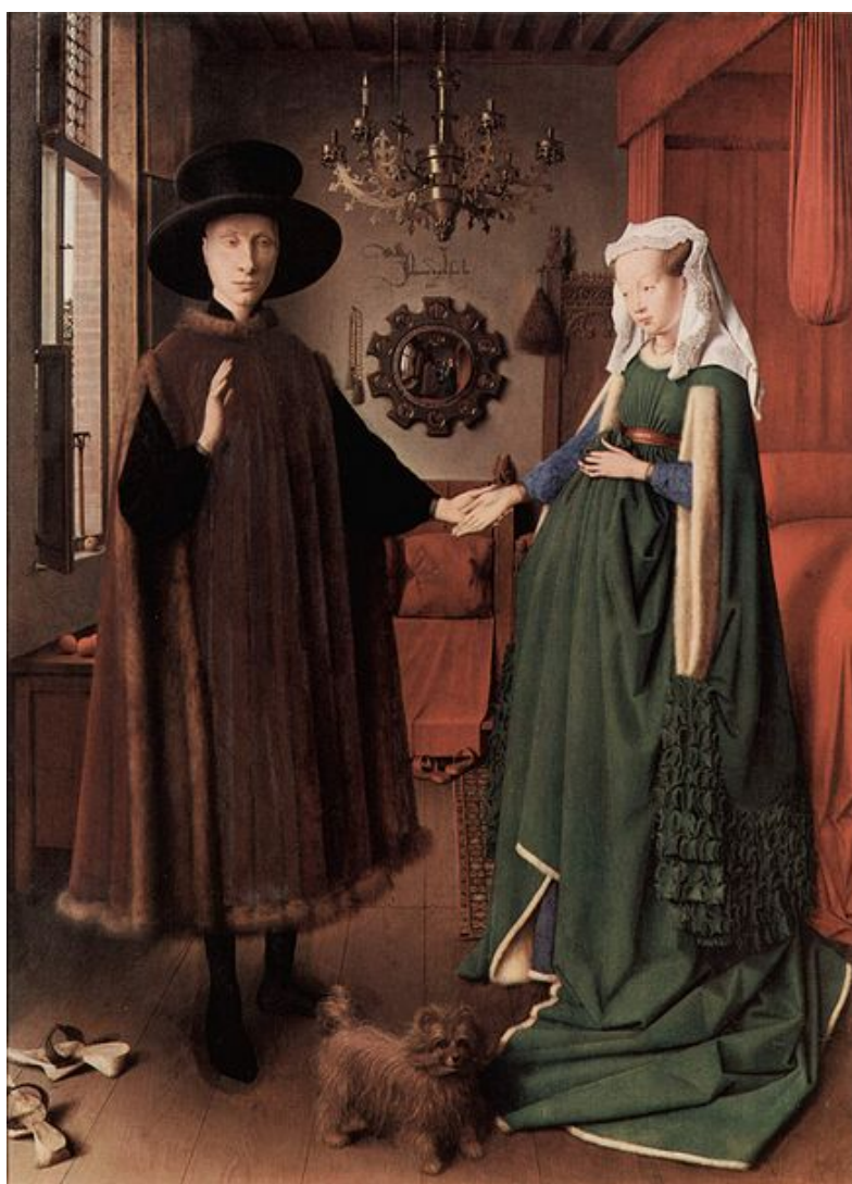
Ян ван Эйк Портрет четы Арнольфини, 1434

Существует художественный или литературный процесс, посредством которого художник или писатель воспроизводит, в ограниченном масштабе, совокупность своей работы внутри себя самого. Наиболее известный пример — полотно Ван Эйка «Чета Арнольфини» , где присутствующее зеркало отражает саму картину несколько раз во всё меньшем масштабе. Многие писатели, романисты и драматурги пробовали применять эту технику в литературе: среди прочих мы приведём в пример Дидро, Новалиса, Пиранделло, Гельдерода, Жида и Моравиа. Возможно, более известным литературным примером будет роман «Генрих фон Офтердинген» Новалиса, где герой находит книгу, которая является лишь историей его собственного приключения.