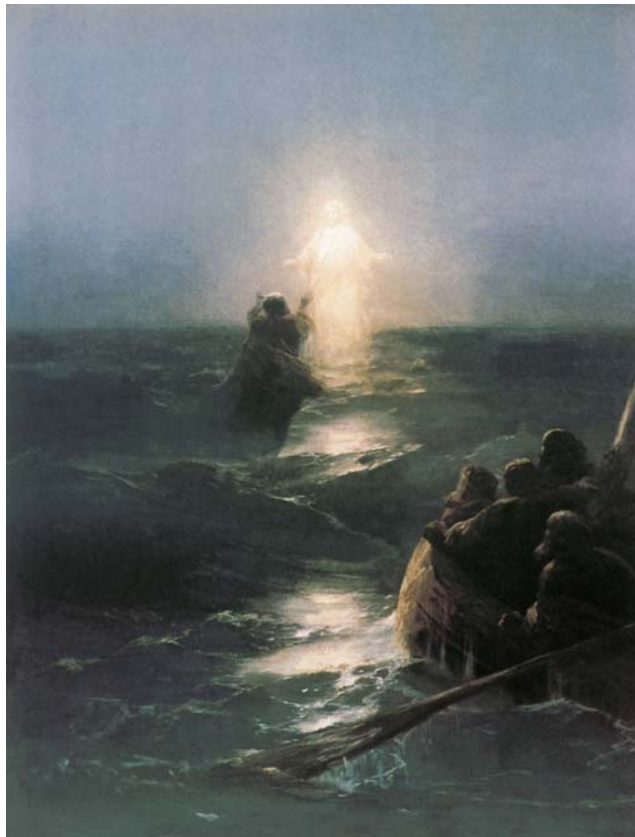
Иван Айвазовский. Хождение по водам

Сейчас мы значительно поднялись над сентиментальной мистической путаницей и жестким дуализмом, в котором молодой Эвола упрекал христианство. Тройное различие Тело–Душа–Дух , основа традиционного взгляда на человека, присутствует в христианстве, особенно в ранних текстах, Посланиях апостола Павла к фессалоникийцам и Коринфянам. Заповедь «прославления Бога во плоти» является противоположностью внутренней атаки, которую христианство направило на плоть человеческую. Апостол Павел говорил, что человек — одновременно тело, душа и дух, и что человеческое тело есть богоявление души и храм Святого Духа. Переход между духом и телом, душа — опора метафизического напряжения, которое первое подразумевает во втором. Вместилище импульсов, посредством которых мы признаём союз, объединяющий нас с биологическо–материальной сферой, является также рычагом духовного напряжения. Ношение следа этих экзистенциальных поисков высшего мира, признаков, которые по самой своей природе выходят за рамки импульсов простой возбудимости, чья организация в соответствии со стилем поведения и действия является основой того, что Эвола называет «расой духа», «расой души», в высшем ноопсихическом смысле этого слова, а не в низшем, биоопсихическом значении души, мыслимой как источник аффективного рассеивания.