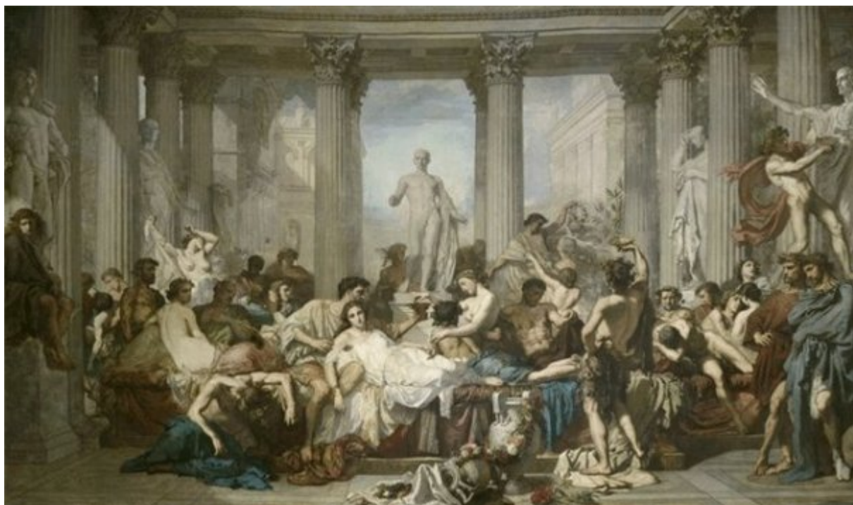
Тома Кутюр. Римляне времен упадка. 1847 г.