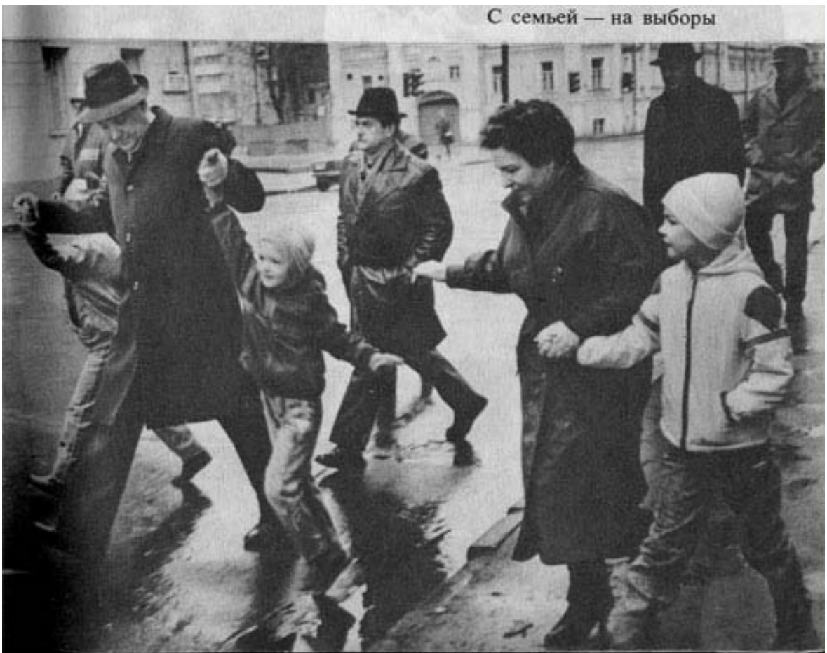
С семьей — на выборы