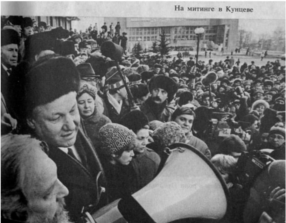
На митинге в Кунцеве