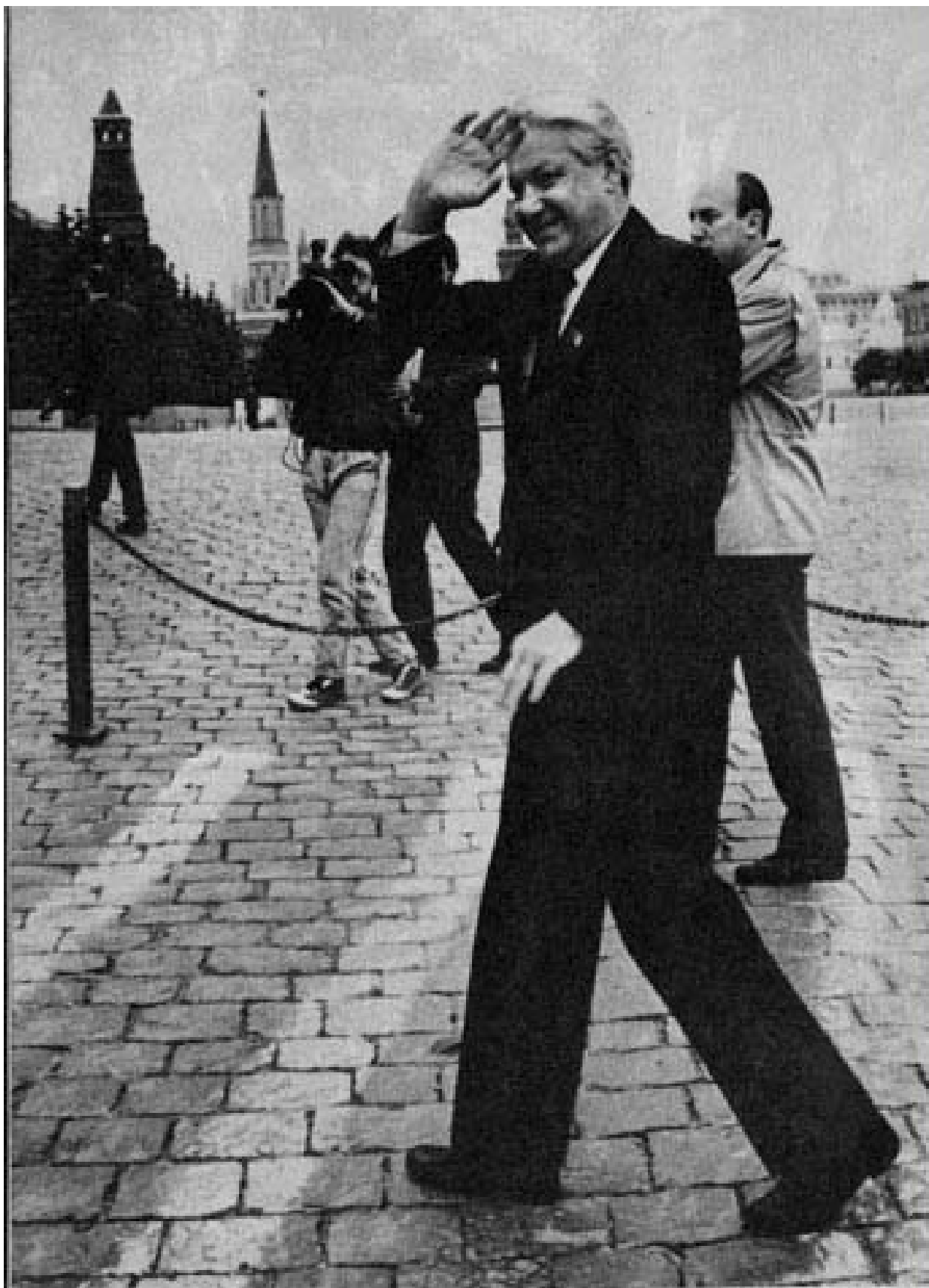
*Первый день в роли Председателя Верховного Совета РСФСР