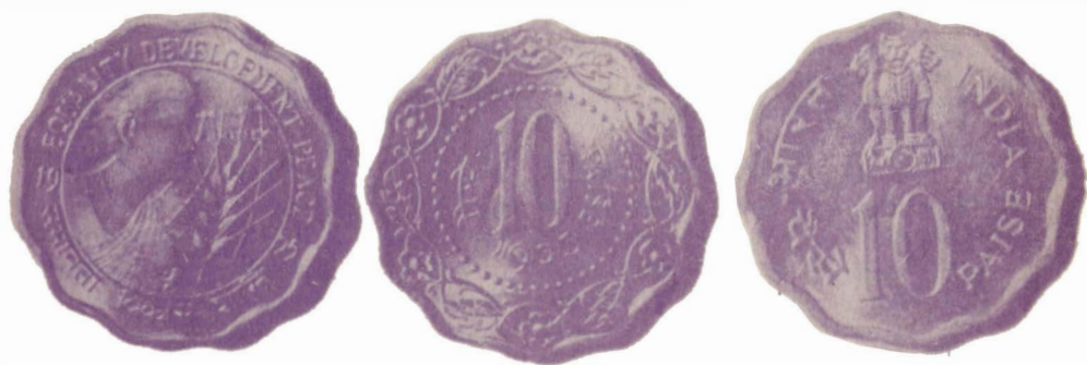
Современные индийские монеты в 10 пайсов

виков рассказывает легенду о Крѐзе от лица золотого червонца.