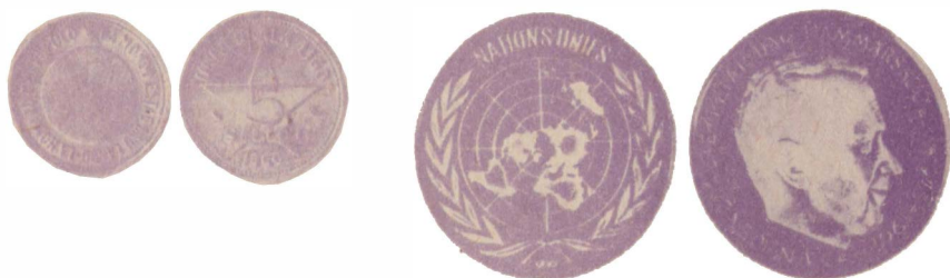
Монеты Всемирного союза эсперантистов и ООН

водская плотина, облицованная в 1751 г. гранитными блоками. Это уникальное сооружение протяженностью в двести метров, с тремя арочными водопусками завершается кирпичными ограждениями с металлической решеткой. По своим архитектурным достоинствам плотина может стоять в одном ряду с римскими акведуками. Однако четыре корпуса из двенадцати уже разрушены «Иванами, не помнящими родства», что вызвало протест городской общест-венности.