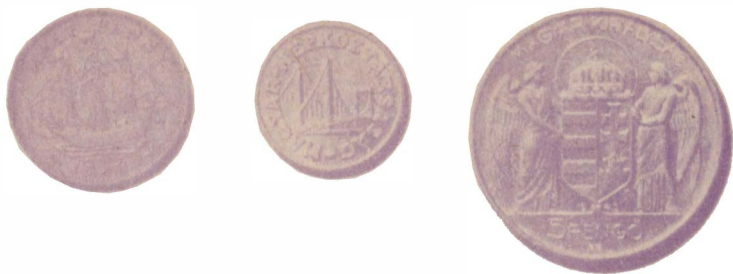
Английское полпенни с изображением парусника Ф. Дрейка «Золотая лань». Венгерские монеты с изображениями покосившегося креста на короне и знаменитого моста Маргит в Будапеште