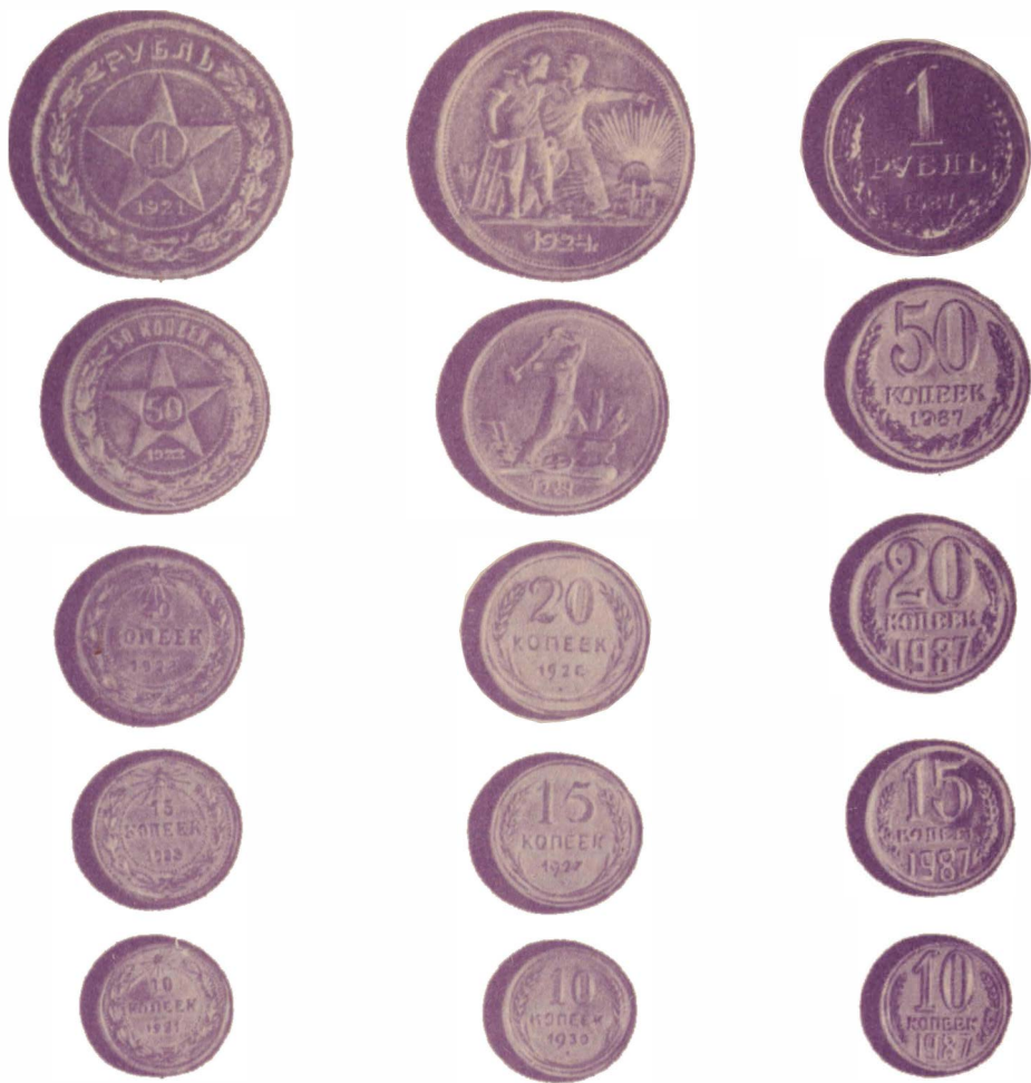
Первые советские монеты (в сравнении)

честве «разносчиков» всякого рода рекламы, и у многих государств есть на это специальные статьи доходов, то есть прибыли, получаемых от продажи юбилейных и других памятных монет. Такой сувенир привлекает внимание, любознательных подталкивает к знаниям, к книге.