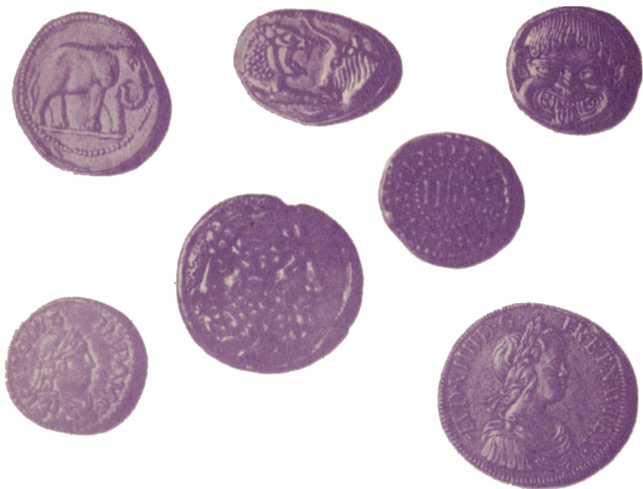
Древние монеты: со львом — статер Крѣза (VI в. до н. э.), статер (Неаполис, VI в. до н. э.), тетрадрахма (Баркидес, III в. до н. э.), ас (Рим, III в. до н. э.), две монеты денье (Франция, IX—X вв.), эку (Франция, 1643 г.)

ко на характеристику человека и на его дела, но и на другие предметы и явления.