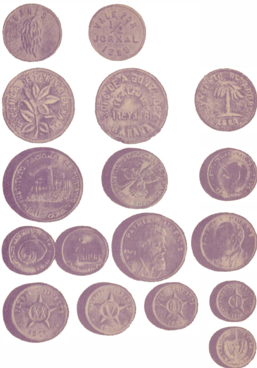
«Банановый токен» или «фича», равный 1/2 поденной оплаты. «Интур» — специальные туристские монеты, выпущенные Кубинским национальным институтом туризма, с изображениями различных достопримечательностей страны. Современные монеты Кубы