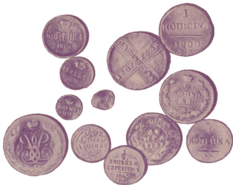
Пятак 1727 г. с Андреевским крестом; денга 1731 г.; полушка 1735 г.; 2 копейки 1812 г. (Екатерининский монетный двор); 2 копейки 1812 г. (Санкт-Петербургский монетный двор); в центре — серебряная копейка-московка XVII в.

Однако давайте попробуем разобраться вместе, хотя бы в общих чертах.