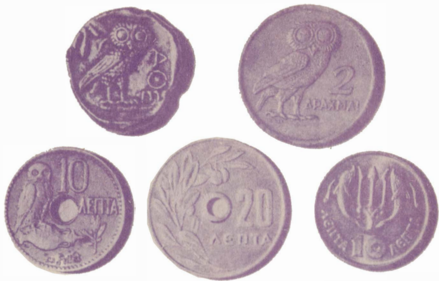
Греческие монеты — лепты, вверху слева — античная тетрадрахма V в. до н. э.