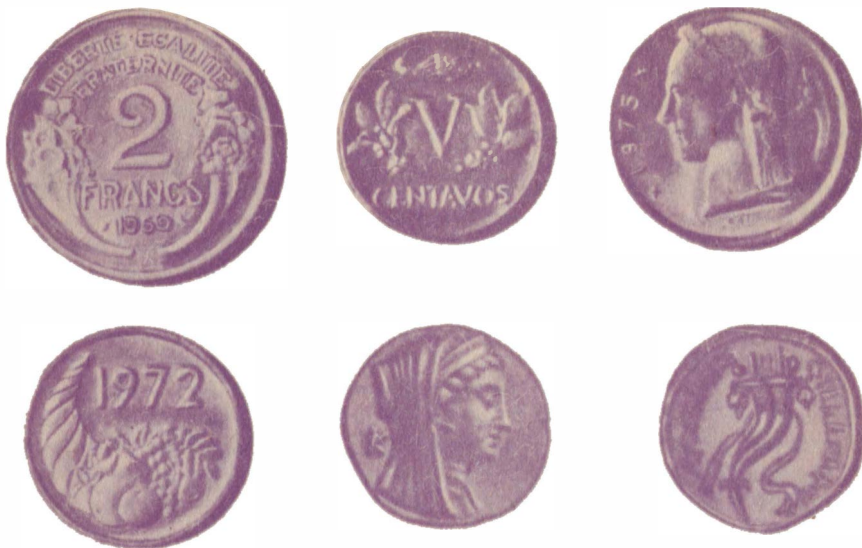
Рог изобилия на монетах Франции, Алжира, Бельгии, Колумбии; октодрахма III в. до н. э. (Египет)

ской империи богиня Монета была представлена держащей весы и рог изобилия.