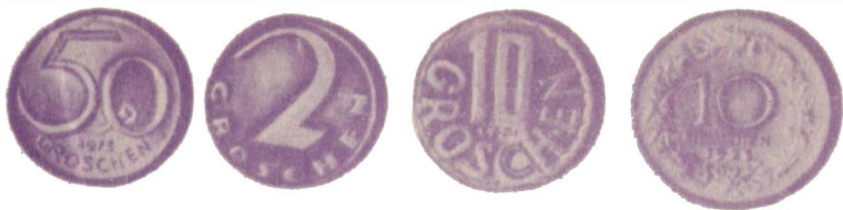
Австрийские гроши разных лет

1839—1843 гг. грошем стали называть денгу в связи с выпуском двуязычных русско-польских монет, где польский грош приравнялся к полкопейке. В то же время алтын возродился как монета в 3 копейки. Здесь разница между ними существенная, алтын — это уже действительно богатство. В этом свете поговорка «Не было ни гроша, да вдруг алтын» приобретает несколько иной смысл, чем тот, к которому мы привыкли: не было фактически ничего, а тут вдруг целое «состояние»! Так оно и есть, если иметь в виду ремарку драматурга: «Действие происходит лет тридцать назад...» То есть где-то в 40-х гг. прошлого столетия, когда произошла денежная реформа, когда алтын-трехкопеечник выгодно отличался от гроша, ставшего полкопеечником... А вот до этой реформы, когда грош был двухкопеечником, разница между ним и алтыном была невелика, и тогда поговорка могла толковаться в народе несколько иначе, с тонкой и едкой иронией: дескать, ничего не было, да ничего, собственно, и не прибавилось.