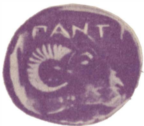
Монета Пантикапеи (V в. до н. э.) с изображением головы барана и начальными буквами названия города

ре слов» Б. Казанский, именно так возникло выражение «за баран» — как всякий принудительный платеж. Он приводит ряд письменных примеров, начиная с 1337 г., то есть со времен Ивана Калиты: «...а друг у друга между кто переорет (запашет) или перекосит — вины баран, а меж сел между — 30 белож».