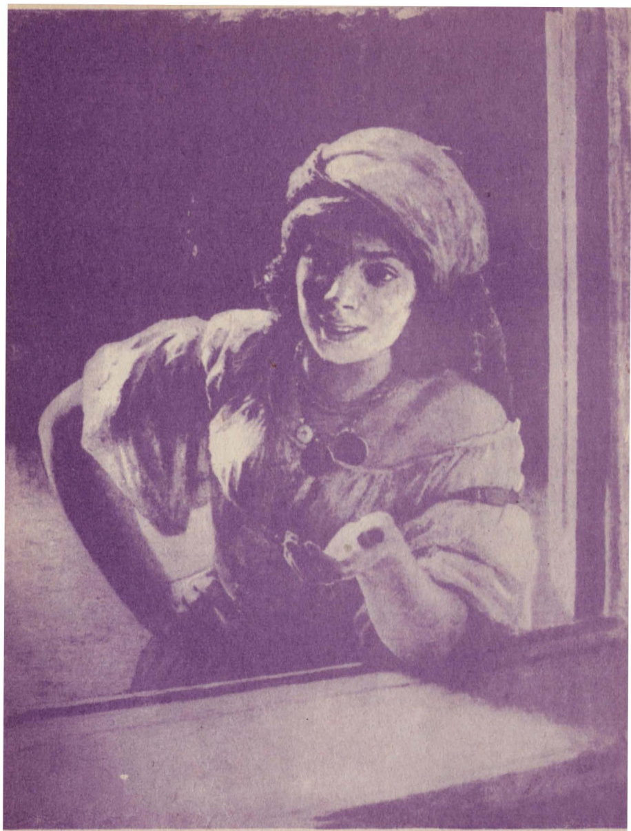
Н. Я. Ярошенко. Цыганка (1886 г.)