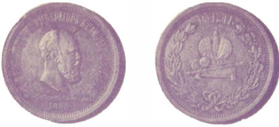
Коронационный рубль Александра III (1883 г.)

10, 5 и 2 копейки, с монограммой «Е—II» и надписью «Царица Херсонеса Таврического». Монеты в 5 и 2 копейки сейчас являются большой редкостью.