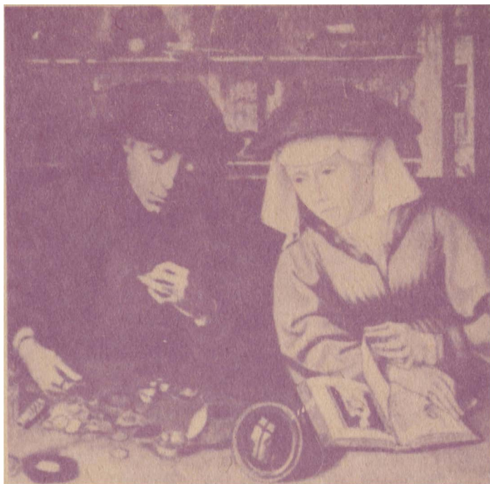
Квентин Метсис. Меняла с супругой

чинам, о которых сейчас можно лишь догадываться. Один из ответов дает история того беспокойного времени, когда положение иностранцев в России осложнялось религиозными конфликтами. В конце 20-х гг. XVII в. иноверцам стали запрещать держать в домах православных работников. Причины ограничений были, конечно, не в вопросах иной веры: московские купцы-конкуренты желали обогащаться сами. Царь разрешил стрельцам под предлогом обыска — не держат ли еретики православных слуг — вторгаться в дома иностранцев. Но эти годы были тревожными не только для заморских гостей. Раз-