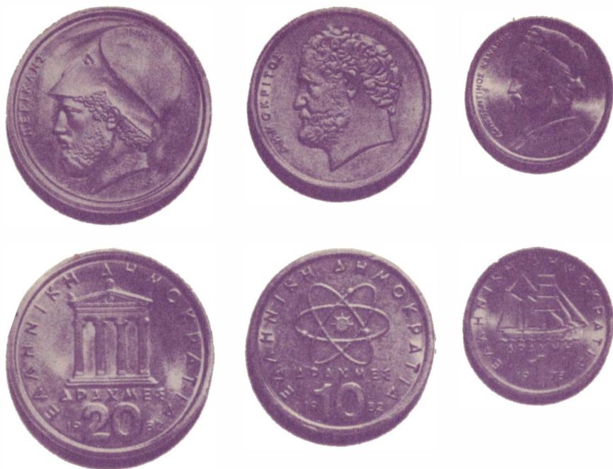
Современные греческие монеты

Миф об аргонавтах дошел до нас вместе с поэмой Аполлония Родосского «Аргонавтика». Основными героями поэмы стали золоторунный овен (баран), смелый юноша Ясон, коварная Медея и аргонавты (плывущие на корабле «Арго»). Волшебное золотое руно (шкура овена), которое висит в священной роще бога войны Ареса в Колхиде (так греки называли Черноморское побережье Кавказа), должно спасти греческий народ. Стережет золотое руно, не смыкая глаз, огнедышащий дракон.