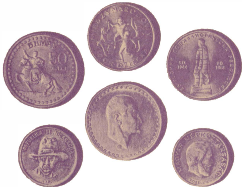
Памятные монеты различных стран: 1 тугрик, посвященный 50-летию Монгольской Народной Республики; болгарская монета с изображением памятника советскому солдату — «Алеша»; польская монета в 20 злотых, посвященная Году ребенка, объявленного ООН в 1979 г.; монета Никарагуа с портретом Сандино; монета Венгрии с портретом Кошута; юбилейная монета Египта с портретом Насера

фраз и выражений по аналогии: длинный язык, длинный нос. Представляется, что в основе образа «длинный рубль» еще лежит и длинный путь, который приходилось проделывать людям, уезжавшим на заработки. А вот «левый рубль» — это образное выражение родилось недавно, в нем, возможно, уже сказалось влияние политической терминологии, слово «левый» в данном случае означает «незаконный».