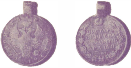
Рубль, превращенный в подвеску

гривна. На широком обруче с откидывающейся пряжкой древний мастер вырезал фигурку сидящего по-восточному человека. По мнению ученых, это может быть и Сиявуш с кубком в руке и кинжалом на коленях. По крайней мере, он походит на «культурного героя» Средней Азии, подобного египетскому Осирису или фрагийскому Аттису. А козлоголовые существа на ожерелье — наверняка праздник дионисийского культа... Кочевые племена сарматов пришли с востока и несколько веков проживали на обширнейшей территории — в Средней Азии, на Дону, в Приазовье и Северном Причерноморье — до самого Дуная.