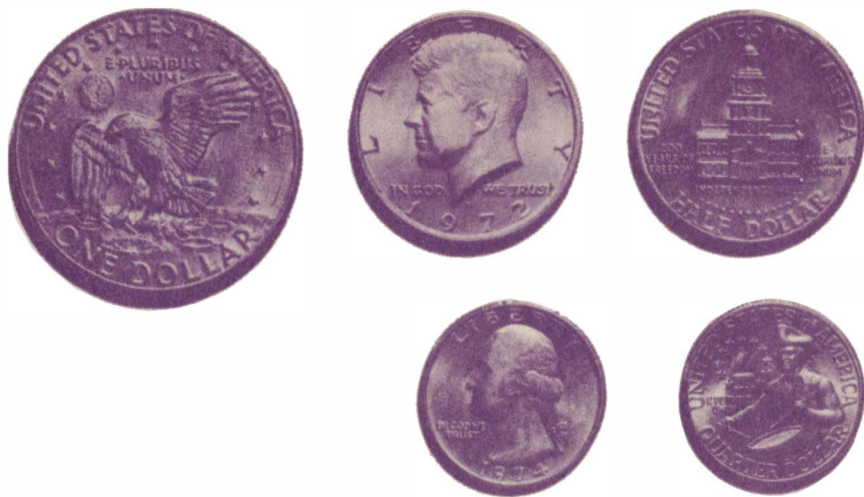
Современные американские монеты

зеленые перья. В общей сложности счастливицам досталось около 8 тыс. долларов.