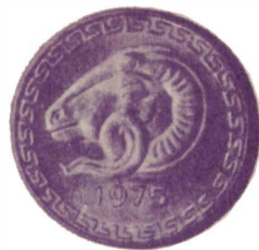
Современная алжирская монета в 20 сантимов

каска рога... Различные варианты греческого мифа о козе Амалфеи рассказывают о том, что один рог ей обломил Юпитер и подарил его дочерям критского царя Милисса, при этом сообщил рогу чудесную силу наполняться всем в изобилии. По другой версии, коза сама обломила свой рог, и Юпитер наполнил его травами и плодами и поместил его между звездами.