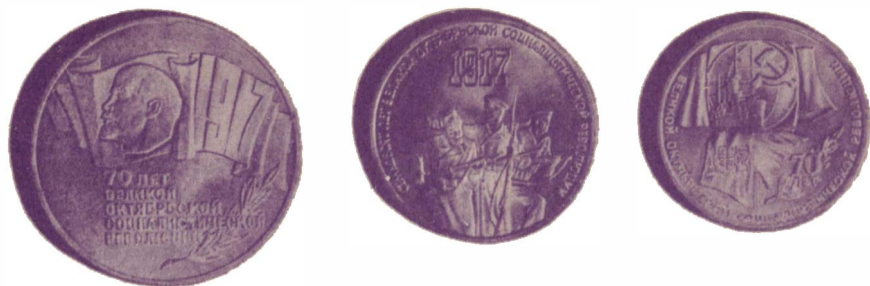
Советские монеты, выпущенные в честь 70-летия Великого Октября (5, 3, 1 рубль)

лу он выражался каким-либо символом: рисунком, сценкой, изображением божества, животного. Так, на греческих монетах с древних времен до недавнего времени была отчеканена сова — любимая птица богини Афины, символ мудрости.