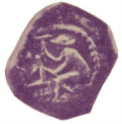
Медное пуло великого князя тверского Бориса Александровича (1425—1461) с изображением денежника, чеканящего монеты

кормовой флаг кораблей русского военно-морского флота, впервые поднятый на первом русском военном паруснике, построенном на Оке в 1669 г. Первоначально полотнище флага было трехцветным — бело-сине-красным, а с 1712 г. — белым, с синим диагональным крестом, реявшим на кораблях до 1917 г.