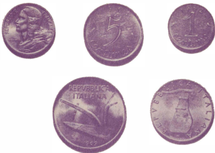
Монеты, вышедшие «в тираж» (обесценившиеся, чеканка которых прекращена): 1 и 5 сантимов (Франция), 5 и 10 лир (Италия)

ционеров, поскольку на него также нельзя было ничего приобрести. Коробок спичек стоил 5 пиастров, а проезд в автобусе — 10. Рост цен от правил меллим, прослуживший 101 год, «на пенсию».