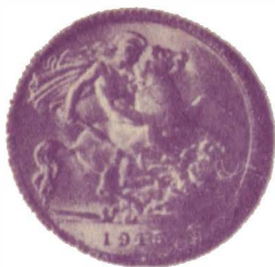
Золотой английский соверен (чеканился с 1816 г.)

воде, чем больше пьешь ее, тем меньше вероятность утаить жажду.