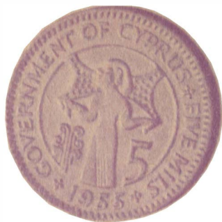
Кипрская монета достоинством 5 филсов с изображением человека, несущего медный талант

1644 г. цена на медь на мировом рынке снизилась, так как другие страны также обнаружили у себя запасы медных руд. Тогда-то и было решено отчеканить и выбросить на рынок огромные монеты из меди достоинством в 10 далеров. Это были прямоугольные пластины весом в 19,7 кг. За такую монету можно было купить стадо коров.