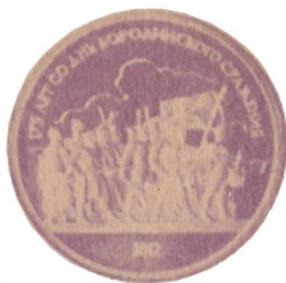
Советские памятные монеты, выпущенные в честь 175-летия со дня Бородинского сражения.

ные и художественные ценности. Однако тысячелетия, прошедшие с той поры, сделали свое дело. Горгиппия исчезла. Оказались разграбленными и захоронения горожан. А тут сразу 36 нетронутых!