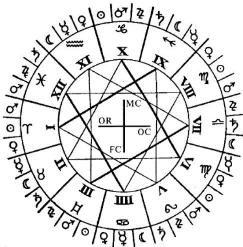
Схема деления зодиака на двенадцать частей. Каждая часть делится на три более мелких по десять градусов