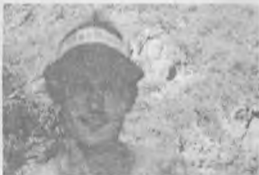
Одинокий Волк после двух суток перепросмотра в пещере.