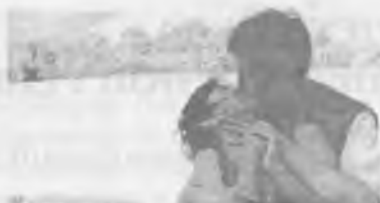
Одинокий Волк и Мудрая Сова.