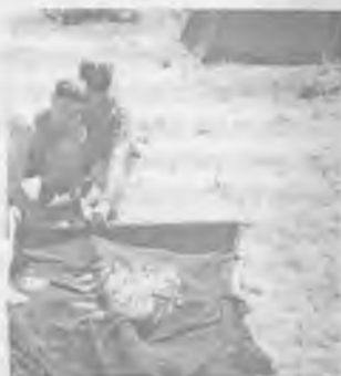
Парящий и Быстрый Чиж укрепляют флаг.