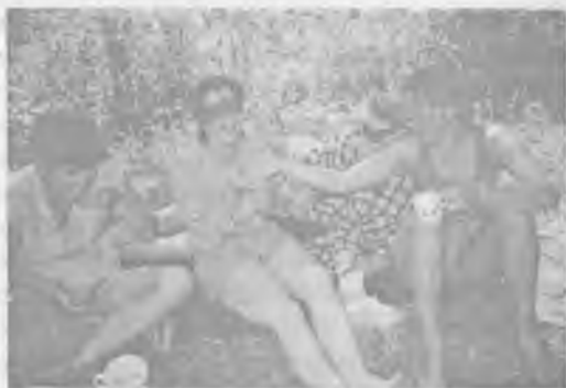
«Слепые» кормят друг друга.