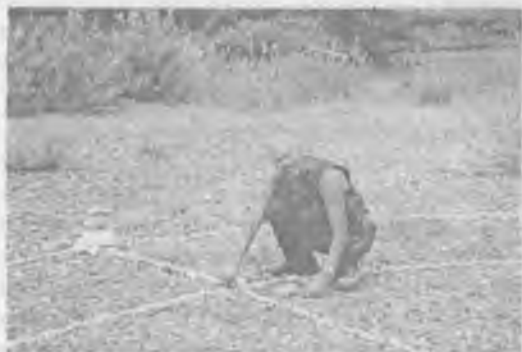
С.С. строит «Магическое Колесо».