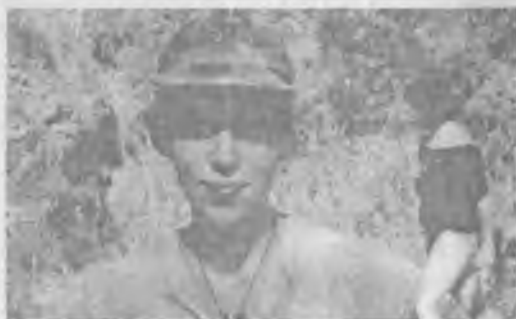
Капля в небе после двух суток перепросмотра в пещере.