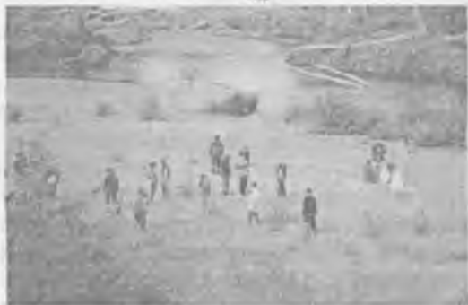
В «Магическом Колесе».