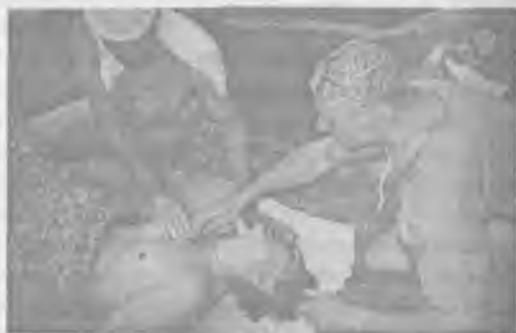
Парящий с Орлами и Бурая Лапа помогают Боа при процессе ребёфинга.