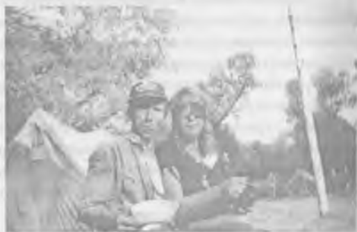
«Слепой» день с Умелым Бобром.