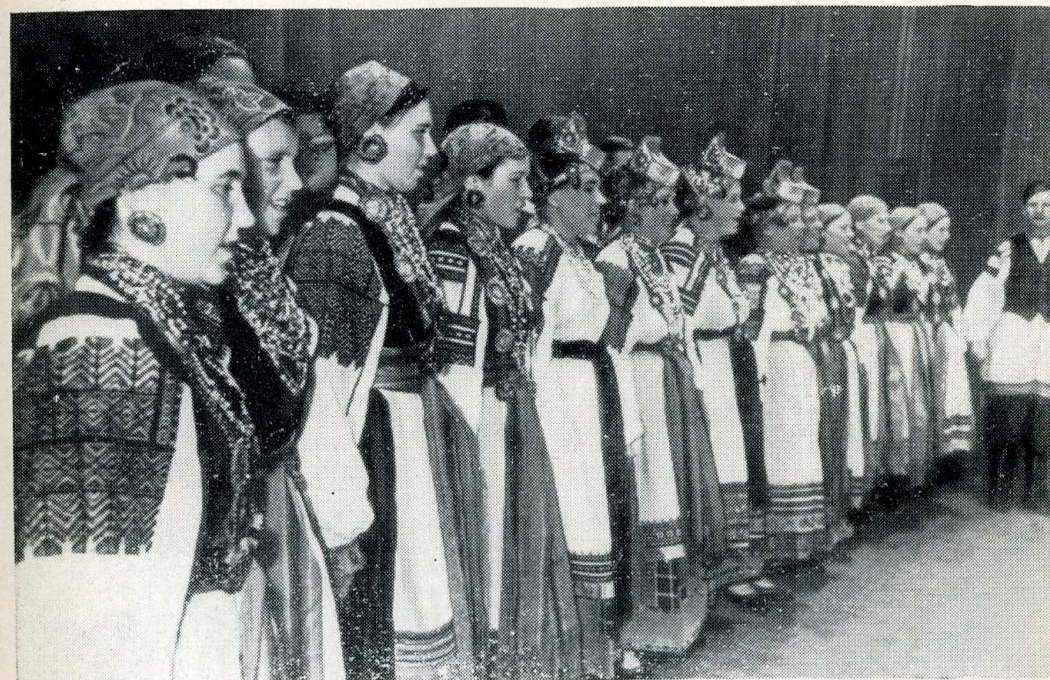
Хор села Афанасьевка (1958)

В песне «Гуляю, гуляю я до полночи» мать советует сыну почаще бить и журить свою жену. Сын решает выполнить материнский наказ по-своему: