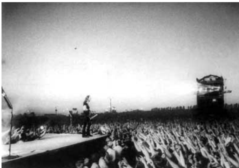
...который был записан полностью вживую, при поддержке фанатов со всего мира. Обратите внимание на «живую цепь» позади Хэтфилда, состоящую из самых приближенных фанатов.