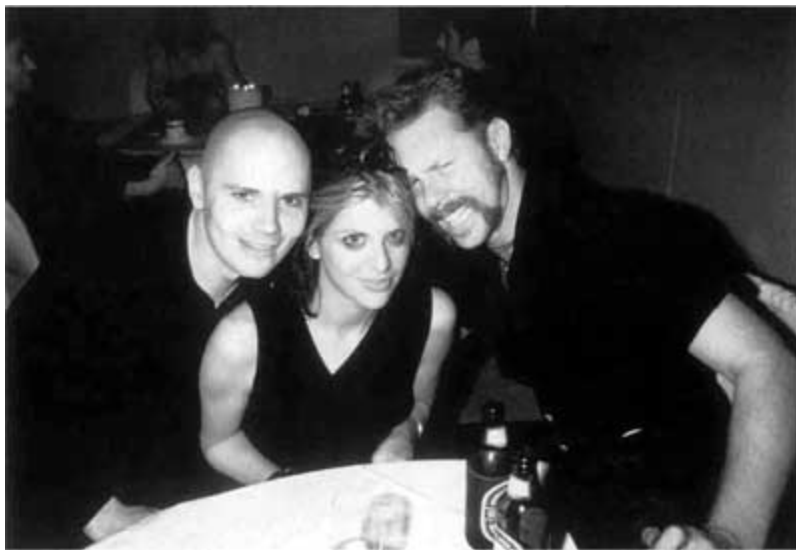
Хеви-метал встречается с альтернативой: Хэтфилд с новой короткой стрижкой плечом к плечу с фронтменом «Smashing Pumpkin» Билли Корганом (крайний слева) и вокалисткой «Hole» Кортни Лав во время церемонии вручения наград MTV в 1995-м.