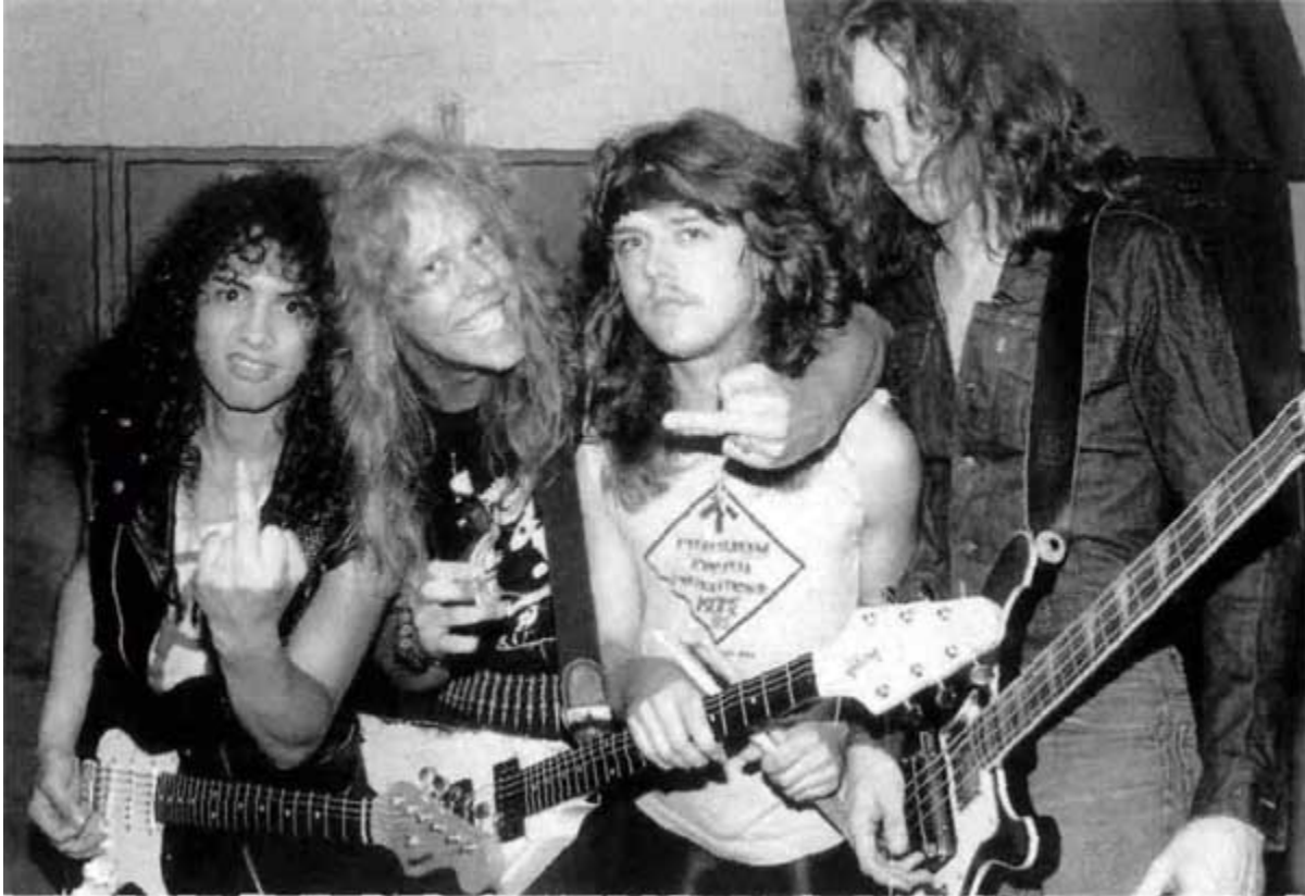
Изгнав Мастейна и заменив его Кирком Хэмметтом (на фото — крайний слева), «Metallica» в 1983-м отправилась в концертно-алкогольный марафон по всем маленьким городкам Америки...