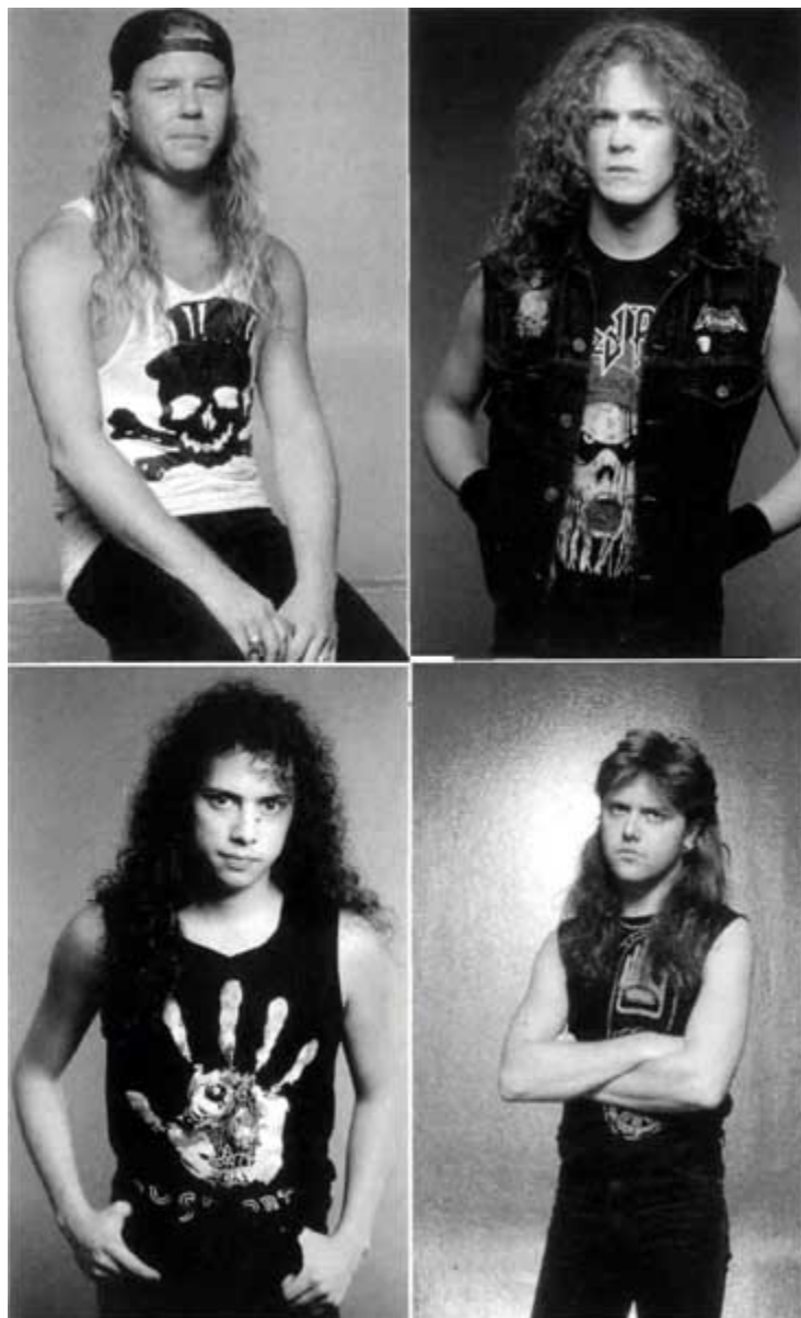
Четыре Всадника в конце 1980-х, на пике металлического движения. Крутым поворотом к мэйнстриму и не пахнет. Или все-таки?..