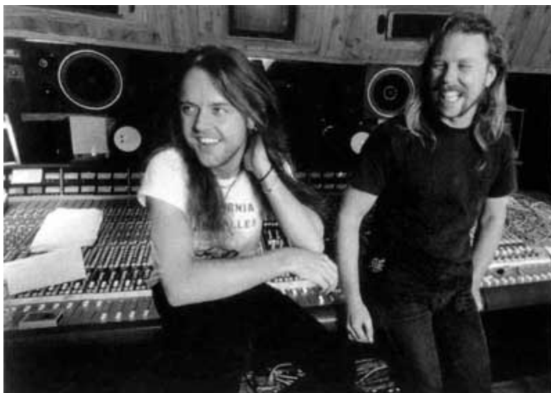
Перерыв во время монтажа коллекционного издания «Live Shit: Binge and Purge» в 1993-м...