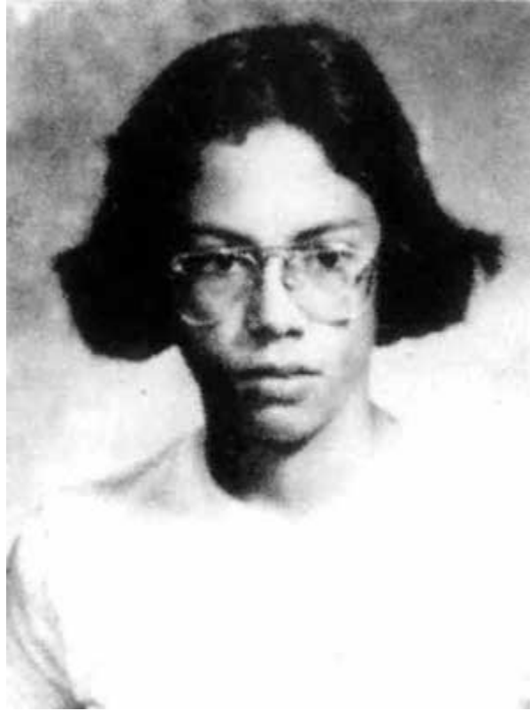
Кирк Хэмметт в подростковом возрасте: прическа «с крылышками».