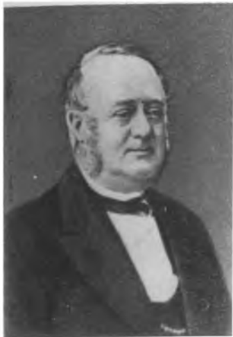
Отец Эдварда Грига — Александр Григ