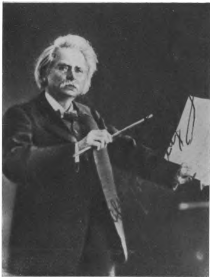
Эдвард Григ. 1907