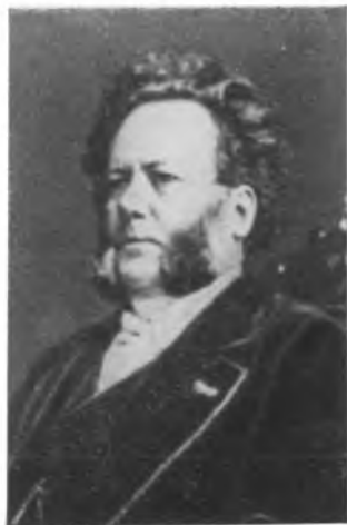
Генрик Ибсен. 1874