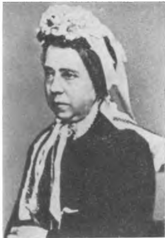
Мать Эдварда Грига — Гесина Юдит Григ