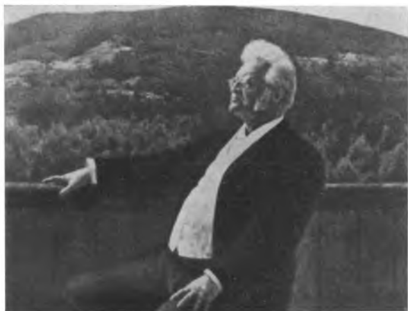
Бьёрнстерне Бьёрнсон С портрета Э. Вереншелля