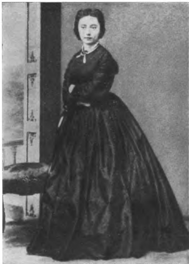
Нина Хагерн. 1865