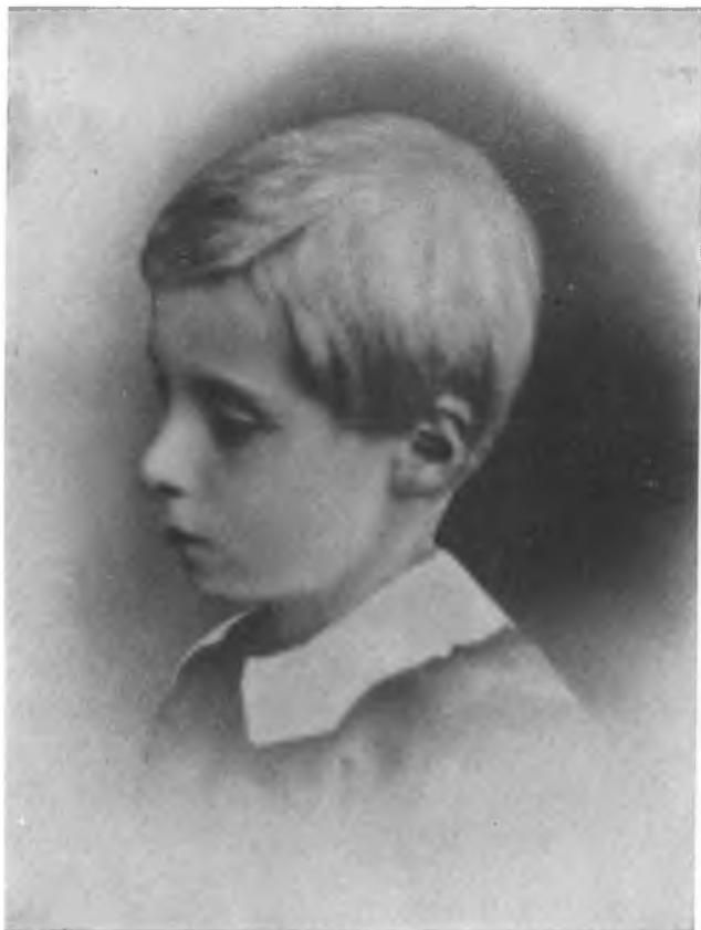
Эдвард Григ в одиннадцать лет