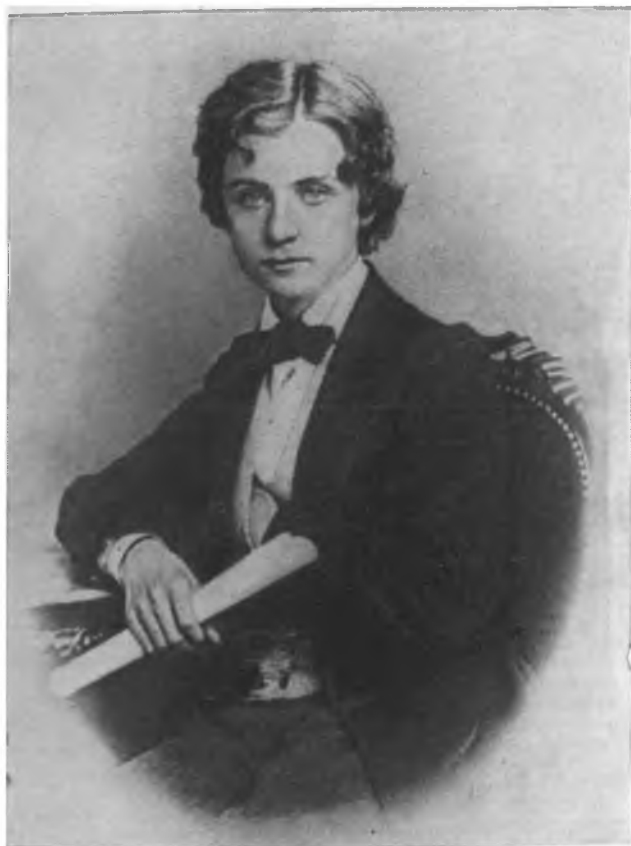
Григ — ученик Лейпцигской консерватории