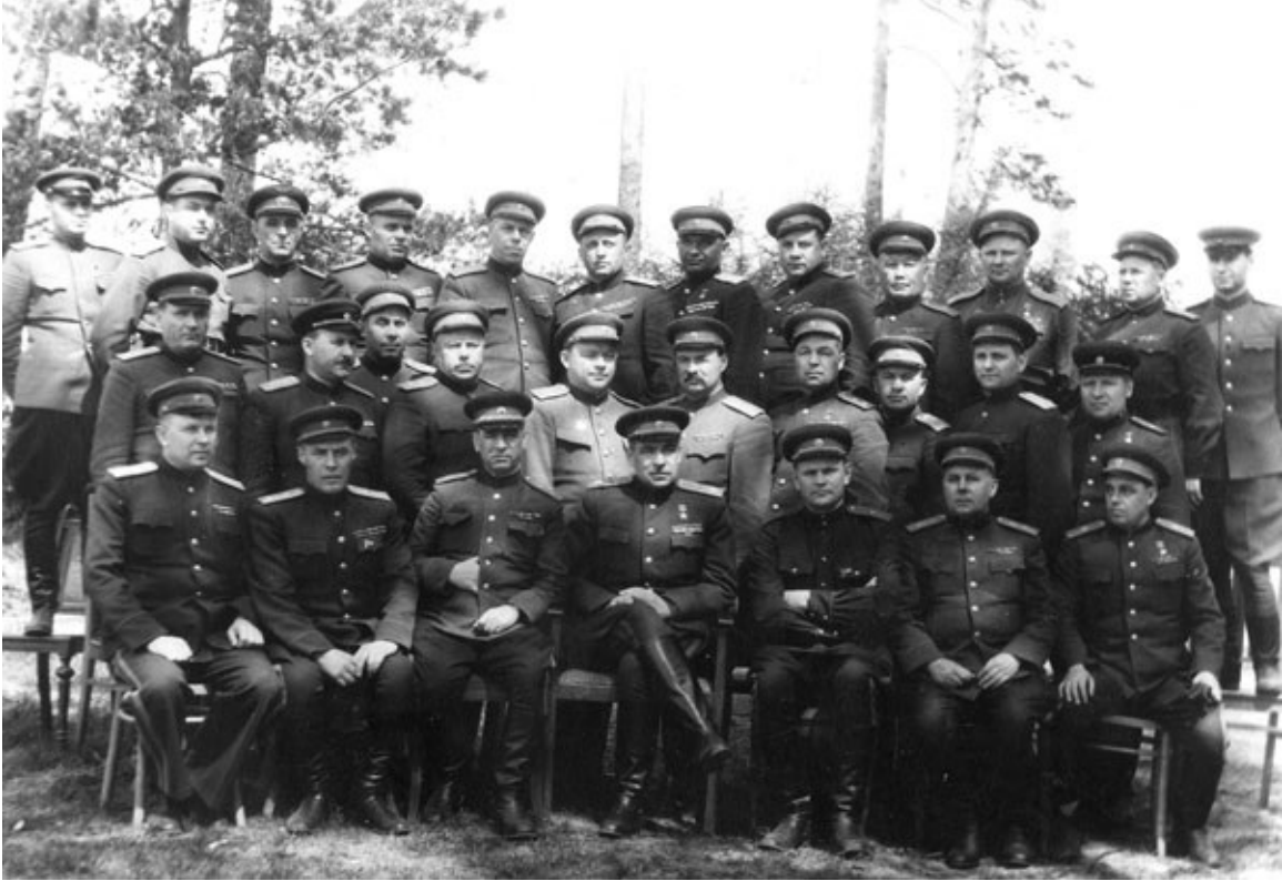
Военные советы фронта и армий Ленинградского фронта. Метекай. Май 1945 г.