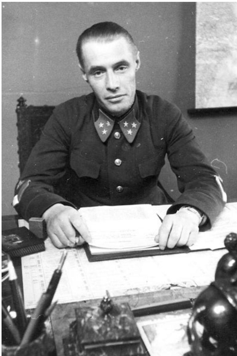
Командующий 1-й особой Краснознаменной армией в рабочем кабинете