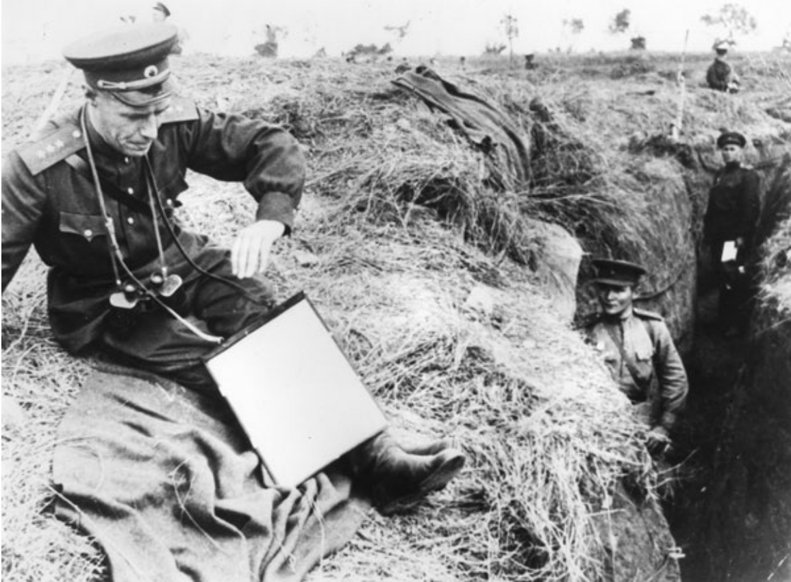
М. М. Попов – командующий Брянским фронтом