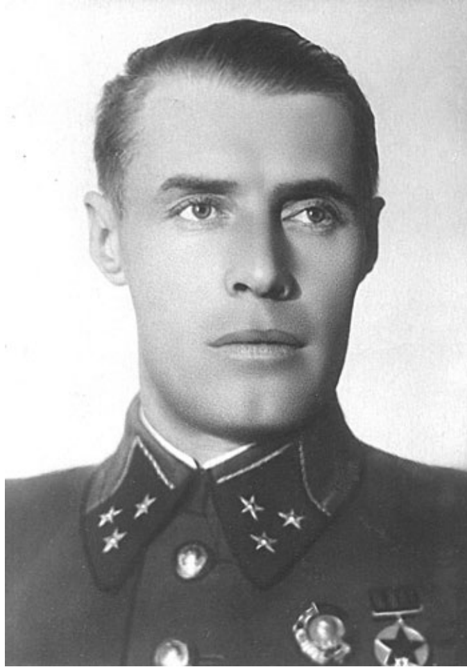
Генерал М. М. Попов. Ленинград. 1940 г.