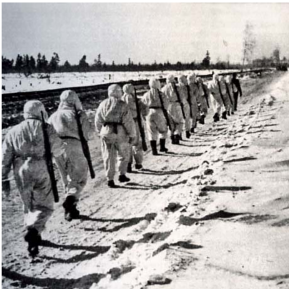
Зима 1942 г. У железнодорожного полотна близ Погостья. Идет пополнение 311 с.д.

Раненый рассказал нам, что очередная наша атака на Погостье захлебнулась и что огневые точки немцев, врытые в железнодорожную насыпь, сметают все живое шквальным пулеметным огнем. Подступы к станции интенсивно обстреливает артиллерия и минометы. Головы поднять невозможно. Он же сообщил нам, что станцию Погостье наши, якобы, взяли с ходу, в конце декабря, когда впервые приблизились к этим местам. Но в станционных зданиях оказался запас спирта, и перепившиеся герои были вырезаны подоспевшими немцами. С тех пор все попытки прорваться оканчиваются крахом. История типичная! Сколько раз потом приходилось ее слышать в разное время и на различных участках фронта!