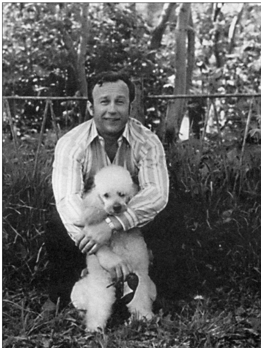
1975 год. Александр Огородник. Белый, пушистый. И завербованный...