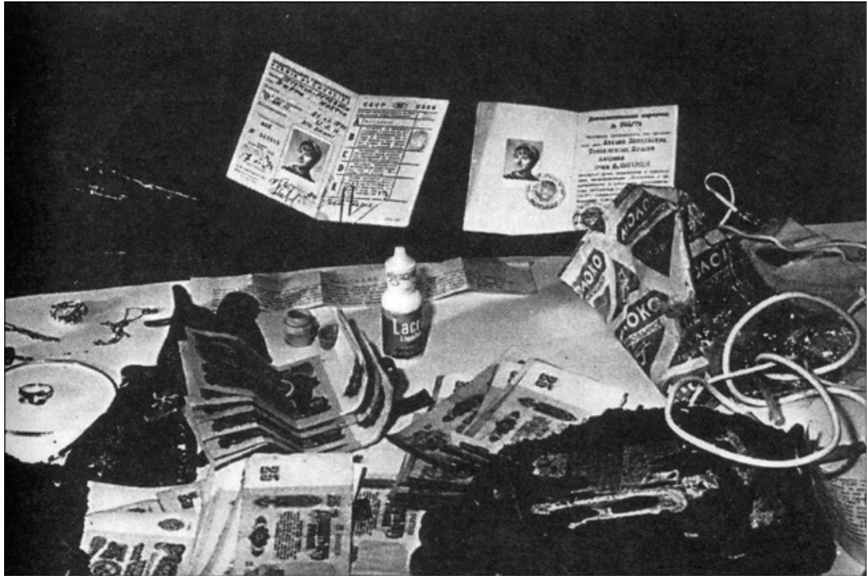
Содержимое контейнера, предназначенного для Огородника: драгоценности, деньги, микропенки, спецупаковка с ядом