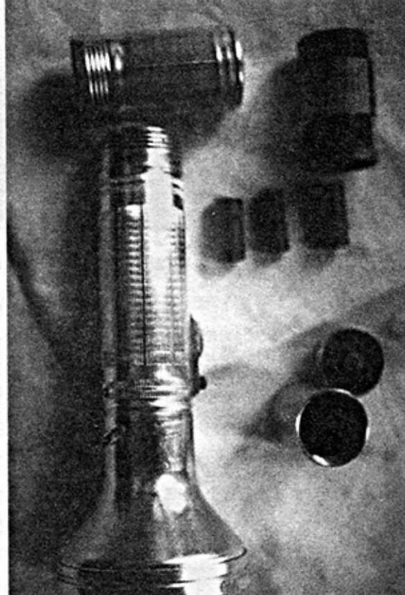
Личное оружие Огородника. Рядом с пистолетом авторучка, стреляющая боевым патроном Карманный фонарь китайского производства с контейнером в виде батарейки «Марс»