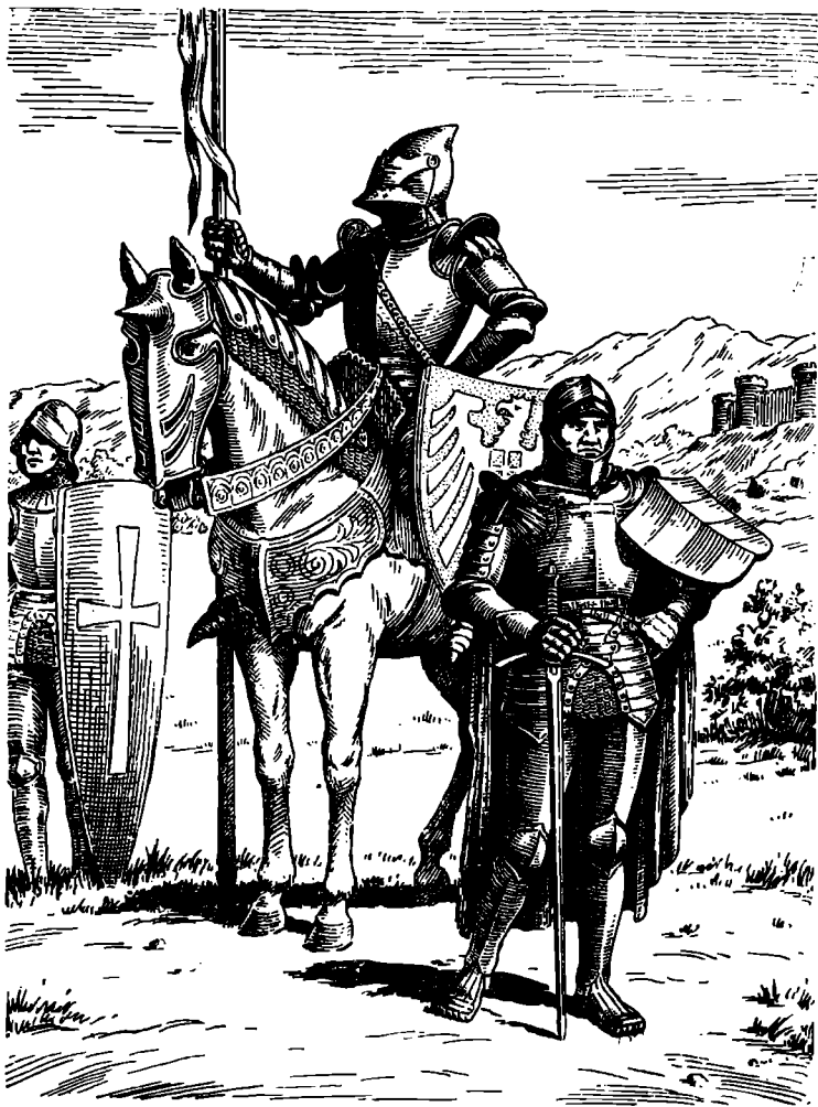
Немецкие рыцари (XV век)

нителю, оруженосцы, стрелки из луков и т. п., сопровождавшие рыцаря в походе и помогавшие ему в бою.