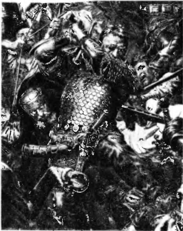
Ян Жижка в битве под Грюнвальдом (фрагмент картины Яна Матейко)

Гроссмейстер понял, что его план королем Ягайло разгадан и что ему не удастся поставить польское войско в неблагоприятные условия. Поэтому Юнгинген решил нанести удар по более слабому звену противника — по войску Великого княжества Литовского, разбить его, а затем расправиться со своим главным противником — польским войском.