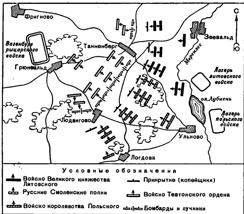
Схема расположения союзного польско-литовского войска и войска Тевтонского ордена к началу Грюнвальдской битвы (по С. Кучиньскому)

нием, часами потом с удивлением, наконец, с тревогой: фронт противника в действительности оказывался значительно шире, чем фронт рыцарского войска. Надо было срочно перестраивать боевой порядок рыцарского войска в две линии, чтобы удлинить фронт.