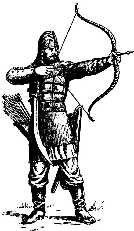
Воин русского Смоленского полка

В XIV веке благодаря укреплению власти великого князя в Литве усилились тенденции к образованию централизованного государства. Однако основной опорой великого князя продолжали оставаться крупные магнаты, входившие в Раду литовскую, то есть в состоявший при великом князе высший совет. Во главе войска стоял гетман, государственной перепиской ведал канцлер, доходами государства управлял подскарбий; их помощниками были каштеляны. В то же время находившиеся в составе литовского государства русские княжества продолжали управляться представителями местных княжеских родов. Таким образом, государственное устройство Великого княжества Литовского зависело от различных влияний, преимущественно польского и русского. Еще в 1387 г., то есть вскоре после Кривской унии, король Ягайло