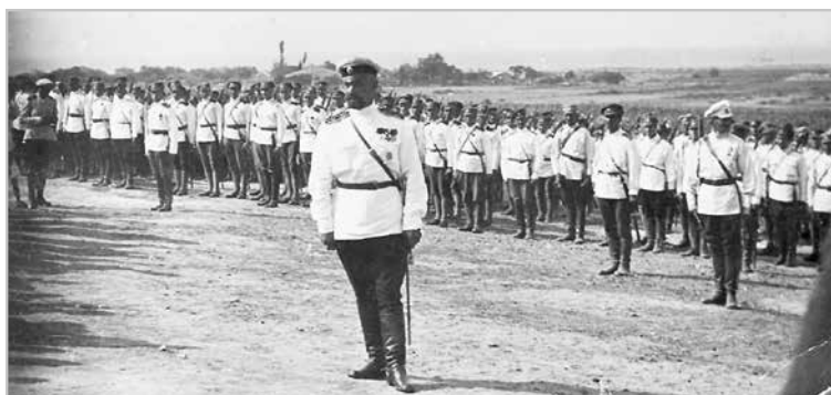
Генерал Кутепов на параде в Галлиполийском лагере