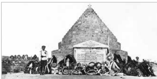
Памятник в Галлиполи