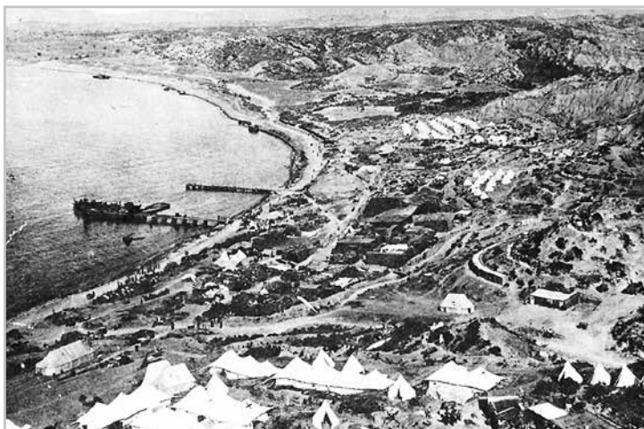
Вид русского лагеря в Галлиполи