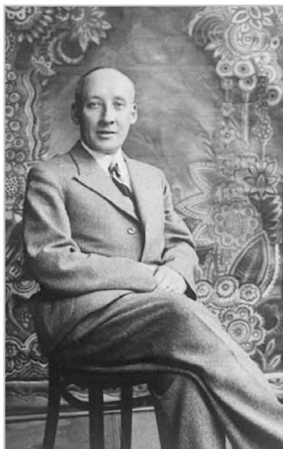
Прага. 1937 г.