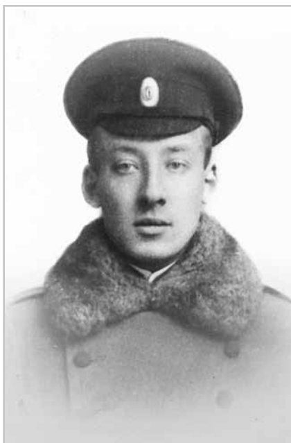
Георгий Орлов. Москва, 1916 г.