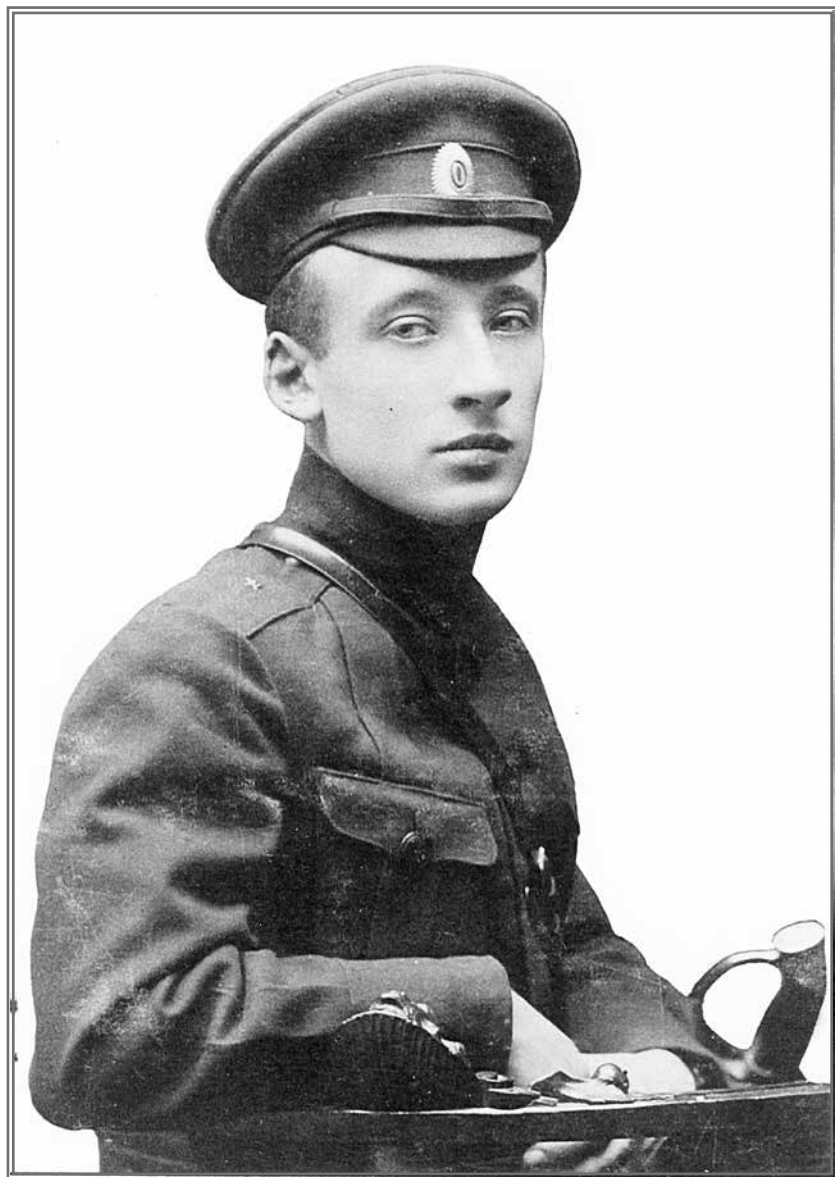
Георгий Орлов. 1917 г.