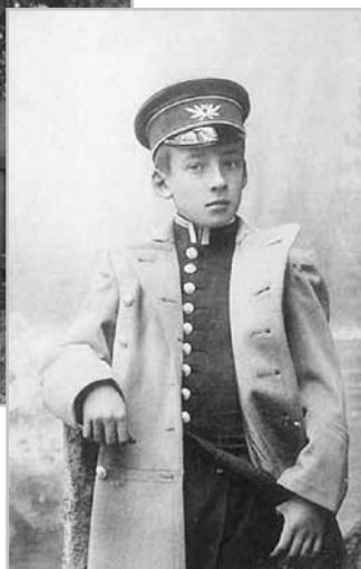
Георгий Орлов в 1906 г.