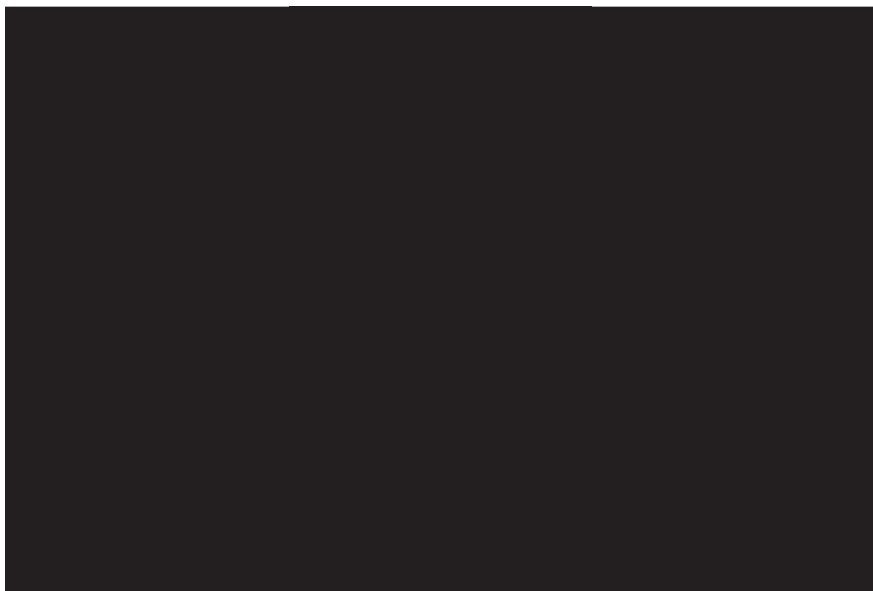
Рис. 2.1. Исследования в современном менеджменте

Основные компоненты исследования — постановка целей и задач; предварительный анализ имеющейся информации, условий и методов решения; формулировка исходных гипотез, планирование и организация экспериментов, проведение экспериментов, анализ и обобщение полученных результатов; проверка исходных гипотез на основе полученных фактов и окончательная формулировка новых фактов и законов, получение объяснений или научных предсказаний — на сегодняшний день являются актуальными не только для теоретической науки, но для практики управления.