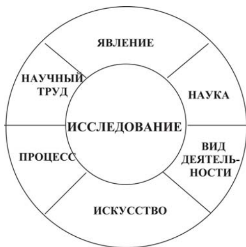
Рис. 1.1. Понятие “исследование”

Обобщая вышеизложенное, можно отметить, что исследование — это вид деятельности с более богатым содержанием чем, скажем, анализ, проектирование или диагностика. Исследование проблемы или ситуации включает в себя более широкий набор методов, чем анализ или проектирование. Это и наблюдение, и оценка, и проведение эксперимента, и классификация, и построение показателей, и многое другое. Безусловно, исследование включает в себя анализ, но не сводится к нему. Исследование представляет собой более высокий уровень творческой деятельности человека.