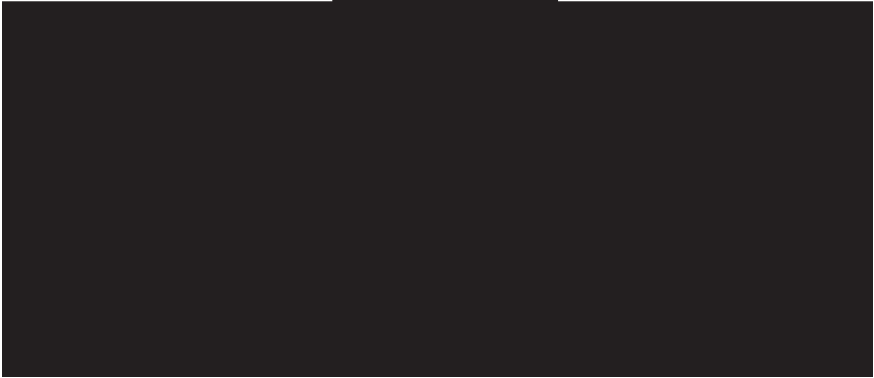
Рис. 3.3. Механизм действия анализа

В свою очередь, синтез состоит в обобщении информации об отдельных составляющих и формировании совокупности информационно-аналитических данных об объекте исследования в целом. Механизм действия синтеза представлен на рис. 3.4.