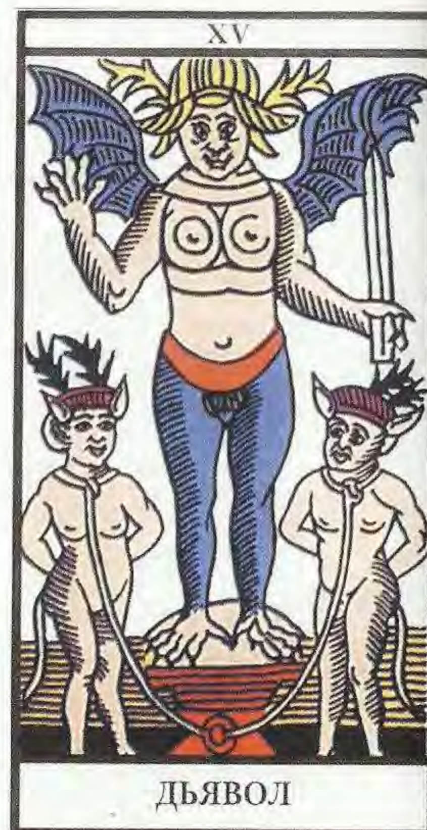
Рис. 7 (к с. 220). Аркан III «Хозяйка» Рис. 8 (к с. 283). Аркан XV «Дьявол»

«Создание этой колоды Таро уходит корнями в деятельность герметического ордена “Золотого Рассвета” английского общества розенкрейцеров, в который Алистер Кроули вступил в 1898 г. <...>