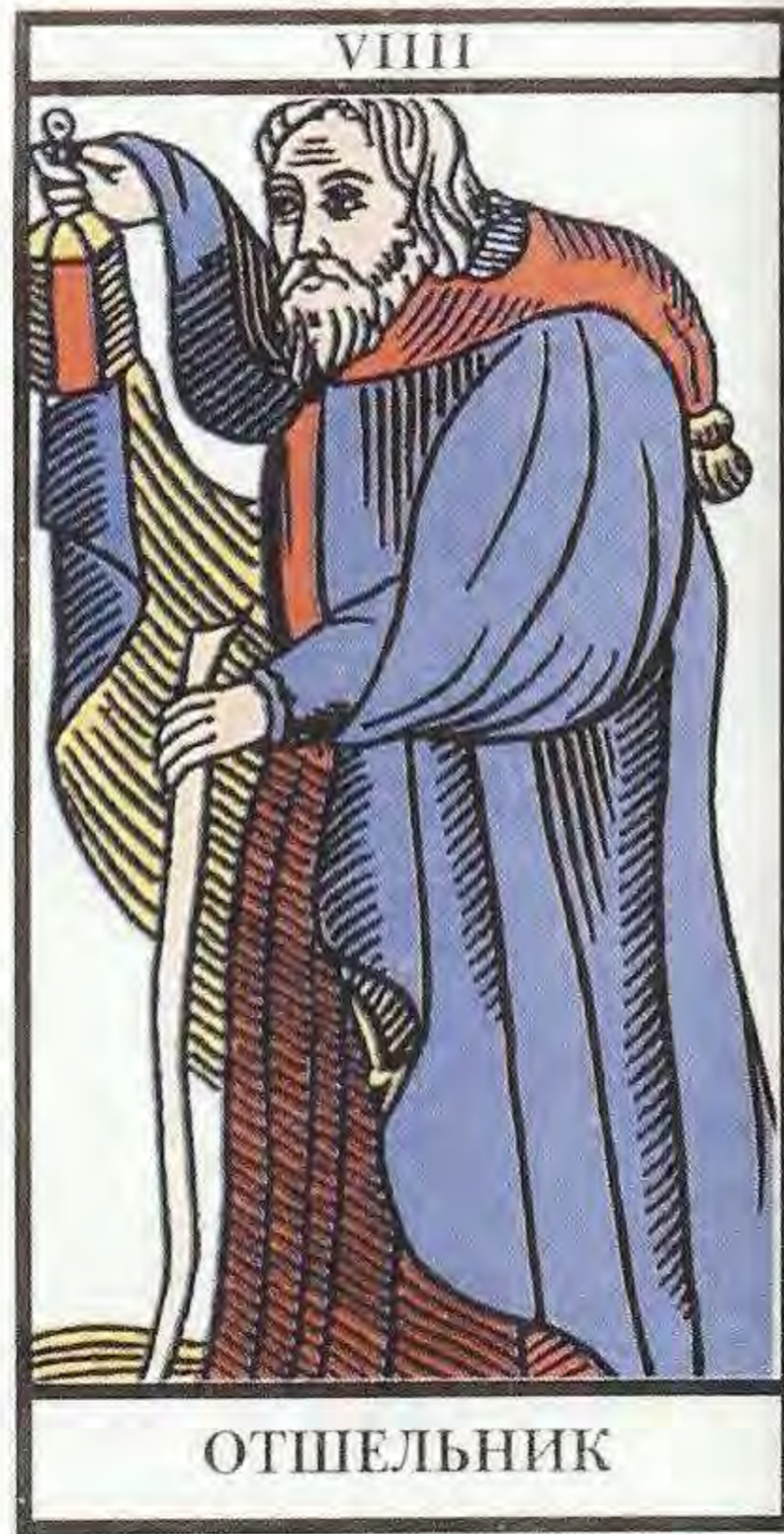
Рис. 3 (к с. 80). Аркан XIII «Смерть» Рис. 4 (к с. 91). Аркан IX «Отшельник»