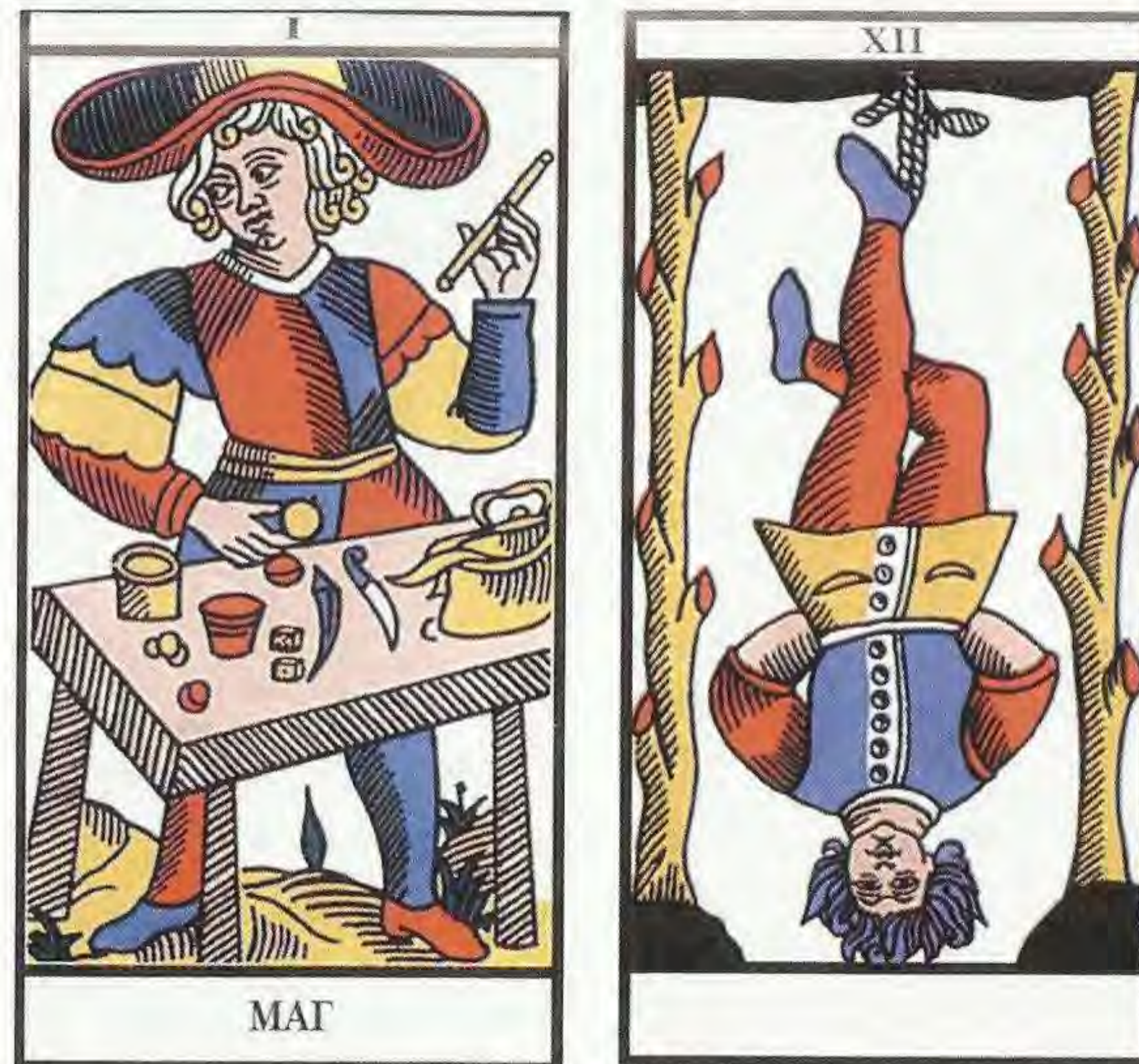
Рис. 1 (к с. 22). Аркан I «Маг»