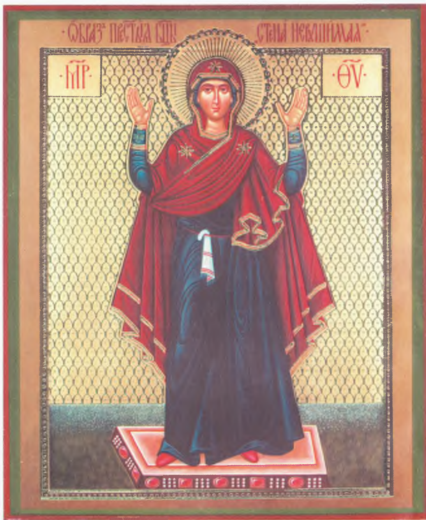
Икона Божией Матери «Нерушимая Стена»