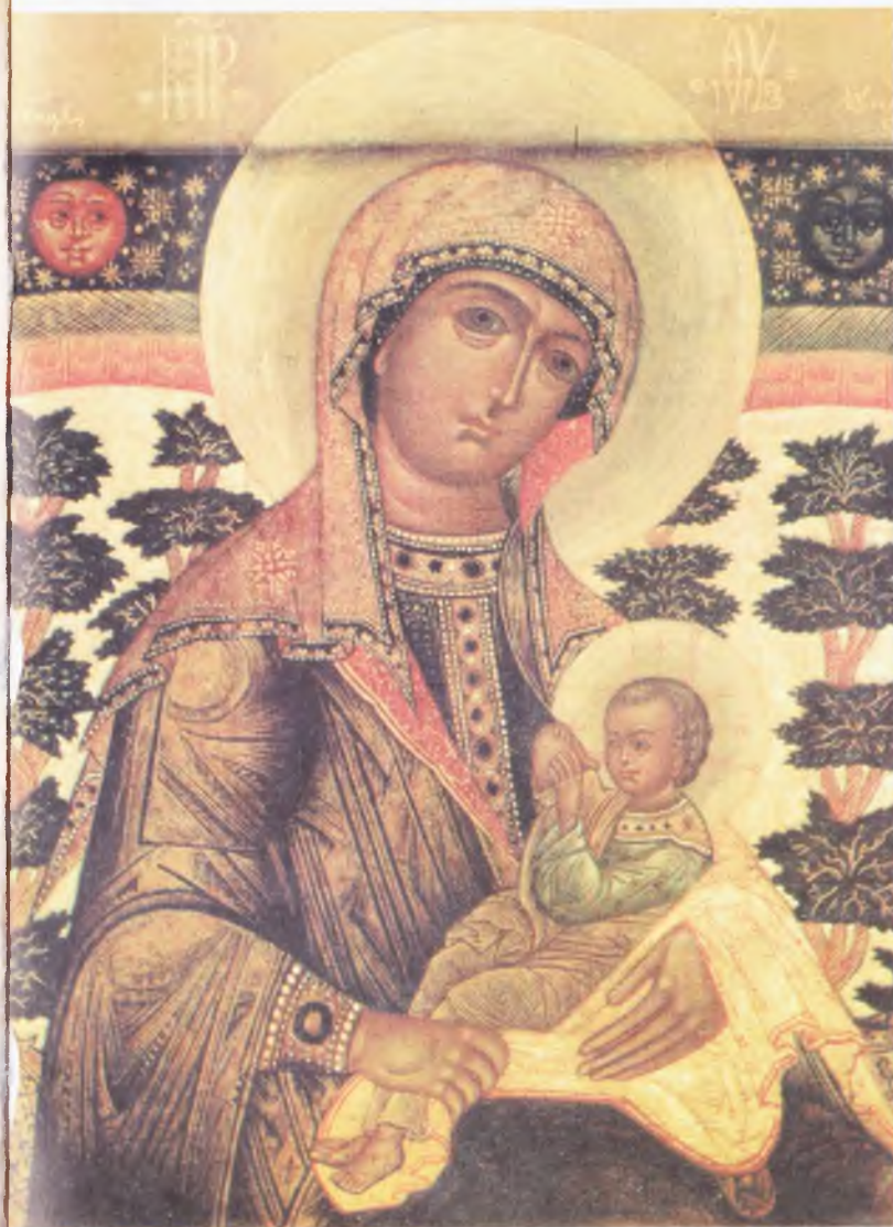
Икона Пресвятой Богородицы «Млекопитательница»

«Моли Бога о мне, святыи угодниче Божий (имя), яко аз усердно к тебе прибегаю, скорому помощнику и молитвеннику о душе моей».