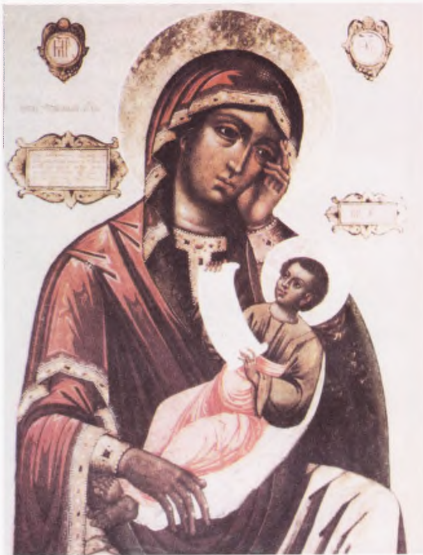
Икона Пресвятой Богородицы «Утоли моя печали»