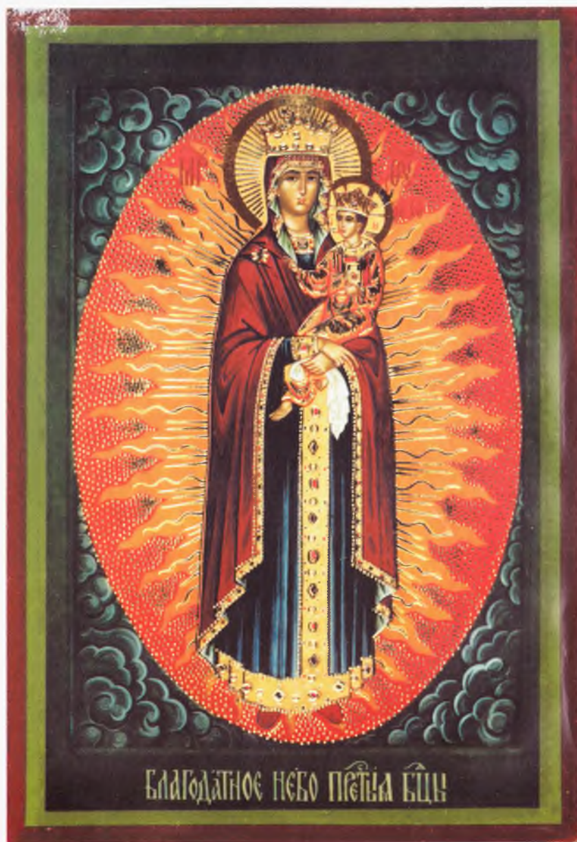
Икона Пресвятой Богородицы «Благодатное Небо»