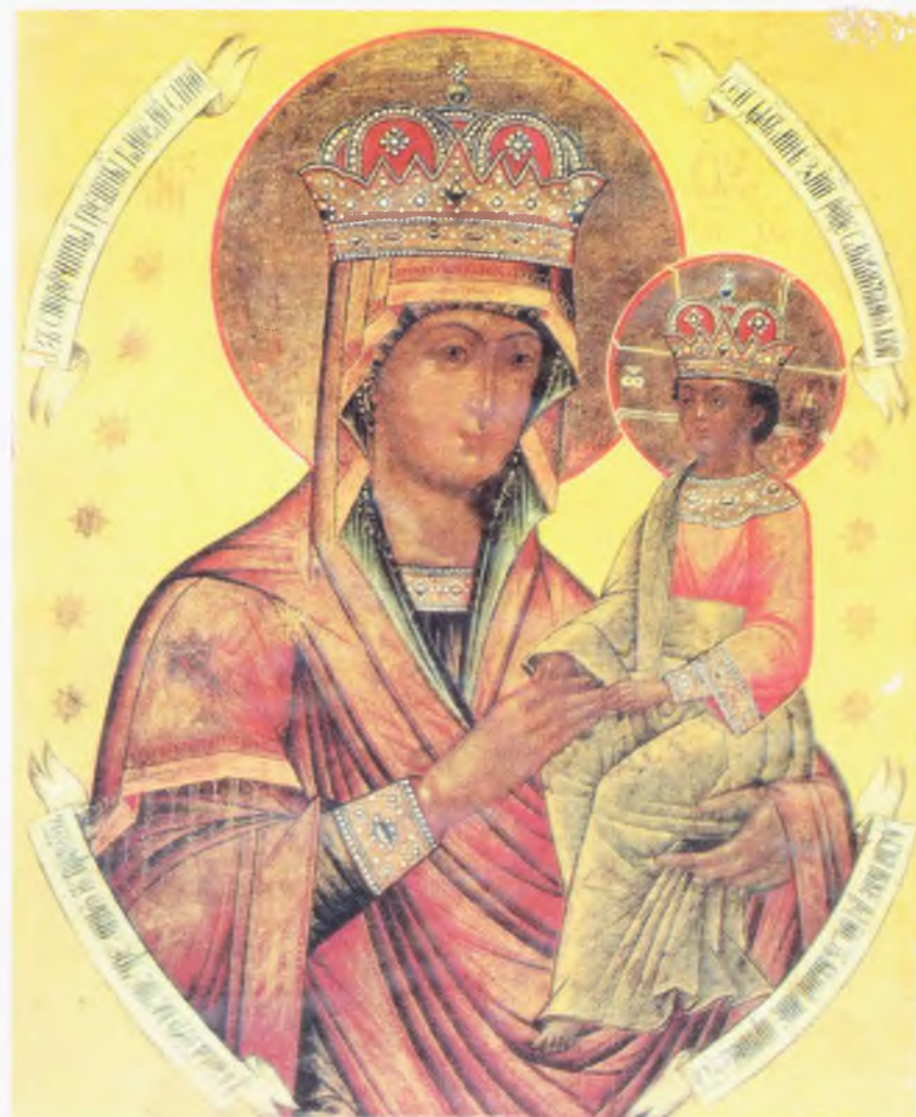
Икона Божией Матери «Споручница грешных»