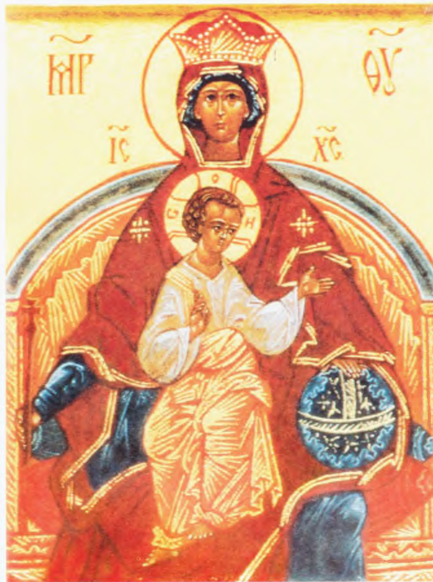
Икона Божией Матери «Державная»