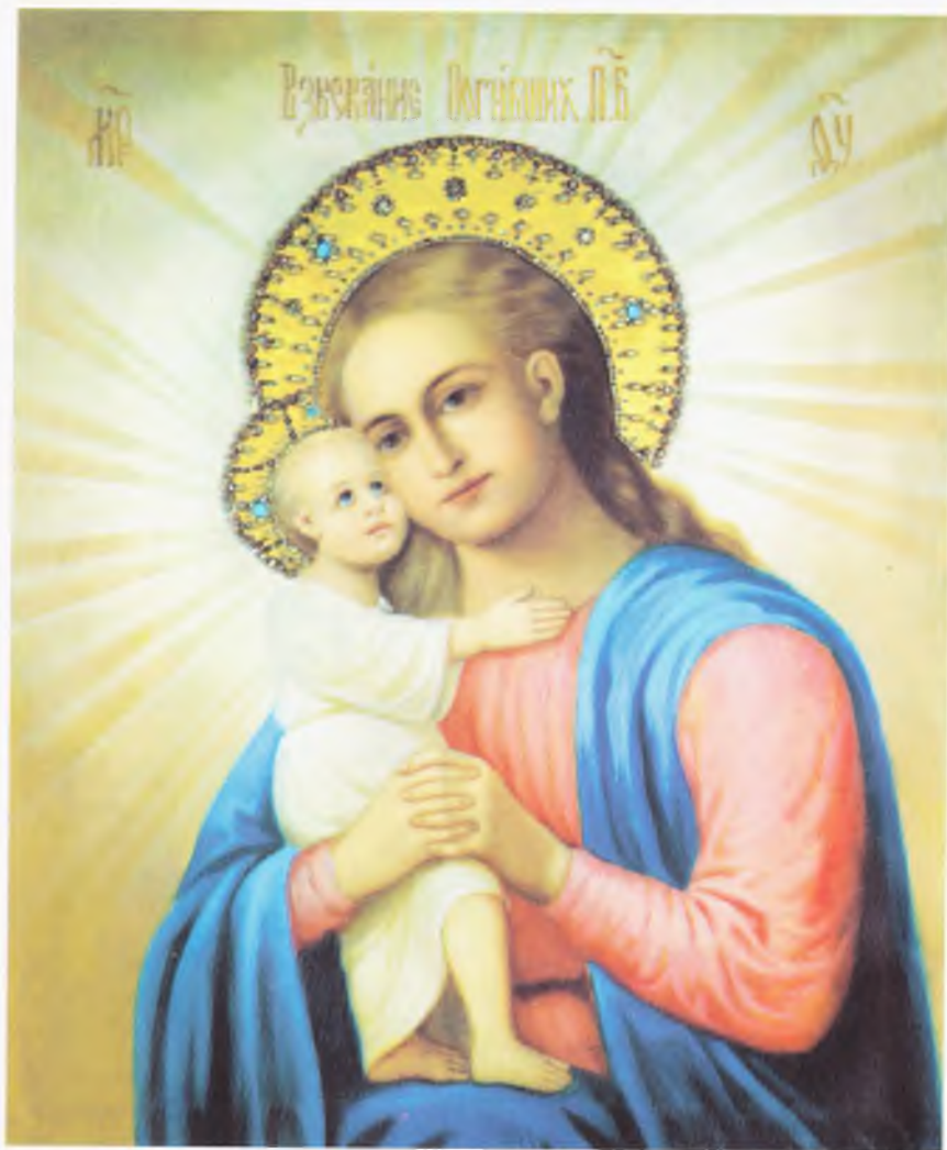
Икона Божией Матери «Взыскание Погибших»