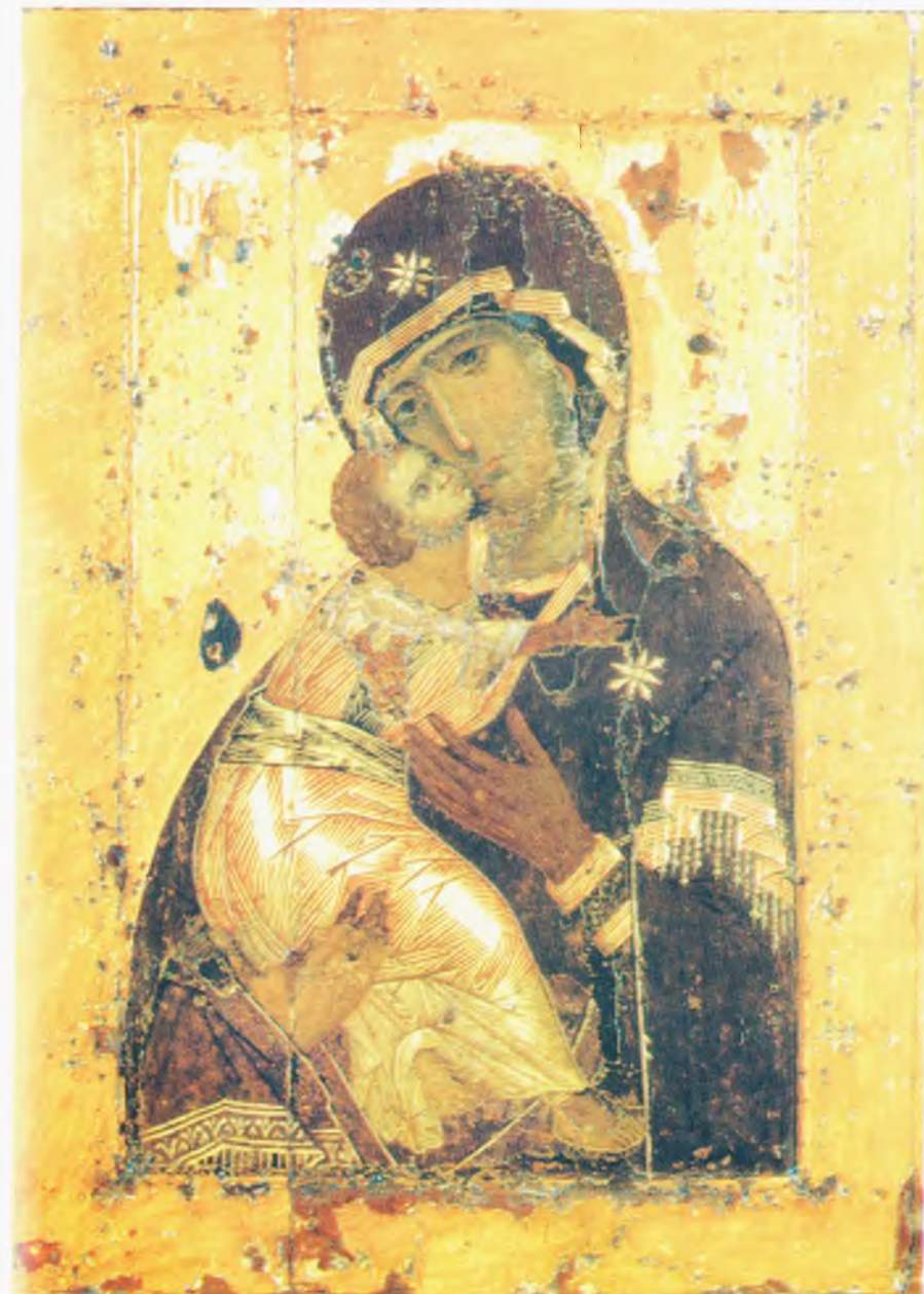
Владимирская икона Божией Матери