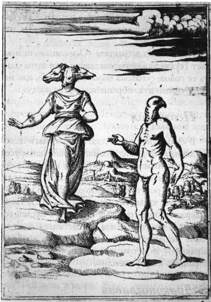
Геката с головами животных. Иллюстрация из трактата итальянского мифографа Винченцо Картари «Образы древних богов» (1571).

са» (IV.2006–2125) упоминается изображение трехглавой Гекаты на льняном листе. Гекату предписывается изобразить с головами коро-