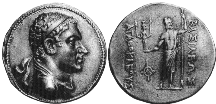
Греческая тетрадрахма из Бактрии

оракулов, если бы не то обстоятельство, что монета была отчеканена в 185–170 гг. до н.э., а халдейские оракулы появились несколькими веками позже.