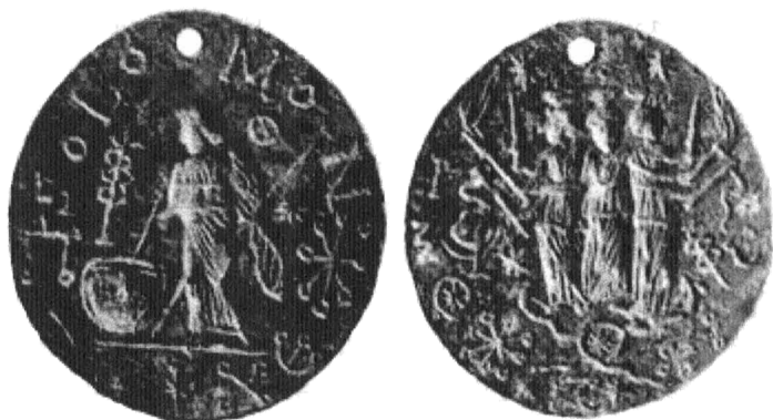
Амулет с изображением Соломона (слева) и Гекаты (справа).

чами в руках, а на другой — царь Соломон, совершающий операцию гигромантии (призывания духа при помощи сосуда с водой). Это еще одно наглядное свидетельство взаимодействия и синтеза иудейской и греческой магии.