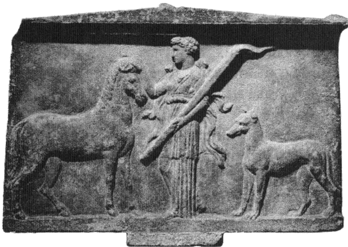
Вотивный рельеф из Краннона (ок. 400 г. до н.э.).