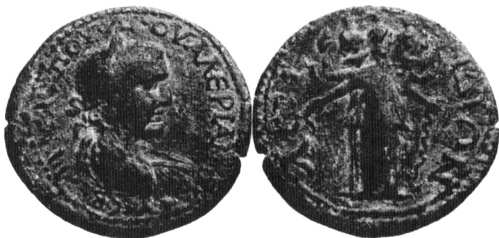
Монета из Аспенда (Памфилия)

из Памфилии (ныне часть Турции) трехтелая Геката предстает с калафом на голове и с факелами и змеями в руках.