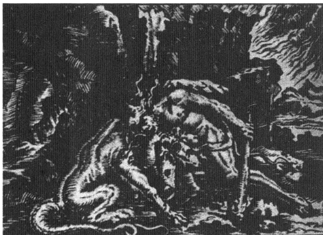
Геркулес выводит Цербера из Аида. Гравюра И.У. Краусса (1655–1719), иллюстрация к «Метаморфозам» Овидия.

растал ядовитый аконит. Высказывалось предположение, что имя Кербера произведено от «Кер Эреб» и, таким образом, означает «демон мрака». Если так, то становится понятно, почему философ Порфирий называл Кербера одним из верховных демонов. Агриппа приписывал Порфирию утверждение о том, что Кербер «сущий в трех стихиях, а именно, Воздухе, Воде и Земле, есть вредоноснейший диавол» 4 ; однако в действительности Порфирий в трактате «Об изваяниях» писал: «Кербера изображают трехглавым, потому что есть три положения солнца над землей: восход, полдень и закат».