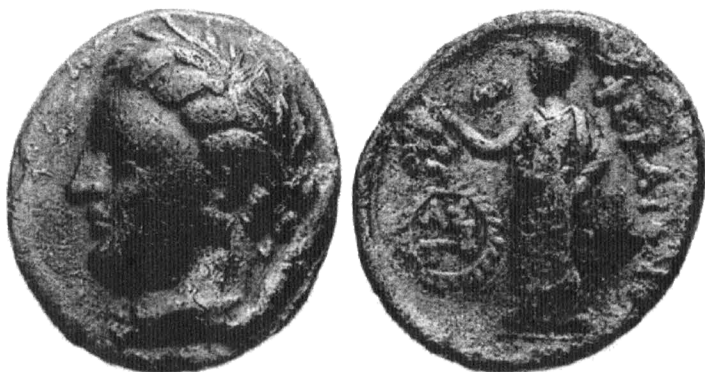
Трибол из Фессалии

На византийских монетах в честь Гекаты изображали полумесяц со звездой. В 339 году до н.э., когда Филипп Македонский (отец Александра Македонского) осадил Византий, именно Геката, по мнению местных жителей, спасла город от врагов. Стефан Византийский (VI век н.э.) в своем «Описании народов» рассказывает, как воины Филиппа сделали подкоп и собирались ночью напасть на город, но Геката, сияющая богиня луны, явила горожанам видение факелов, благодаря чему замысел неприятеля раскрылся и был сорван. Турки, захватившие Византий в 1453 году, заимствовали полумесяц со звездой — эмблему Гекаты — для своего флага. Впоследствии сложились новые легенды, приписавшие этому символу иное происхождение, но в действительности за ним изначально стояла Геката 2 !