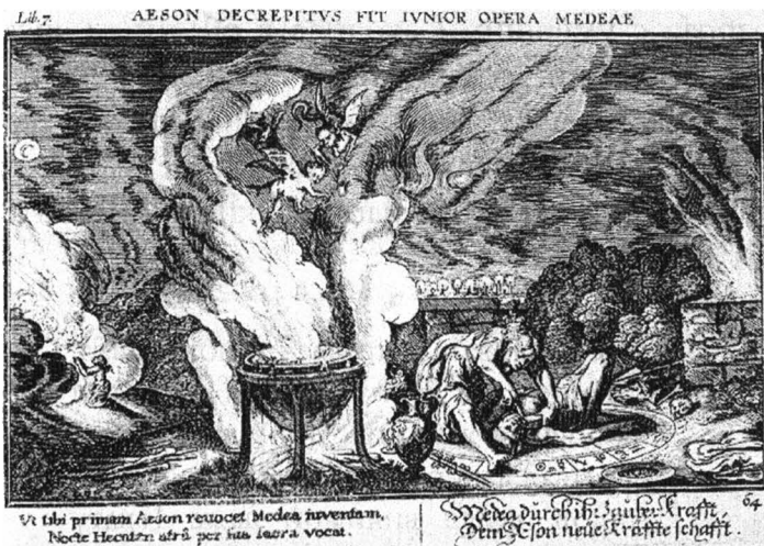
Медea перерезает горло Эсону. Гравюра И.В. Баура (1607–1640), иллюстрация к «Метаморфозам» Овидия.

Аида мертвого человека» 6 . В том же фрагменте упоминаются такие магические силы, как власть над погодой и защита от старости, — а в древнегреческой литературе эти способности тесно ассоциировались с Медеей и другими жрицами и служителями Гекаты.