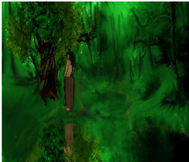
III. Единение-преобразование человек-Натем