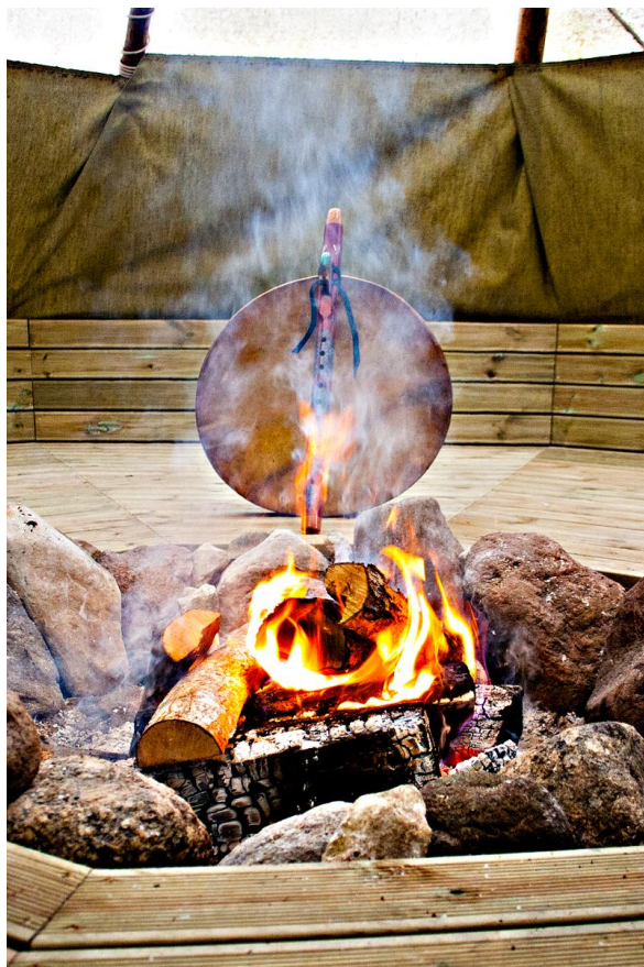
IX. Огонь, наполняющий духом флейту, отдыхающую на бубне