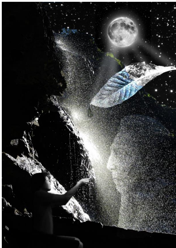
VII. Видение древней песни Тунакарамаму: Апачуру