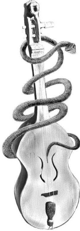
V. Призыв духа анаконды с помощью Каэр