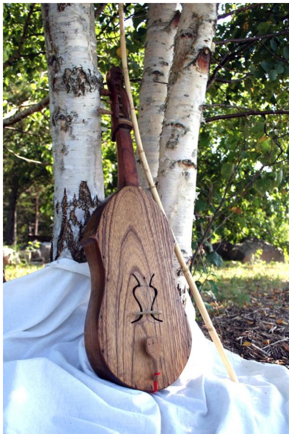
IV. Музыкальные инструменты: Туманк и Казэр