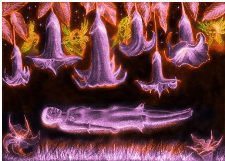
VIII. Сновидение Ванто (Флорипондия, Бругмансия)

немного подождать и принять чукулу (напиток из зрелого приготовленного банана) перед возвращением в маленький ямтаи. Вернувшись к очагу, путники получают чичу (ферментированный напиток на основе юкки), это будет поддерживать их следующую ночь, которую они проведут у реки. На следующий день начинают кушать суп: юкка, пельма и пальма. Диета и забота должны бережно продолжаться, также как и отдых на реке в одиночестве. Продолжается связь с Табаком. Согласно пути, который был избран для каждого Мастером или личным собственным решением, начнется погружение в практику Натемаму или принятие Маикия (Maikiua) или Ванто (Wanto) (вариация Бругмансия – Brugmansia, дурман джунглей) в священной церемонии: Маикиямаму (Maikiuamamu).