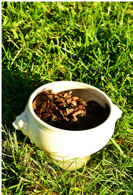
II. Церемониальная чаша с Табаком