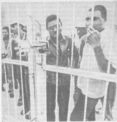
Вся жизнь — за железными воротами

события непосредственно на оппенгеймеровских золотых рудниках Ранда явились своеобразной «репетицией» того, что произошло затем в Соуэто.