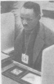
Последняя ступень на пути к аду

Вот цифры, которые не встретишь в ежегодных отчетах «Англо-Американ корпорейшн»: для них «не хватило места» среди бесчисленных выкладок, касающихся инвестиций, авуаров, прибылей и дивидендов ААК и ее филиалов. Пятеро из каждой тысячи африканцев, загнанных в золотые подземелья Ранда, становятся жертвами несчастных случаев и профессиональных болезней. Еще семнадцать расплачиваются рукой, раздавленной обвалом, либо ногой, попавшей под вагонетку, либо другими тяжелыми увечьями.