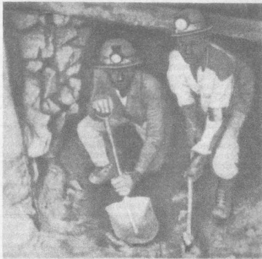
Каторжный труд африканцев на шахтах Витватерсранда

Правда, обоих Оппенгеймеров, особенно «либерала» Гарри, подчас коробила прямолинейность столпов расистского режима, во всеуслышание заявлявших о намерении увековечить «бааскап», что на африкаанс означает господство белых. В начале правления националистов главу «Англо-Американ корпорейшн», как и ряд других южноафриканских горнорудных магнатов «бритишеров», несколько озадачивала антимонополистическая демагогия новых правителей страны (наиболее крупные частные состояния контролировались тогда британцами), взятый