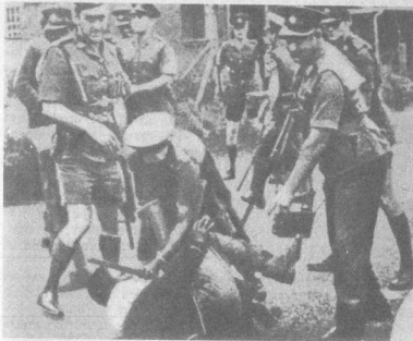
Очередная жертва полицейского террора

Современники свидетельствуют, что Сесиль Родс очень гордился тем, что его именем назвали целую страну — честь, которой в истории человечества удостоились очень немногие. Уже будучи на смертном одре, он все спрашивал: «Они не изменят название страны?» Но наследники Родса столкнулись после второй мировой войны