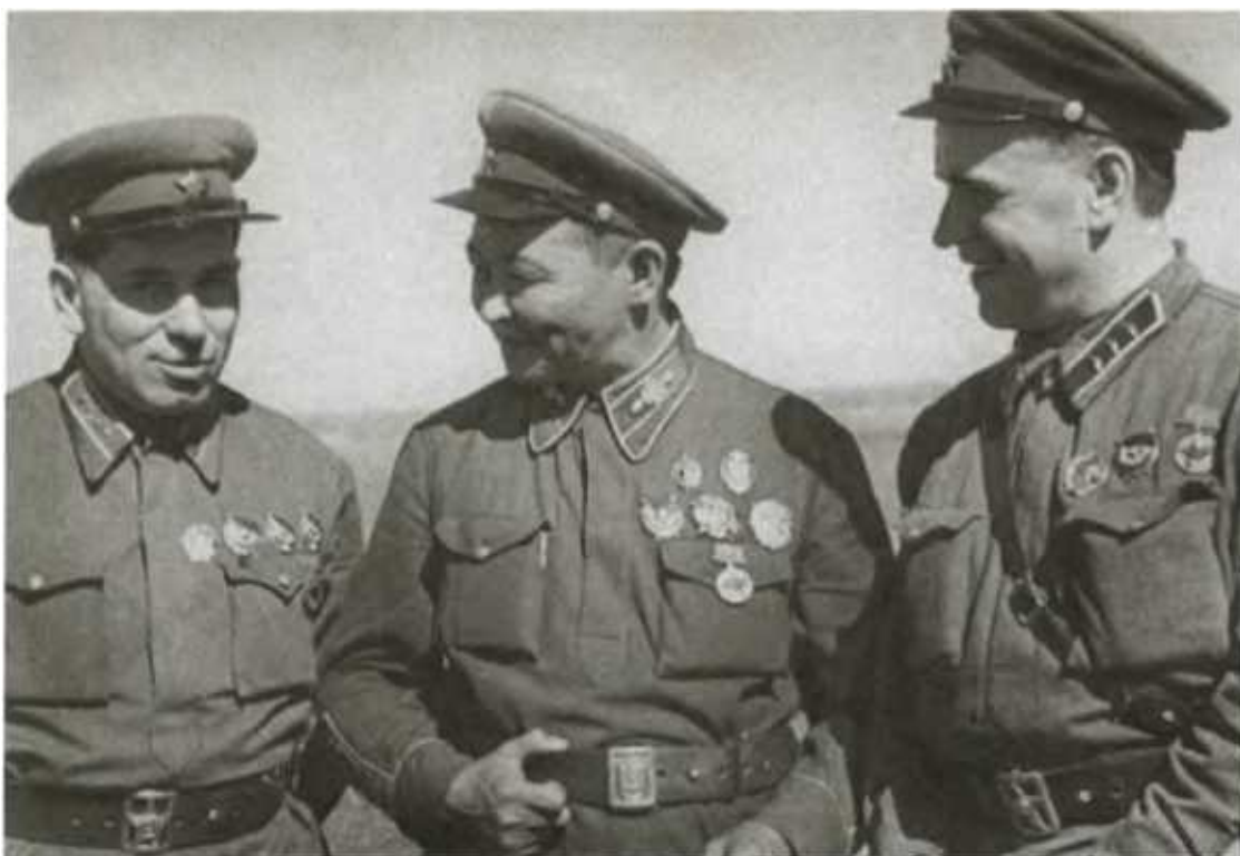
Командарм 2-го ранга Г. М. Штерн, маршал Х. Чойбалсан и комкор Г. К. Жуков.