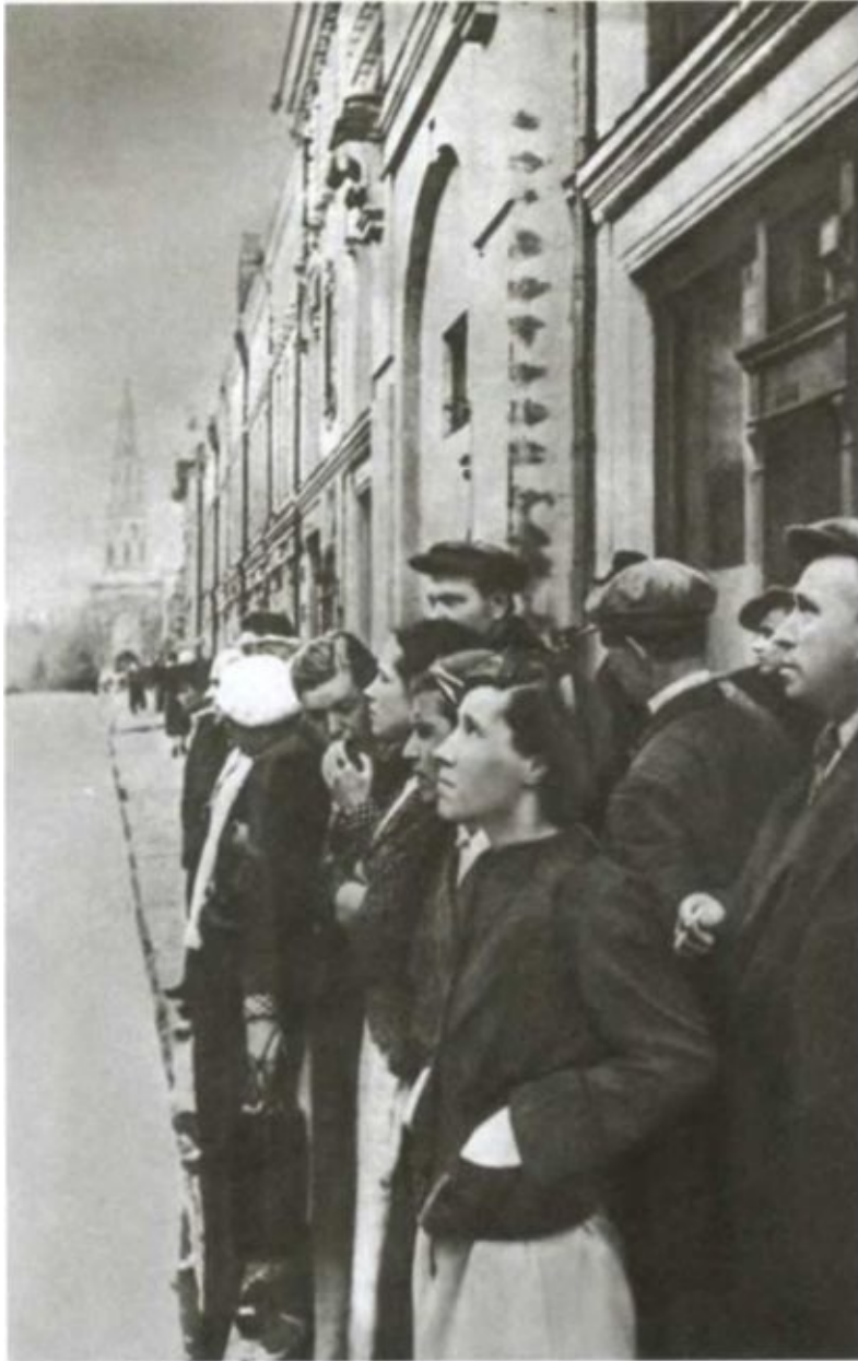
Москва. 22 июня 1941 г.