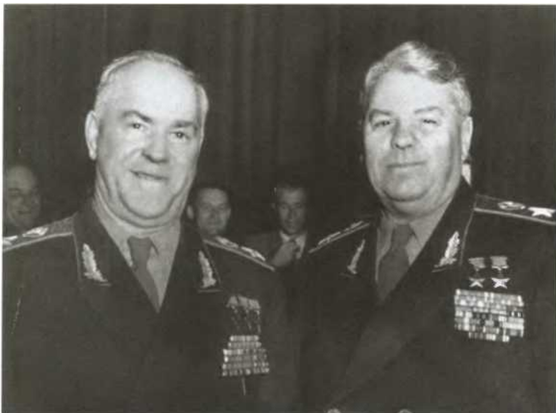
Г. К. Жуков и А. М. Василевский.