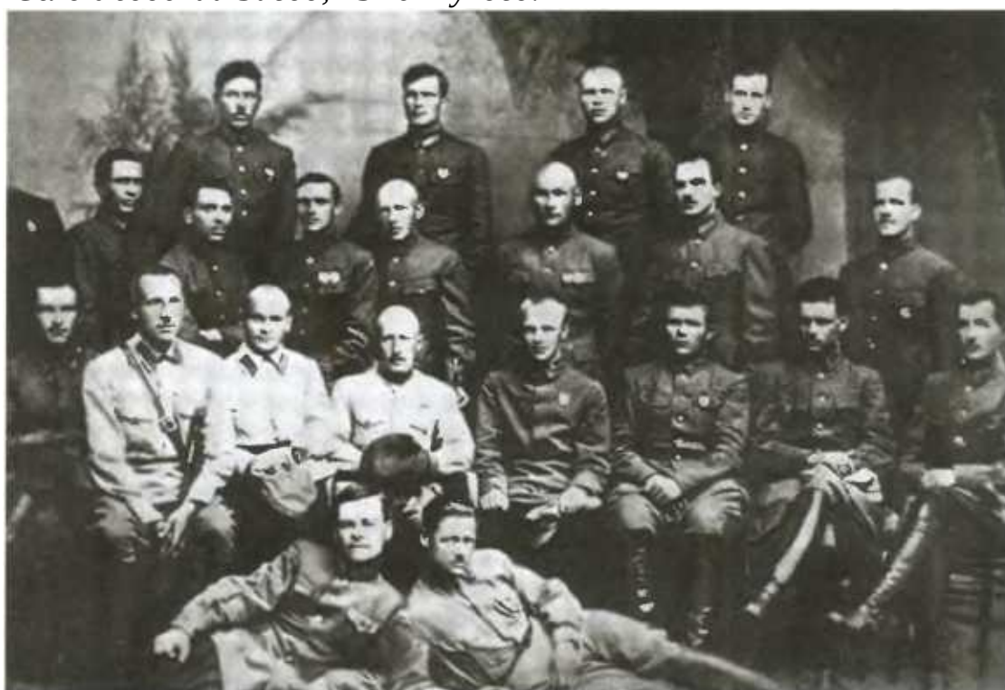
Кавалерийские курсы командного состава. Во втором ряду первый справа — Г. К. Жуков.