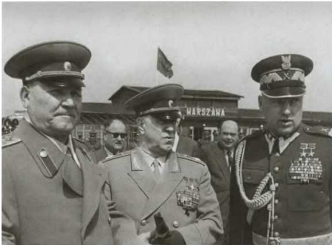
И. С. Конев, Г. К. Жуков и К. К. Рокоссовский на аэродроме в Варшаве. 1955 г.