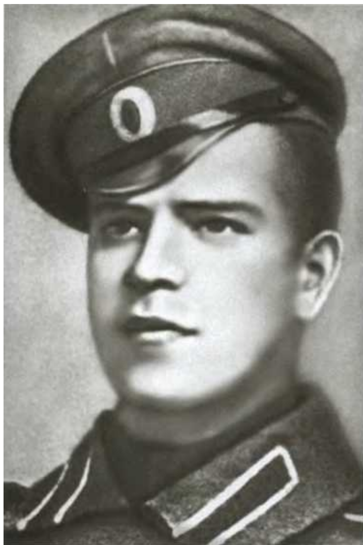
Вицеунтер-офицер Георгий Жуков.