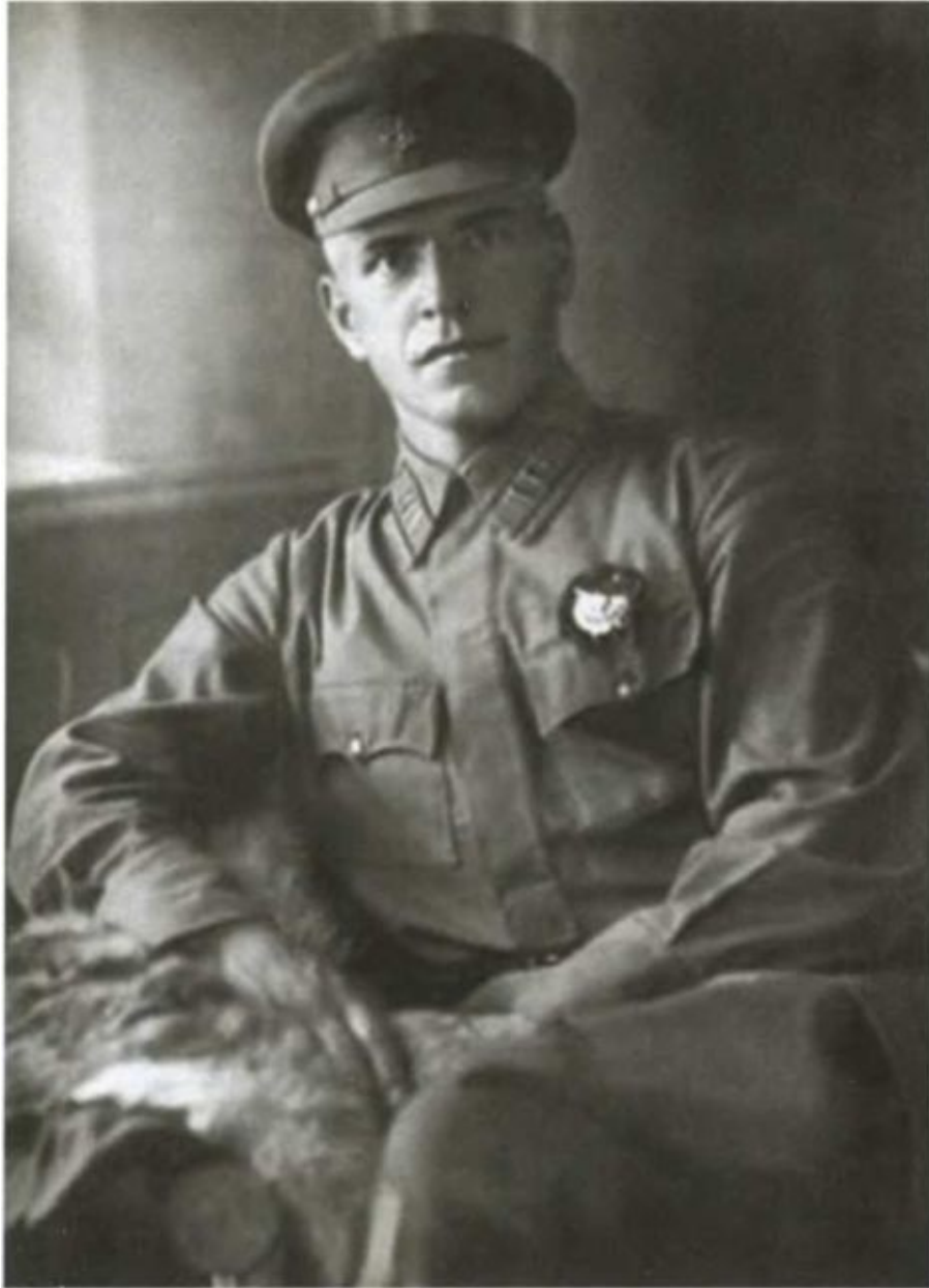
Г. К. Жуков — помощник инспектора кавалерии Управления боевой подготовки РККА. 1931 г.