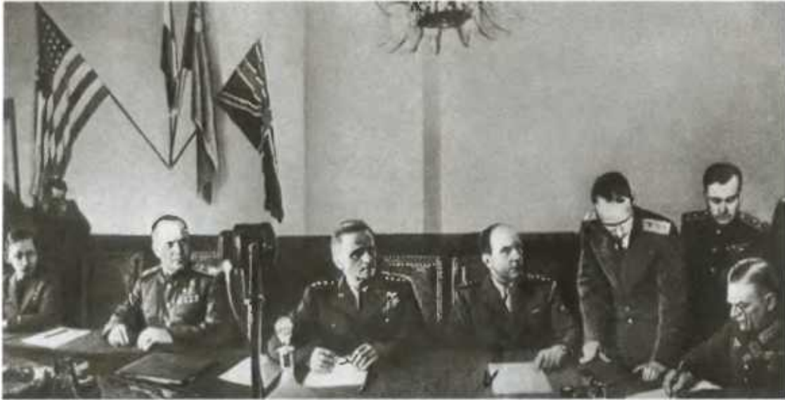
Подписание акта о капитуляции фашистской Германии. 9 мая 1945 г.