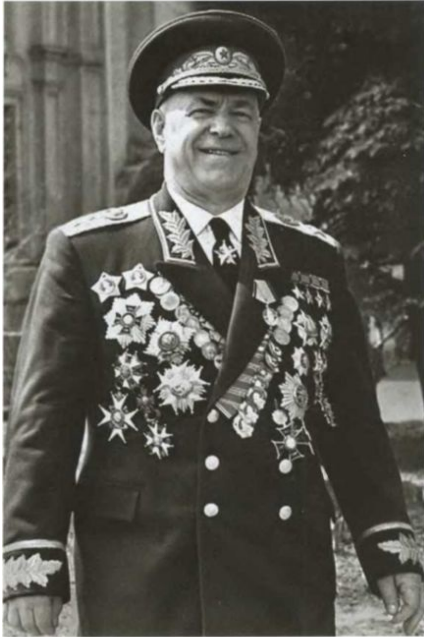
Маршал Советского Союза Георгий Константинович Жуков.