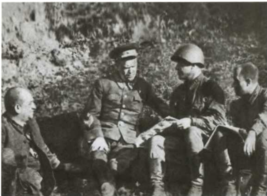
Г. К. Жуков под Ельней.