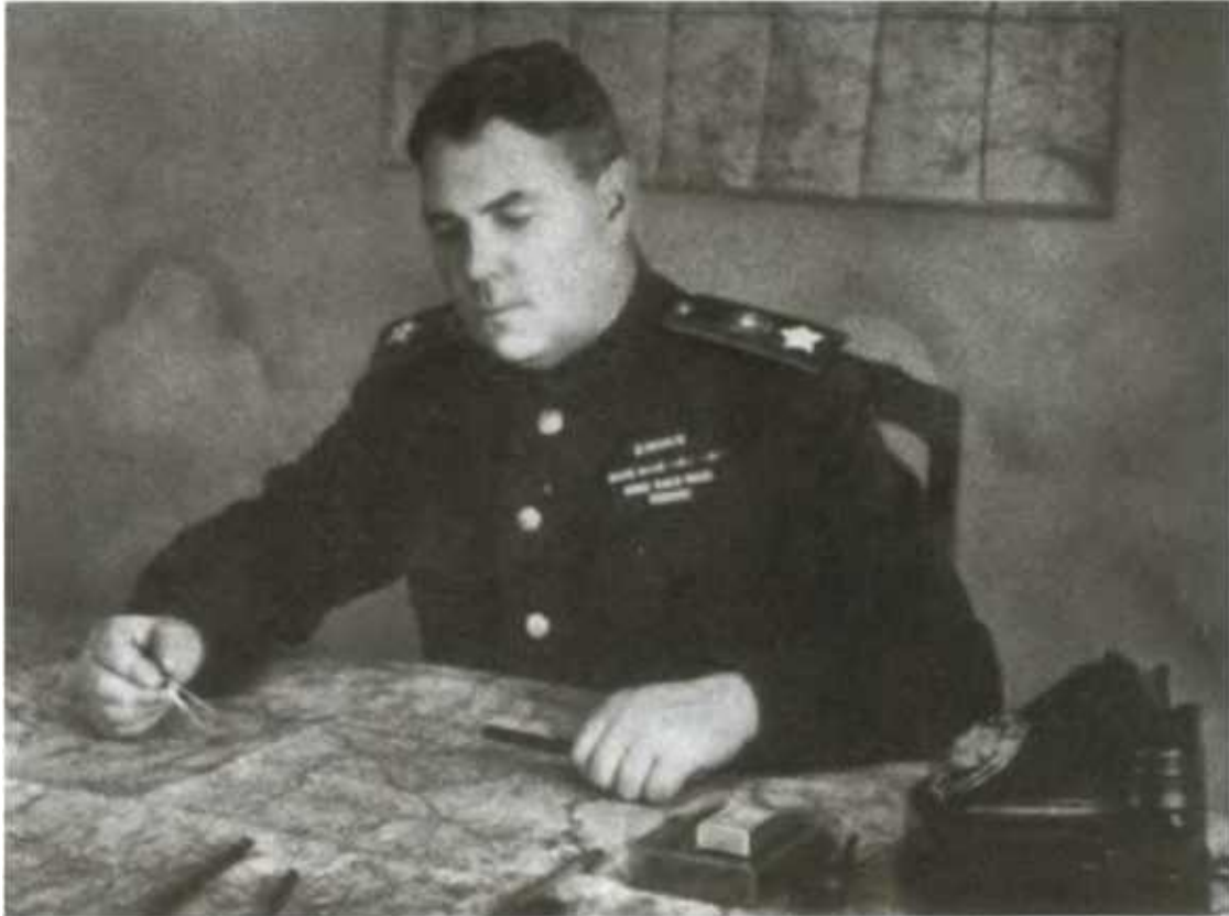
А. М. Василевский — начальник Генерального штаба. 1943 г.