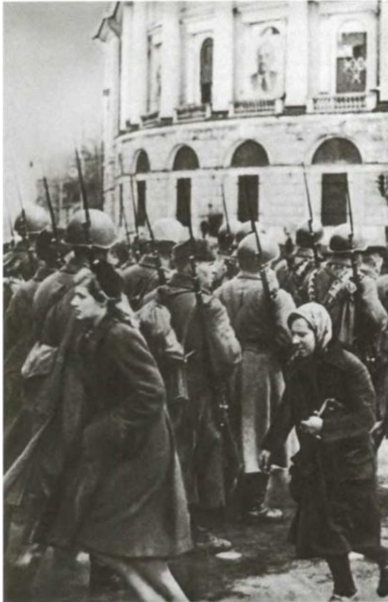
На улицах Ленинграда.