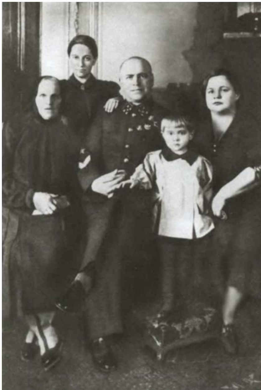
Семья Г. К. Жукова. 1940 г.