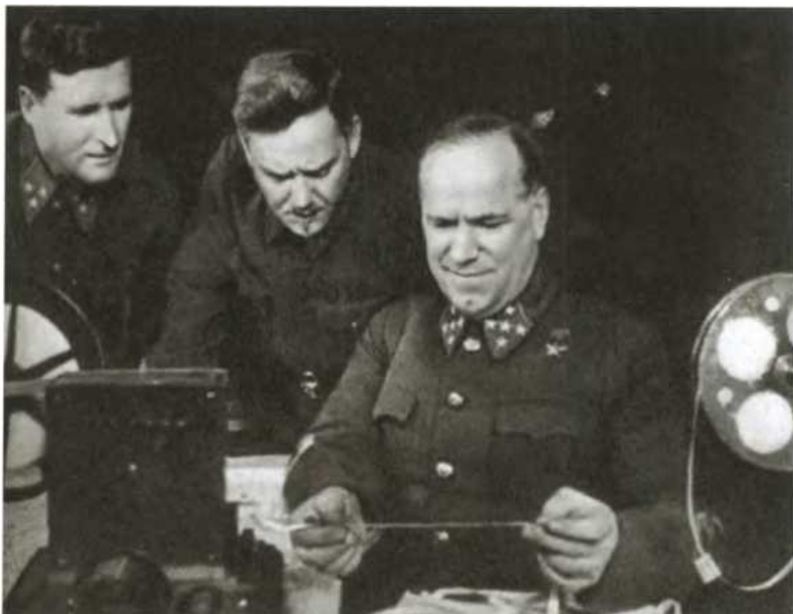
Западный фронт. Г. К. Жуков с Н. А. Булганиным и В. Д. Соколовским.