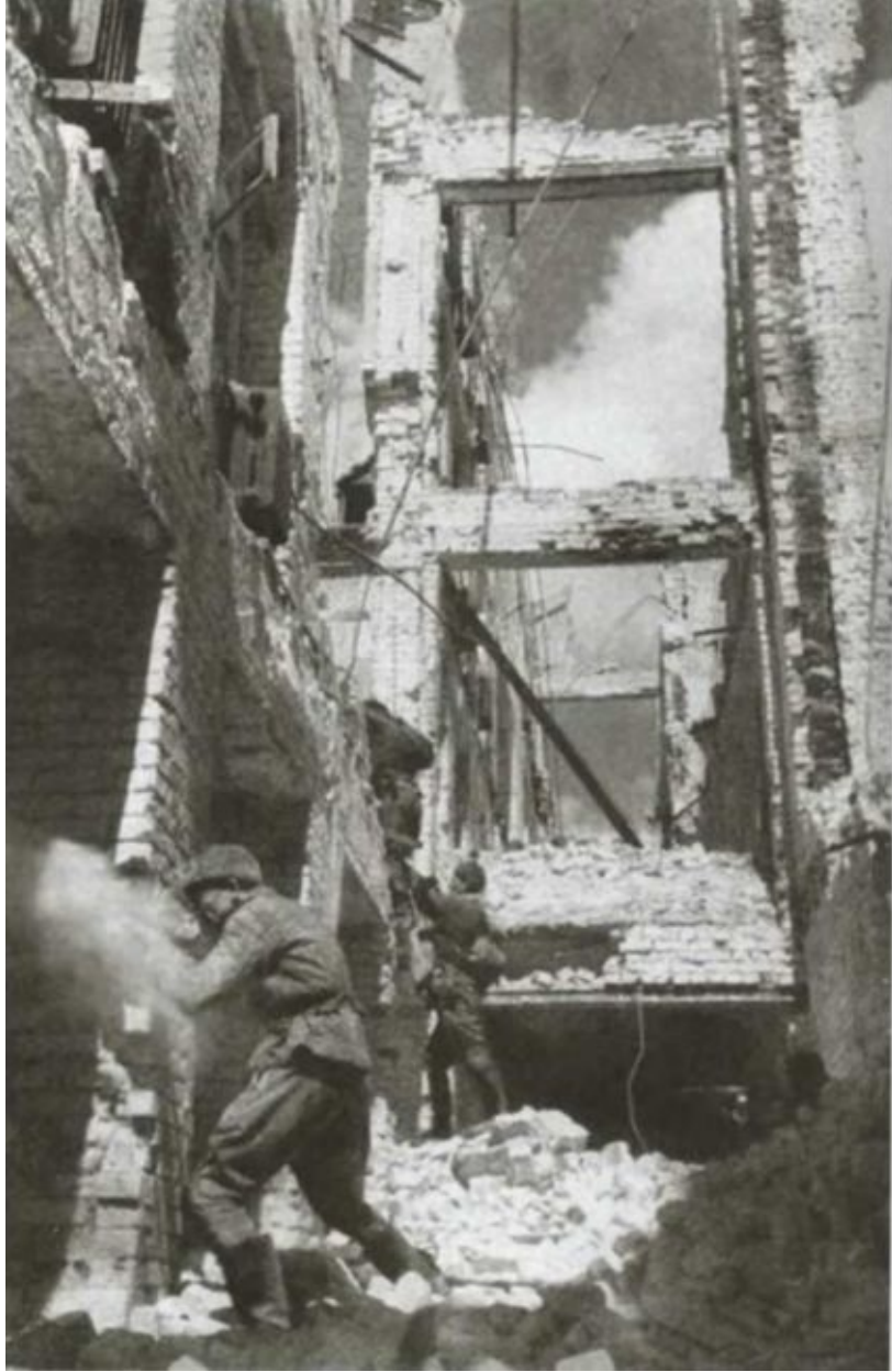
Бои в Сталинграде.