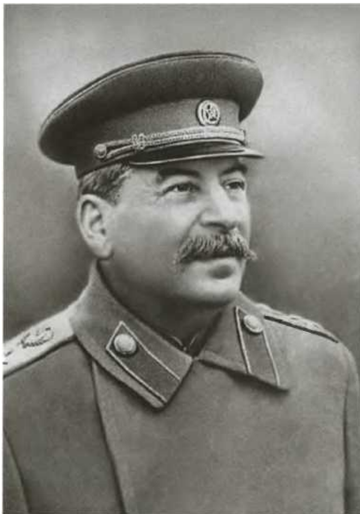
И. В. Сталин — руководитель государства, ВКП(б), Верховный главнокомандующий.