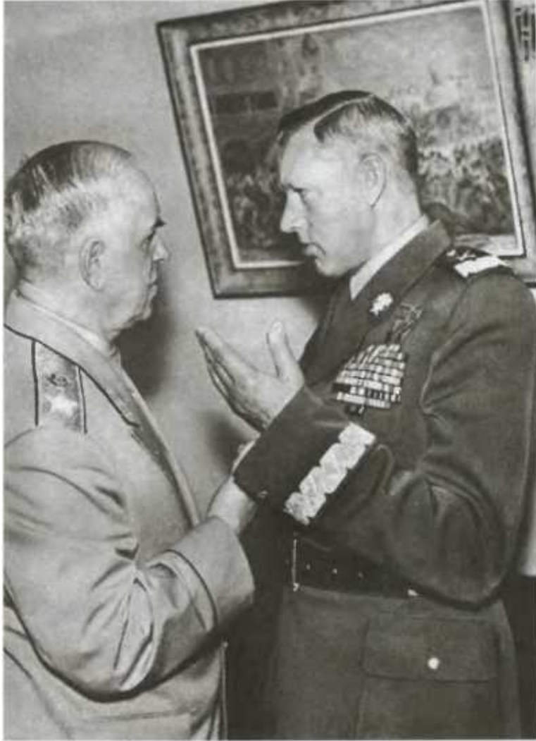
Г. К. Жуков и К. К. Рокоссовский. 1956 г.