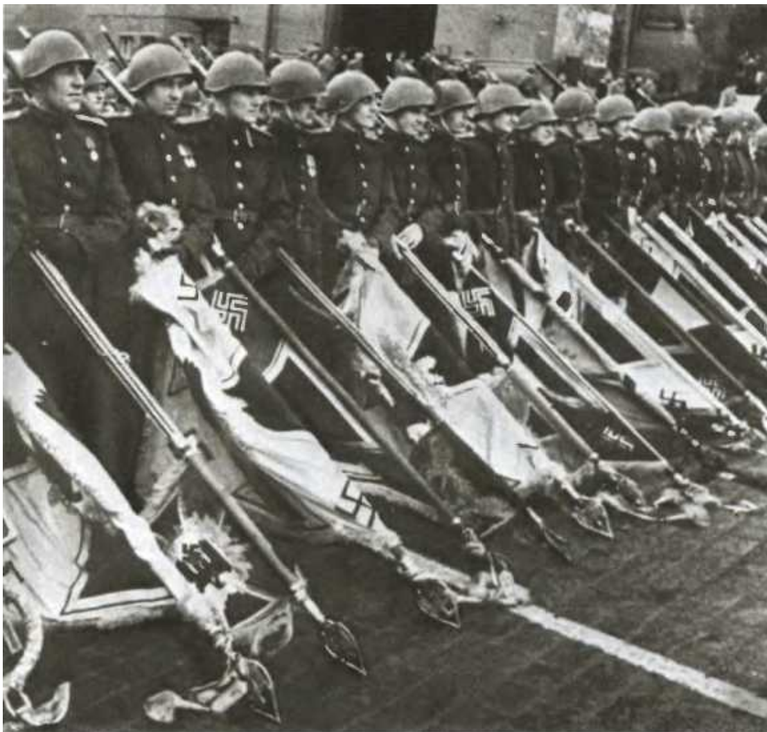
Парад Победы. Советские воины складывают знамёна и штандарты поверженных германских армий к подножию мавзолея.