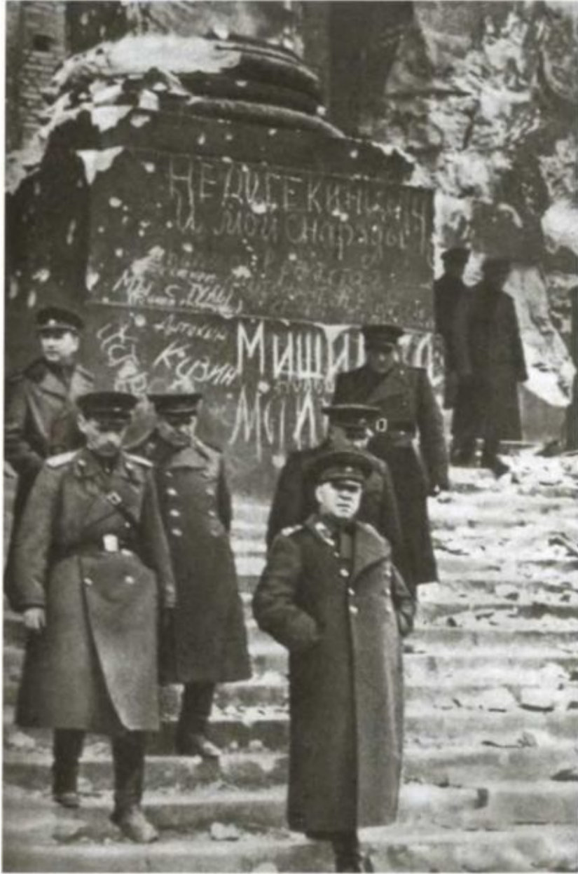
Г. К. Жуков на руинах рейхстага. 1945 г.