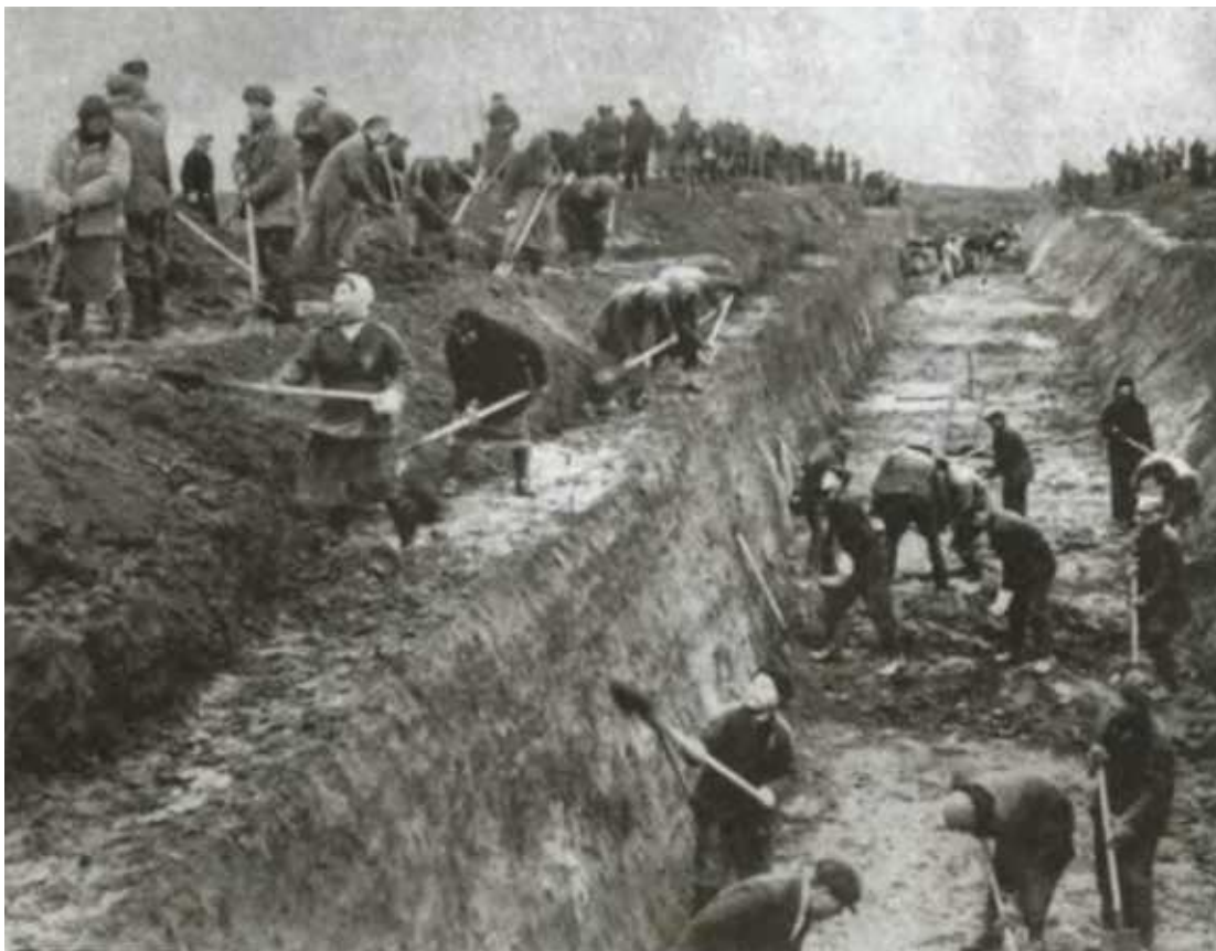
Строительство оборонительных рубежей на подступах к Москве. Сентябрь 1941 г.