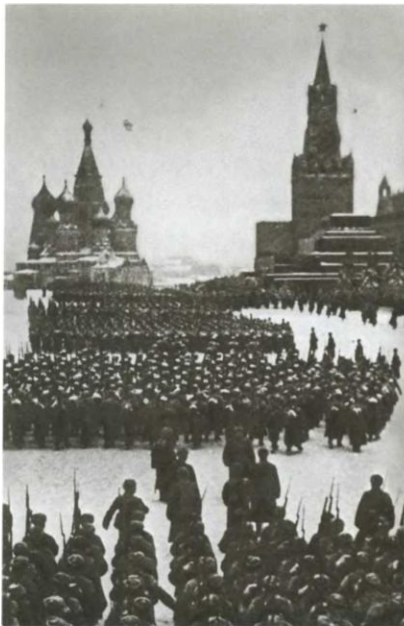
Парад войск 7 ноября 1941 года, уходящих с Красной площади на защиту Москвы.