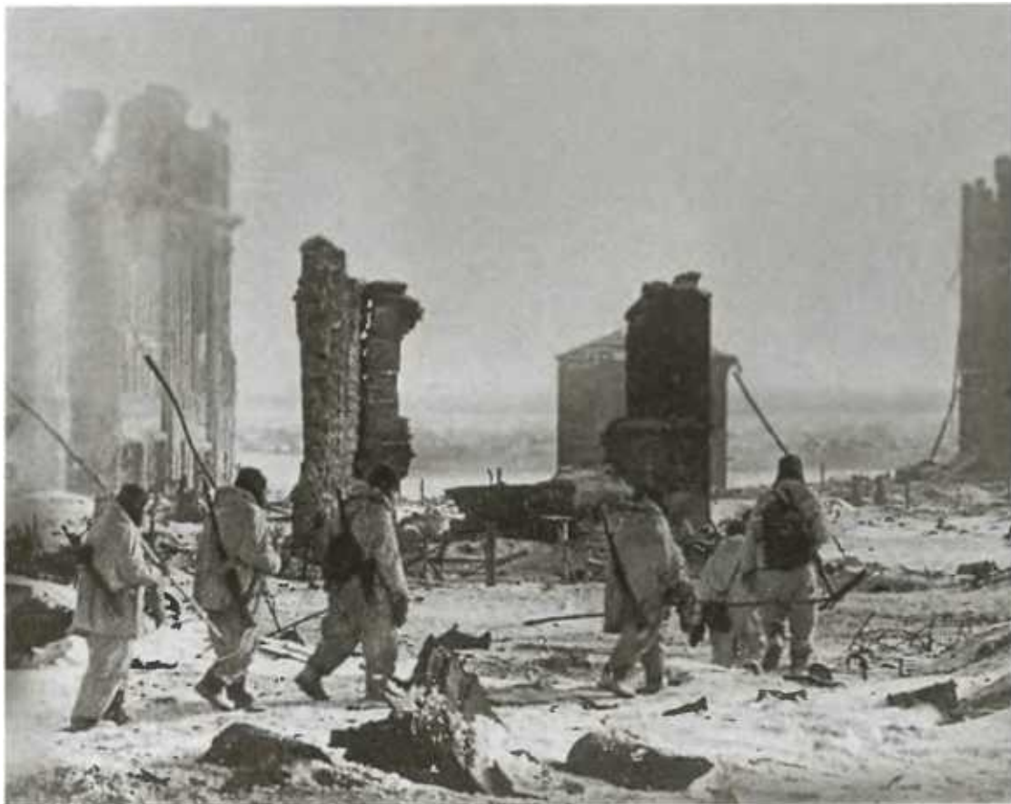
Советская пехота на улицах Сталинграда.