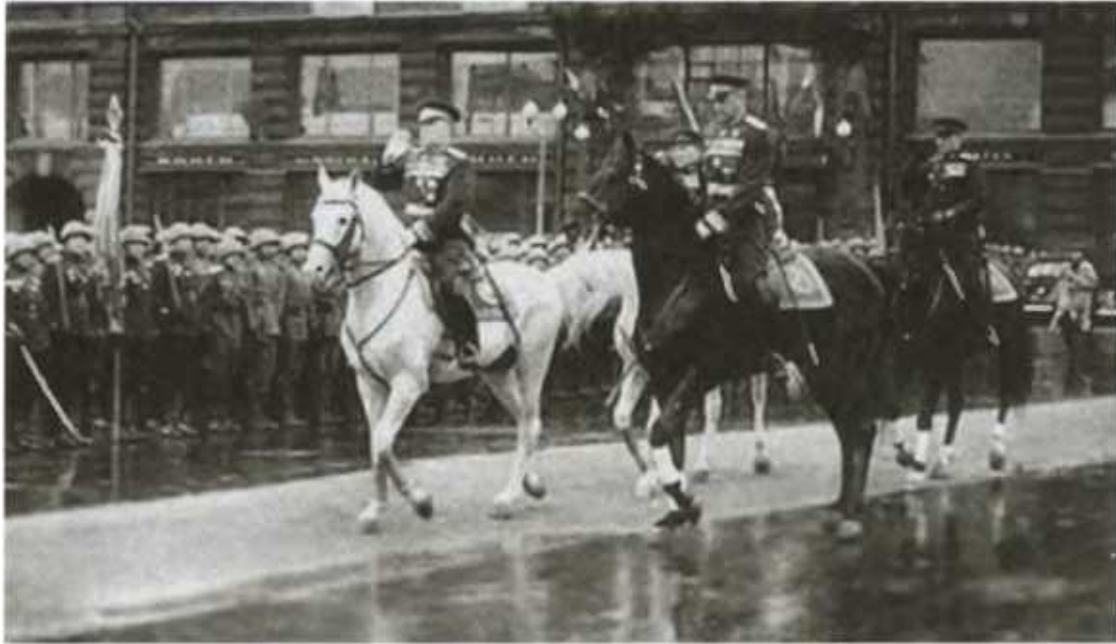
Маршалы Советского Союза Г. К. Жуков и К. К. Рокоссовский принимают Парад Победы. 24 июня 1945 г.