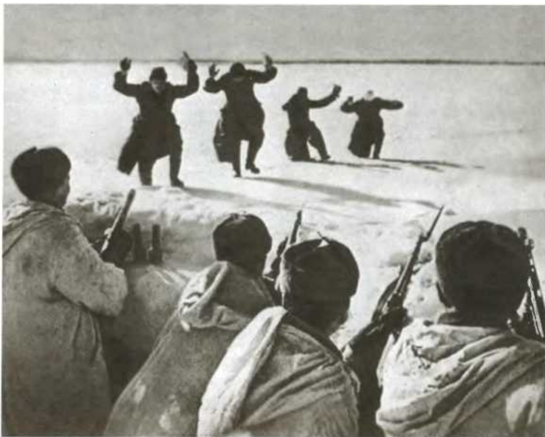
Они шли на Москву.