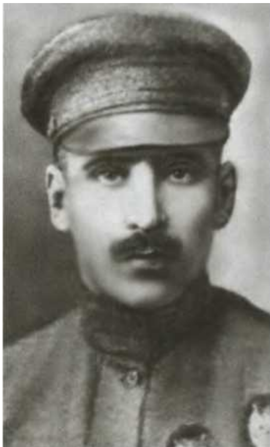
В. К. Блюхер.