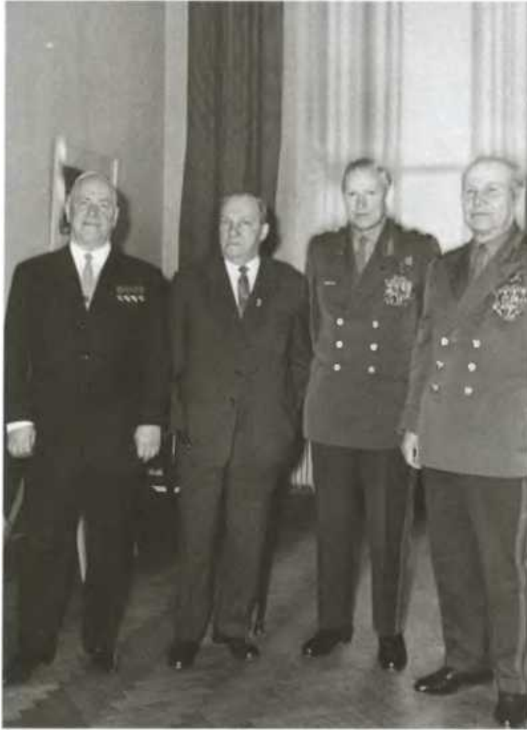
Г. К. Жуков, М. Ф. Лукин, К. К. Рокоссовский и И. С. Конев на премьере фильма о московской битве. Конец 1960-х гг.