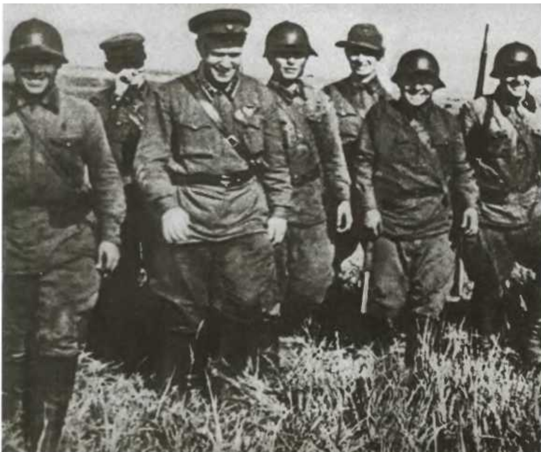
Г. К. Жуков среди бойцов Халхин-Гола.