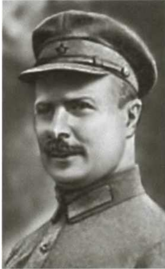
М. В. Фрунзе.