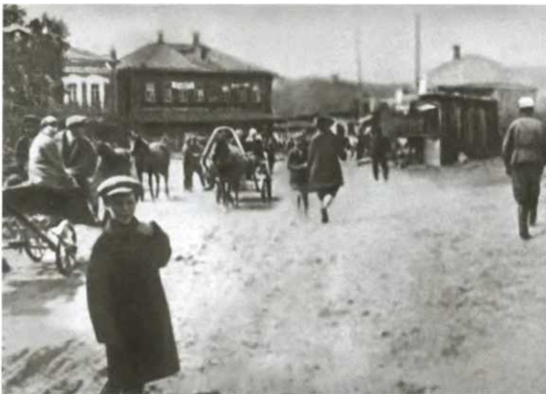
Село Угодский Завод, ныне Жуково.