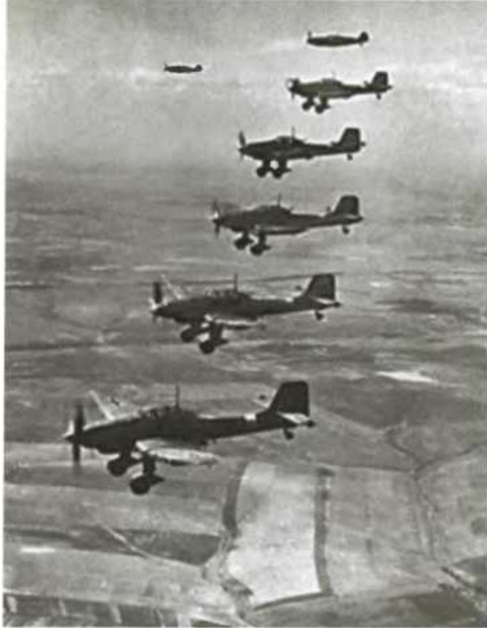
В небе Советского Союза самолёты фашистской Германии. 22 июня 1941 г.