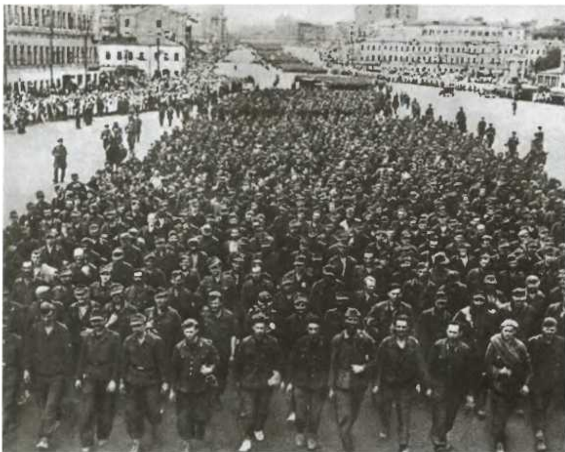
Пленные немцы на улицах Москвы.