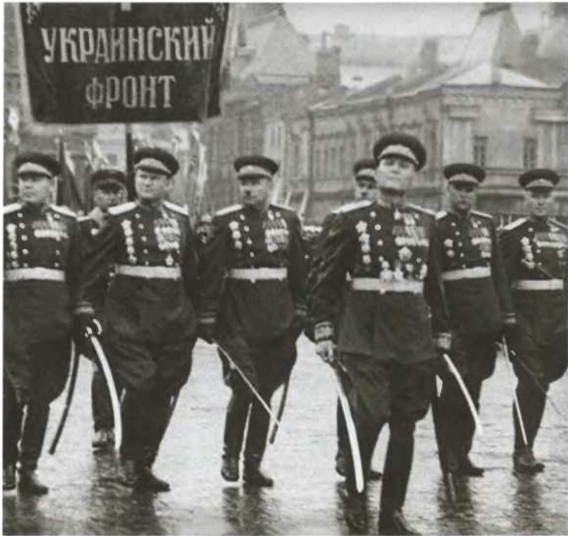
Маршал Советского Союза И. С. Конев на Параде Победы.