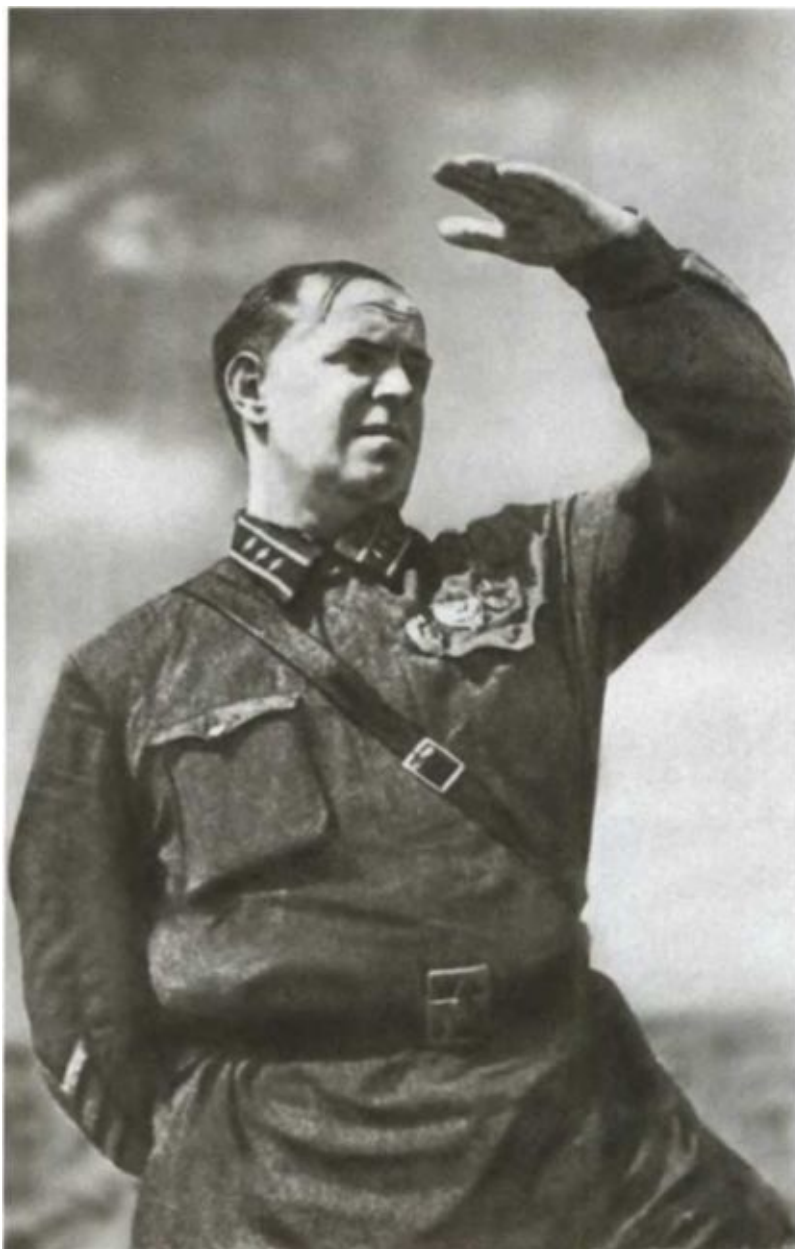
Комкор Г. К. Жуков.