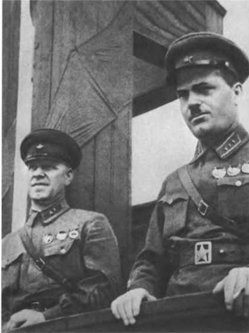
Комдив Г. К. Жуков и комкор М. П. Ковалёв.