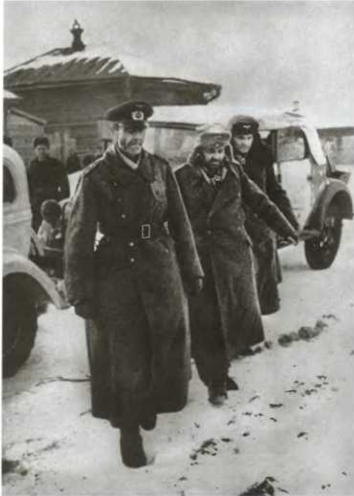
Пленённый в ходе Сталинградской битвы фельдмаршал Ф. Паулюс.