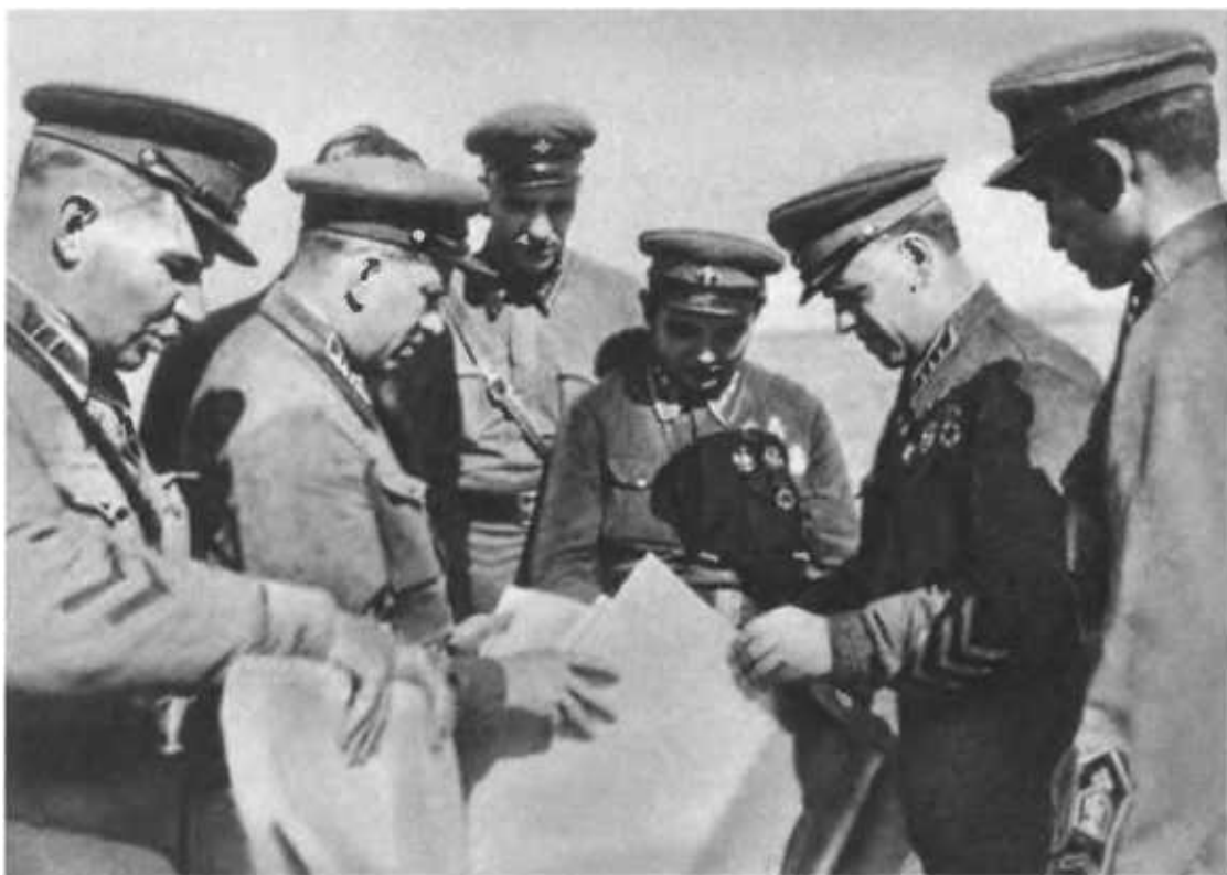
Г. К. Жуков среди командиров на Халхин-Голе.