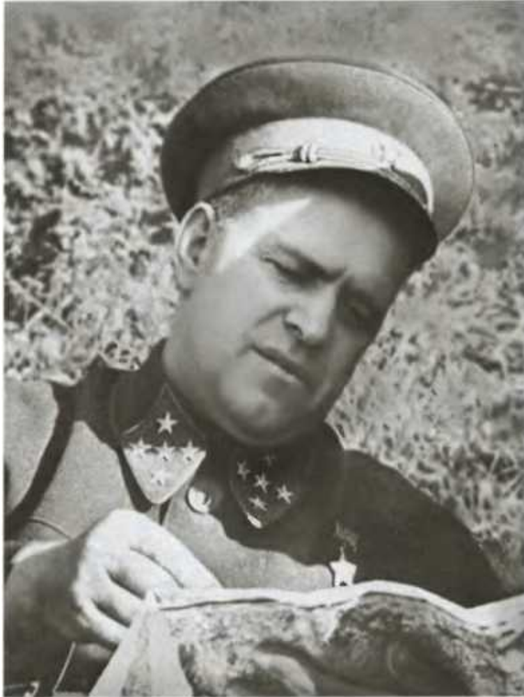
Генерал армии Г. К. Жуков в дни Сталинградской битвы.