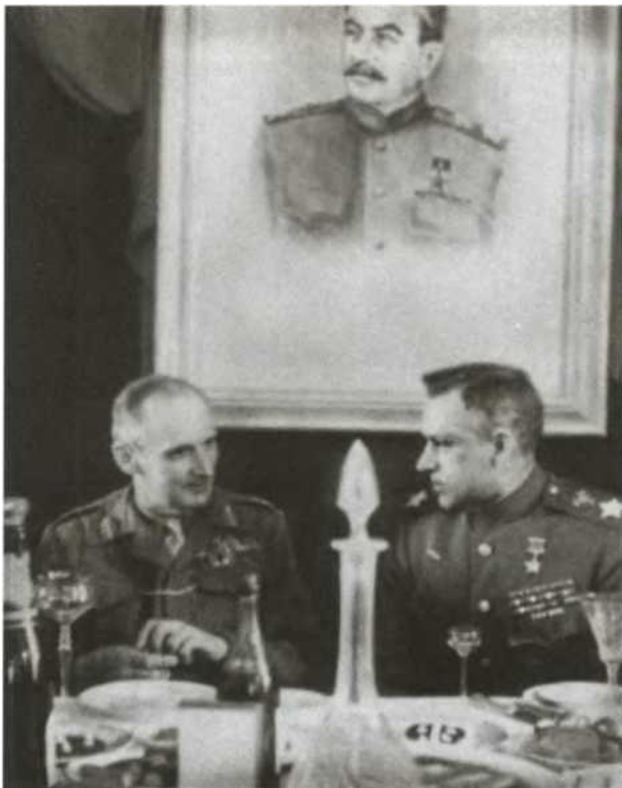
Встреча маршала К. К. Рокоссовского с британским фельдмаршалом Б. Монтгомери