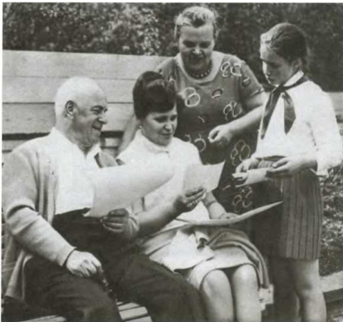
Жуков в кругу семьи.