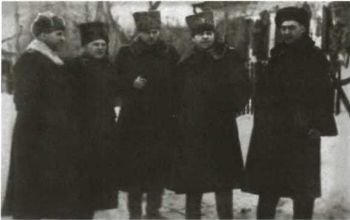
Центральный фронт. Слева направо: генерал-полковник войск связи И. Т. Пересыпкин, генерал-лейтенант К. Ф. Телегин, генерал-полковник К. К. Рокоссовский, Маршал Советского Союза А. М. Василевский и генерал-