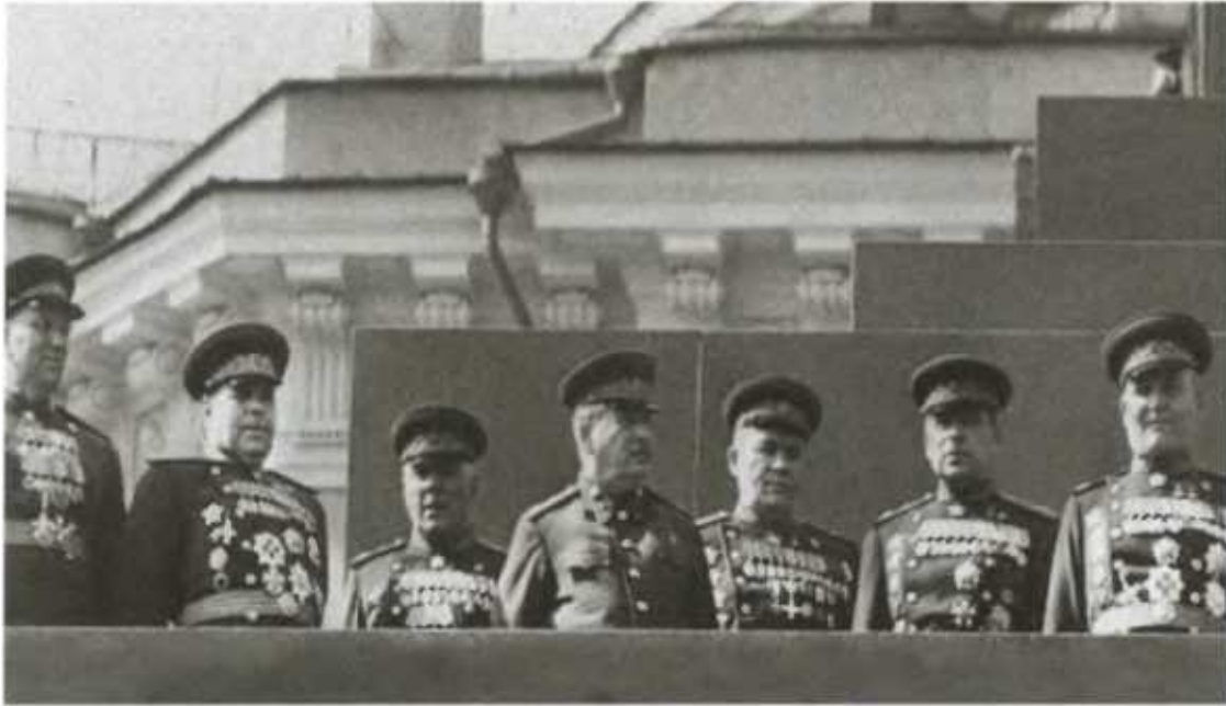
И. В. Сталин и маршалы Советского Союза на трибуне мавзолея.