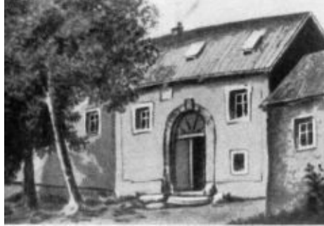
Дом, в котором родился Ян Гус, в Гусинце (до пожара).