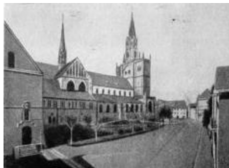
Вид констанцской соборной церкви снаружи. (Место сожжения книг Гуса 6 июля 1415 года).