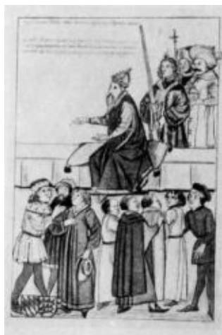
Император Сигизмунд на Констанцском соборе (из хроники Рихенталя).