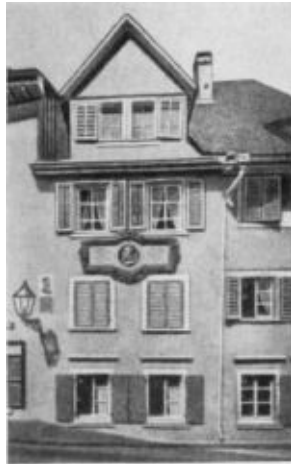
Жилище Гуса в Констанце.