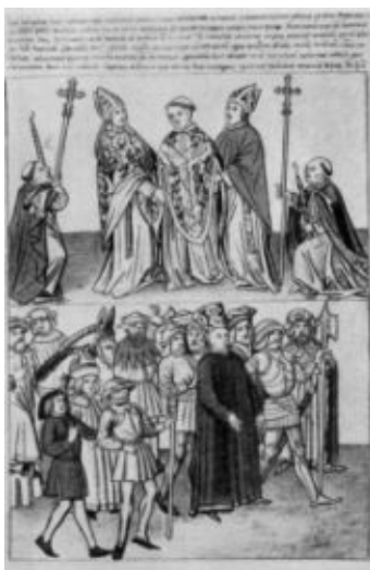
Ян Гус, везомый к месту казни (из хроники Рихенталя).

«Магистр Ян Гус, в уповании слуга Божий, всем верным чехам, кои любят и будут любить Господа Бога, шлет пожелание свое, дабы Господь Бог дал им в милости его жить и умереть и в радости небесной навеки пребывать. Аминь.