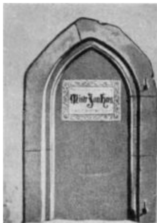
Портал жилища Гуса на Вифлеемской площади в Праге,

Следующий удар был направлен против ближайших друзей Гуса, против Станислава из Знойма и Палеча. В 1408 году, следуя в Рим с королевским посольством, они были арестованы в Болонье и заключены в тюрьму. Их обвинили в ереси; прошло немало времени, и потребовалось серьезное вмешательство пражского двора, прежде чем удалось спасти их жизнь. Когда они вернулись в Чехию, энергия старого Станислава оказалась подорванной, теперь это был сломленный человек, исполненный ужаса перед всемогуществом церкви. Штепан Палеч тоже пережил глубокое потрясение, хотя последствия его сказались не так скоро.