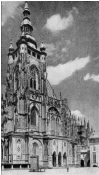
Собор св. Витта в Праге.

Недовольство и возмущение практикой церкви давно уже росли в городах и деревнях. И всегда напрашивалось сравнение между тем, что слово божье-: библия – требовало от христиан, и тем, как эти священные заветы исполнялись священниками, то есть теми самыми людьми, которые должны были быть руководителями и наставниками верующих. Так вновь и