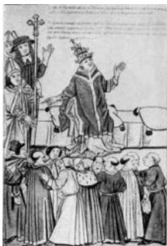
Папа Иоанн XXIII на Констанцском соборе (из хроники Рихенталя).

Ночью Гус был отведен во временную тюрьму, так как приготовленная для него темница в подземелье доминиканского монастыря еще не была оборудована крепкими цепями и запорами. Через неделю он был переведен туда и провел в ней самые страшные месяцы – до марта следующего года. Доминиканский монастырь был построен на маленьком острове у берега Боденского озера, и зимний холод проникал в камеру через окно и каменные стены вместе с тяжелым зловонием от расположенных поблизости отхожих мест. Неожиданный и крутой поворот судьбы, физические страдания, разлука с друзьями и с внешним миром вообще – все это угнетающе подействовало на Гуса. В этом нездоровом, промозглом