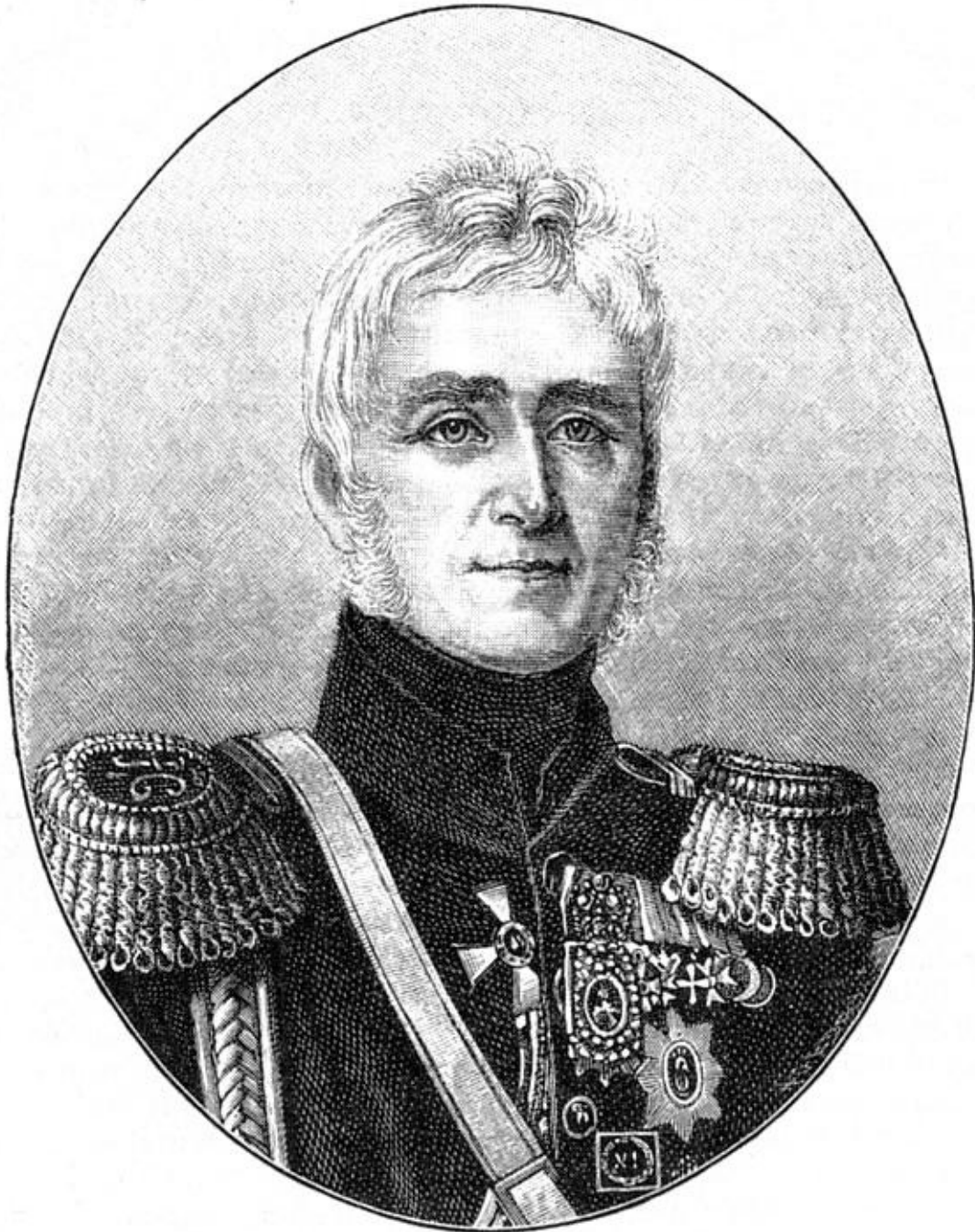
Генерал-фельдмаршал М.С. Воронцов