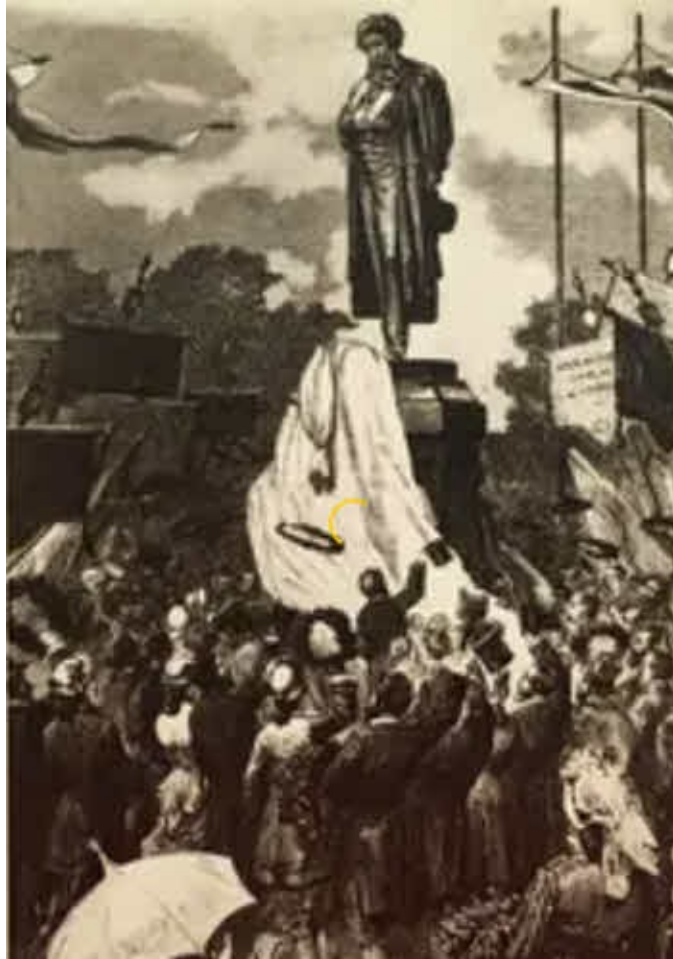
Открытие памятника Пушкину в Москве.