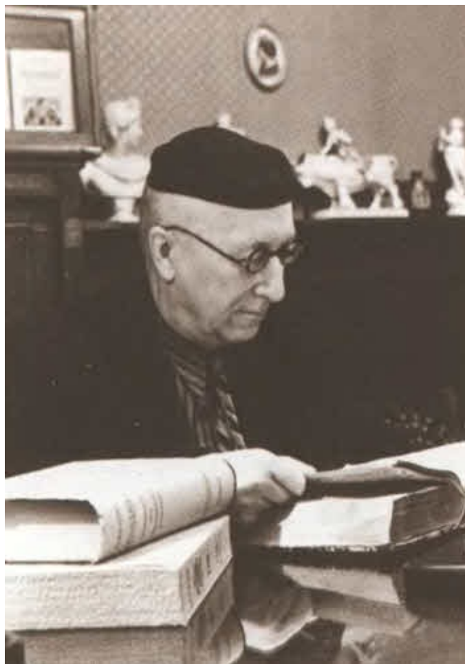
Алексей Лосев в своем рабочем кабинете на Старом Арбате.