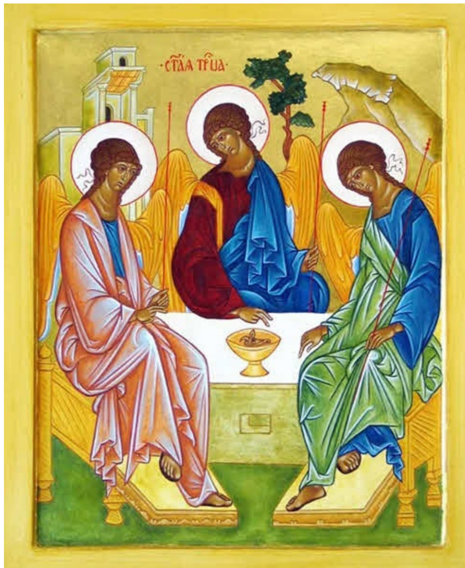
Андрей Рублев. Троица.