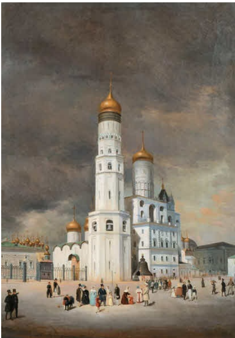
Ивановская площадь в Московском Кремле.