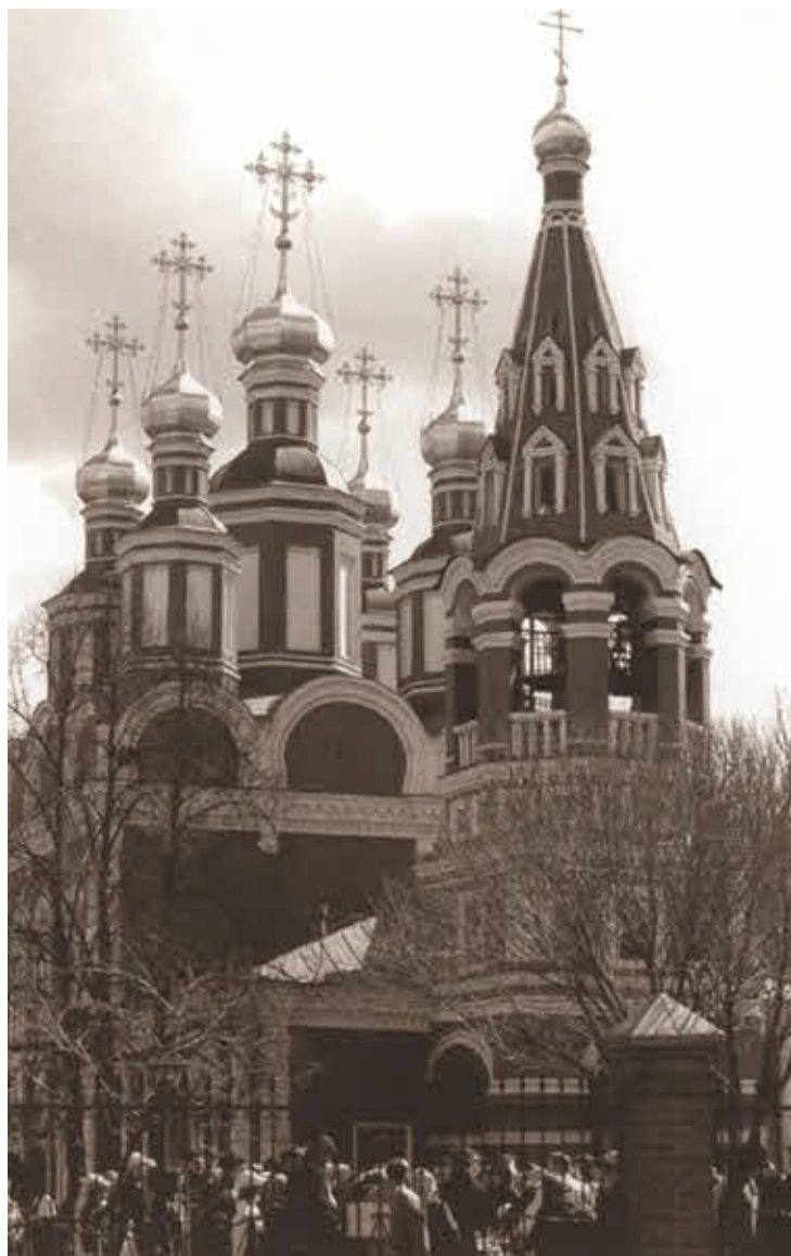
Церковь Михаила Архангела в Тропареве.