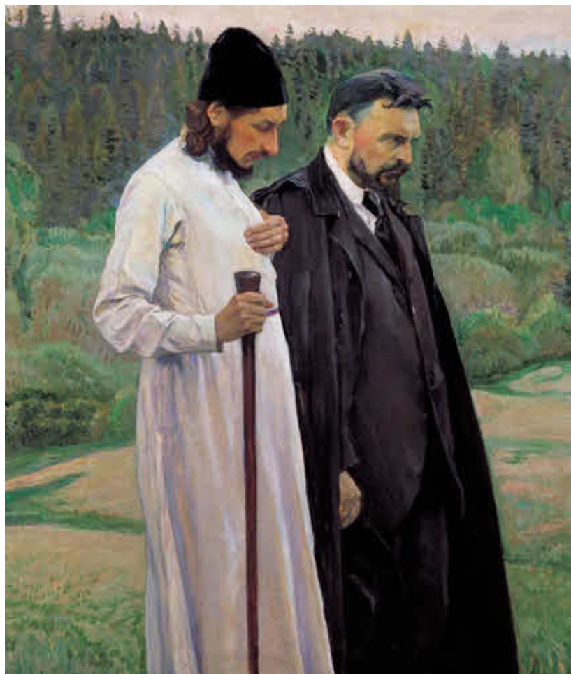
П. Флоренский и С. Булгаков. С картины М. Нестерова.