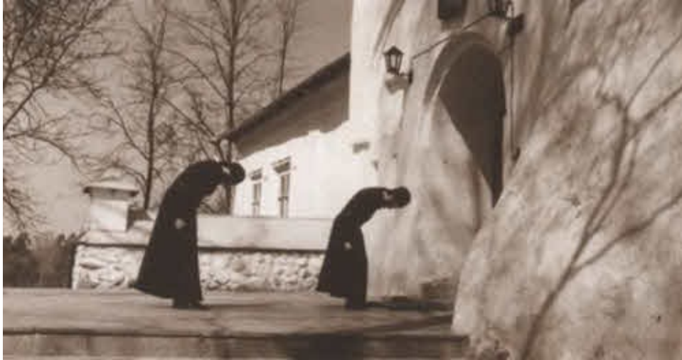
У стен Святогорского монастыря.