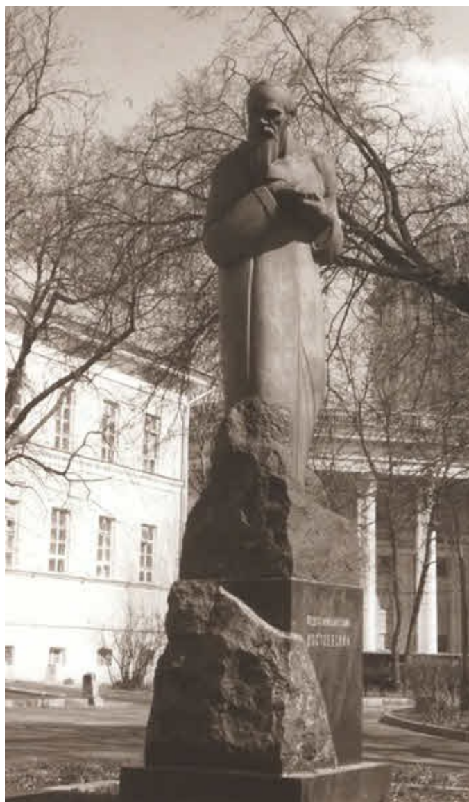
Памятник Федору Достоевскому.

Скульптор С. Меркуров.