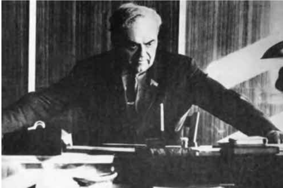
В рабочем кабинете