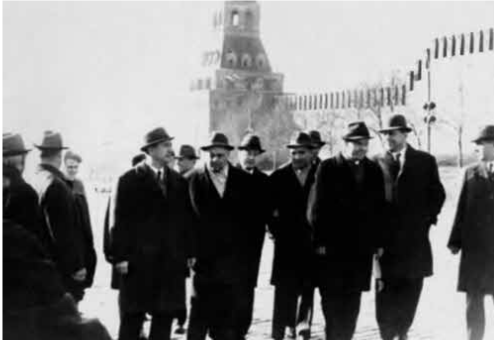
Участники съезда на Красной площади