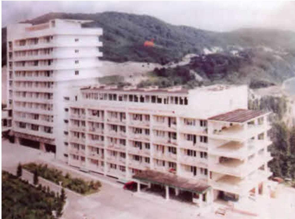
Пансионат «Нефтяник Сибири»