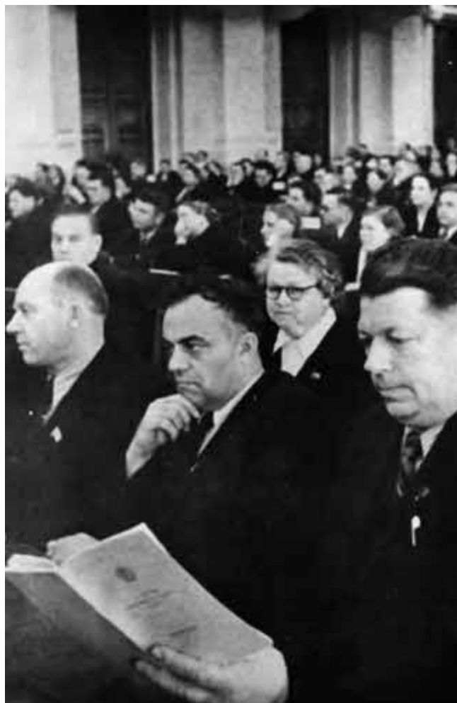
На заседании Верховного Совета РСФСР. 1965 г.