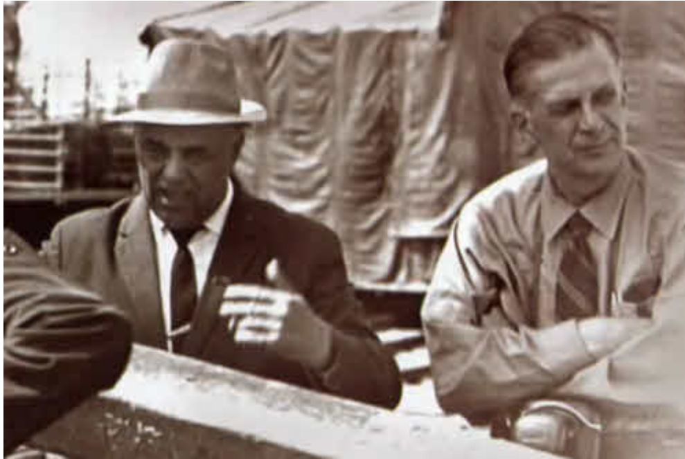
Обсуждение проблем бурения