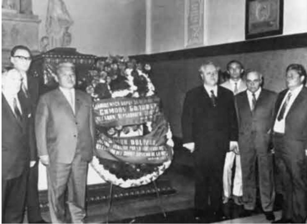
У могилы легендарного борца за независимость Латинской Америки Симона Боливара. 1972 г.