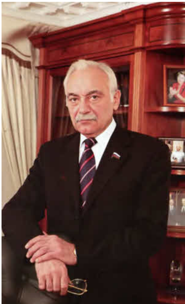
Депутат Государственной думы С. В. Муравленко