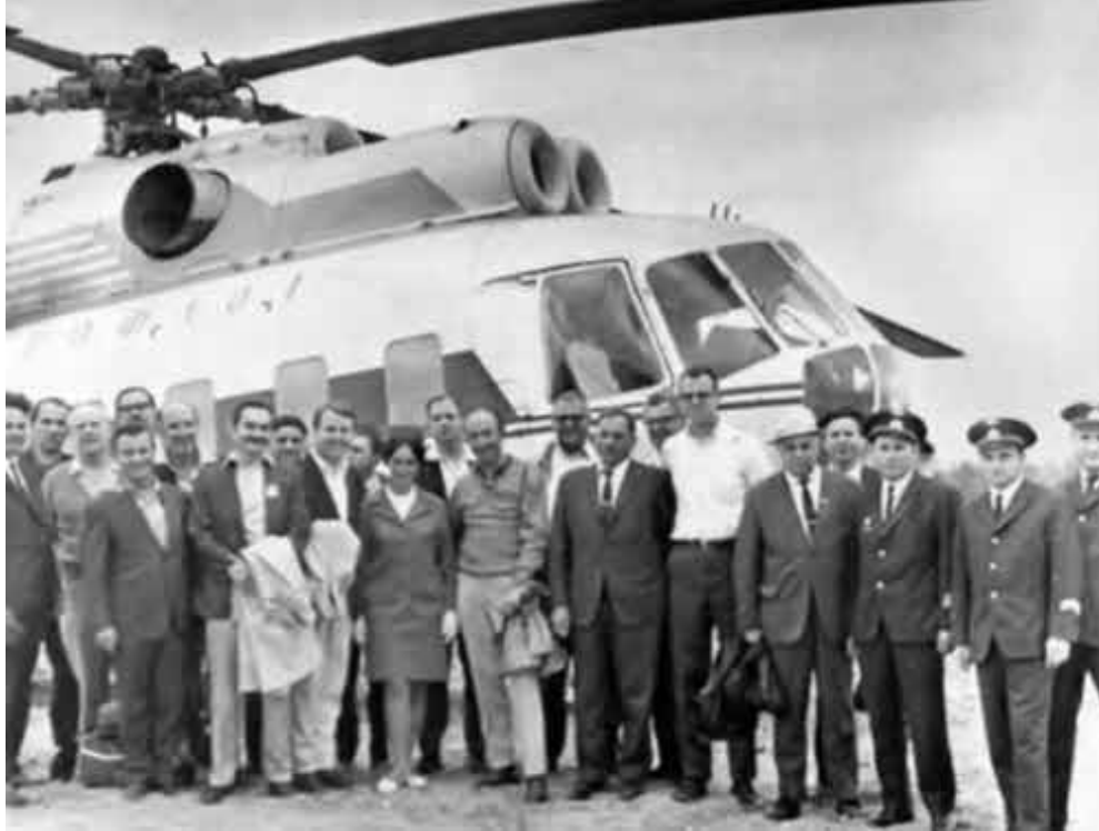
С делегацией из США в Западной Сибири