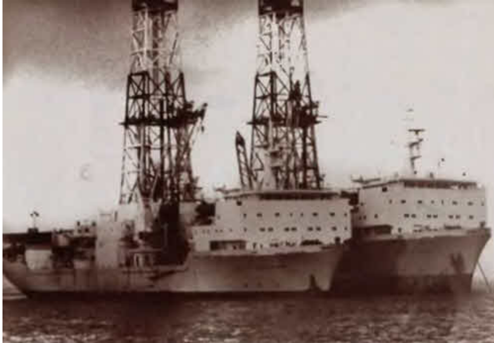
Плавучая буровая установка имени В. И. Муравленко