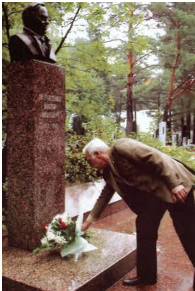
Отец и сын