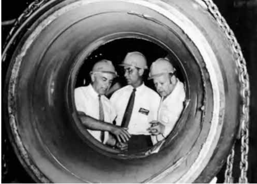
Американские специалисты в Тюмени на заводе «Нефтемаш»