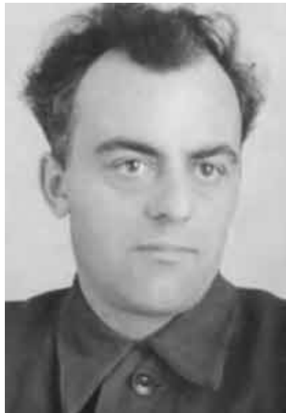
В. И. Муравленко в период работы на Сахалине. 1940-е гг.