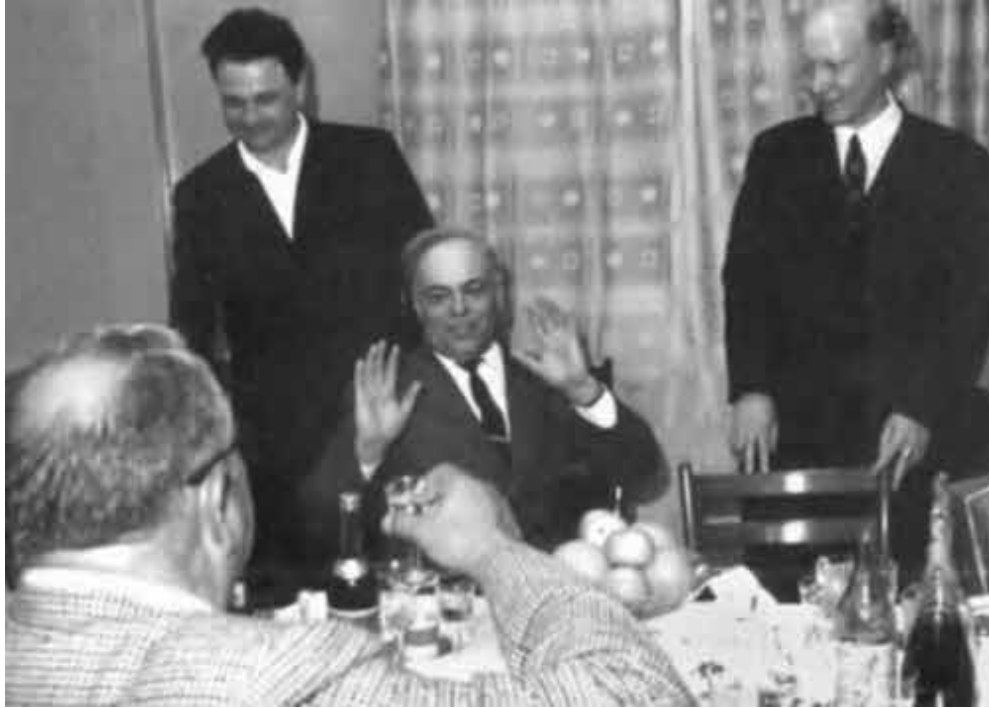
На дружеском ужине с зарубежными друзьями