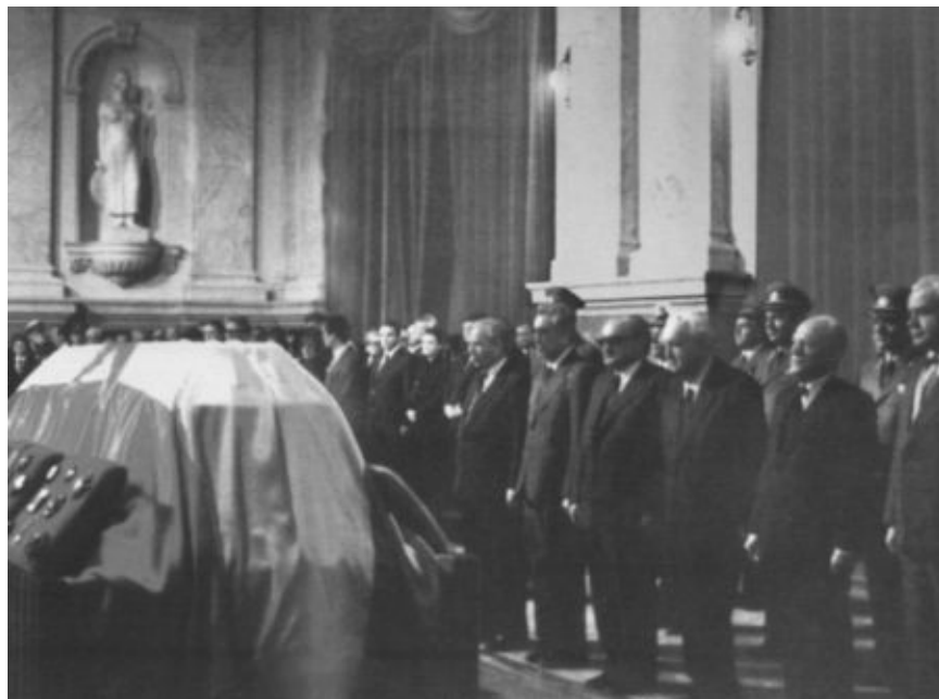
Прощание с Тито