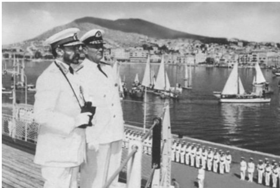
Тито и царь Эфиопии Хайле Селассие