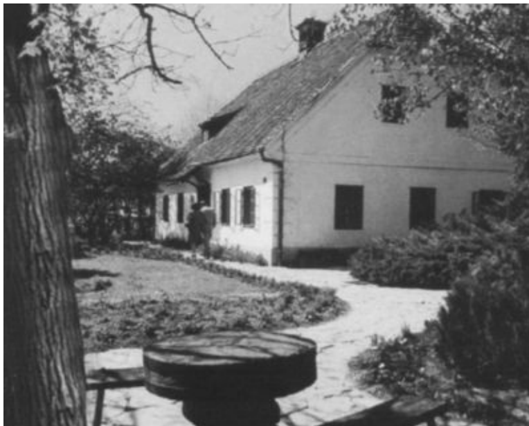
Дом в селе Кумровац, в котором родился Иосип Броз