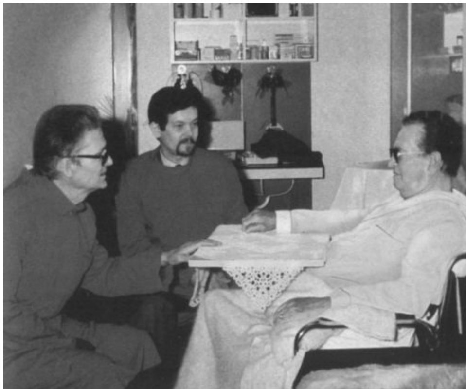
Одна из последних фотографий. После ампутации ноги Тито в больнице навещают его сыновья Жарко и Мишо. Февраль 1980 г.