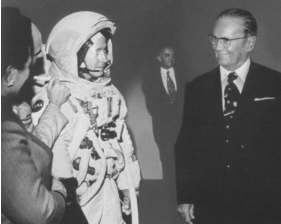
Тито в центре подготовки американских астронавтов