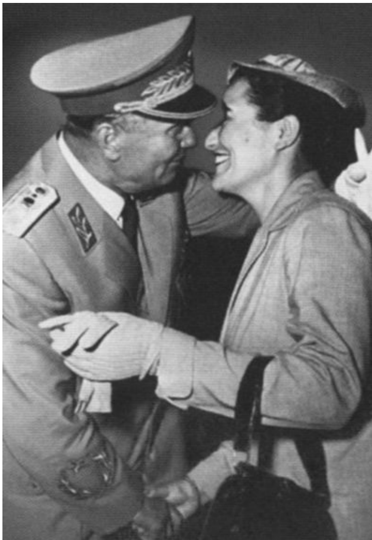
Тито и Јованка