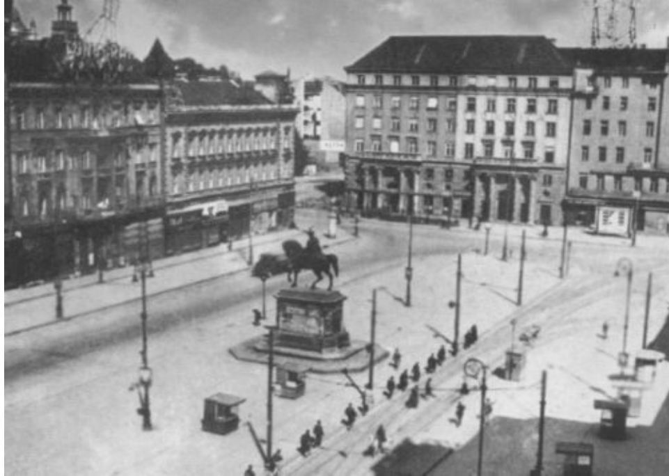
Партизаны вступают в Загреб. Май 1945 г.