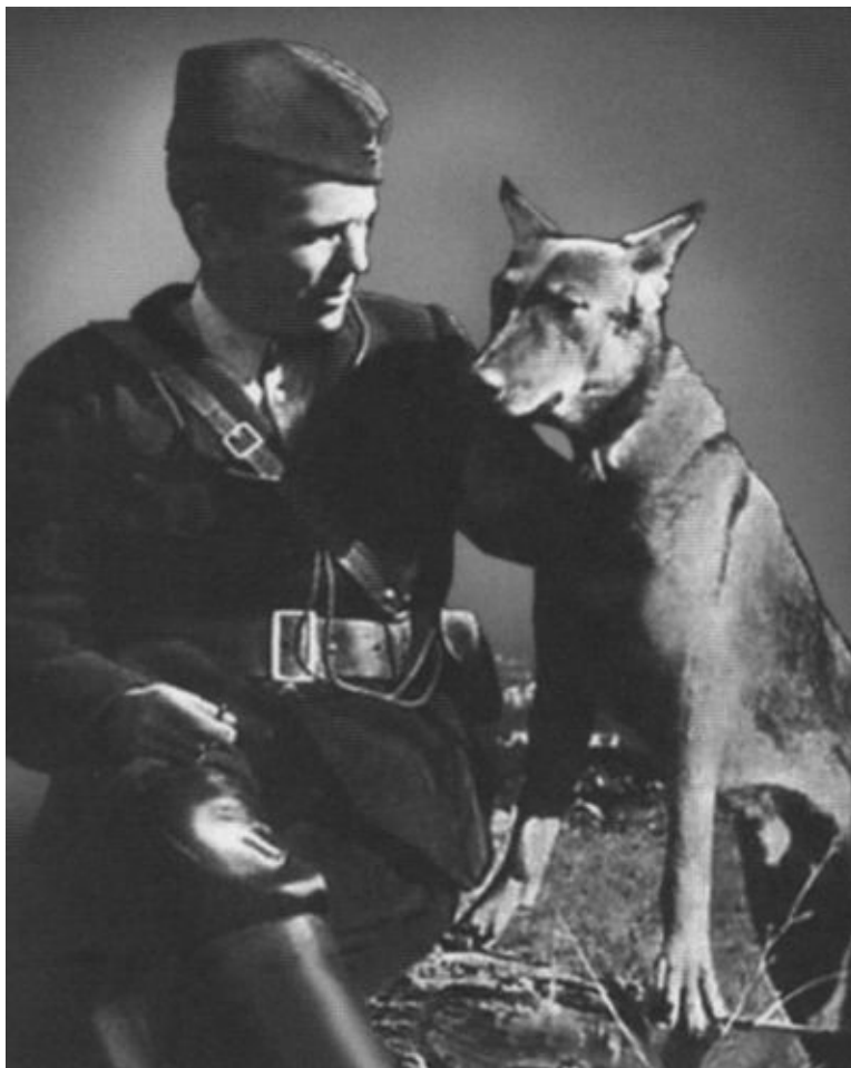
Тито и овчарка Люкс. 1942 г.