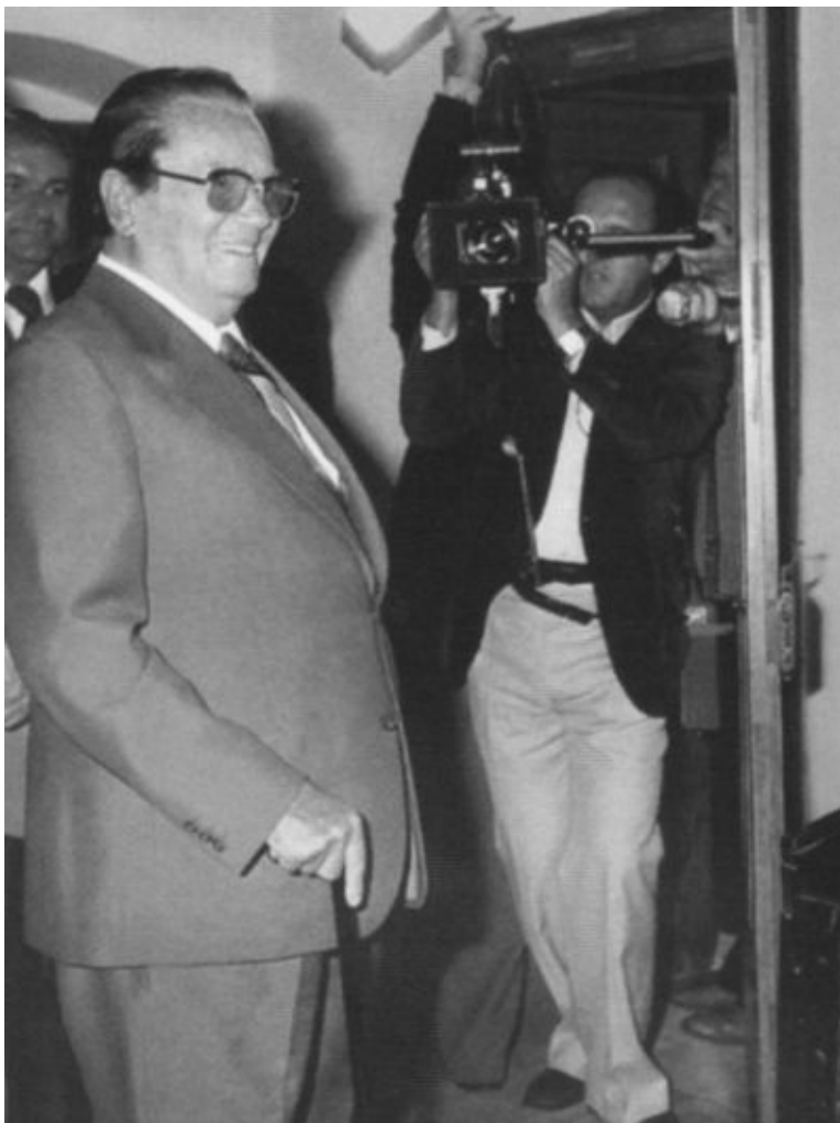
Тито посещает свой дом в селе Кумровац