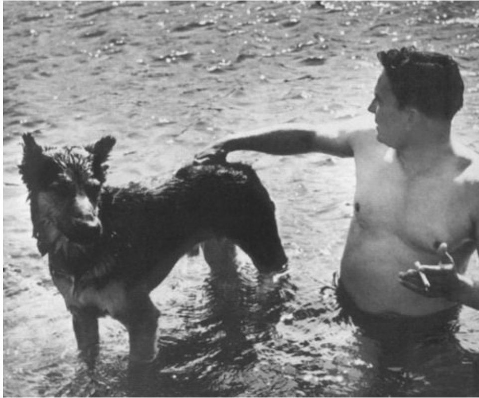
Тито и овчарка Тигр. 1944 г.