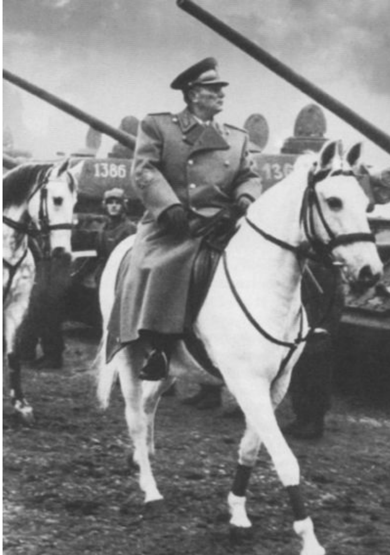
Tumo. 1945 г.