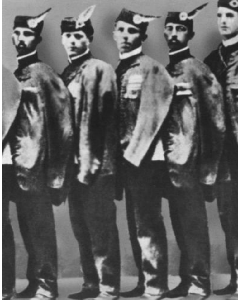
Иосип Броз (первый слева) в форме члена клуба «Соколы» 1911 г.