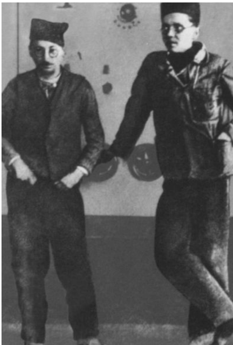
Иосип Броз (слева) и Моше Пьяде в тюрьме Лепоглава.1929 г.