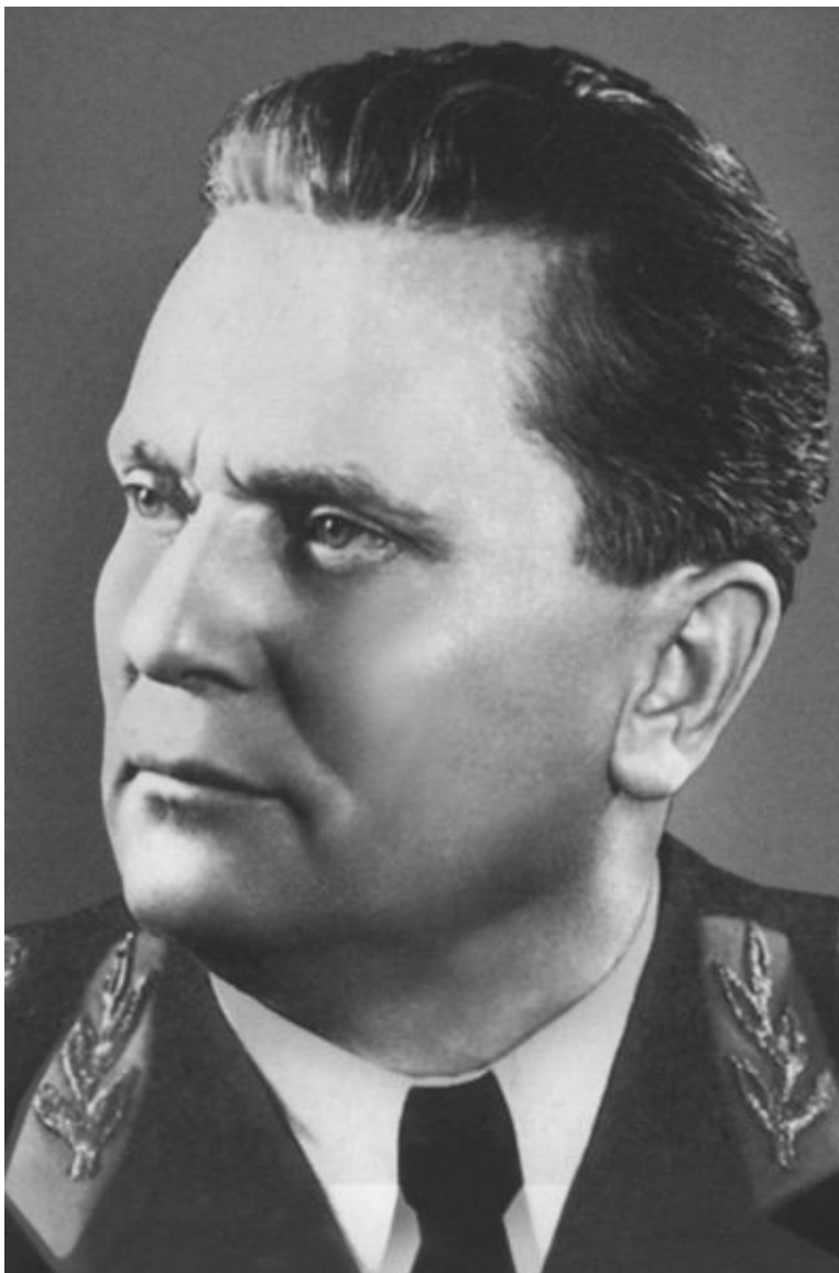
Одна из официальных фотографий. 1949 г.