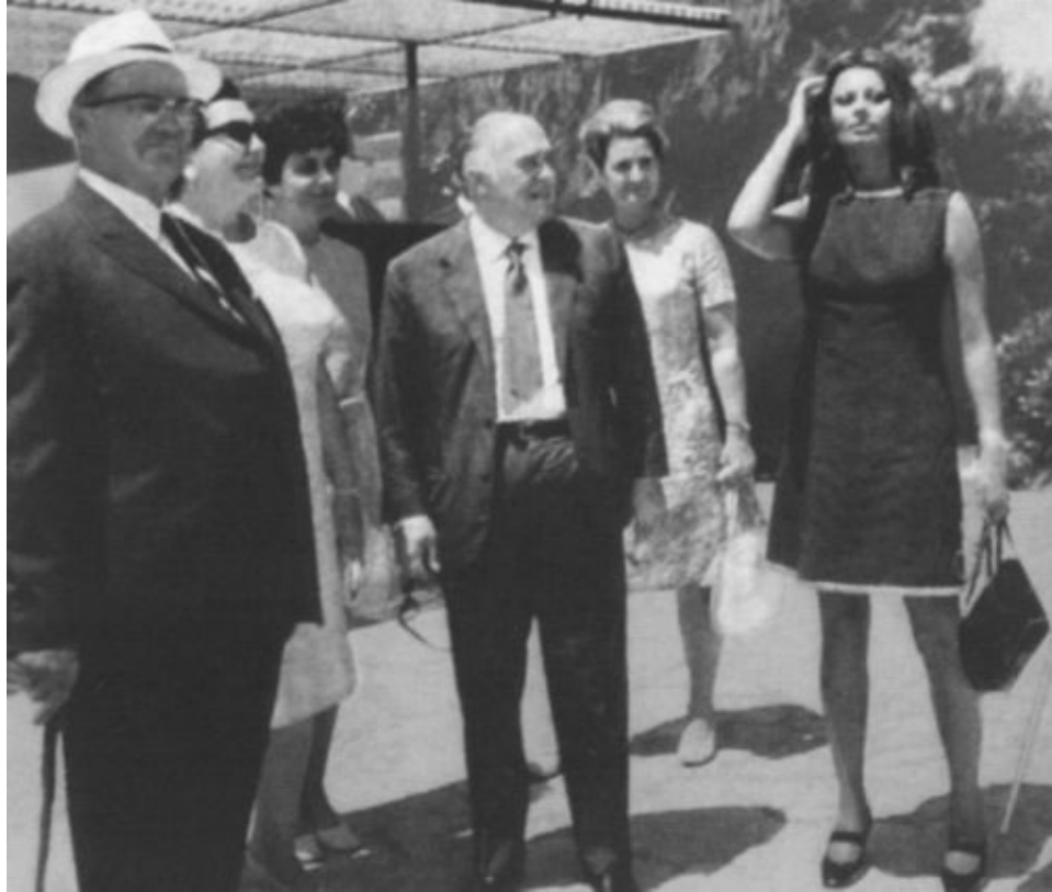
Тито и Йованка Броз принимают в резиденции на Бриони Софи Лорен и Карло Понти