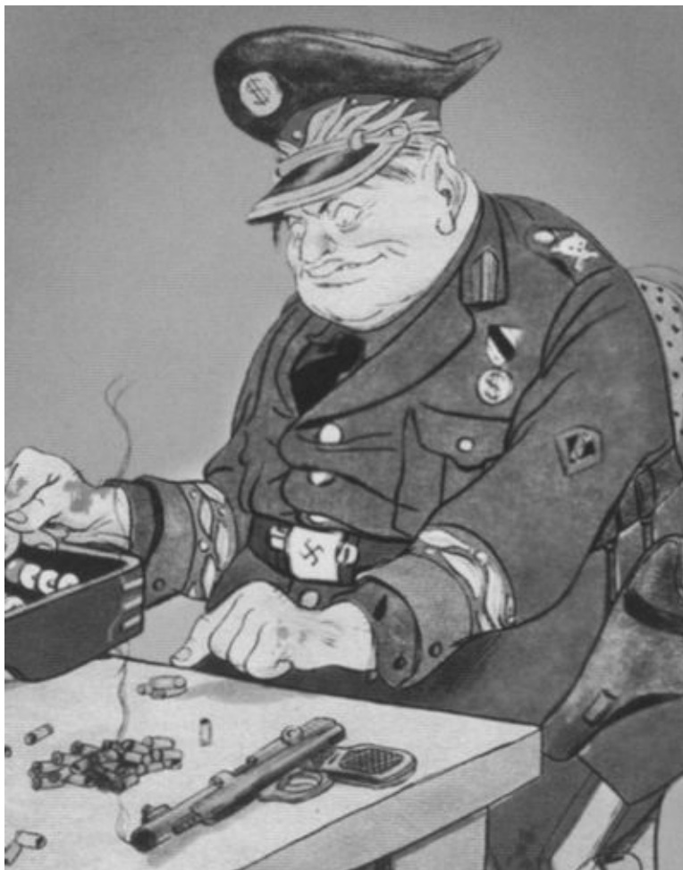
Одна из советских карикатур на «кровавого палача Тито». 1952 г.