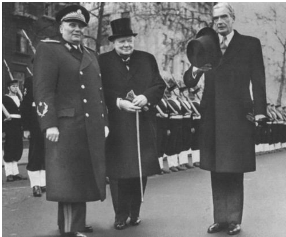
Тито, Черчилль и глава британского МИДа Иден. Лондон, март 1953 г.