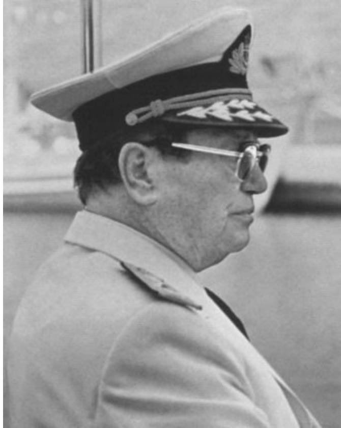
Јосип Броз Тито. 1979 г.