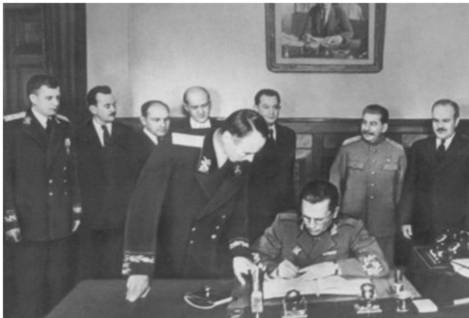
Тито подписывает Договор о дружбе, взаимной помощи и послевоенном сотрудничестве между СССР и Югославией. Москва, 11 апреля 1945 г.