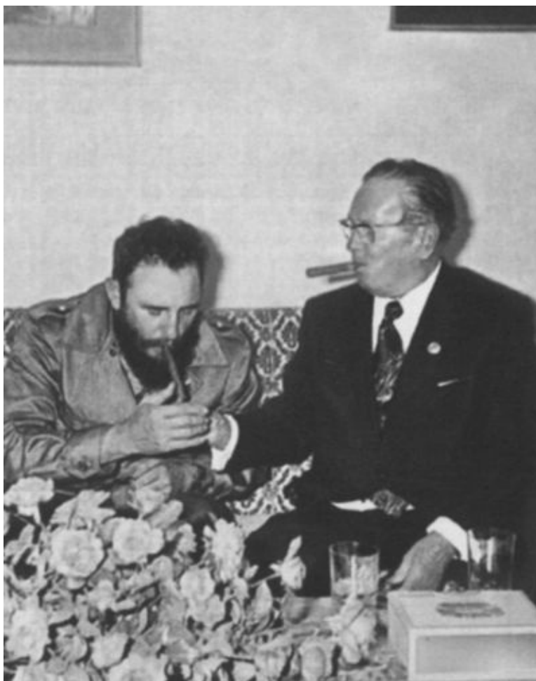
Тито, Фидель Кастро и гаванские сигары