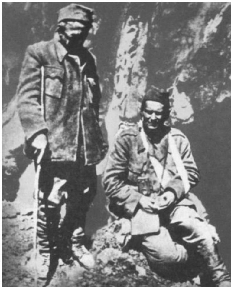
Тито (справа) после ранения в битве на реке Сутьеске. 1943 г.