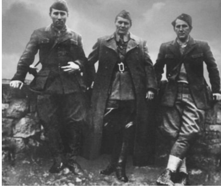
Тито (в центре) с Александром Ранковичем (слева) и Милованом Джиласом.1943 г.