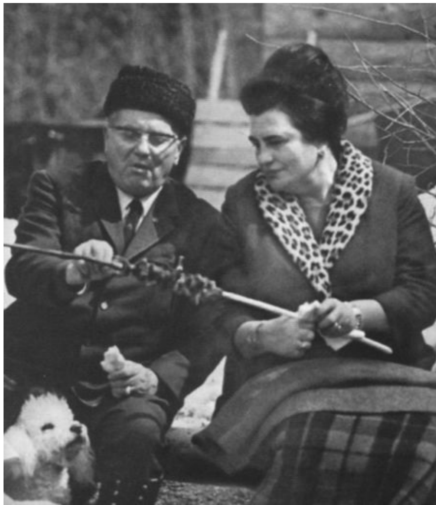
Тито и Йованка еще вместе. На отдыхе с одним из своих пуделей и шашлыками