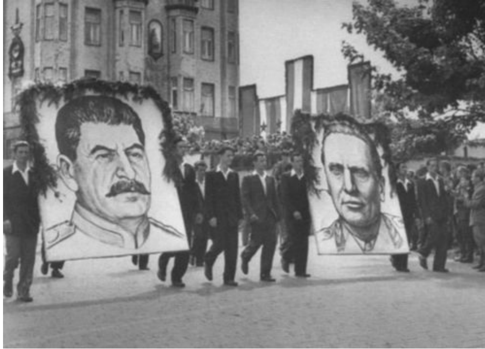
Первомайская демонстрация в Белграде. 1946 г.