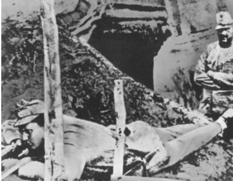
Иосип Броз на службе в австро-венгерской армии. По некоторым данным, снимок сделан на сербском фронте в 1914 году