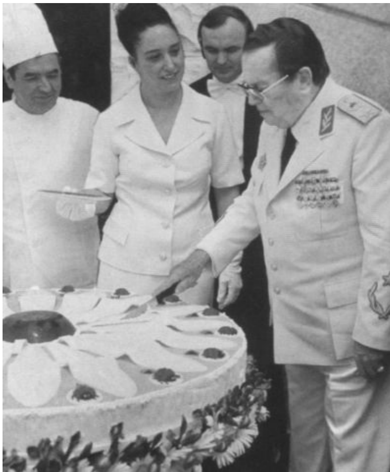
Торт для «любимого маршала»: Тито в последний раз отмечает свой день рождения. Май 1979 г.