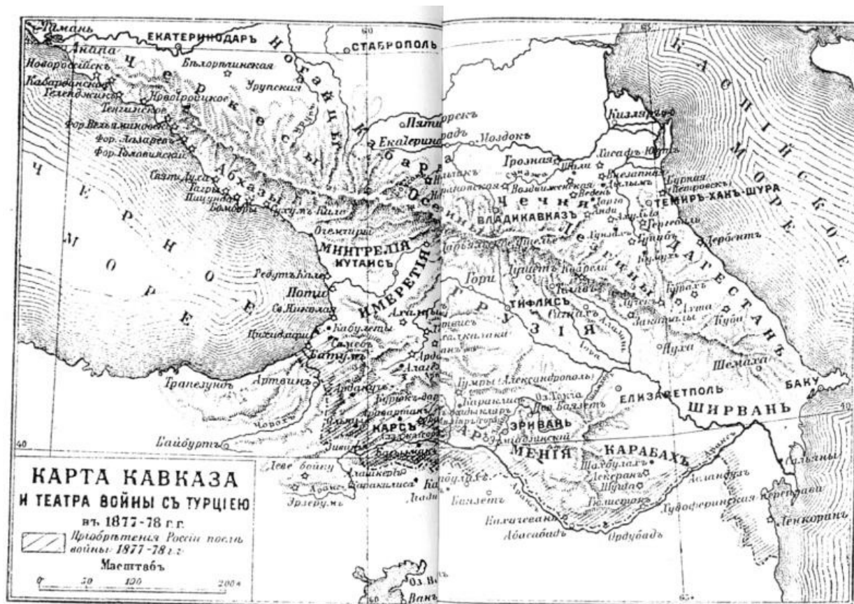
Карта Кавказа и театра войны с Турцией в 1877-78 гг.