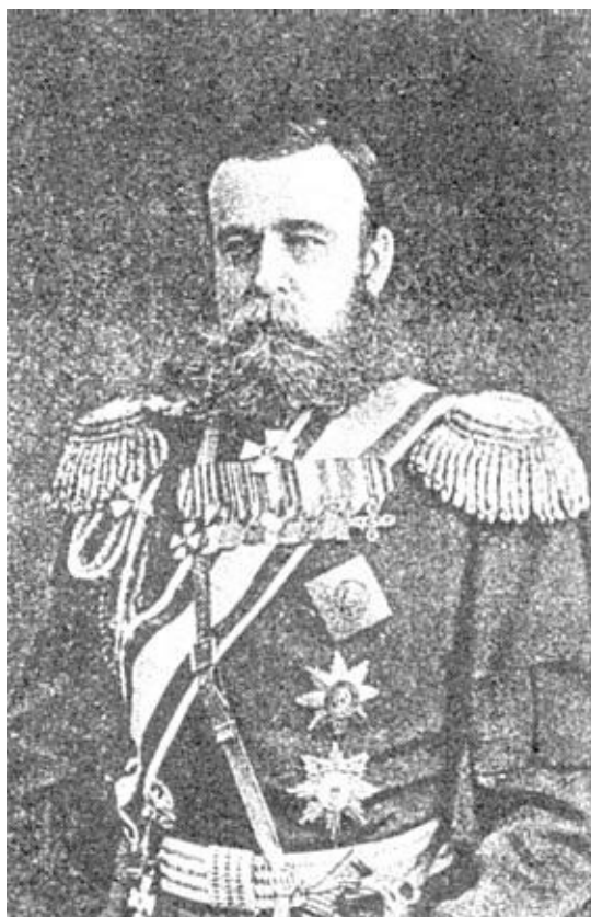
М. Д. Скобелев