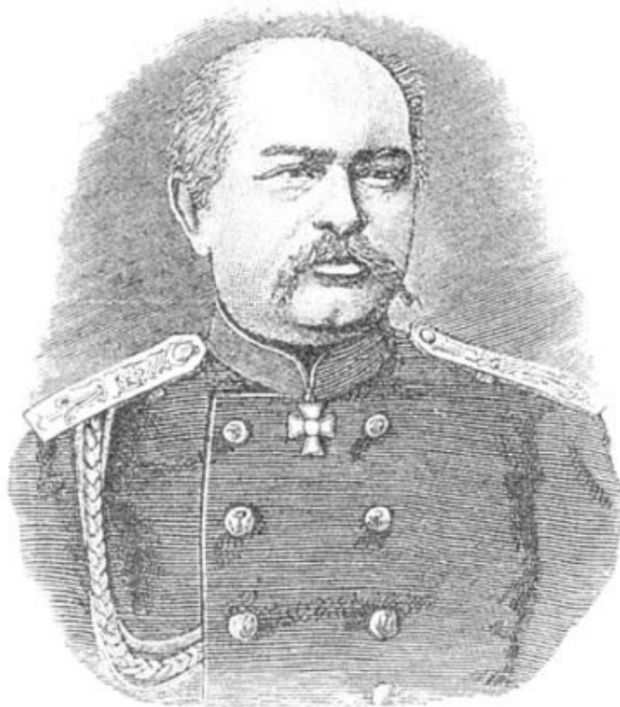
Свиты Его Величества генерал-майор Михаил Иванович Драгомиров

12 апреля 1877 года была объявлена война, и в тот же день наши войска перешли границу. 10 июня произошла переправа через Дунай. 15 числа авангард перешел через Дунай против Зимницы и после упорного боя овладел высотами противоположного берега и городом Снеговом. При этой переправе Скобелев ограничился более чем скромной ролью охотника, или, если угодно, добровольца. Для него, уже отличившегося в целом ряде серьезных битв в Средней Азии, не нашлось подходящей должности в армии. Оставалось одно: самому себя назначить, и Скобелев сам себя произвел в ординарцы М. И. Драгомирова.