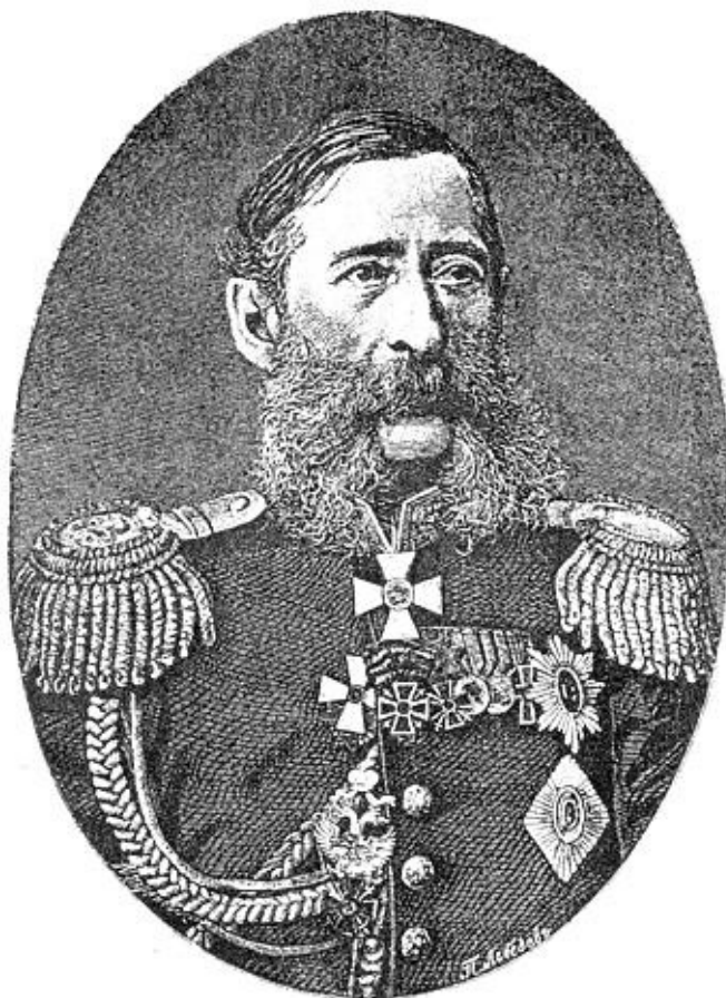
М. Т. Лорис-Меликов

По поводу контузий, полученных Скобелевым, Дукмасов сообщает любопытные подробности относительно суеверия Скобелева, его известного пристрастия к белому цвету и антипатии к черному. Раз при обходе траншей Скобелев обратился к офицерам: