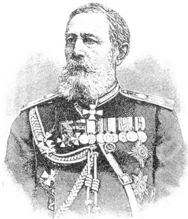
Генерал-адъютант Ф. Ф. Радецкий

23 декабря Скобелев, снесшись с Радецким, движется на селение Шипку. Инициатива атаки с фланга и с тыла была вполне предоставлена Скобелеву. Одновременно с его отрядом выступил и Святополк-Мирский; путь его был значительно легче, а потому он опередил Скобелева.