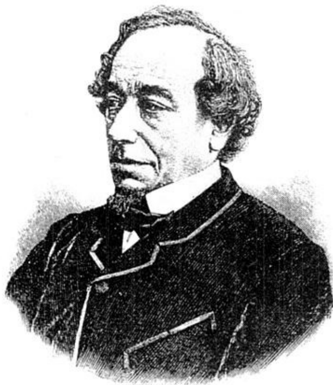
Бенджамин Дизраэли, лорд Биконсфильд