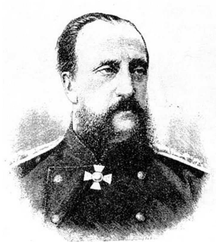
Великий князь Николай Николаевич

Вторая контузия в спину была значительно серьезнее. Когда Скобелев лежал больной в болгарской хате, трудно было удержать посетителей, ежеминутно его навещавших. Несмотря на сильные страдания, Скобелев все время шутил, полусерьезно обвиняя во всем зловещий полушубок. В числе посетителей были и великий князь, главнокомандующий, и отец Скобелева.