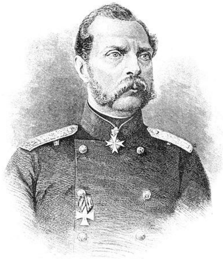
Александр II, император Всероссийский

По несчастью, главная атака была направлена как раз против Скобелева.