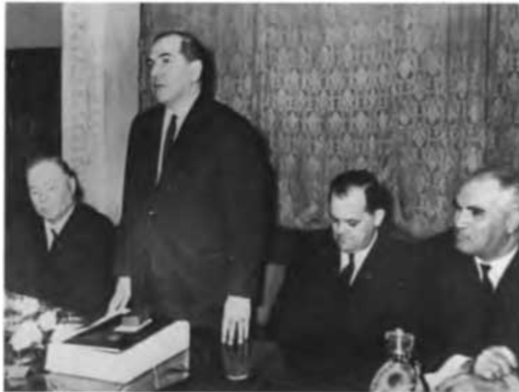
Коллеги поздравляют с юбилеем министра газовой промышленности СССР Алексея Кирилловича Кортунова. 1967 г.