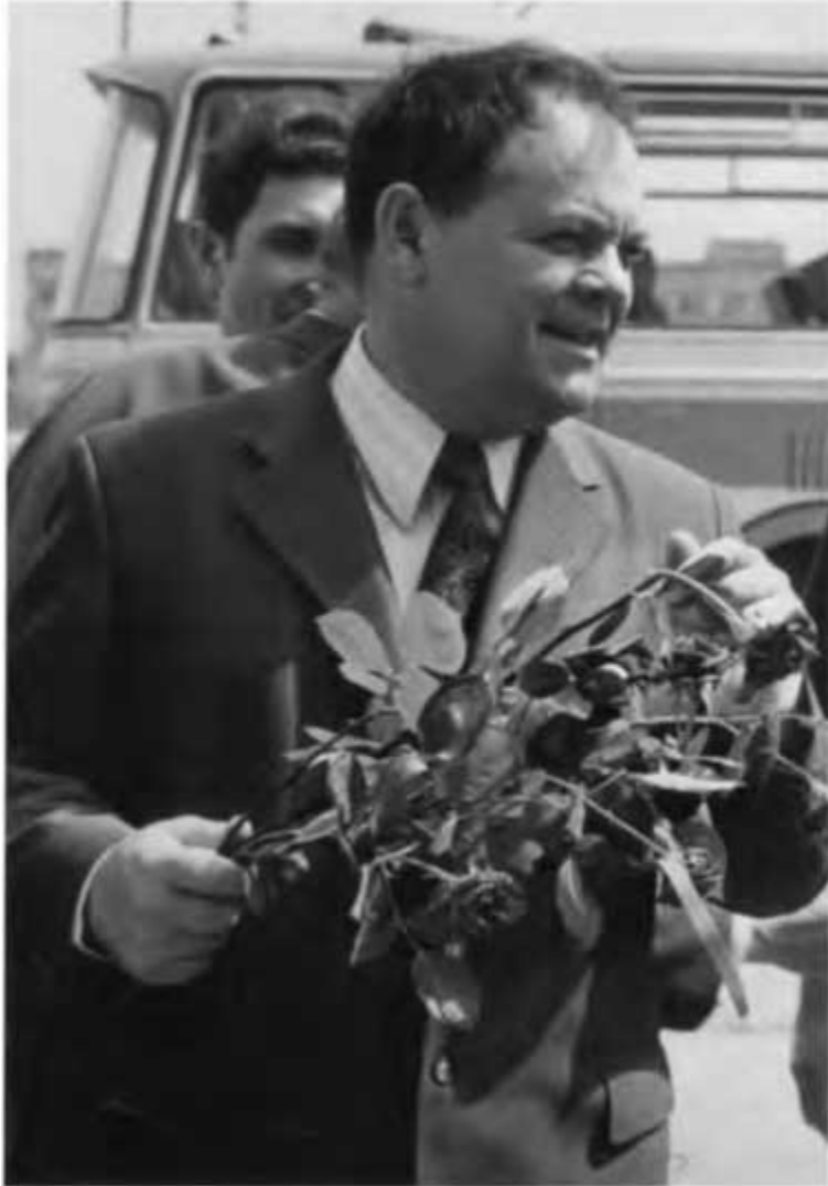
Б. Е. Щербина в Польше. 1982 г.