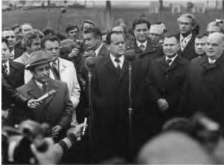
Вступает в строй очередной участок газопровода «Союз». 1977 г.