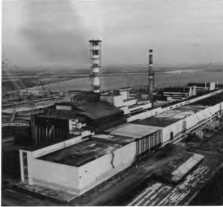
На заседании Правительственной комиссии. Припять, 1986 г.