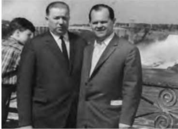
Б. Е. Щербина и первый секретарь Иркутского обкома КПСС С. Н. Щетинин в Канаде. Ниагара, 1959 г.