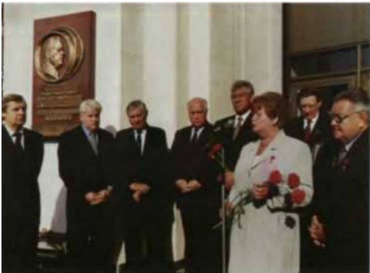
На здании Миннефтегазстроя СССР открывается мемориальная доска Борису Евдокимовичу Щербине. 1999 г.