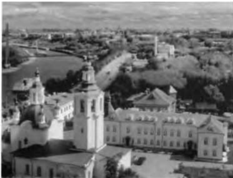
Тюмень. 1961 г.