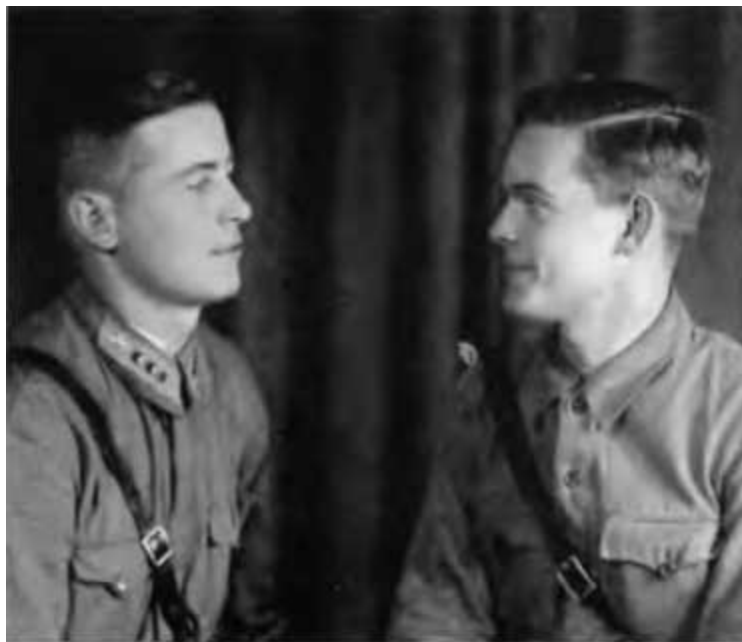
Последний снимок с братом. 1942 г.