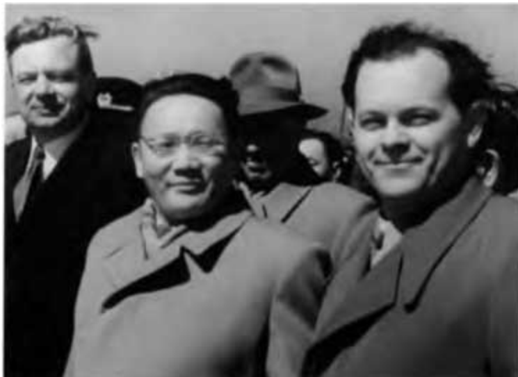
...и председатель Совета министров МНР Ю. Цеденбал. 1959 г.