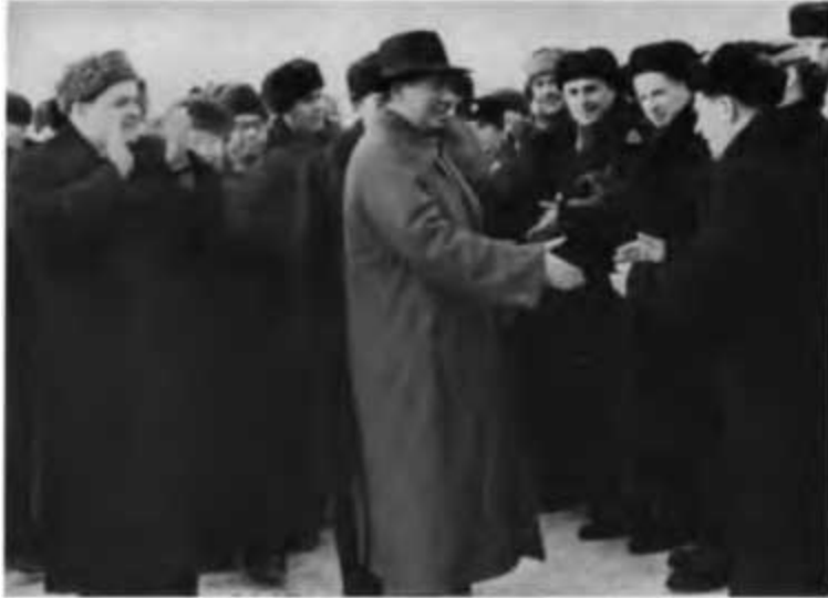
Сибиряки встречают председателя ЦК компартии Китая Мао Цзэдуна...