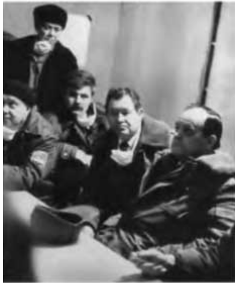
Чернобыльская АЭС. Саркофаг над четвертым реактором.