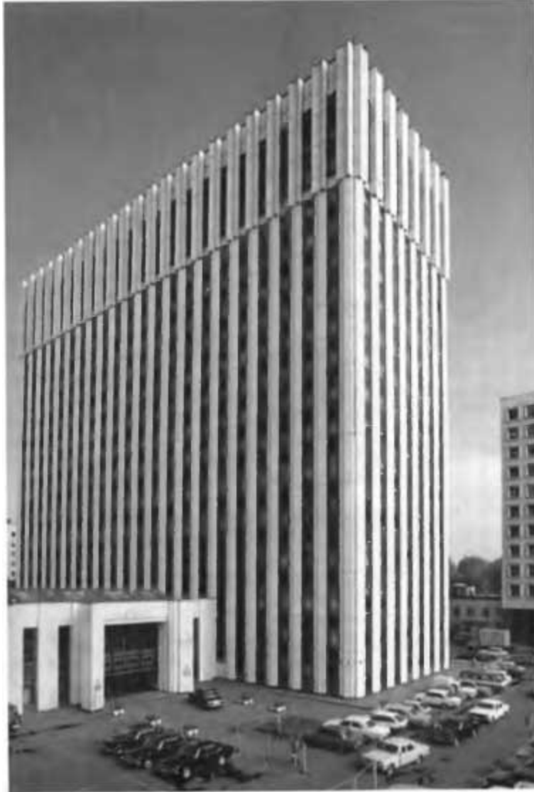
Министерство строительства предприятий нефтяной и газовой промышленности СССР. Москва, ул. Житная, 14