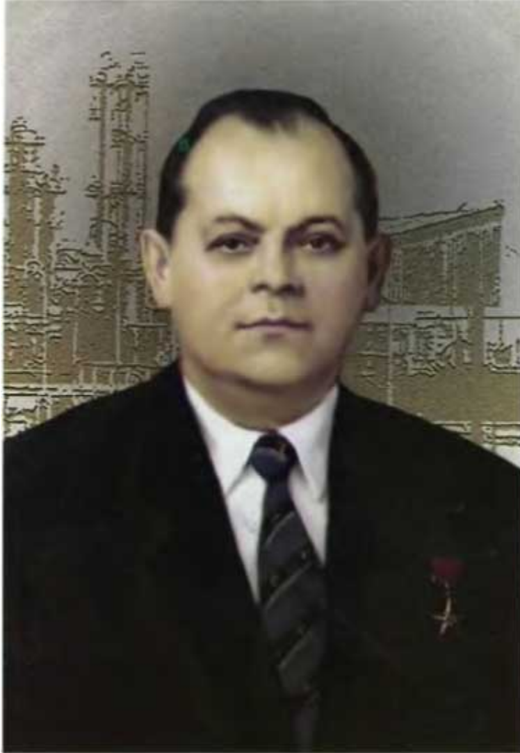
Заместитель Председателя Совета Министров СССР Б. Е. Щербина. 1985 г.