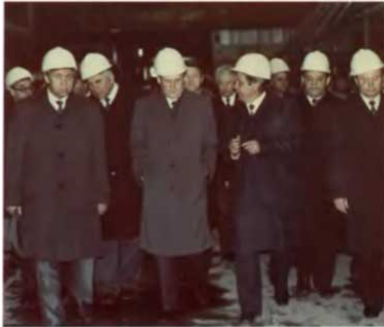
Деловой визит на завод блочных устройств Миннефтегазстроя СССР. Тюмень, 1988 г.