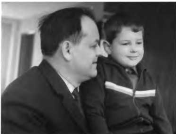
В минуты отдыха с внуком Борей. Успенское, 1970 г.