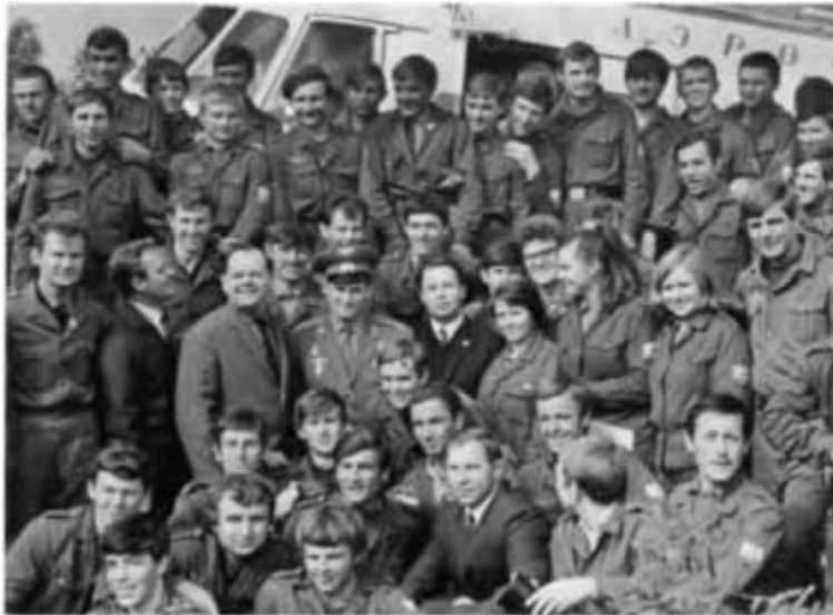
Первый секретарь обкома партии Б. Е. Щербина и первый секретарь ЦК ВЛКСМ Е. М. Тяжельников среди бойцов студенческого строительного отряда. Тюменская область, 1969 г.