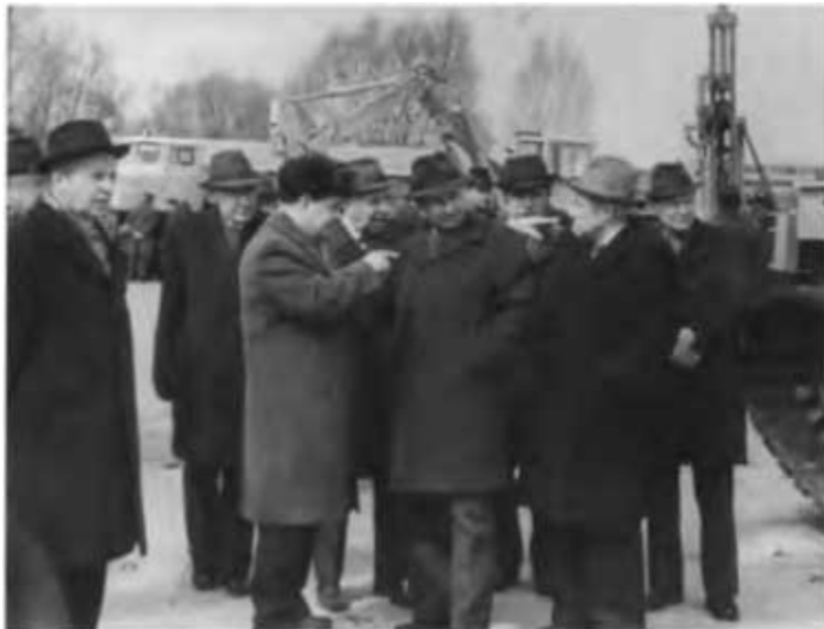
На выставке Миннефтегазстроя в Раменском. 1980 г.