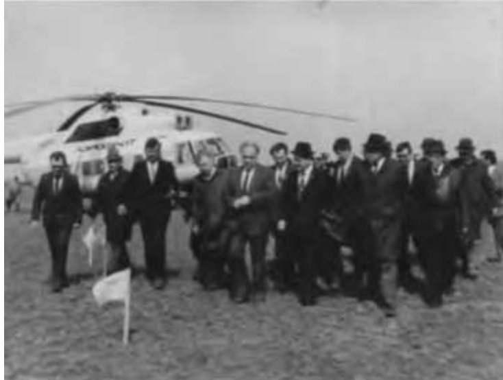
Казахстан, месторождение «Карачаганак». Апрель. 1986 г.