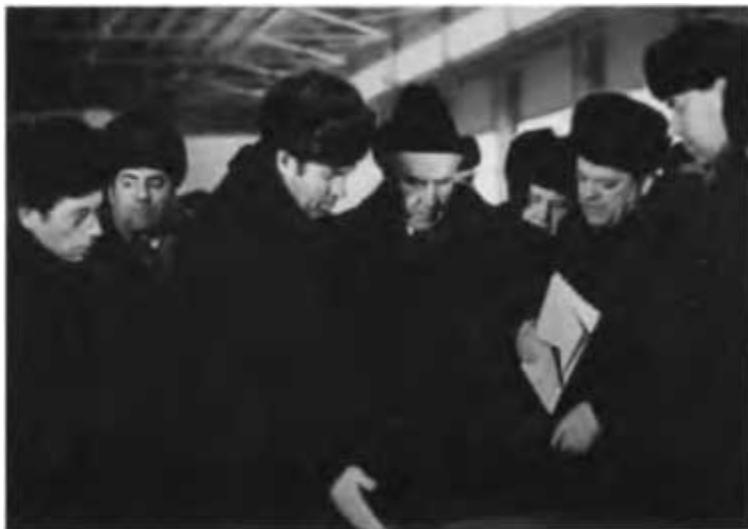
Как дела на строительстве нефтепровода Саянск — Куйбышев? Строители отвечают А. Н. Косыгину. Тюмень, 1975 г.