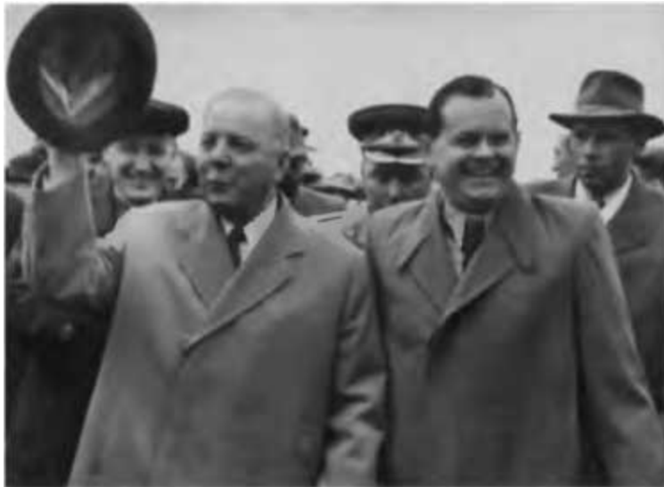
В Иркутск прилетел Климент Ефремович Ворошилов, Председатель Президиума Верховного Совета СССР. 1956 г.