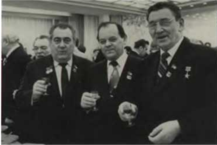
Заместители Председателя Совета Министров СССР А. Л. Костандов, Б. Е. Щербина, И. Т. Новиков. 1976 г.