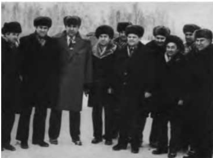
Б. Е. Щербину чаще, чем в Москве можно было встретить на трассах нефте- и газопроводов. Этот снимок сделан на трассе газопровода Уренгой — Челябинск. 1978 г.