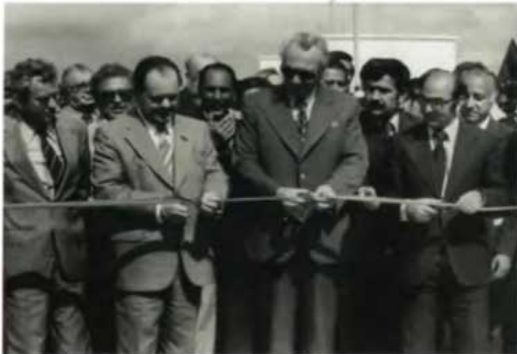
Советские нефтегазостроители создали новый газовый промысел в Афганистане