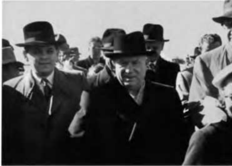
На Иркутскую ГЭС наведались Н. С. Хрущев...