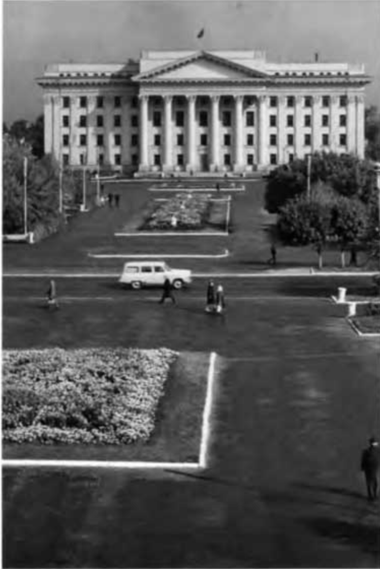
Тюменский обком КПСС. 1965 г.