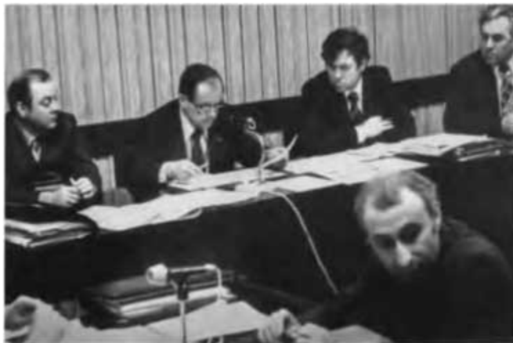
Селекторное совещание в Тюмени. 1978 г.