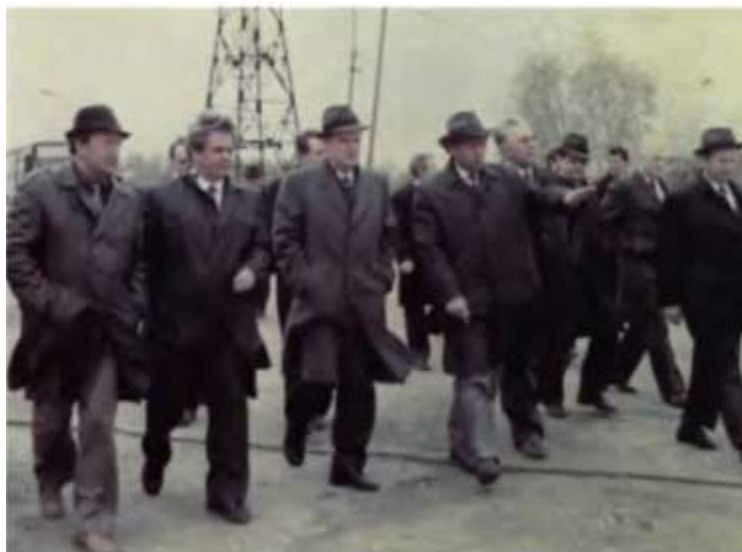
Н. И. Рыжков на строительстве нефтегазовых объектов в Тюменской области. 1988 г.