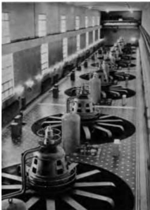
Машинный зал Иркутской ГЭС.