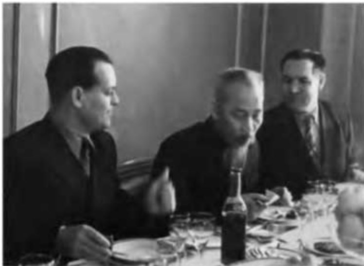
...и председателя ЦК Партии трудящихся Вьетнама Хо Ши Мина. 1954 г.