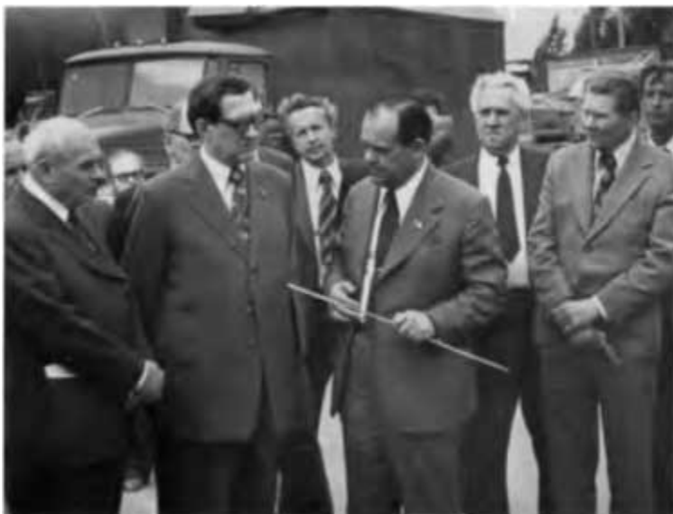
Знакомство с новой техникой