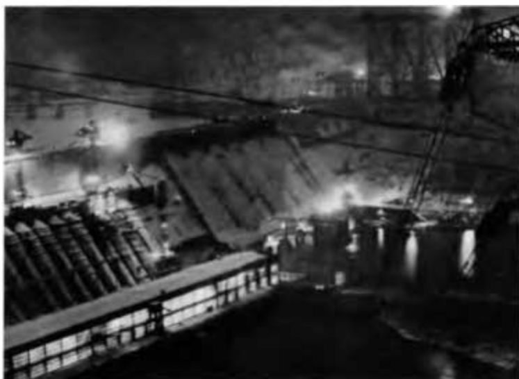
Следом за Иркутской появилась легендарная братская ГЭС.