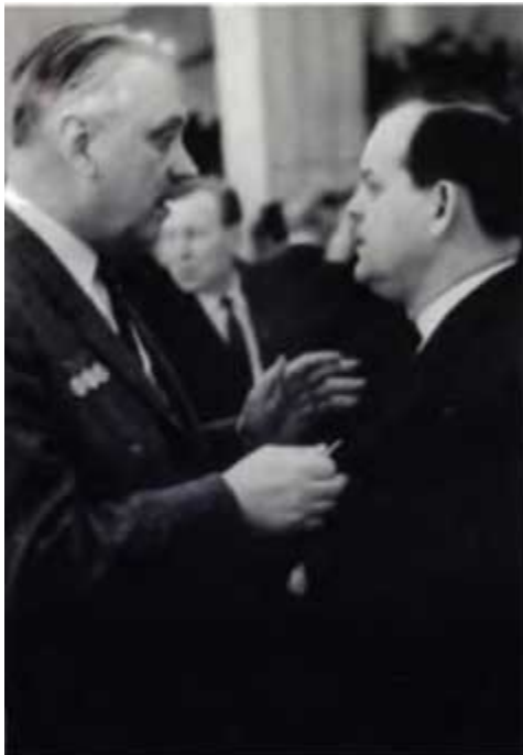
Сергей Владимирович Михалков собирается написать стихи о нефтегазостроителях