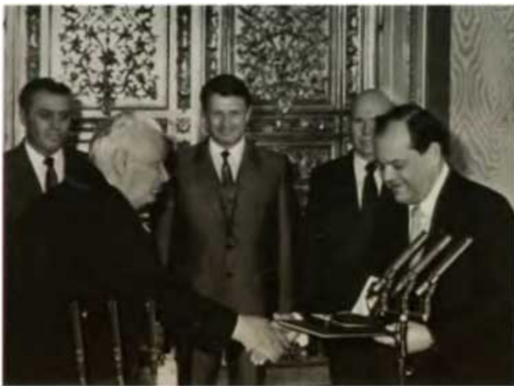
Константин Устинович Черненко, Генеральный секретарь ЦК КПСС, вручает Б. Е. Щербине Золотую Звезду Героя Социалистического Труда и орден Ленина. Москва, Кремль, 1984 г.