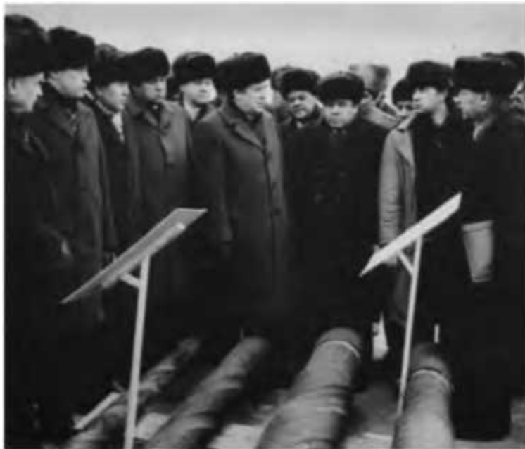
Что ждет Тенгизское нефтяное месторождение? Казахстан, 1987 г.