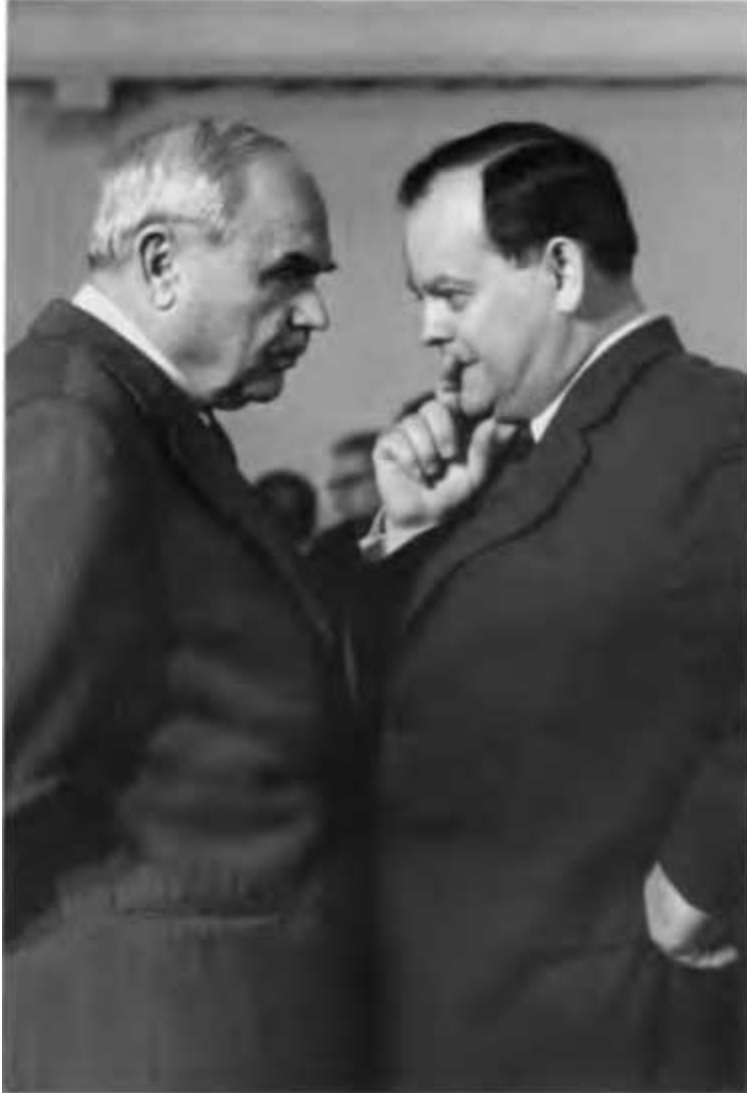
Деловой разговор с председателем Госплана СССР Николаем Константиновичем Байбаковым (слева). 1973 г.