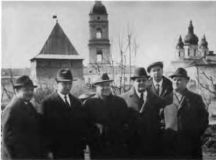
Борис Евдокимович Щербина знакомит столичных гостей с Тобольском. 1979 г.