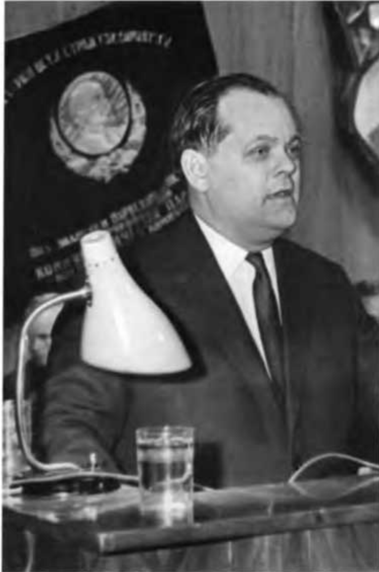
Первый секретарь Тюменского обкома партии Б. Е. Щербина во время выступления на партийно-хозяйственном активе области. Тюмень, 1971 г.