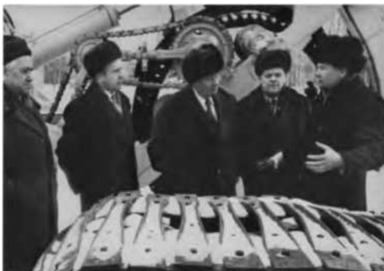
Б. Е. Щербина среди ученых. 1980 г.