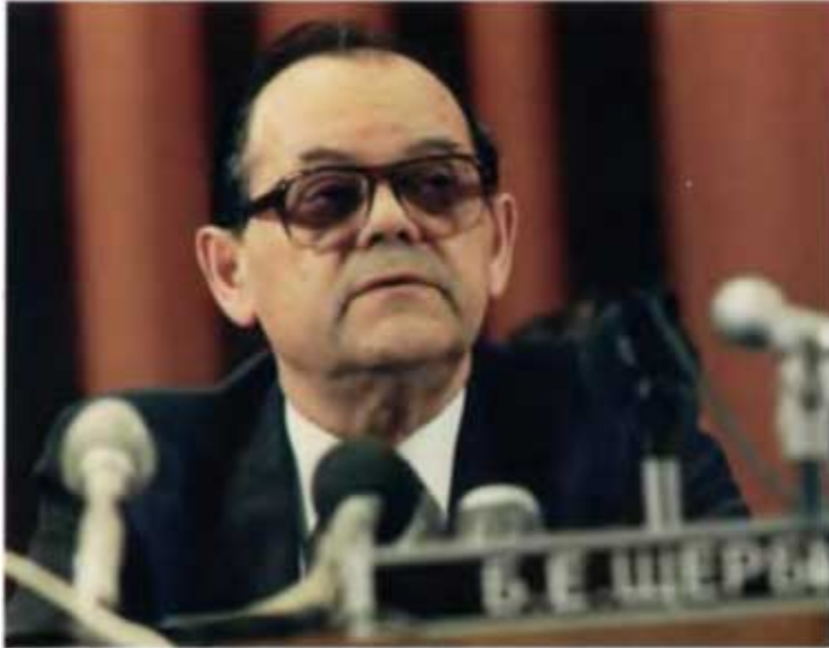
Заместитель Председателя Совета Министров СССР Б. Е. Щербина. 1989 г.