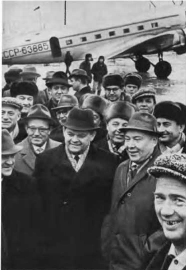
На головных сооружениях нефтепровода Усть-Балык -Омск. 1967 г.