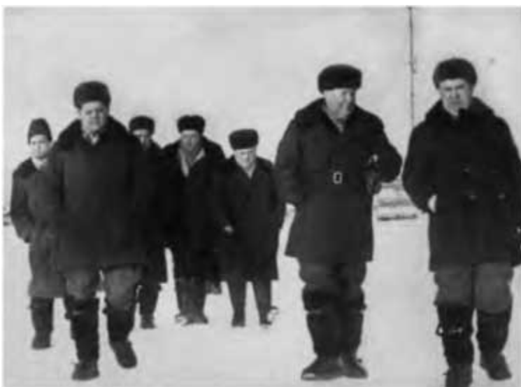
Сургут. 1965 г.