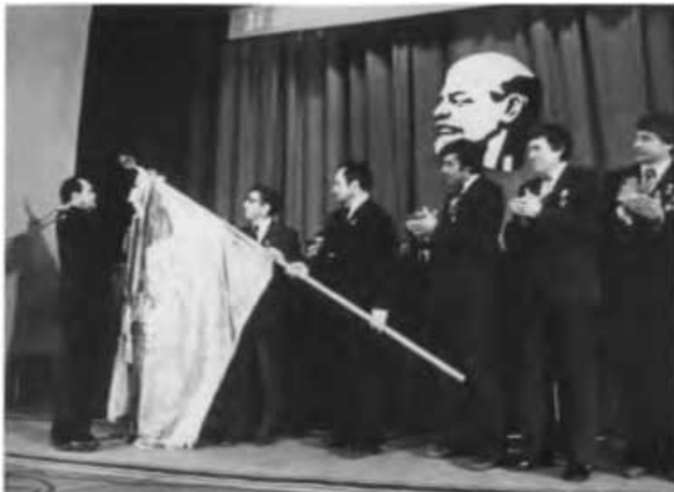
Коллектив Главсибтрубопроводстроя награжден орденом Ленина. Тюмень, 1981 г.