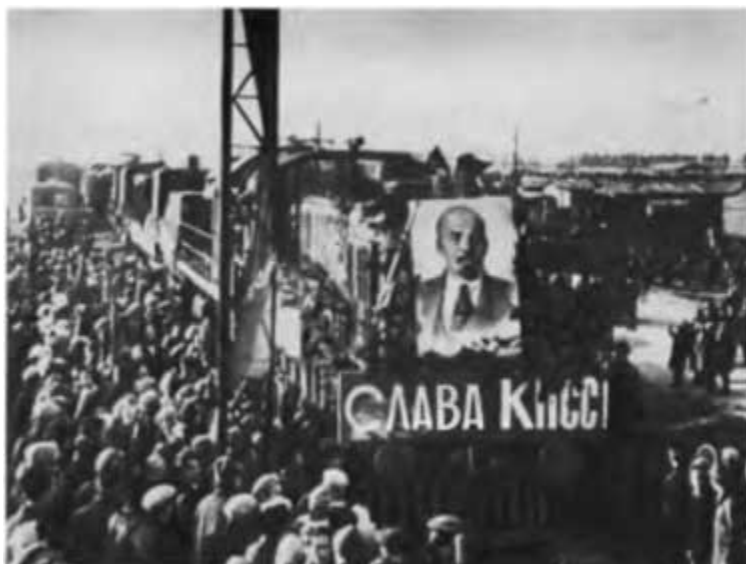
По железной дороге Тюмень — Сургут в Тобольск пришел первый поезд