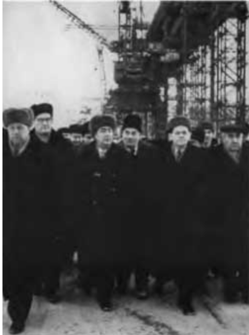
Л. И. Брежнев Председатель Президиума Верховного Совета СССР на Братской ГЭС. 1960 г.