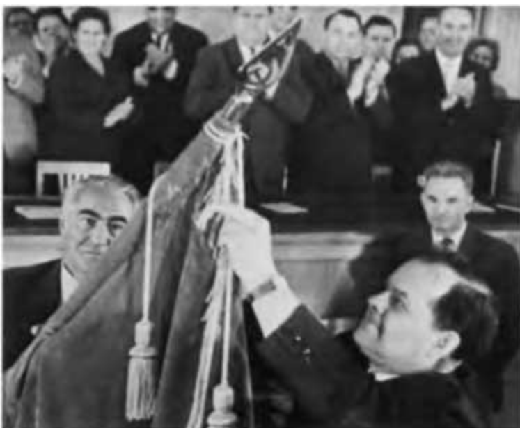
Первый секретарь Тюменского обкома КПСС Б. Е. Щербина вручает орден Ленина объединению «Главтюменьгеология». Тюмень, 1966 г.