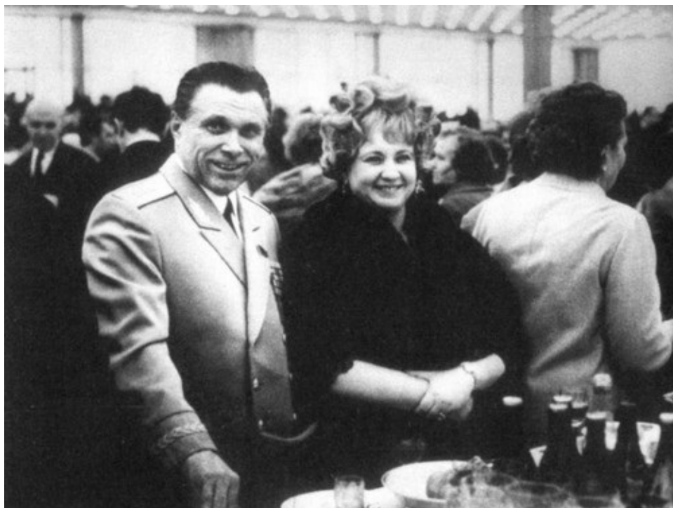
С супругой на официальном приеме