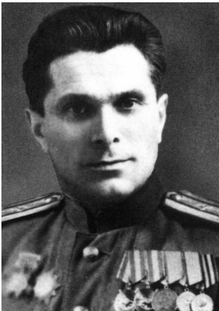
Николай Анисимович Щёлоков. 1944 г.