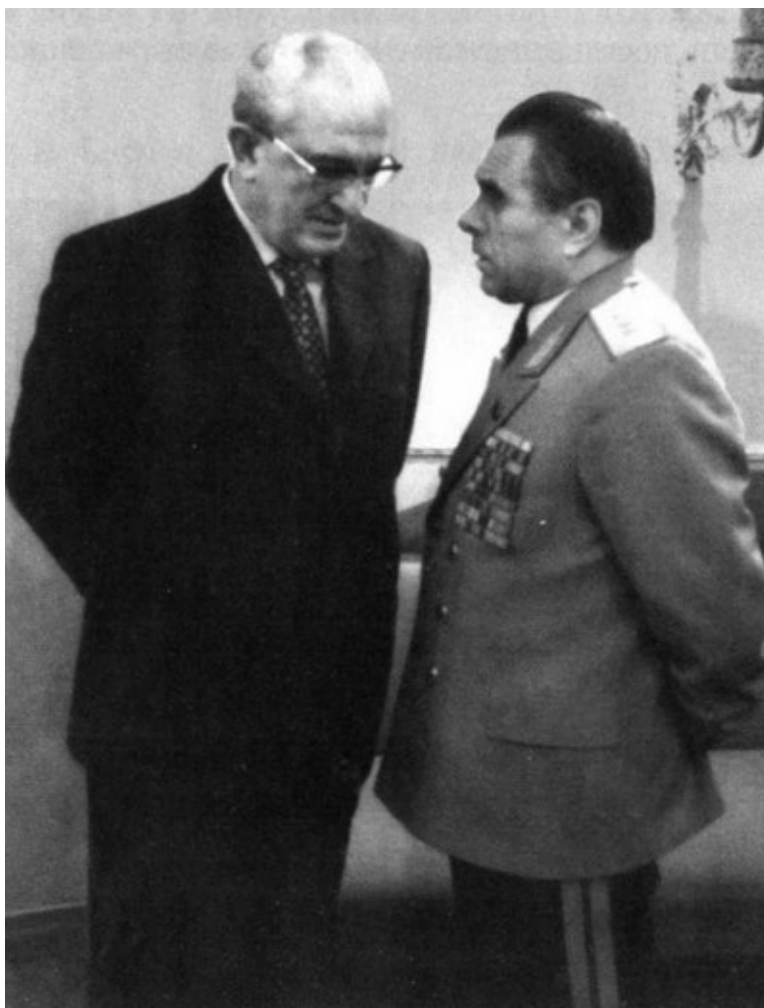
Разговор с Юрием Владимировичем Андроповым