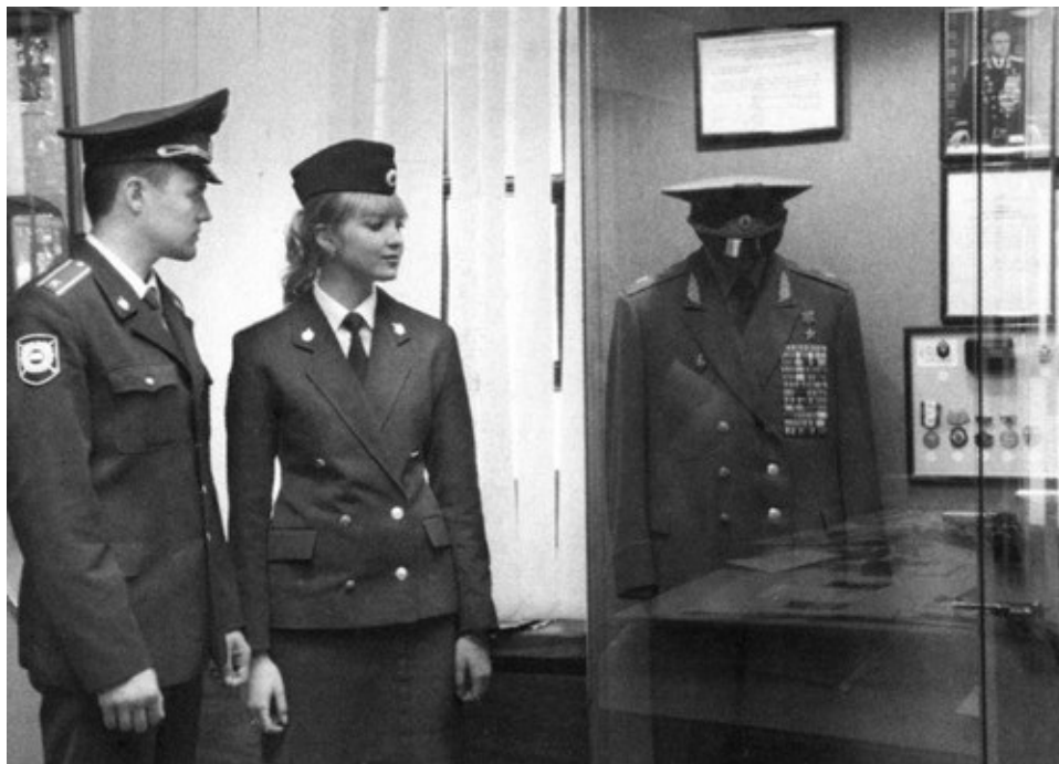
В Центральном музее МВД у стенда, посвященного Н. А. Щёлокову