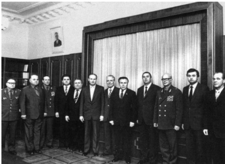
Последний снимок в кабинете министра. 19 декабря 1982 г.