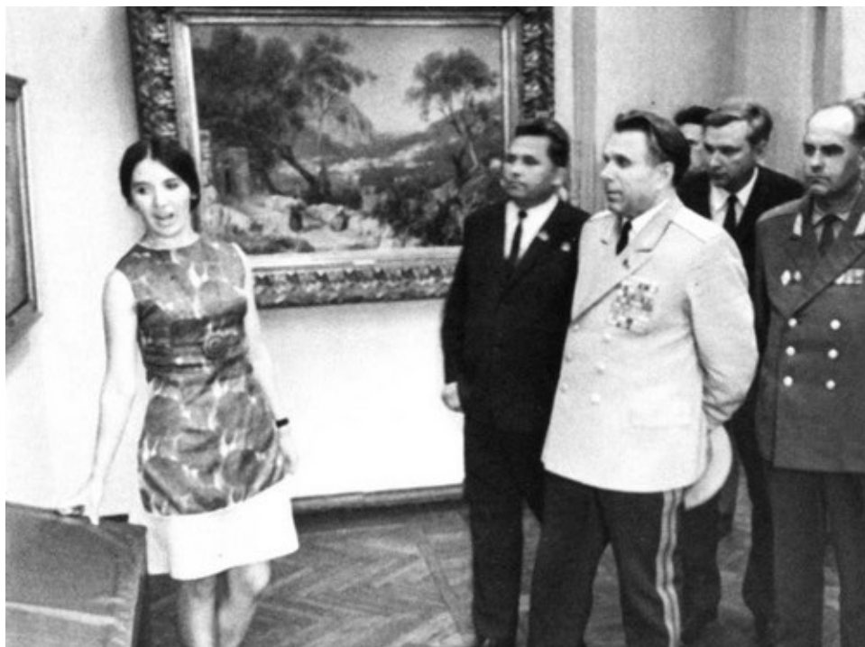
В художественной галерее