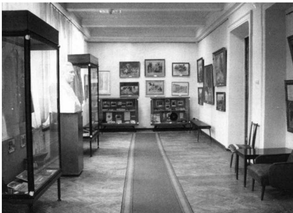
Посвященная Н. А. Щёлокову экспозиция историко-художественного