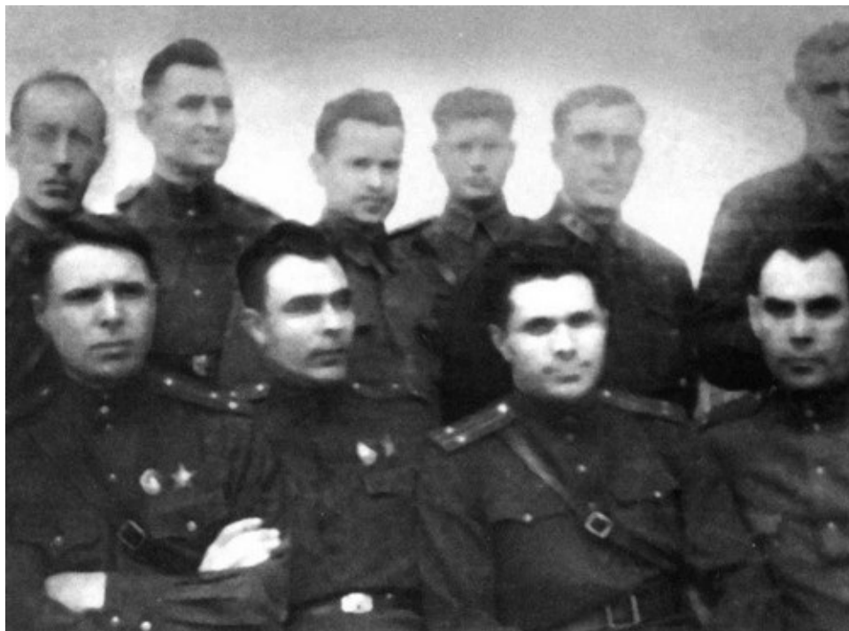
Боевые товарищи. Л. И. Брежнев (второй слева) и Н. А. Щёлоков (справа от него). Краснодар, 1943 г.