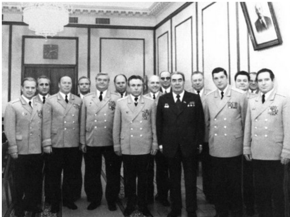
Члены коллегии МВД СССР на встрече с Л. И. Брежневым. 1978 г.