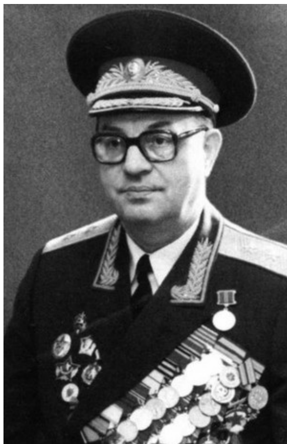
И. И. Карпец