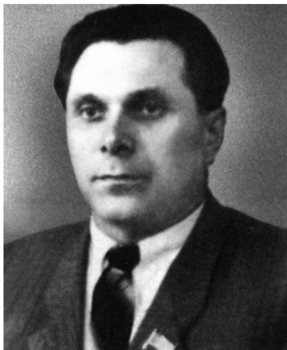
Первый заместитель председателя Совета министров Молдавской ССР