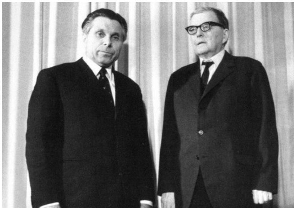
С композитором Д. Д. Шостаковичем