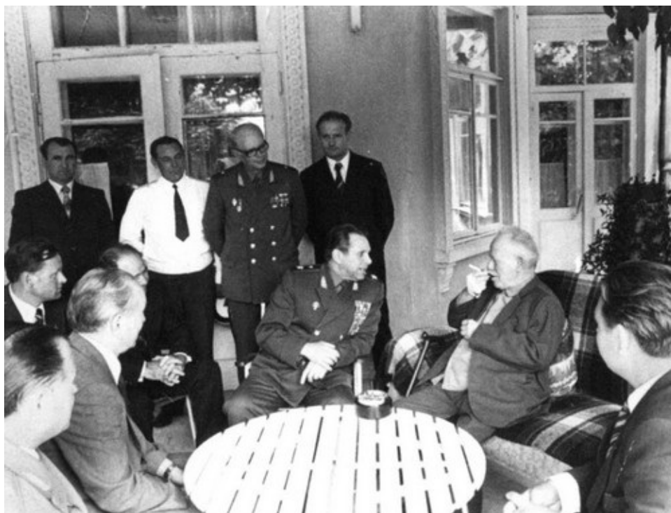
В гостях у Михаила Шолохова в станице Вёшенская