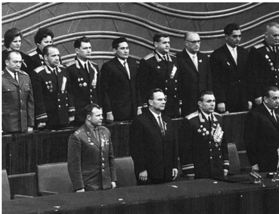
Николай Анисимович Щёлоков (второй справа в первом ряду) — на торжественном собрании, посвященном 50-летию советской милиции. Ноябрь. 1967 г.