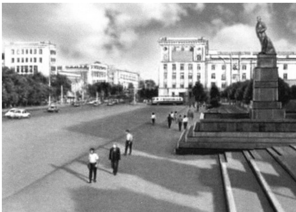
Кишинев, площадь Ленина. Конец 1950-х гг.