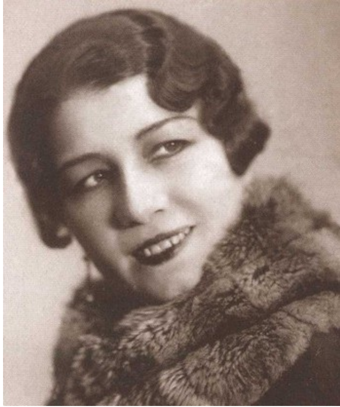
Лидия Андреевна Русланова