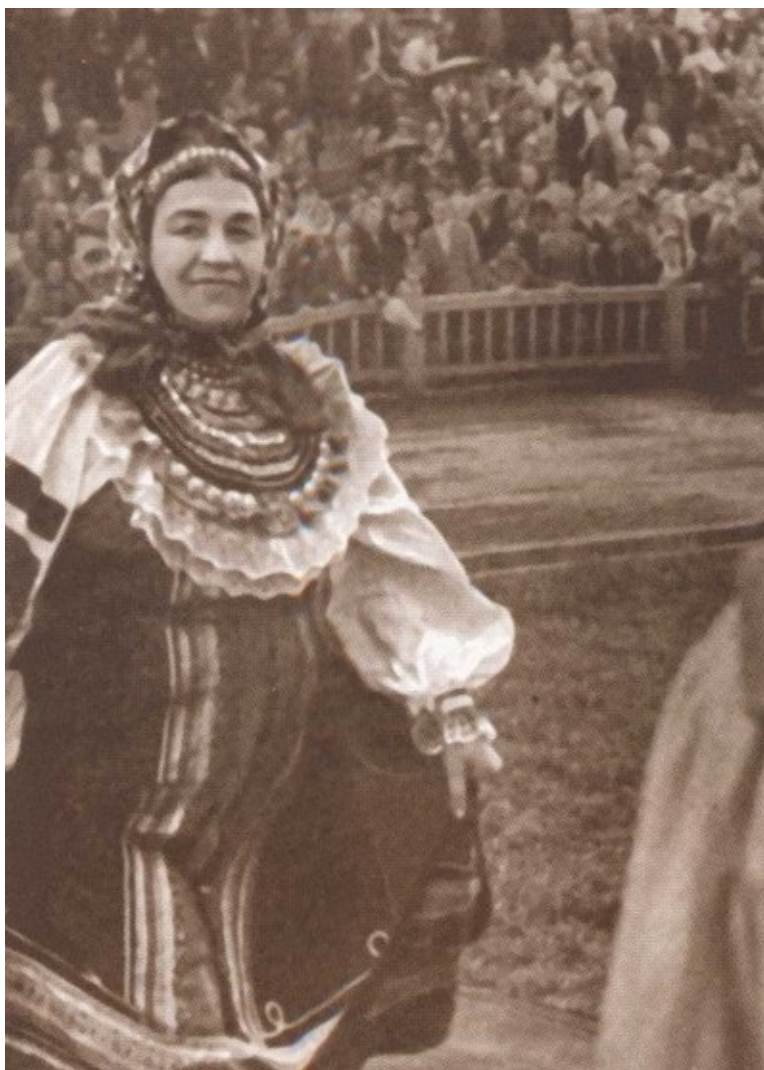
Выступление на стадионе перед многотысячной аудиторией