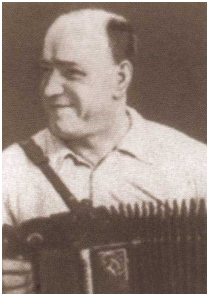
Г. К. Жуков однажды аккомпанировал Л. А. Руслановой