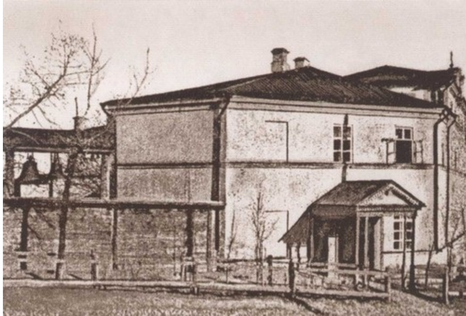
Мариинский детский приют. Саратов, начало XX в.