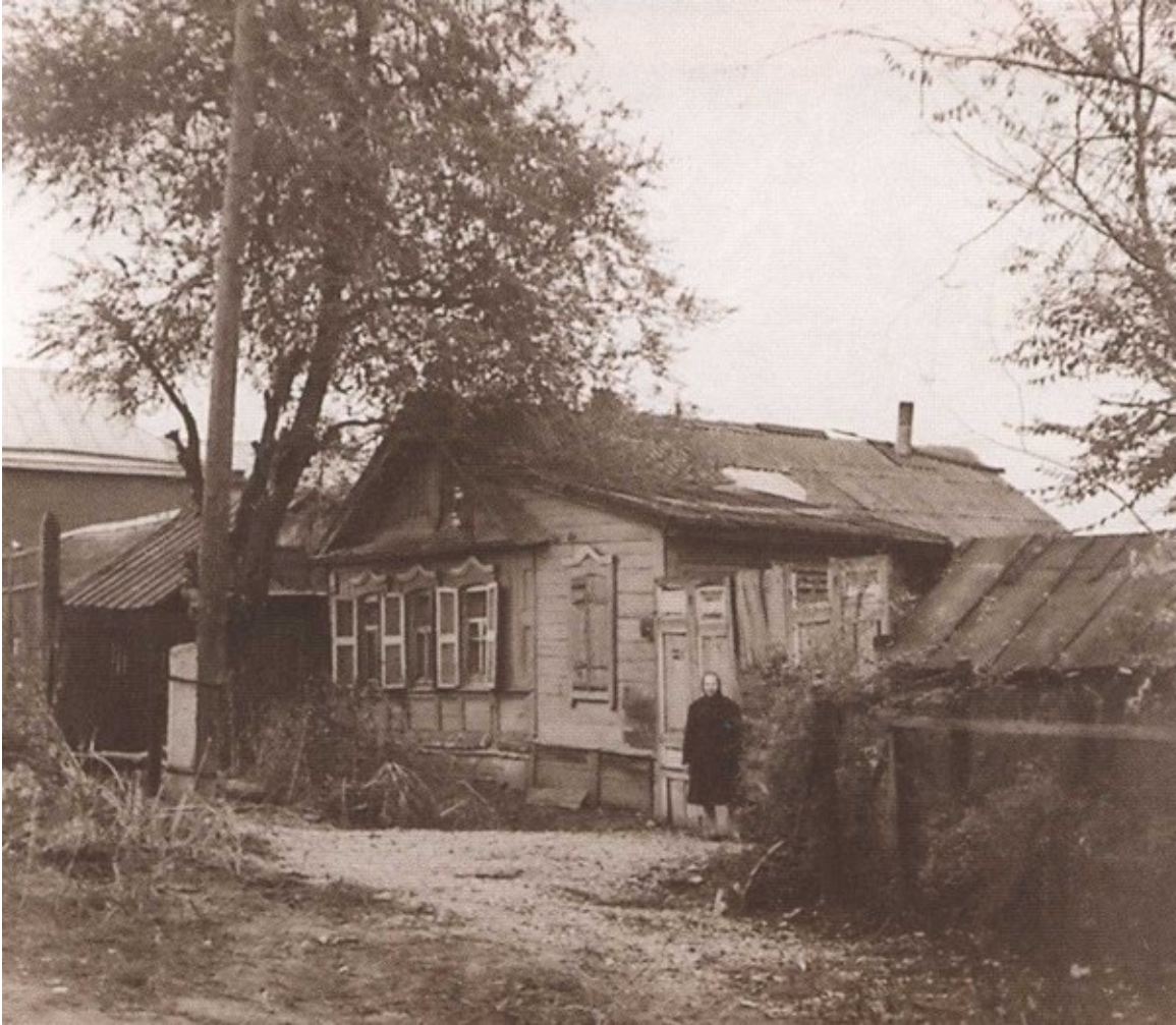
Дом Руслановой в Саратове. Улица Титова, 9