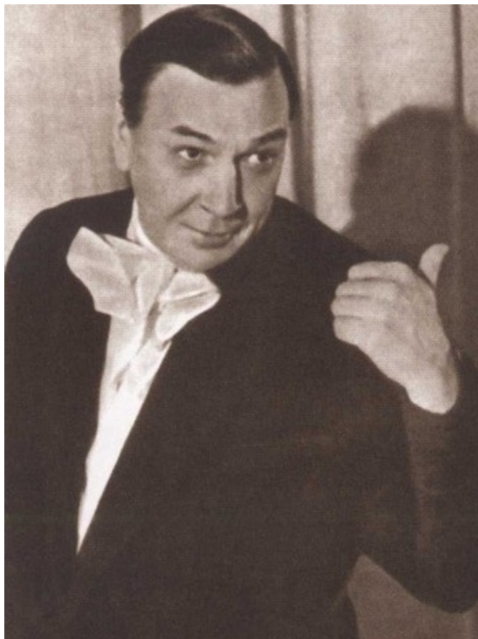
Николай Павлович Смирнов-Сокольский