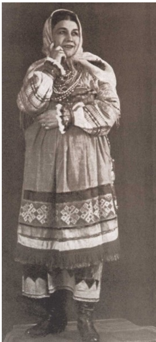
В национальном костюме. 1930-е гг.