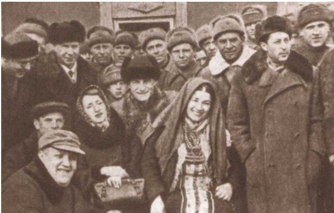
Русланова и Гаркави среди артистов фронтовой концертной бригады