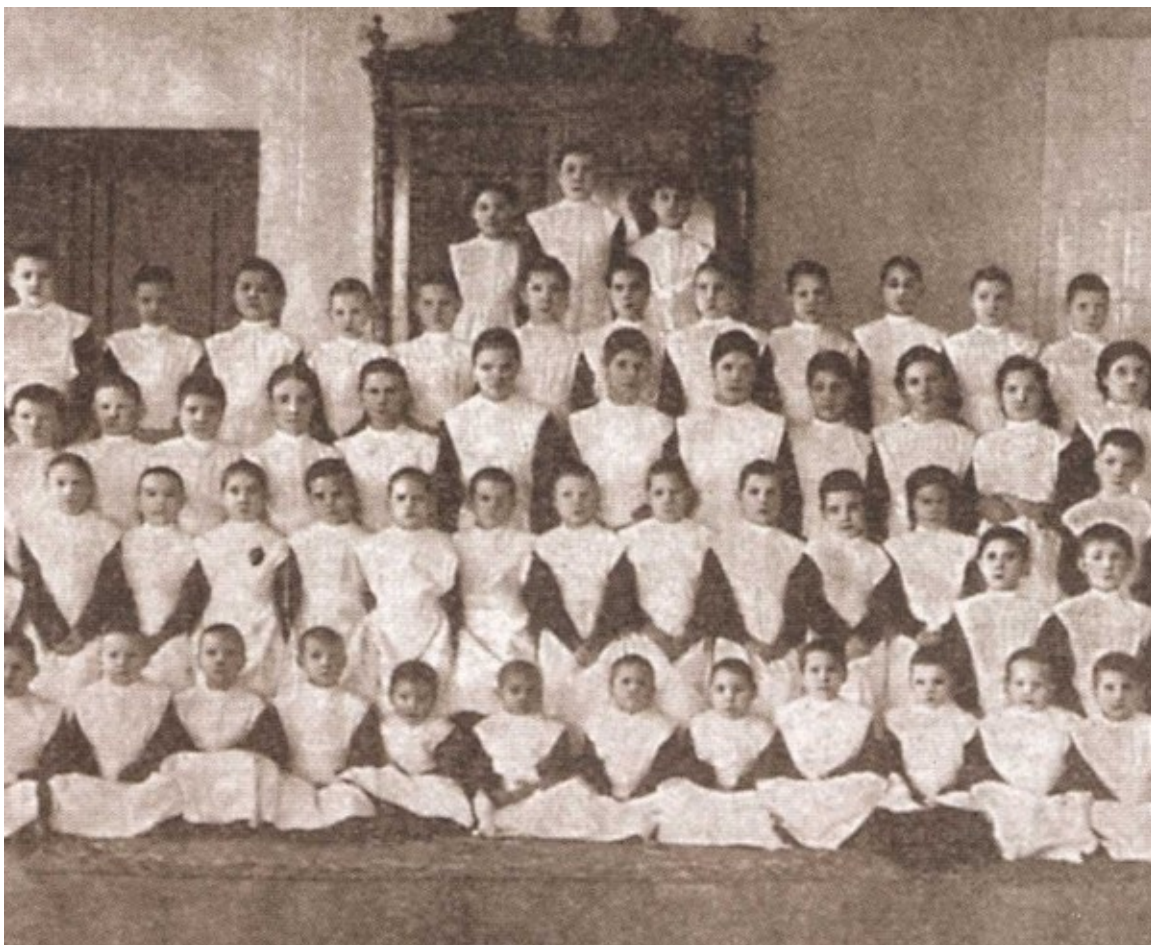
Воспитанницы Мариинского детского приюта. 1912 г.