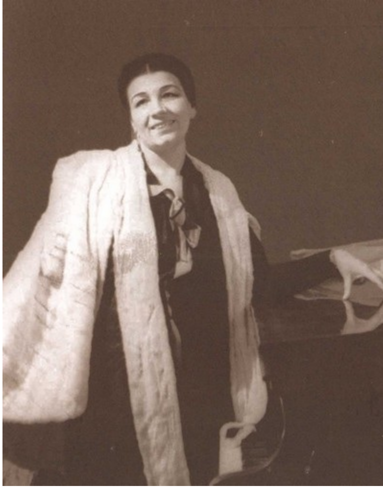
Лидия Андреевна Русланова