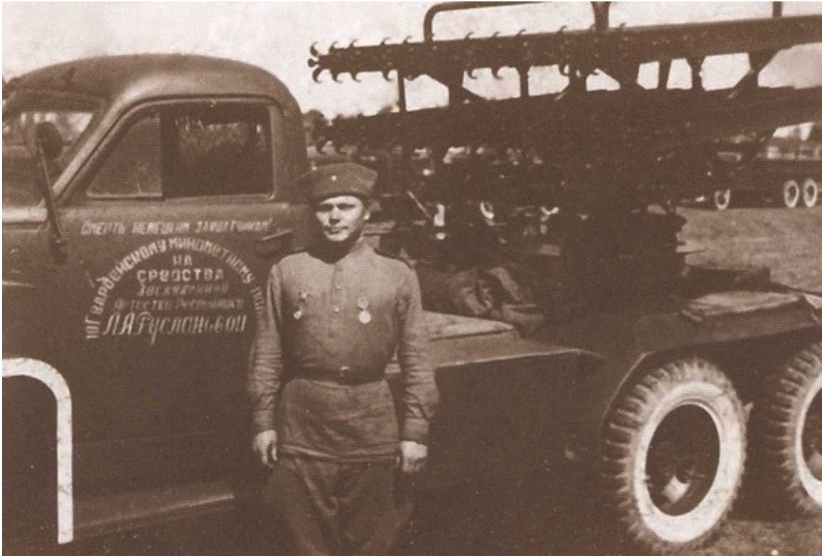
Батарея «катюш», созданная на средства Руслановой