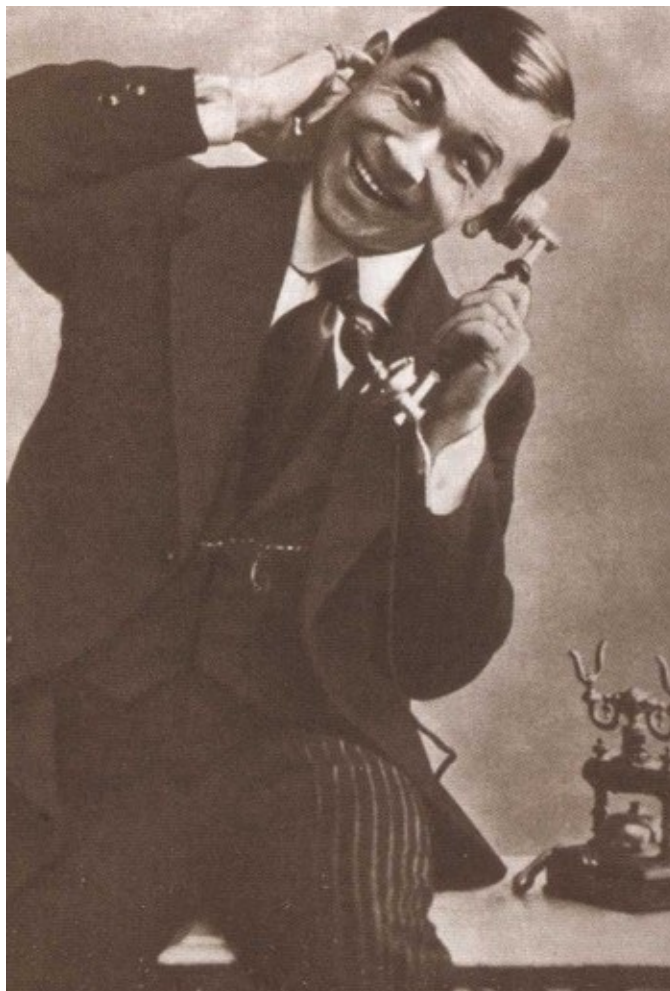
Комик Владимир Хенкин