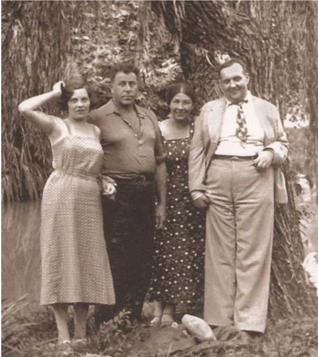
Русланова и Гаркави на отдыхе с друзьями. 1930-е гг.