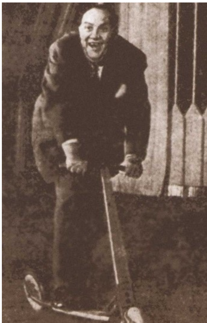
Гаркани перед концертом