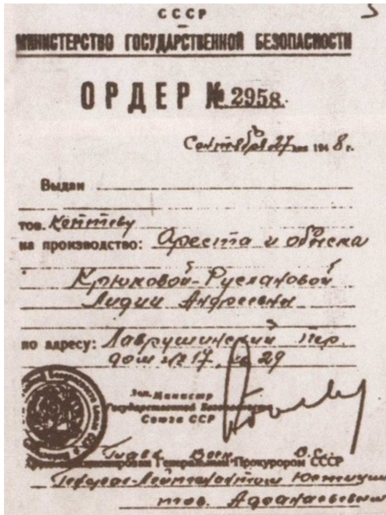
Фото и ордер на арест и обыск из следственного дела № 1762