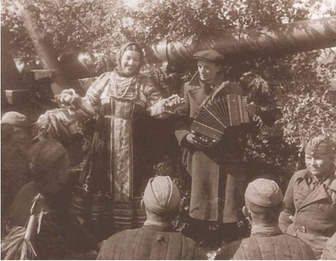
Выступление фронтовой концертной бригады перед бойцами