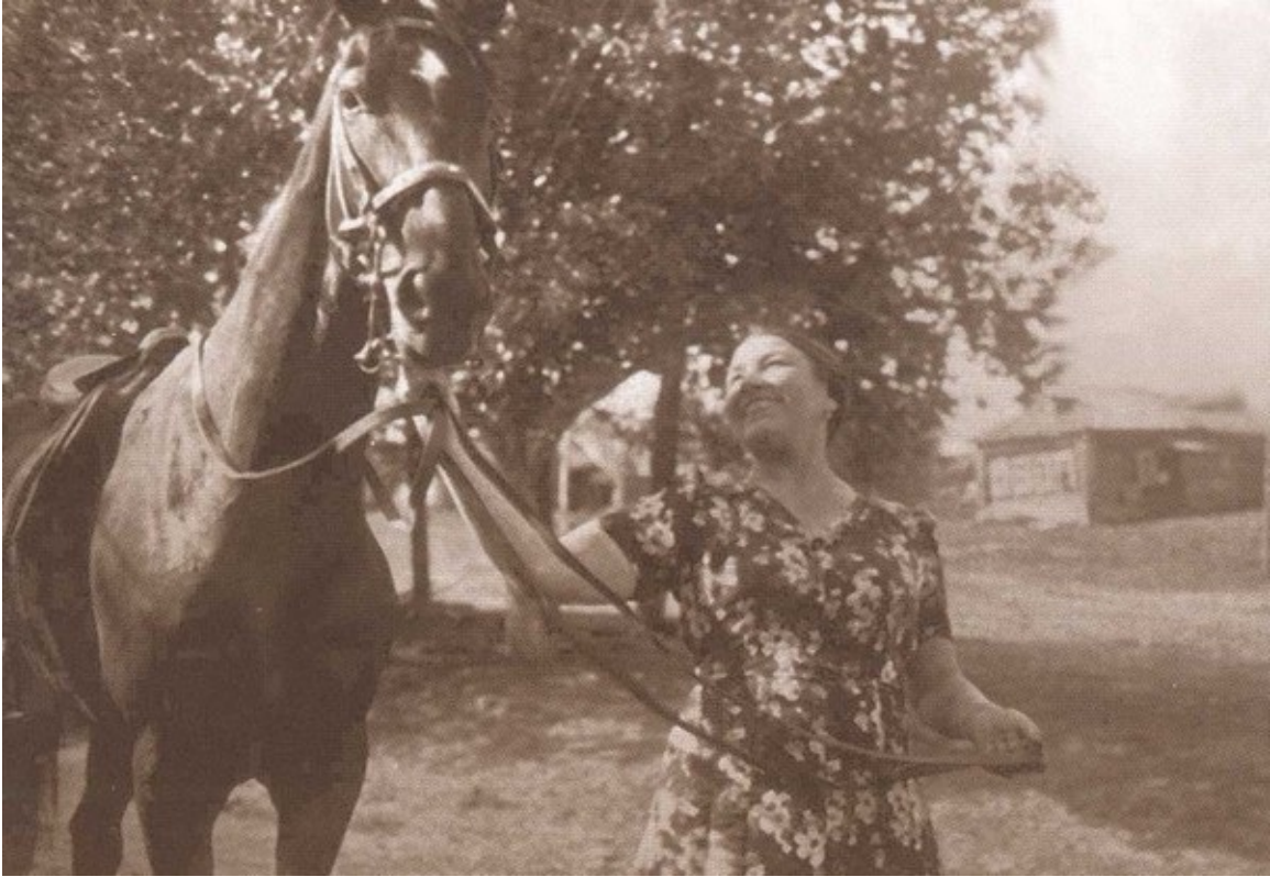
На отдыхе в деревне