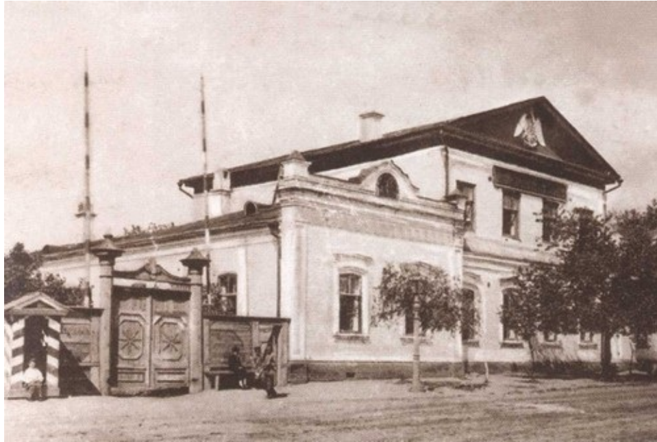
Приют им. М. Н. Галкина-Врасского. Саратов, начало XX в.