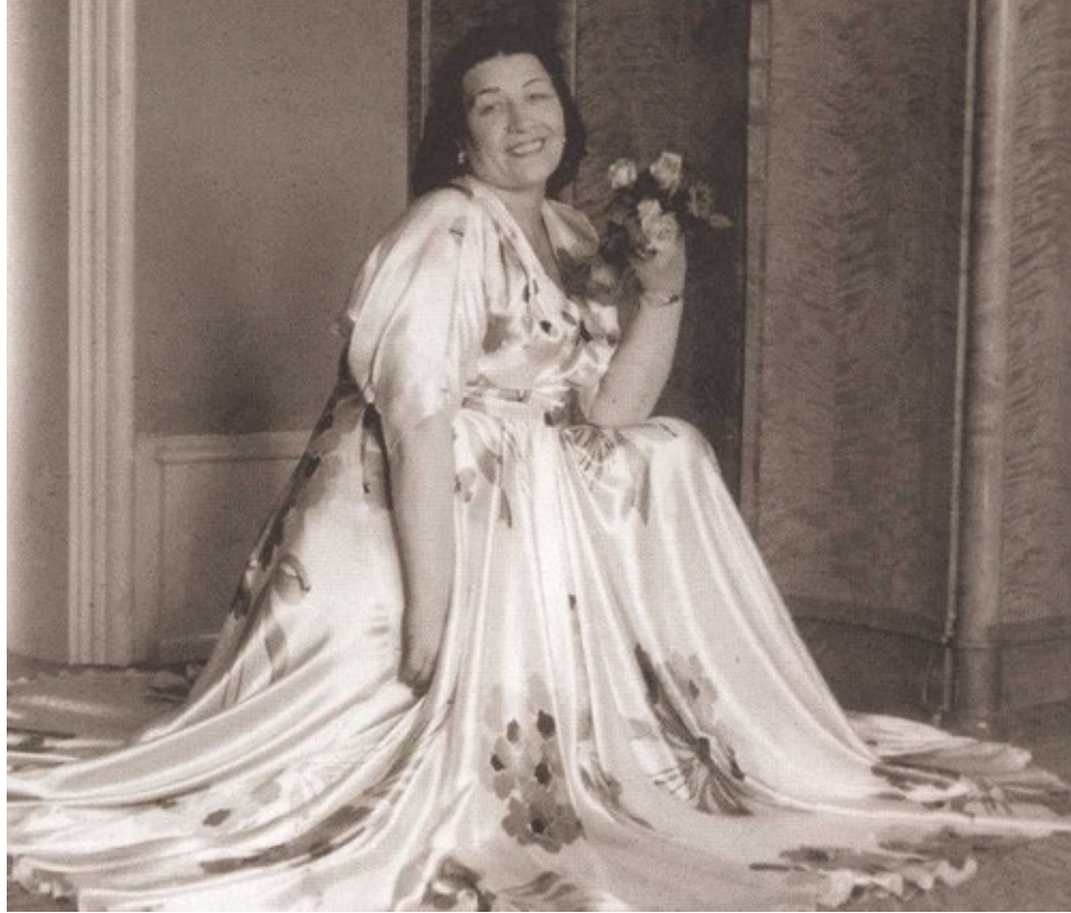
В бальном платье