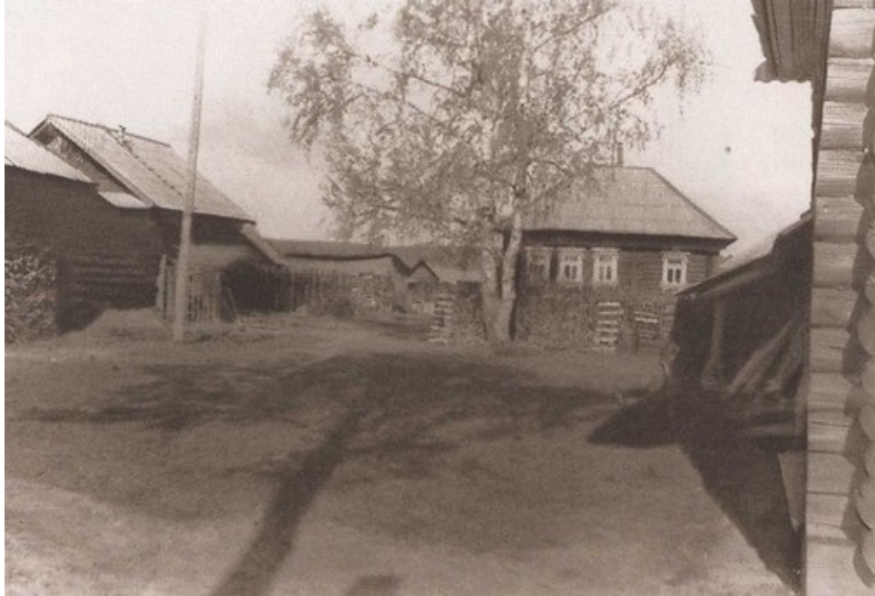
Даниловка. 1998 г.