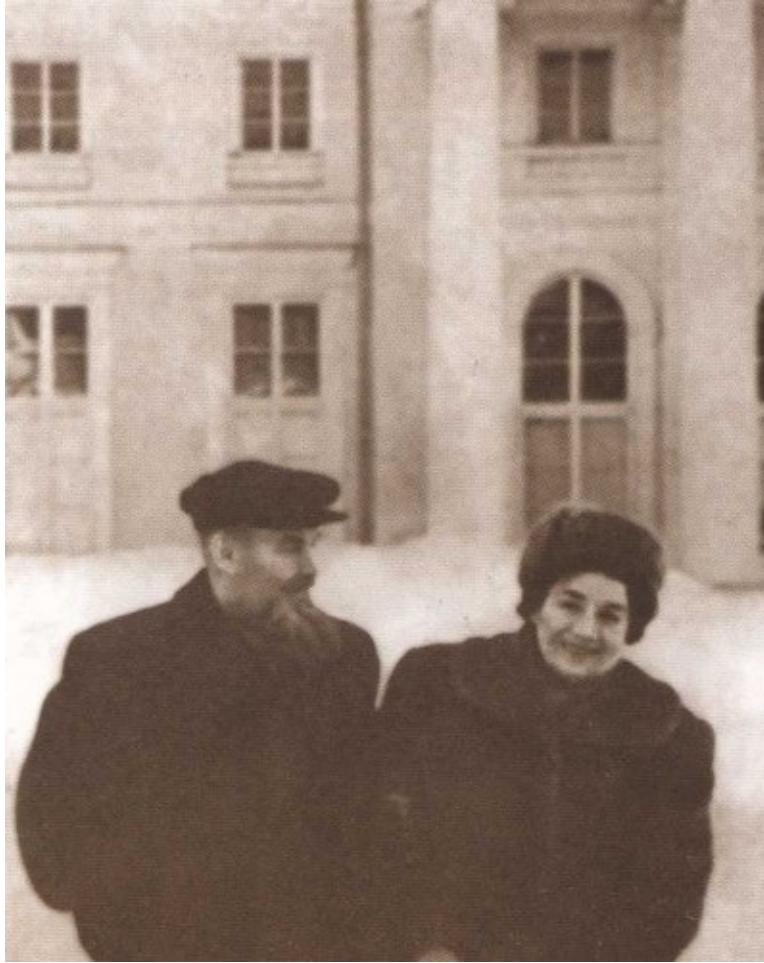
С Игорем Васильевичем Курчатовым