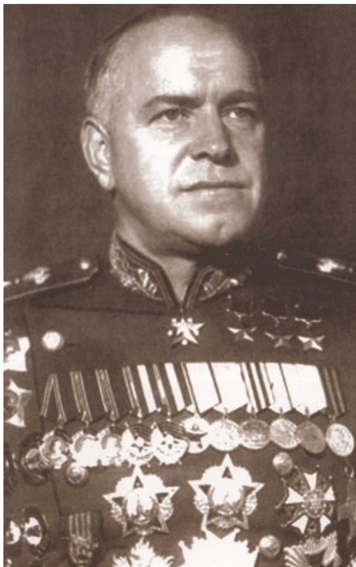
Маршал Советского Союза Георгий Константинович Жуков