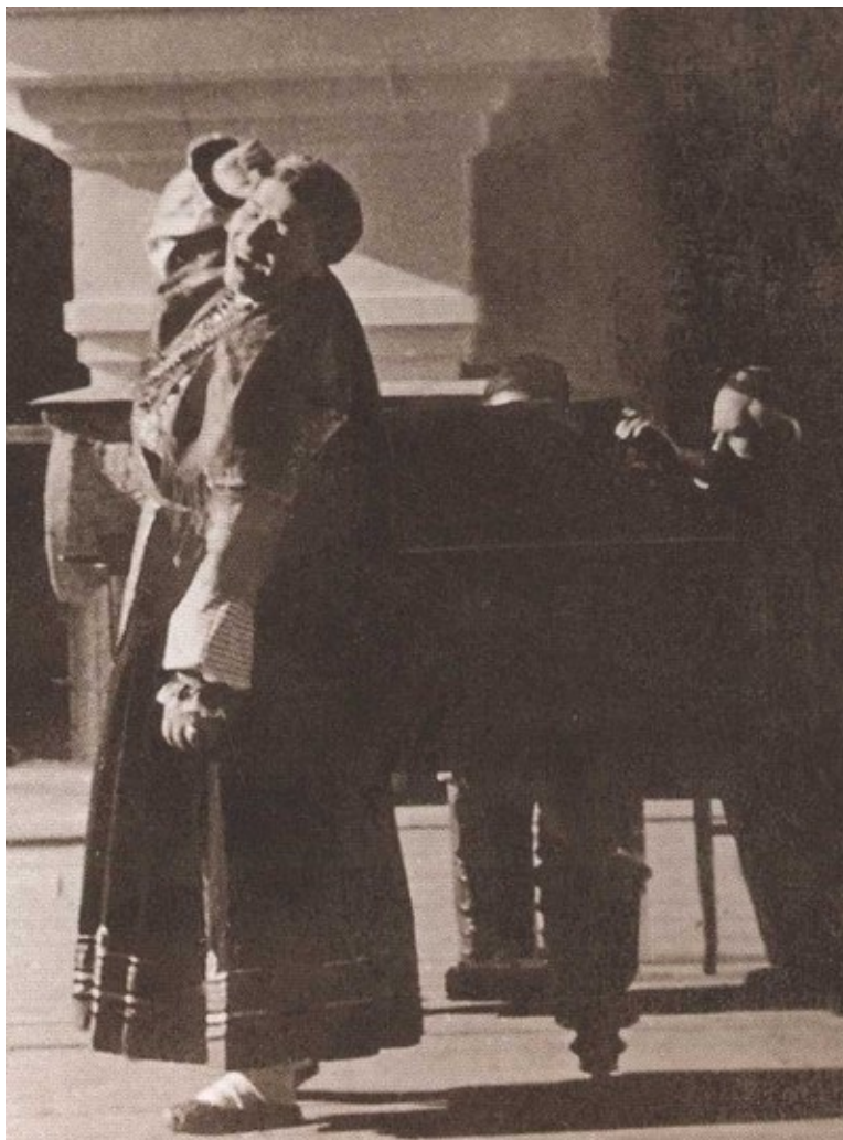
Концерт. 1930-е гг.