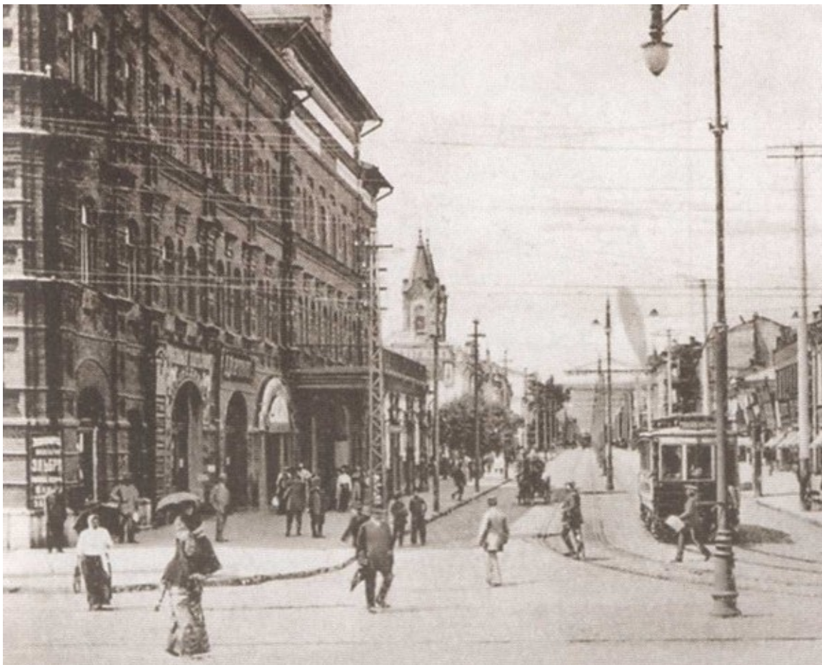
Саратов, Немецкая улица. Слева — Алексеевская консерватория. Начало XX в.