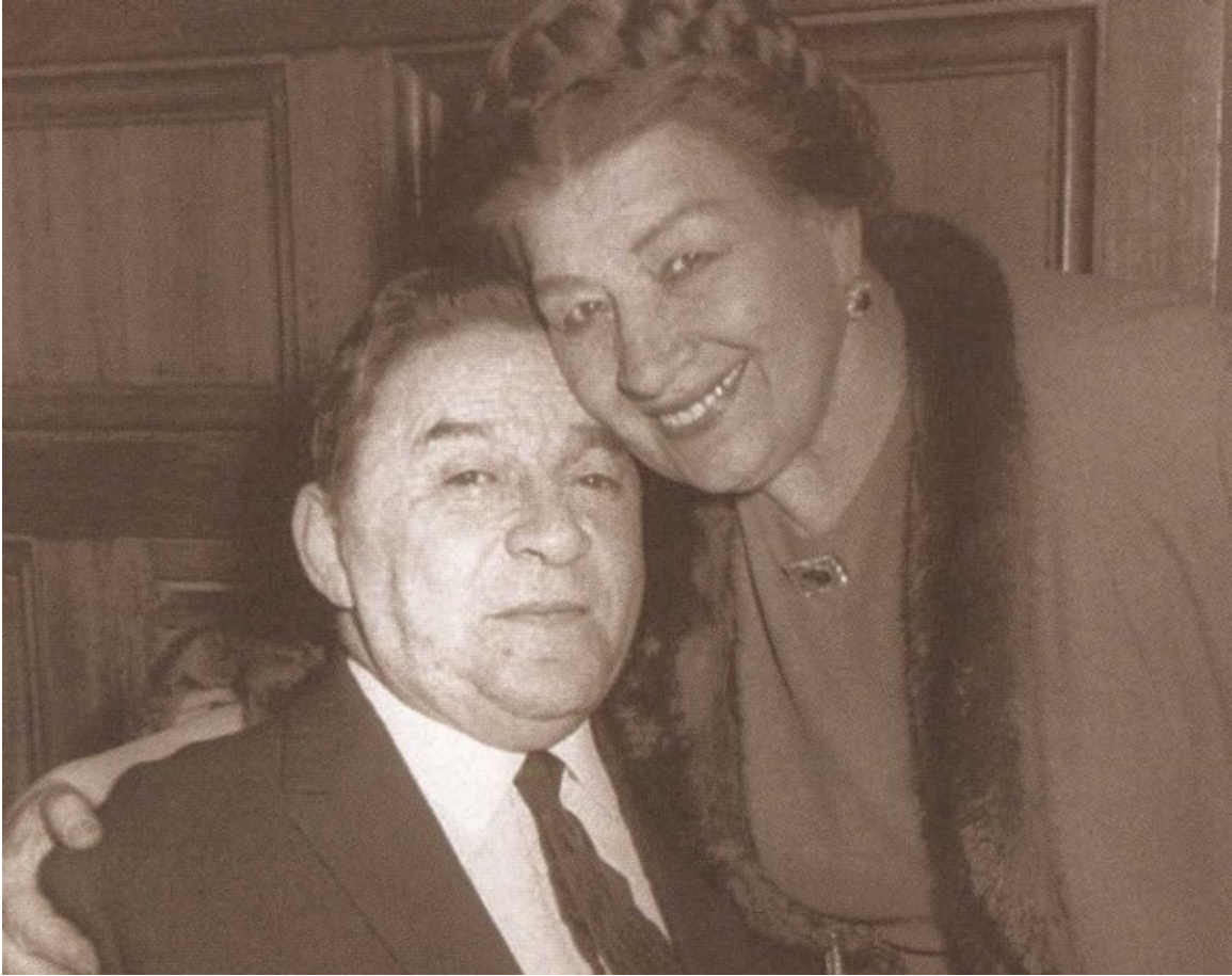
С Леонидом Осиповичем Утёсовым