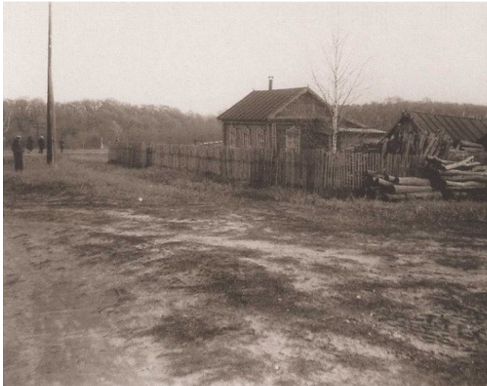
Село Даниловка. 1969 г.