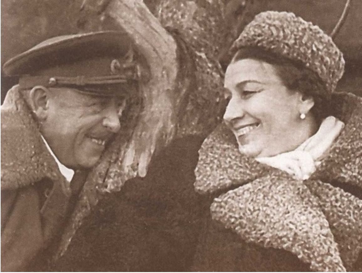
Лидия Андреевна Русланова и Владимир Викторович Крюков