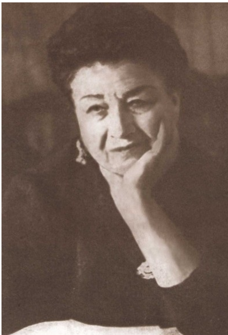
Лидия Андреевна Русланова

II Всероссийский фестиваль и конкурс исполнителей русских народных песен им. Л. А. Руслановой. Саратов, декабрь 1998 г.