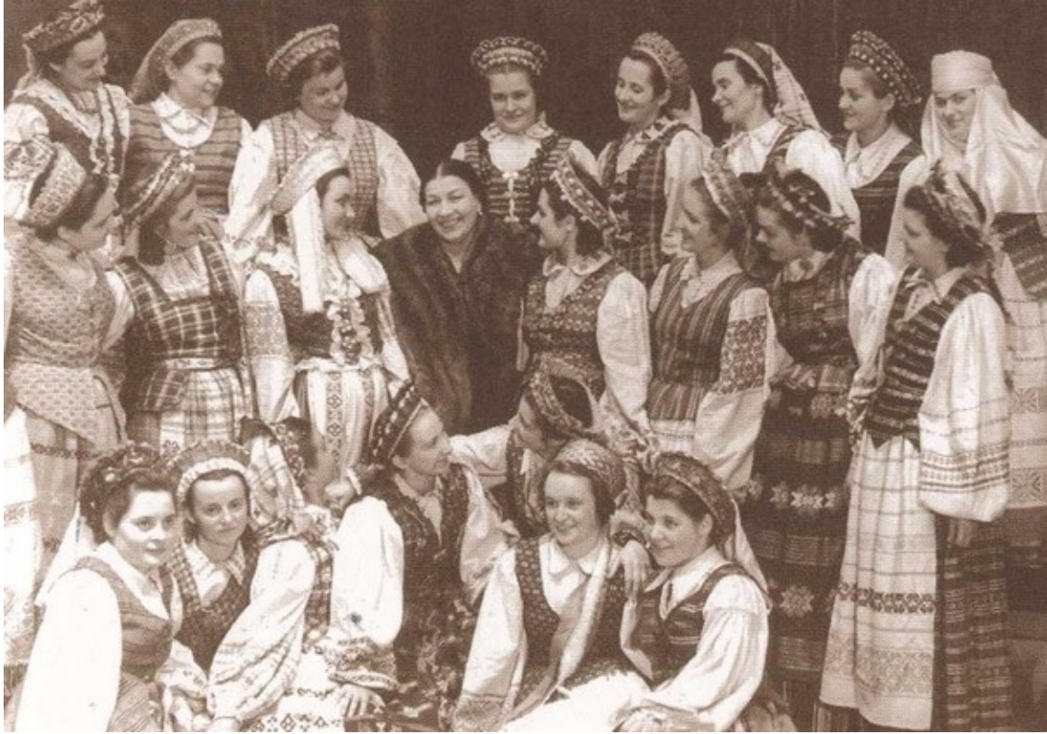
Русланова с ансамблем русской народной песни. 1940-е гг.