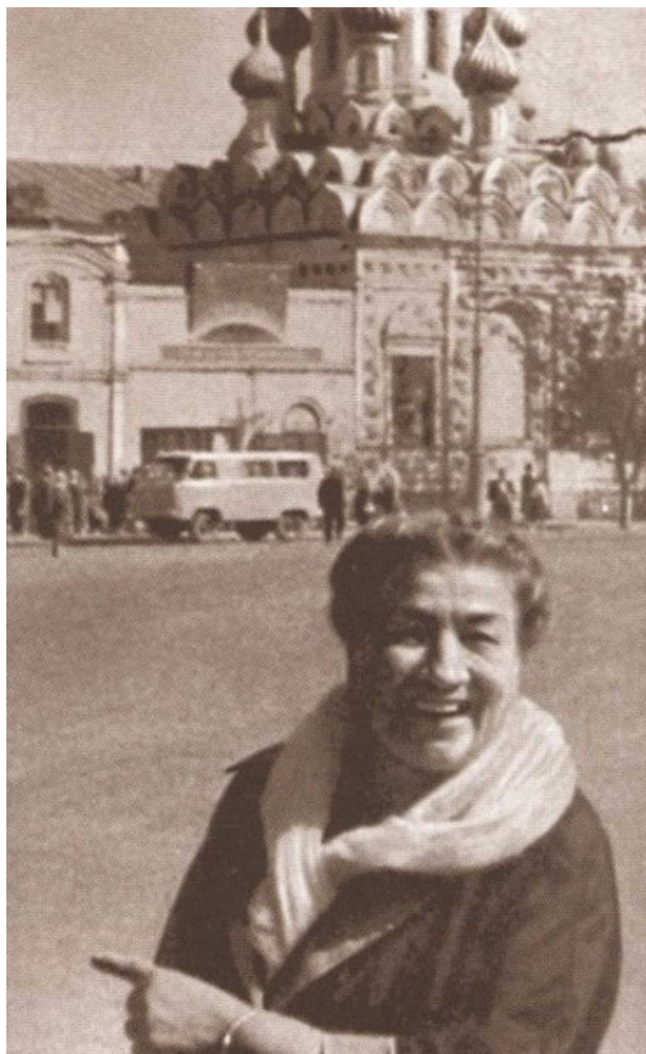
В Саратове. 1963 г.