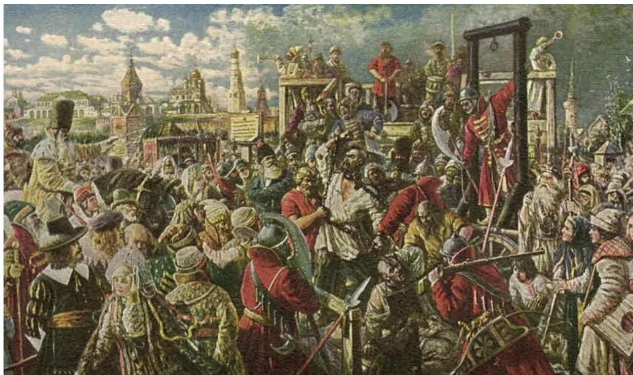
Казнь Степана Разина.