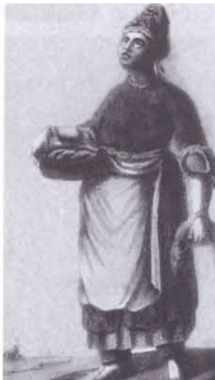
Донской казак и донская казачка.