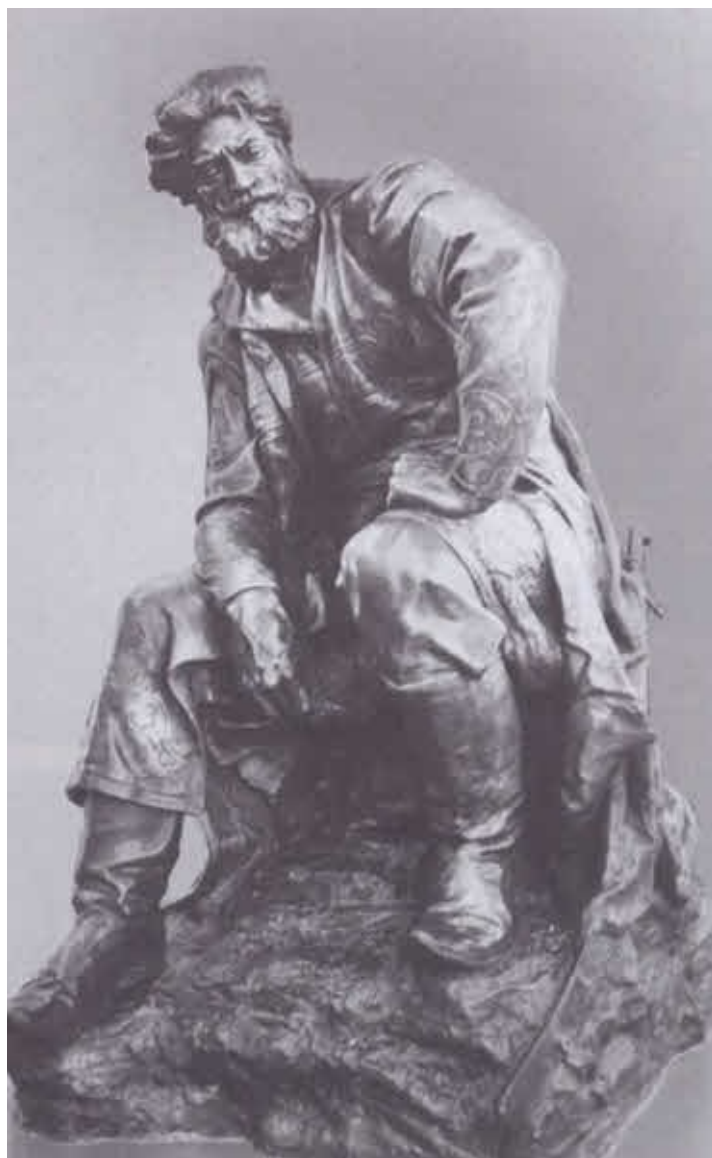
Степан Разин. Скульптура Е. В. Вучетича