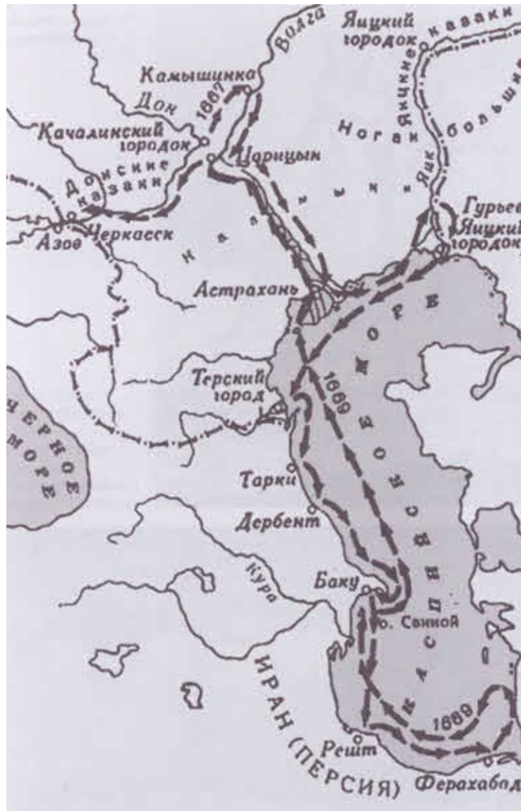
Поход Степана Разина в 1667–1669 годах