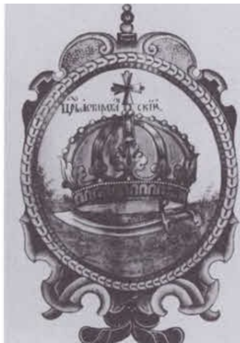
Гербы из «Титулярника» 1672 года: Казанский и Астраханский