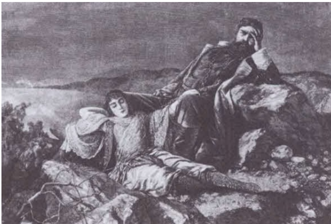
Атаман Стенька Разин и персидская княжна.

Гравюра Шюблера с картины П. Яковлева. 1898 г.