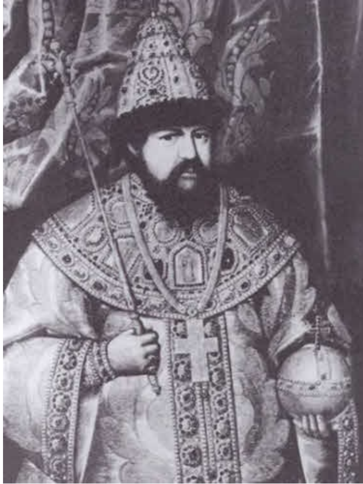
Царь и великий князь Алексей Михайлович