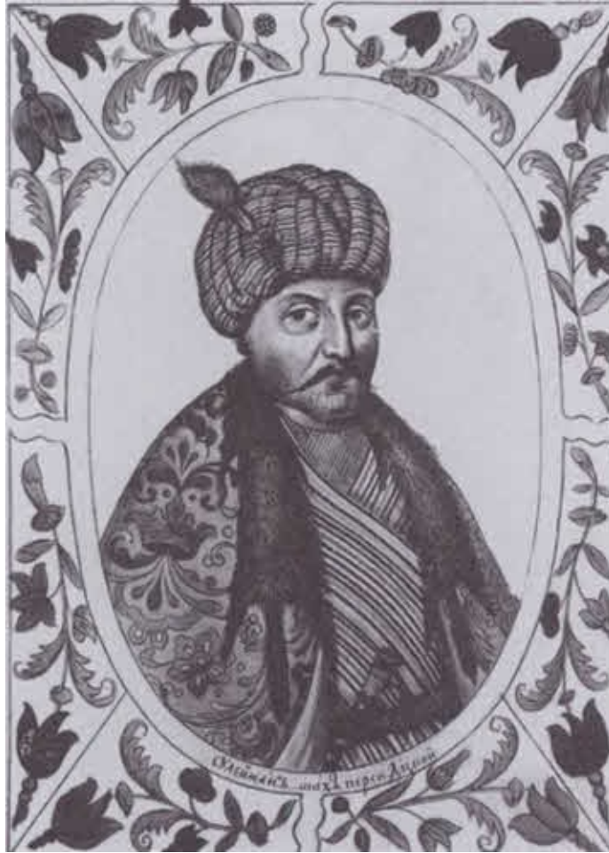
Сулейман, шах Персидский. Рисунок из «Титулярника», 1672 г.