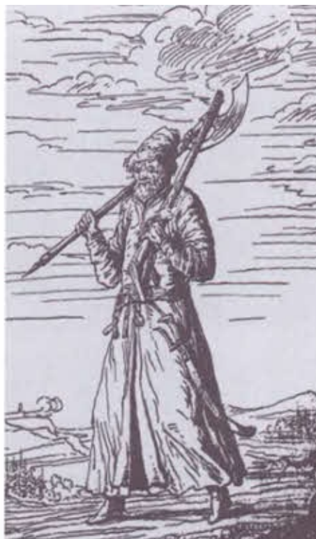
Стрелецкий голова и стрелец.

Рисунки из альбома Э. Пальмквиста. 1671 г.