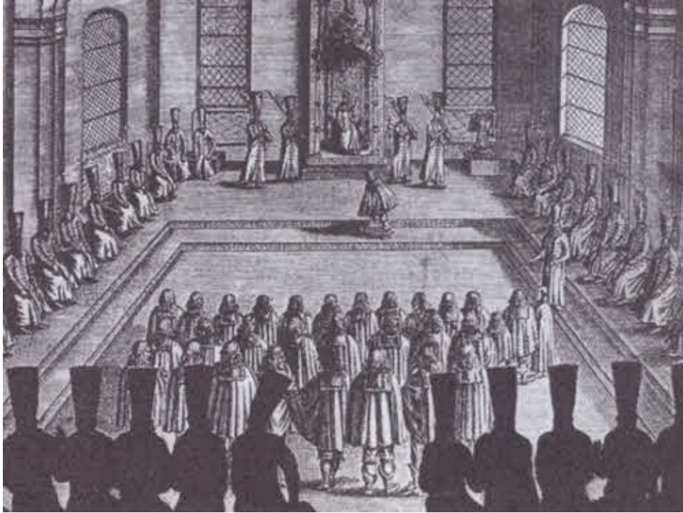
Заседание Боярской думы.

Гравюра из книги А. Олеария «Путешествие в Московию». 30-е гг. XVII в.