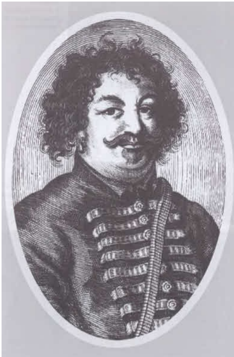
Донской атаман Степан Тимофеевич Разин. Гравюра 1672 г.