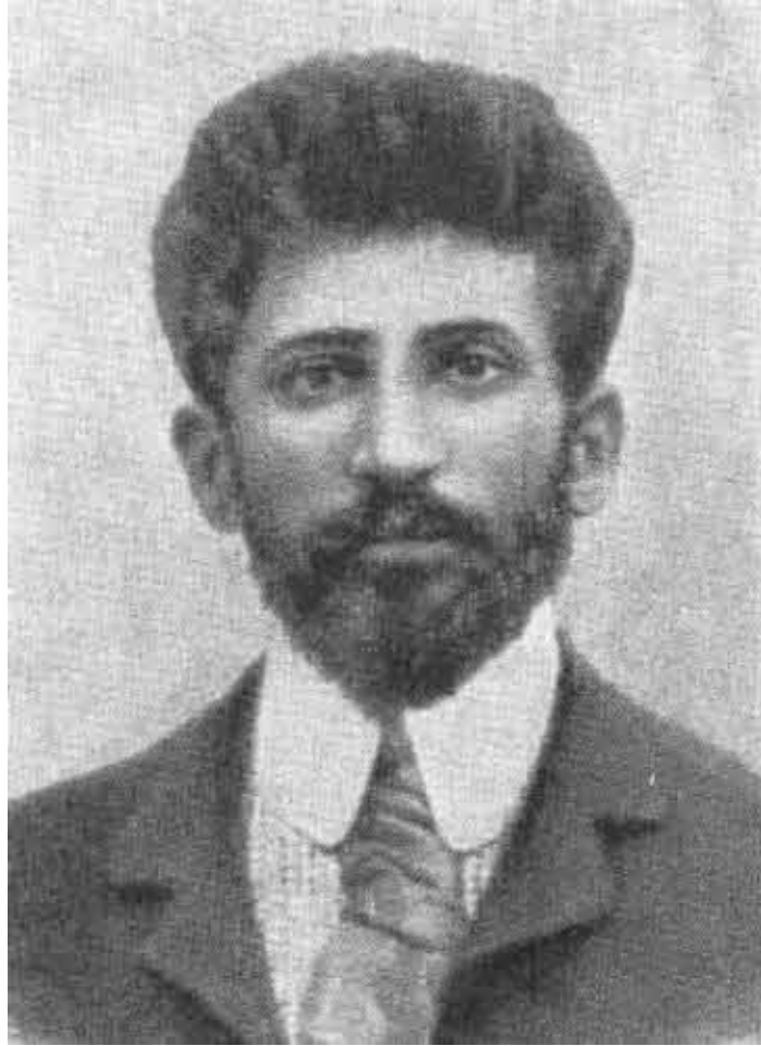
Осип Пятницкий. 1906 год.