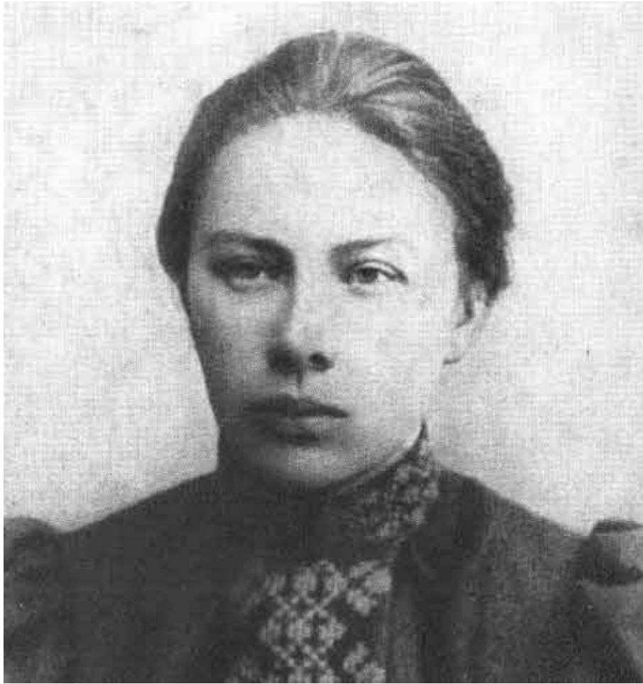
Надежда Константиновна Крупская.