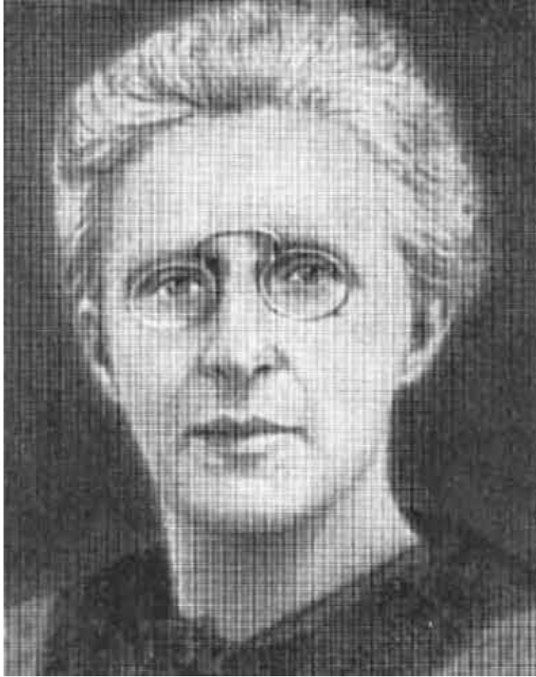
Е. Д. Стасова.