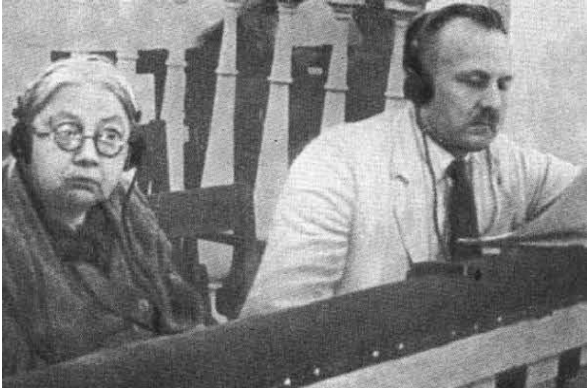
Н. К. Крупская и Вильгельм Кнорин.