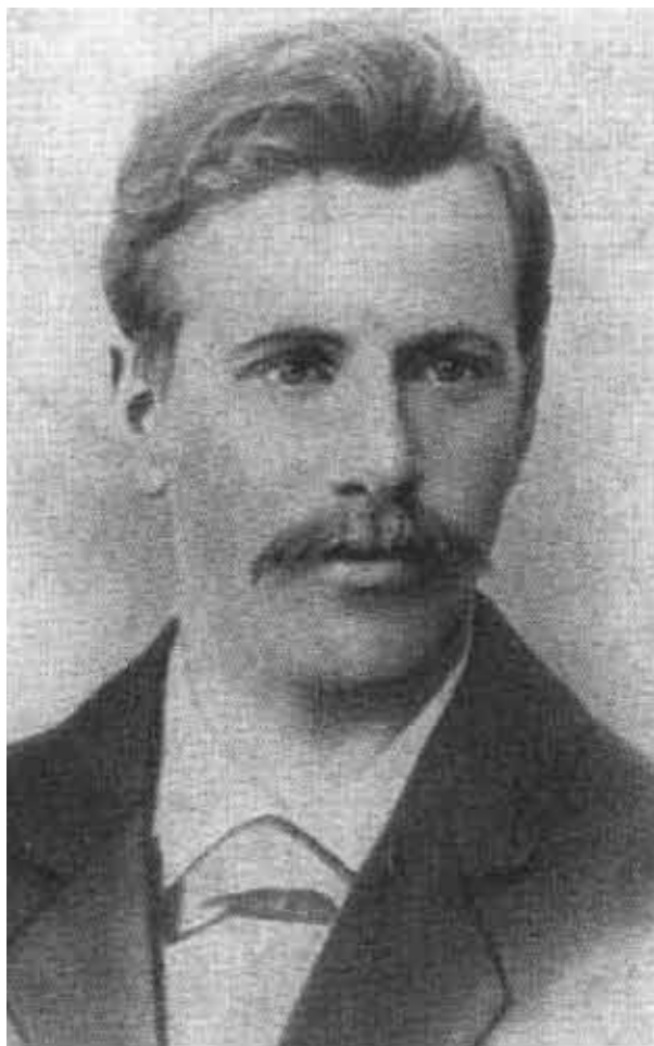
И. В. Бабушкин.