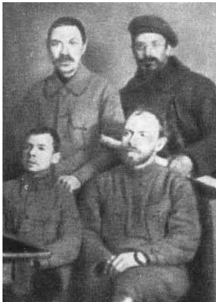
О. Пятницкий в группе делегатов IX съезда партии.