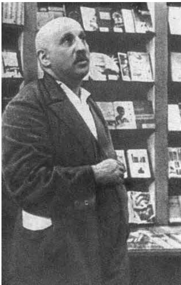
Осип Пятницкий осматривает выставку Коминтерна в Доме союзов. (Печатается впервые.)