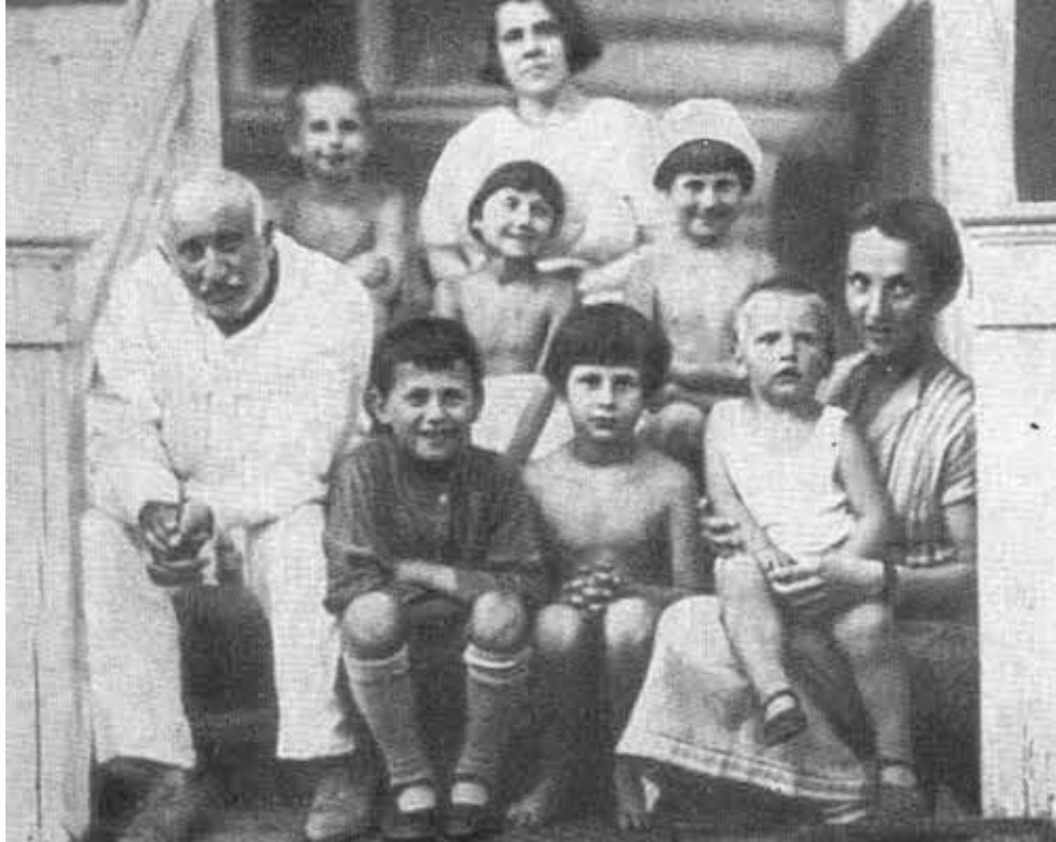
Осип Пятницкий на даче среди детей. 1937 год.