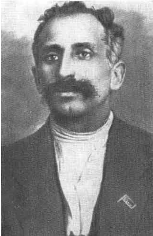
Осип Пятницкий. 1920 год.