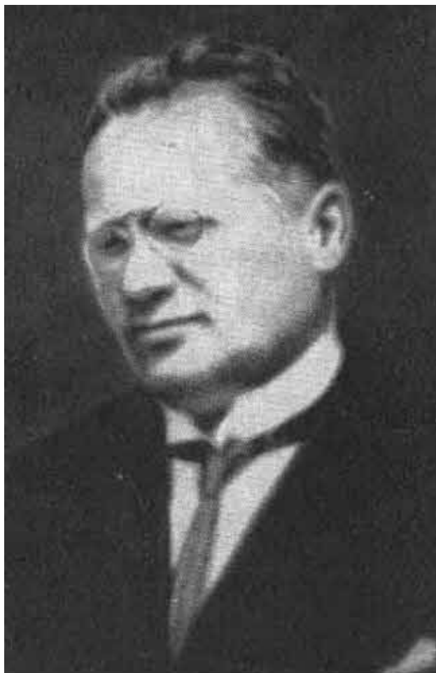
М. М. Литвинов.