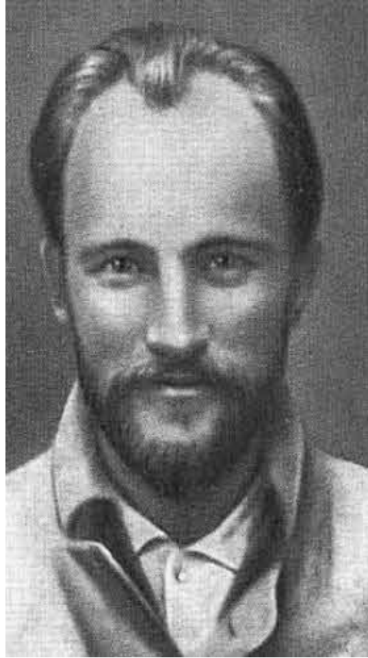
Н. Э. Бауман.