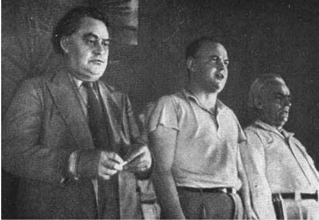
Георгий Димитров, Морис Торез и Вильгельм Пик на VII конгрессе Коминтерна. Август 1935 года.