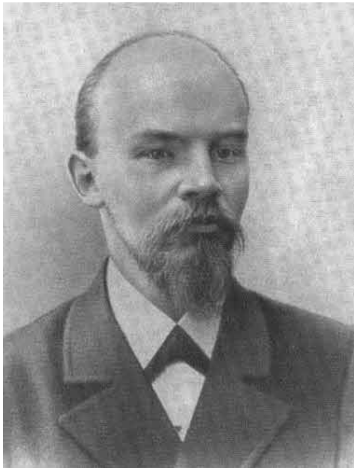
Владимир Ильич Ленин.