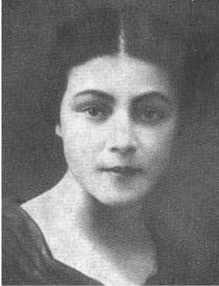
Юлия Пятницкая. 1920 год.