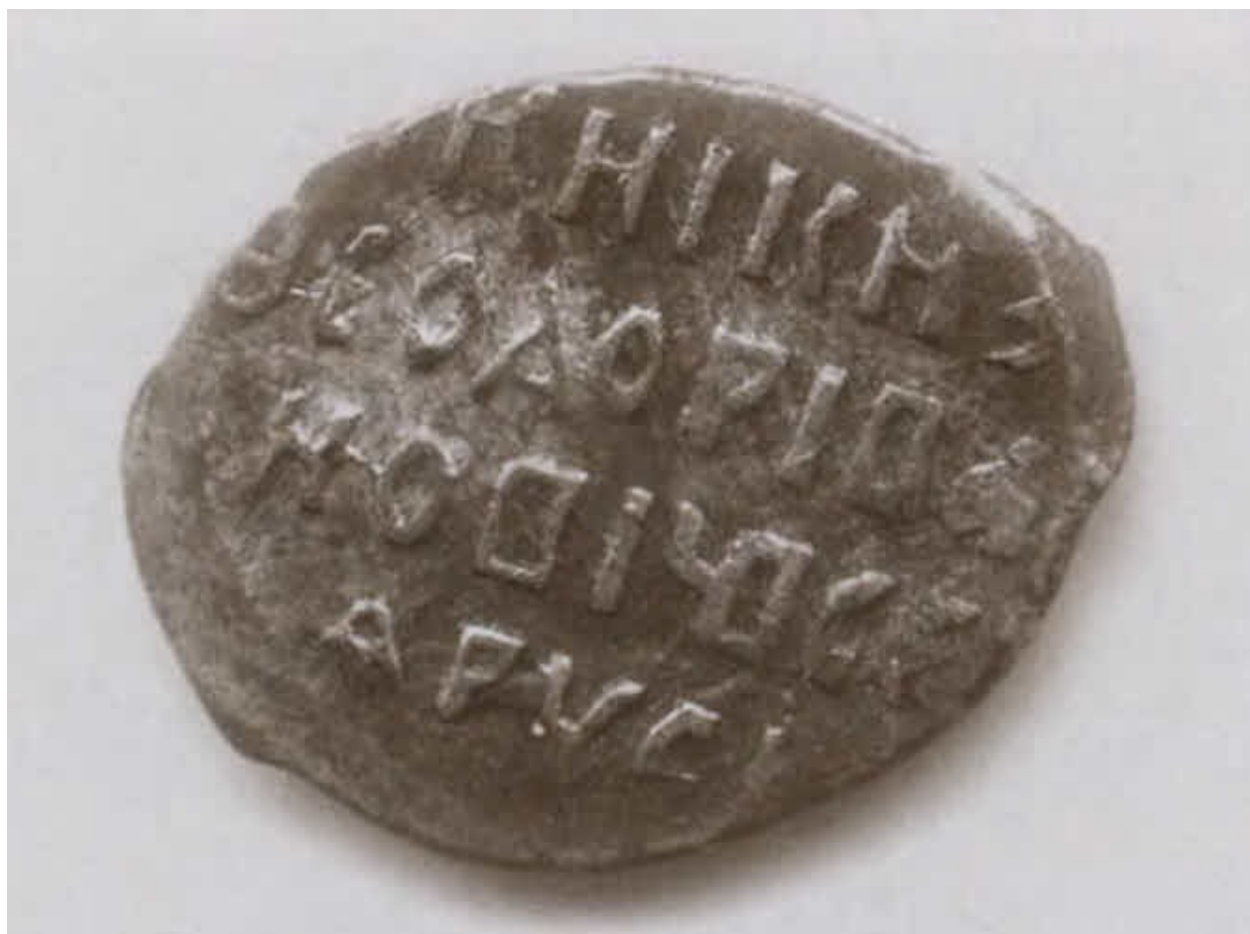
Копейка с именем царя Федора Ивановича