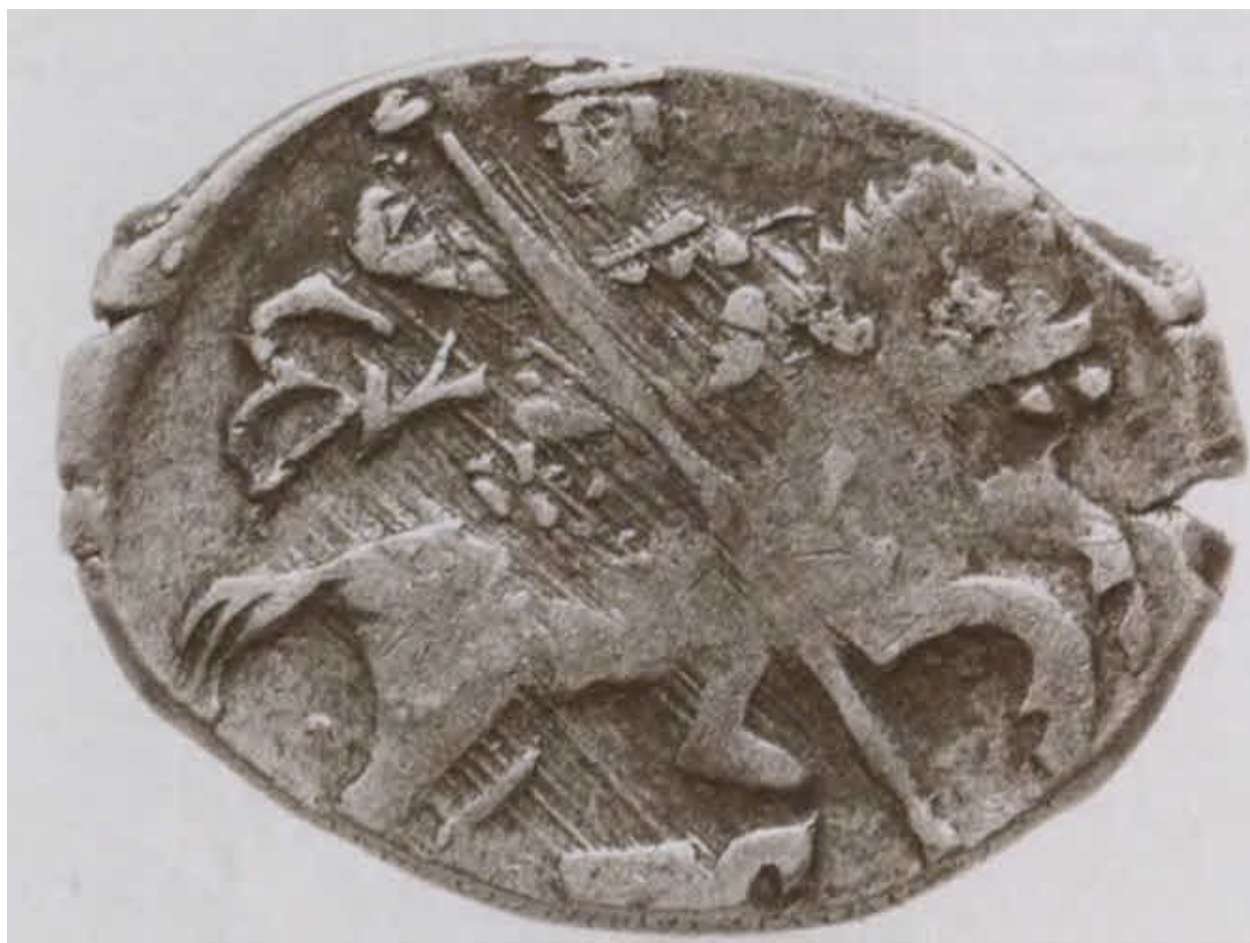
Московский ездец на монете царя Федора Ивановича