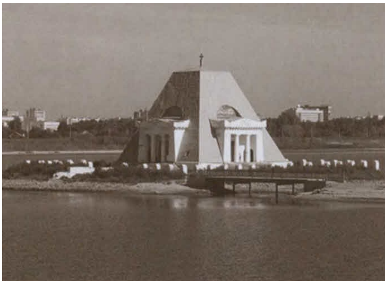
Храм-памятник воинам, павшим при взятии Казани в 1552 году