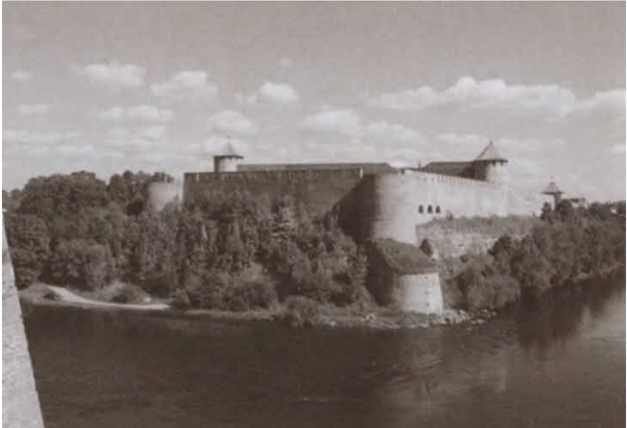
Ивангородская крепость. Построена при Иване III