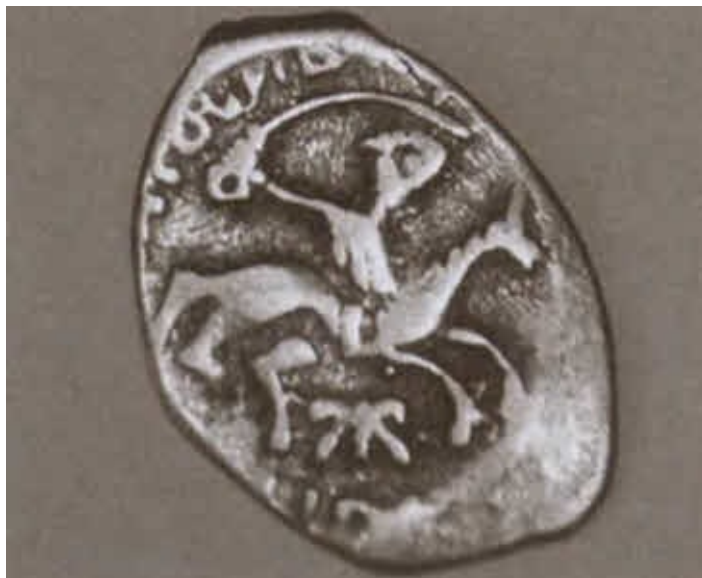
Монета Василия III