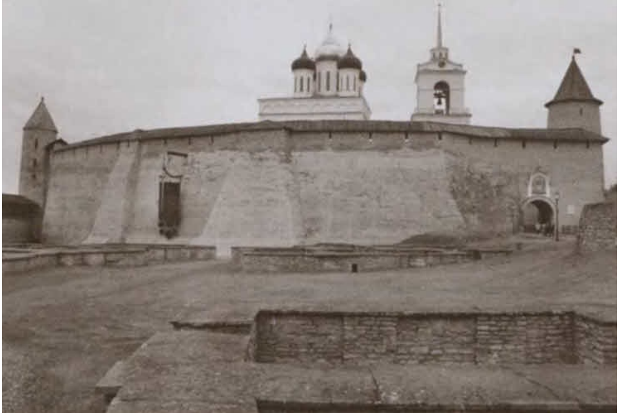
Довмонтов город древнего Пскова