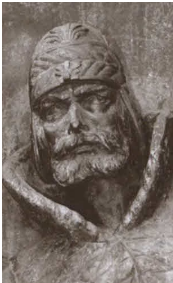
Князь Д. В. Щеня.