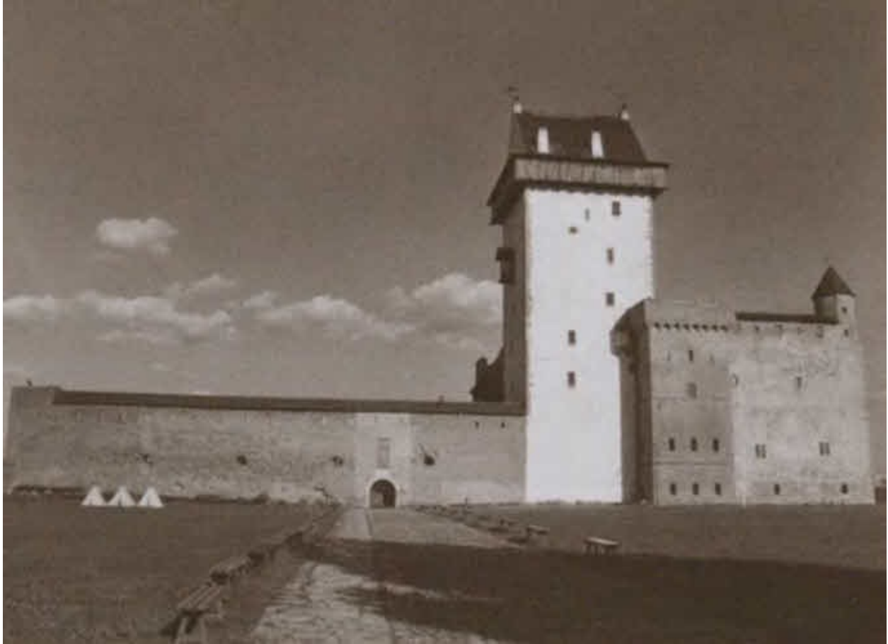
Замок Святого Германа в Нарве. Резиденция фогта Ливонского ордена