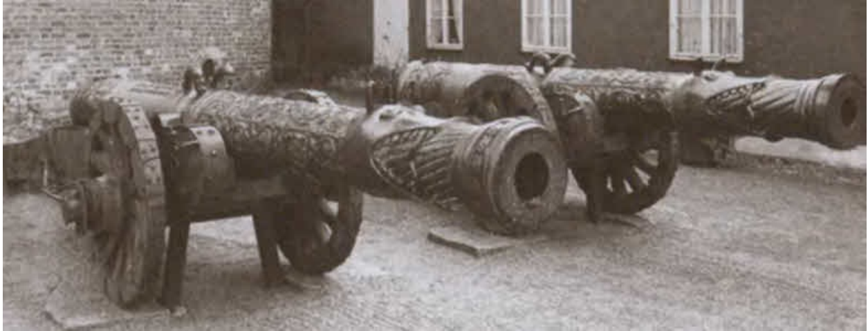
Русские пушки времен Ивана Грозного