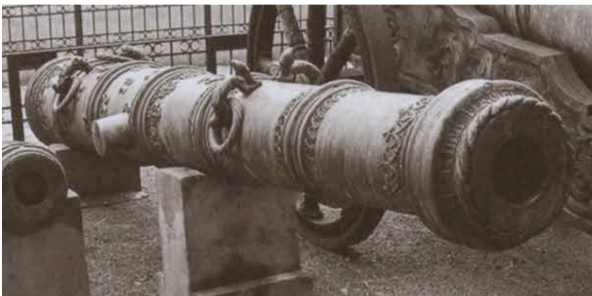
Пушка XVI века