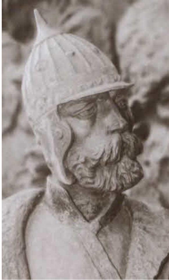
Князь Д. Д. Холмский.