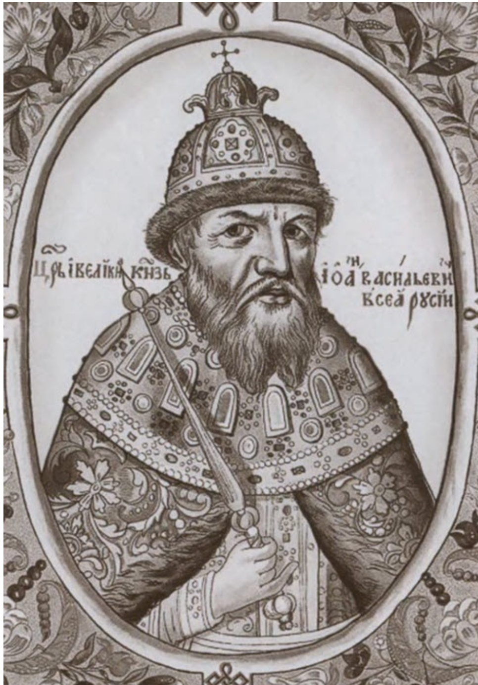
Портрет Ивана Грозного.

Из русской рукописной книги «Царский титулярник». XVII в.