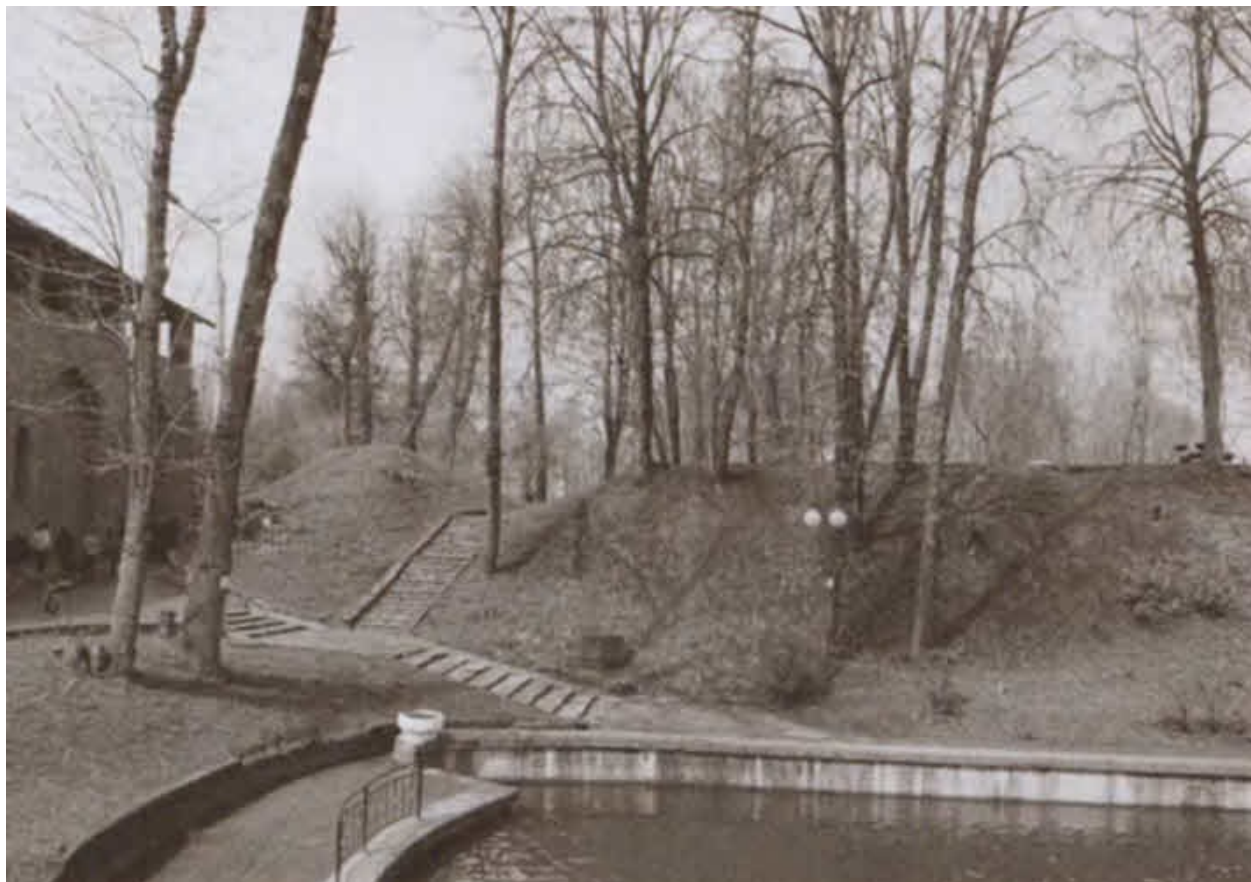
Остатки старого смоленского земляного вала литовских времен, защищавшего город в 1514 году