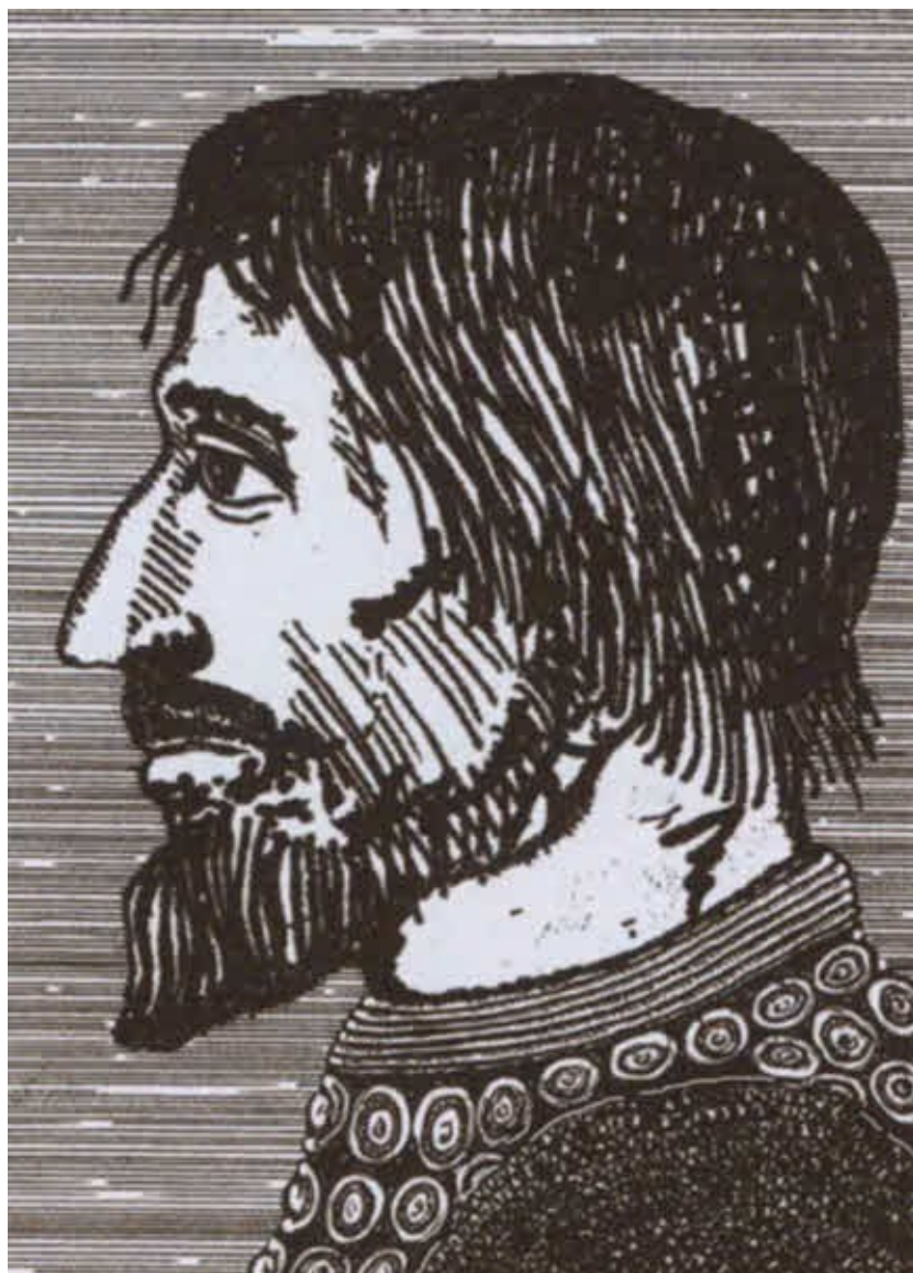
Князь И. П. Шуйский.