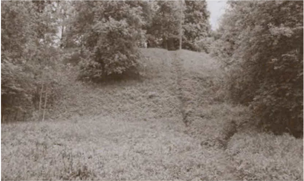
Земляные валы Опочки, отбившей в 1517 году нападение армии гетмана Острожского