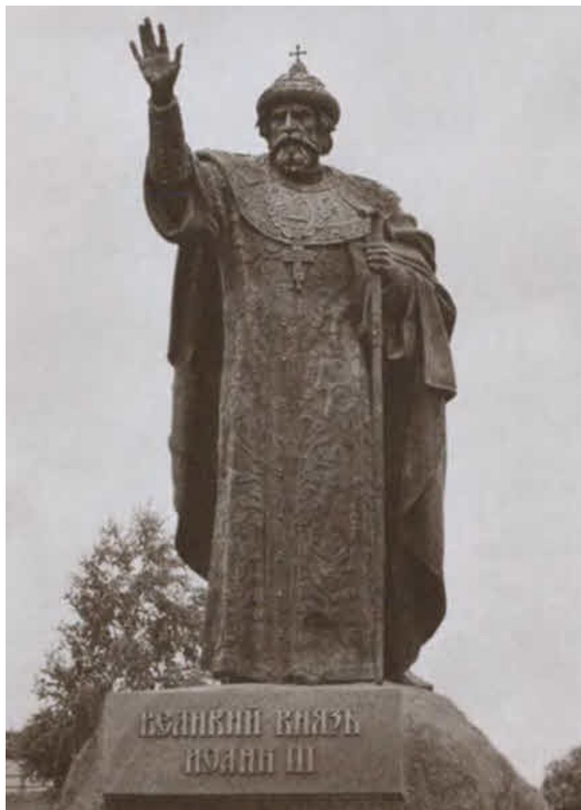
Памятник Ивану III во Владимирском ските Свято-Тихоновой пустыни