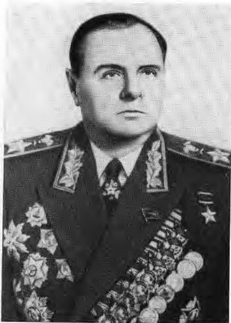
К. А. Мерецков.