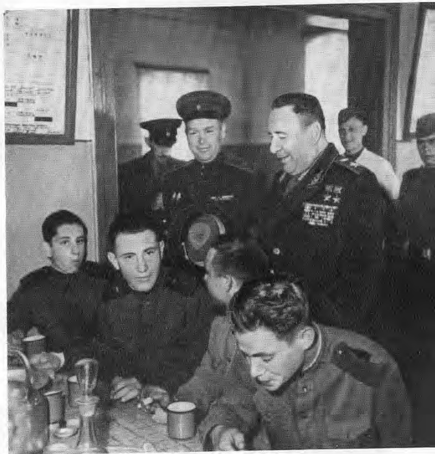
Маршал бронетанковых войск М. Е. Катукоев в воинской части. 1958 год.