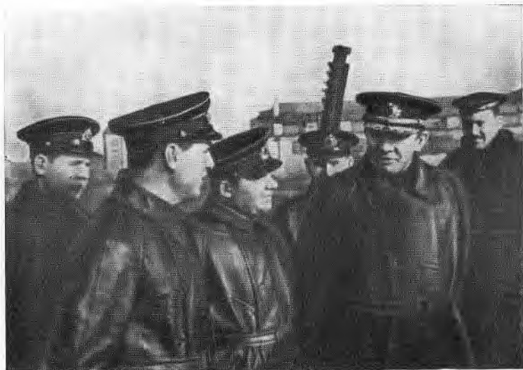
В. Ф. Трибуц (второй справа) беседует с подводниками-балтийцами.