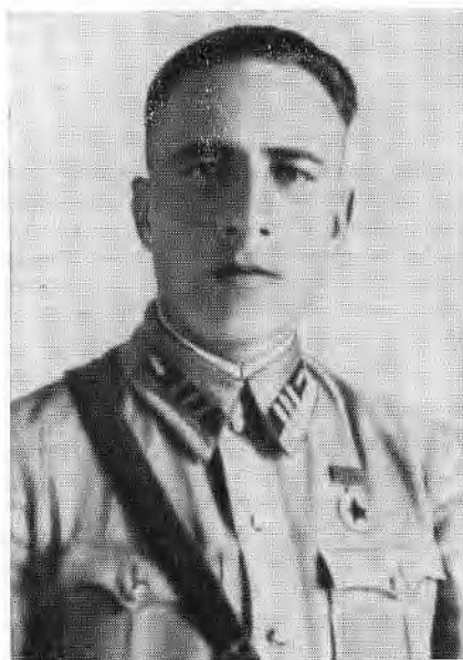
М. Е. Катукон, 1940 год.

Подмосковье. Волоколамское направление. После вручения наград 1-й гвардейской бригаде. Ноябрь 1941 года.