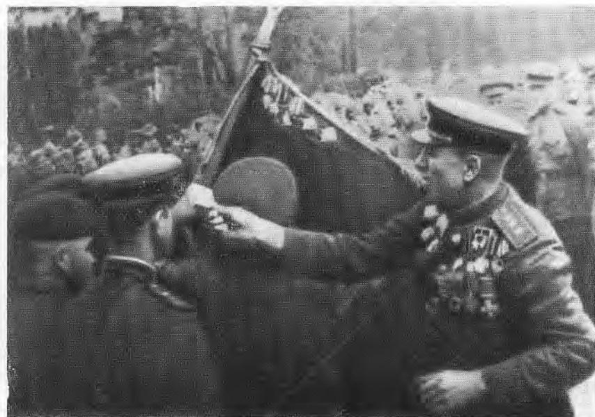
М. Е. Катукоев вручает шестой орден 1-й гвардейской танковой бригаде. Май, 1945 год. Берлин.