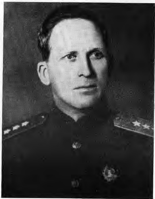
И. Т. Пересыпкин, 1943 год.