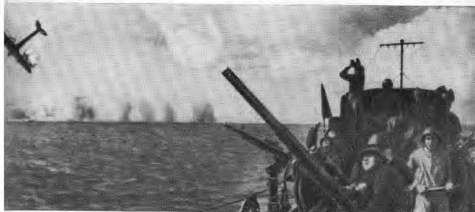
Фашистский стервятник сбит.