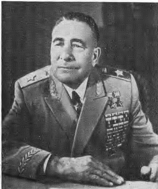
М. Е. Катуков. Одна из последних фотографий.