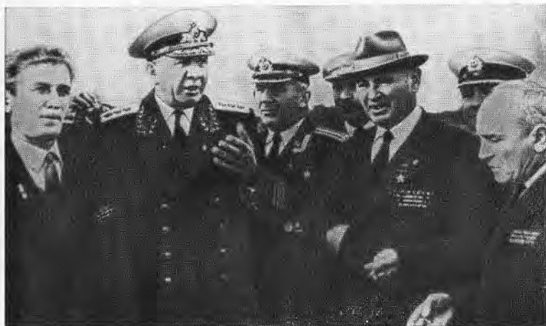
В. Ф. Трибуц среди ветеранов Краснознаменного Балтийского флота.