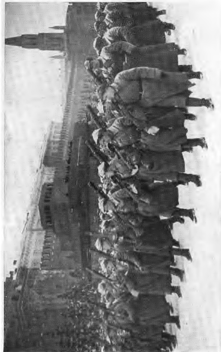
Парад 7 ноября 1941 года.

Делать нечего. Пока пара танков мчится к КП, организуем круговую оборону подручными силами. Несколько связистов и личная охрана развернулись в жидкую цепочку и залегли с автоматами. Минут пятнадцать отбивались. Но вот показали наши танки. Сразу же наши бойцы поднялись в атаку, следуя за танками, смяли фаши-