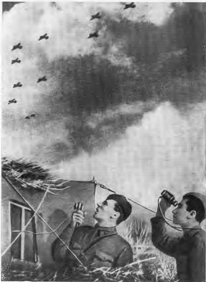
В небе Кубани.

стов и отбросили на полкилометра, а потом подоспевшая пехота завершила разгром прорвавшейся вражеской группировки. Когда стрельба улетела, в блиндаж вошел танкист, весь в копоти, и доложил: «Товарищ генерал армии, ваше приказание выполнено. Прорвавшийся противник разгромлен и отброшен!»