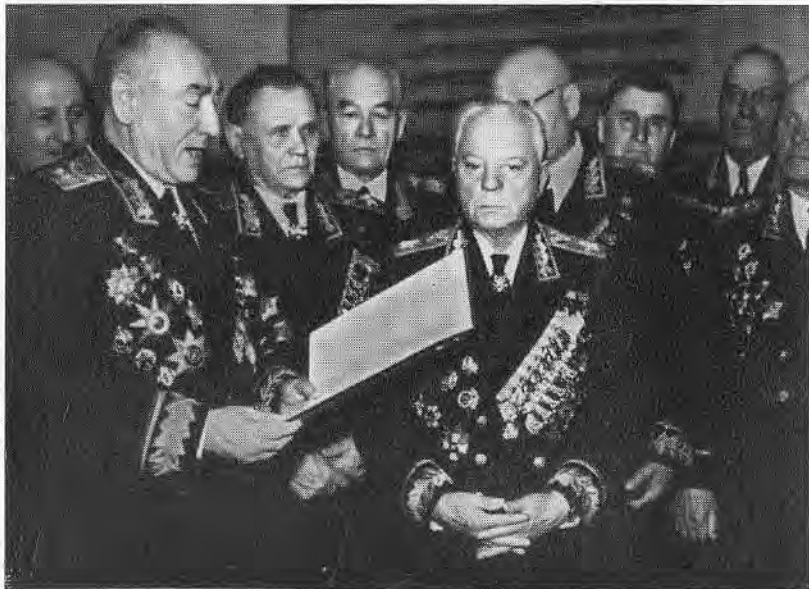
С. С. Бирюзов вручает приветственный адрес К. Е. Ворошилову.