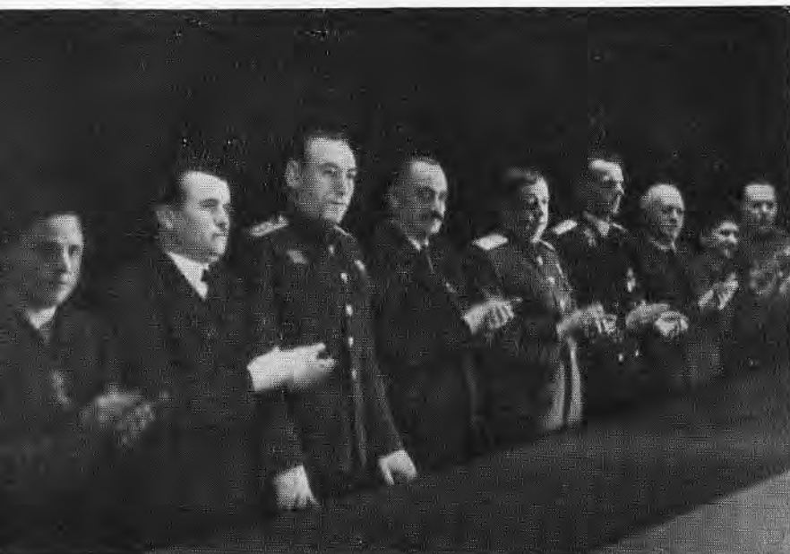
С. С. Бирюзов на торжественном собрании в Софии.