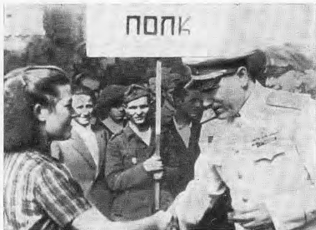
С. С. Бирюзов беседует с молодежью Софии.