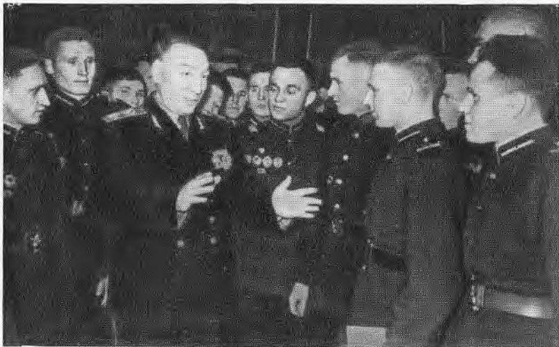
С. С. Бирюзов беседует с воинами войск ПВО, 1952 год.