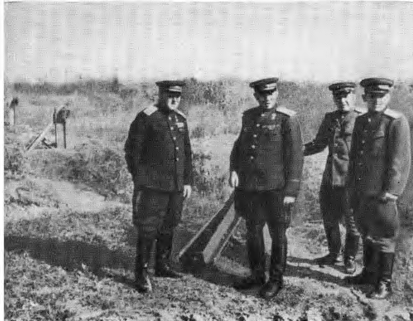
Командующий 1-м Дальневосточным фронтом К. А. Мерецков осматривает японские укрепления.