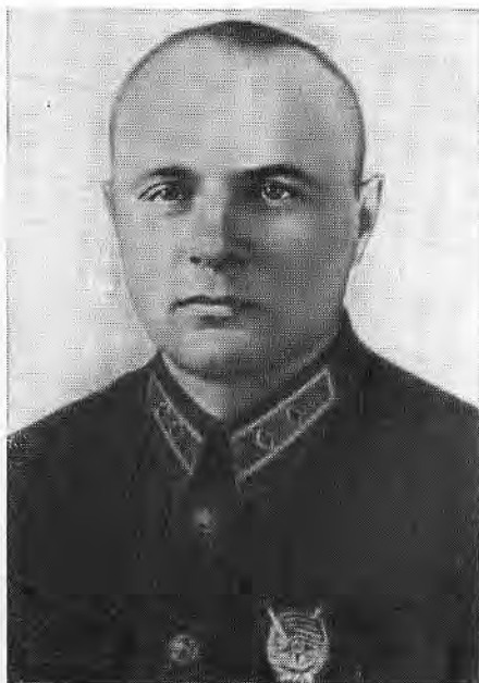
К. А. Мерецков — начальник Генерального штаба.