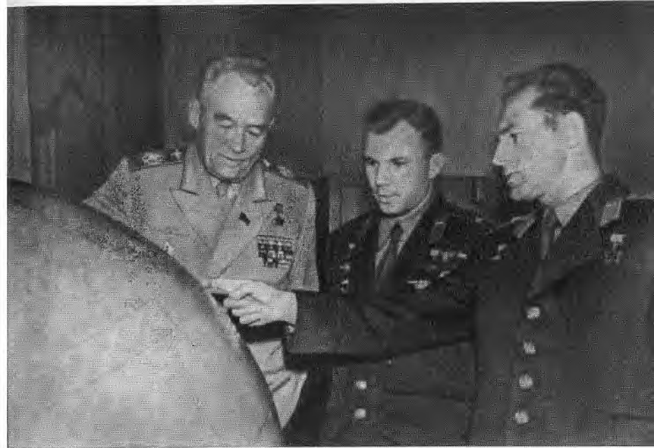
К. А. Вершинин беседует с Ю. Гагариным и Г. Титовым.