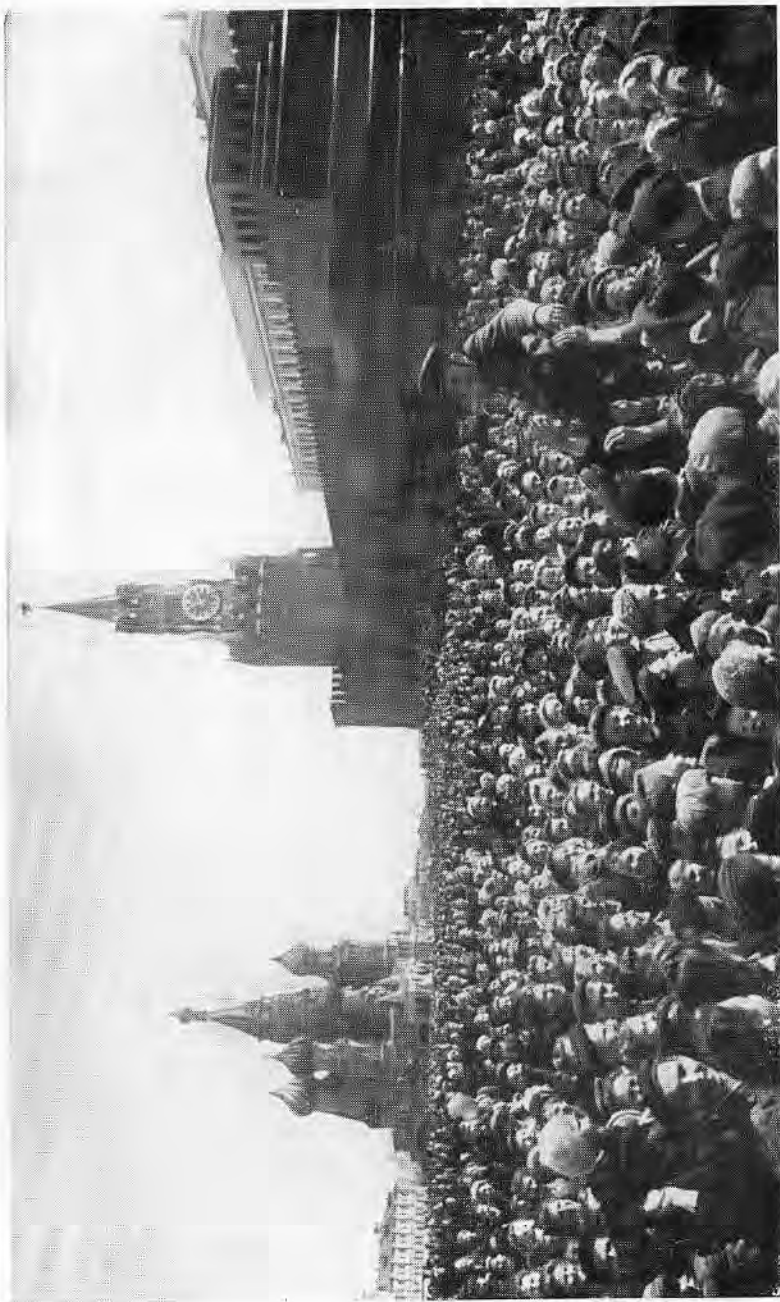
День Победы.

ционных аэродромах Крыма, а также на Таманском полуострове до 1000 самолетов 4-го воздушного флота, что составляло 38 процентов всей его авиации на советско-германском фронте. Для действий на Кубани он мог привлечь еще и часть бомбардировщиков (до 200 самолетов), находившихся в Донбассе и на юге Украины. Противостоять такому превосходству противника — это дело сложное. А нужно было сокрушать его.