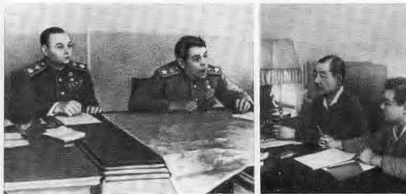
Маршалы Советского Союза А. М. Василевский и К. А. Мерецков допрашивают пленного японского генерала Х. Хата.