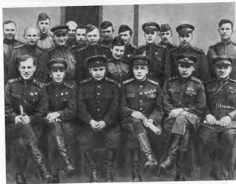
Командующий ВВС Кавказского фронта К. А. Вершинин с группой генералов и офицеров управления 4-й воздушной армии, 1943 год.