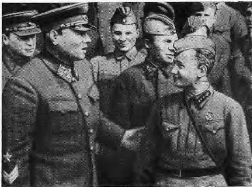
К. А. Мерецков среди участников слета снайперов Волховского фронта, 1942 год.