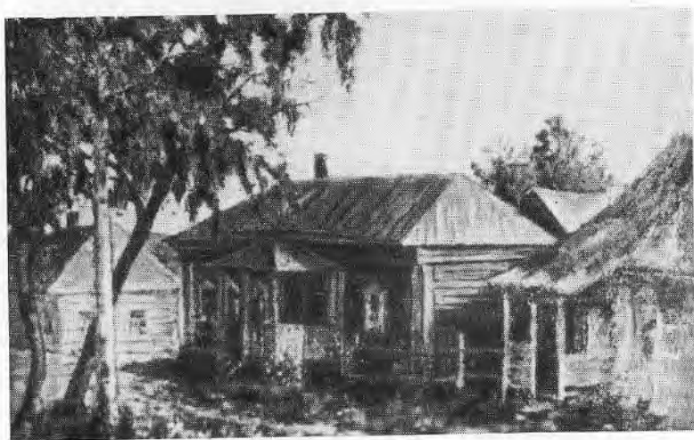
Дом, где родился М. Е. Катюков.