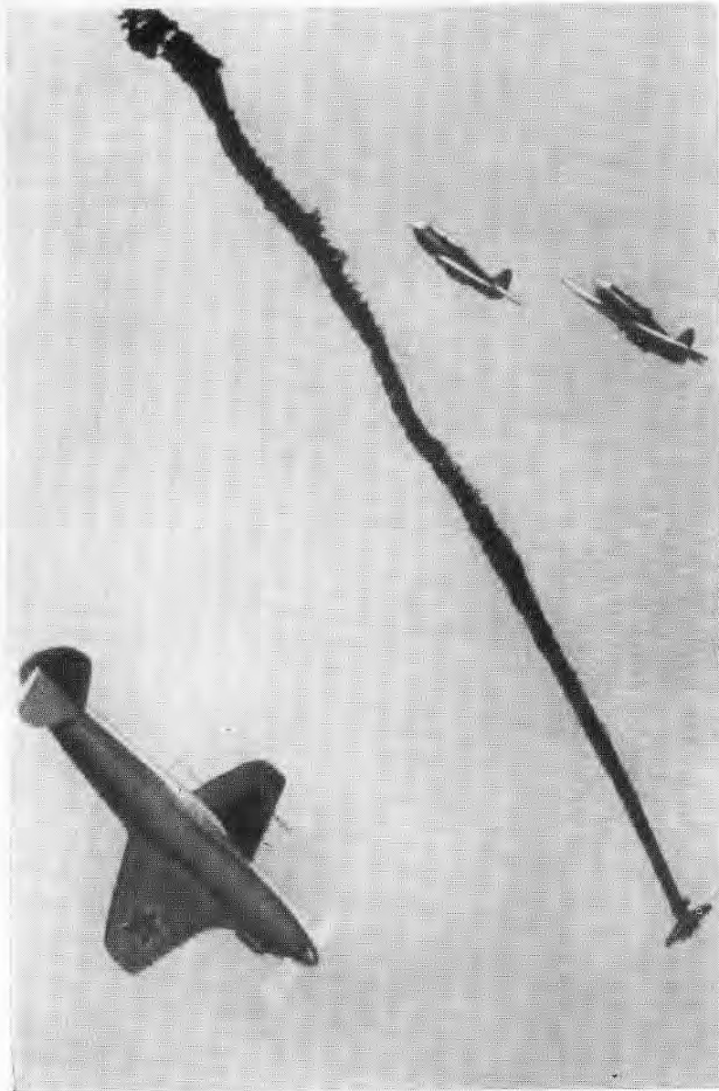
Еще один «мессер» сбит.

Подумать было над чем. В общей сложности к тому времени в составе ВВС фронта было около 600 самолетов (250 — в 4-й, 200 — в 5-й воздушных армиях, 70 — в авиагруппе Черноморского флота и 60 самолетов группы дальней авиации). Противник же сосредоточил на ста-