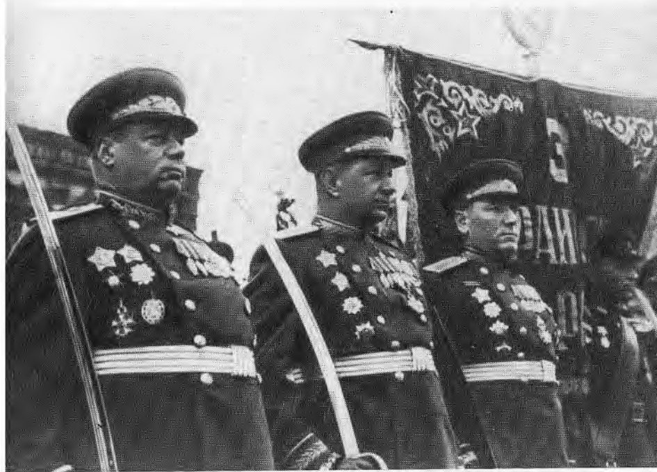
Генерал-полковник С. С. Бирюзов на Параде Победы.