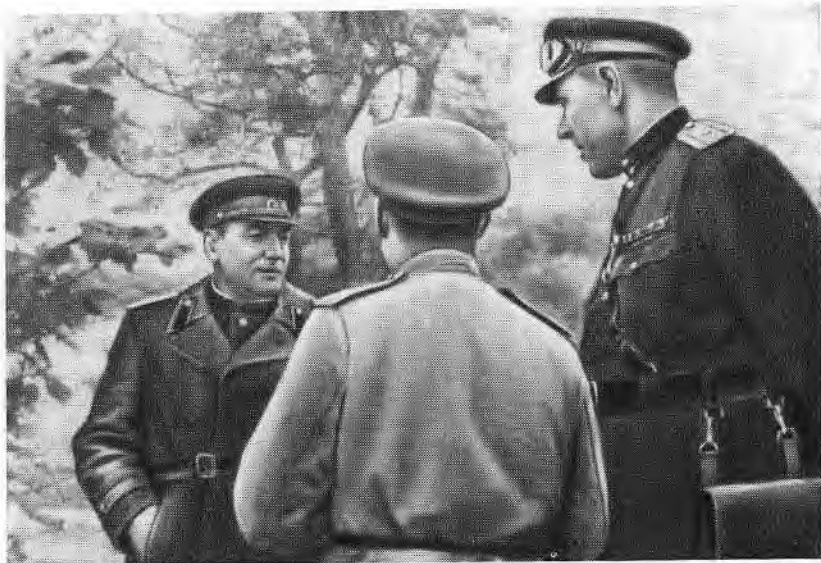
Генерал-лейтенант С. С. Бирюзов беседует с офицерами. Крым, 1944 год.