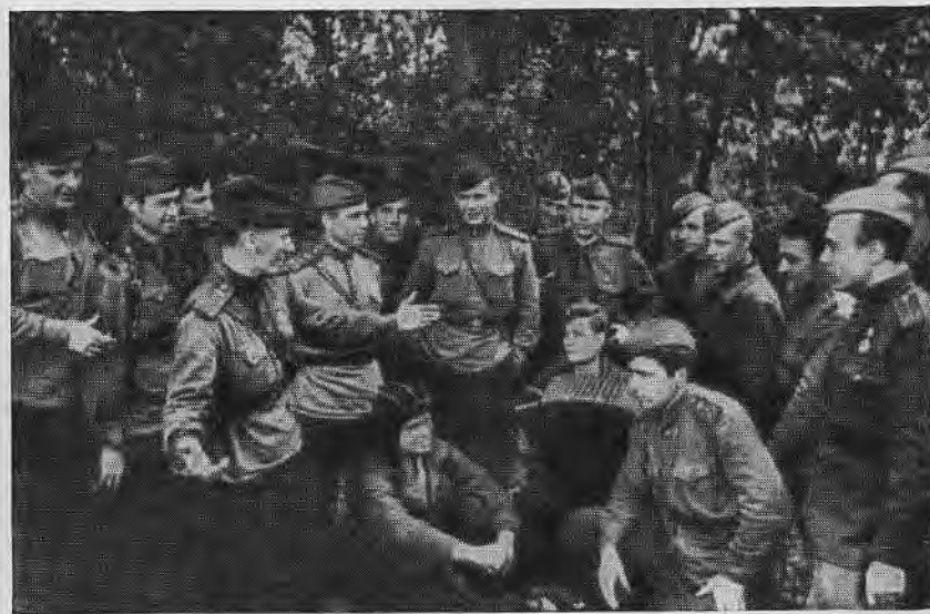
Танкисты на отдыхе.