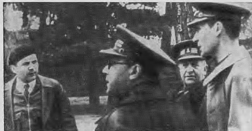
Советник Р. Я. Малиновский в республиканской Испании. 1937 г.