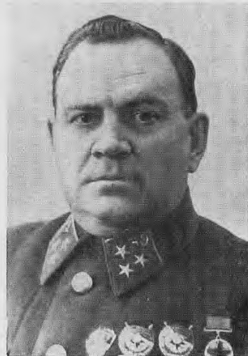
Начальник тыла Красной Армии генерал-лейтенант А. В. Хрулев.