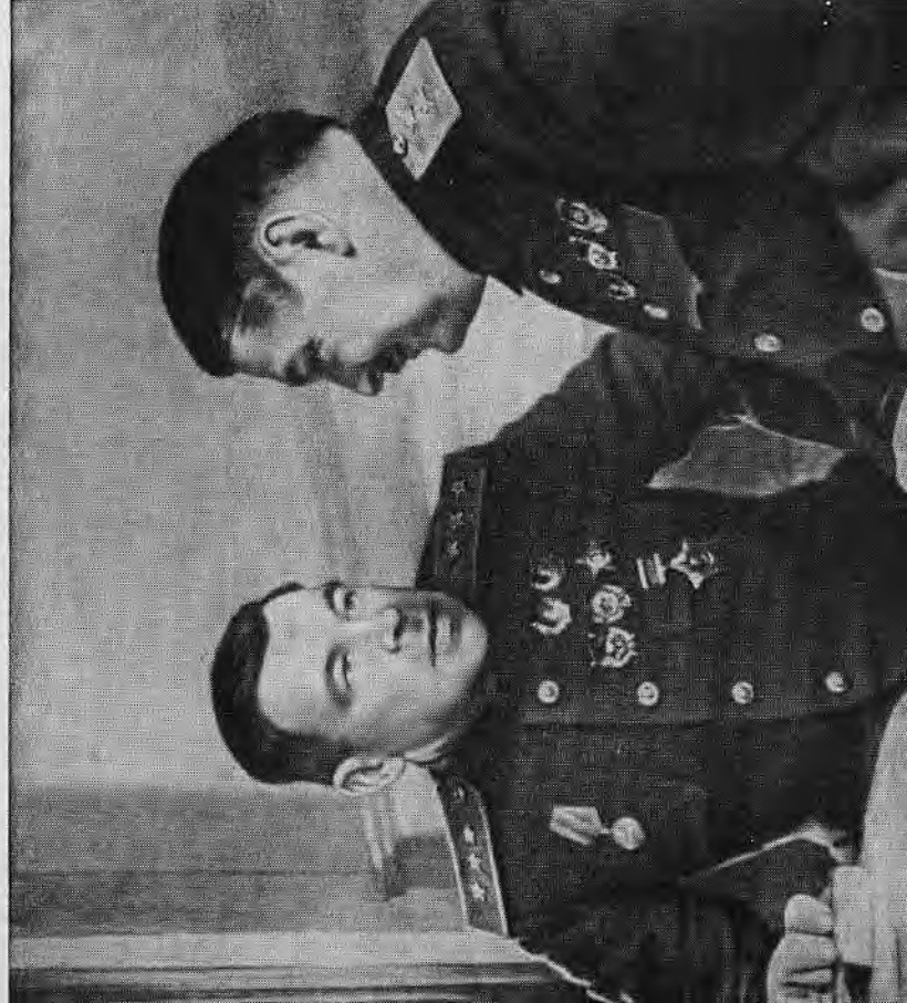
Командующий войсками Ленинградского фронта Л. А. Говоров и член Военного совета фронта А. А. Жданов.