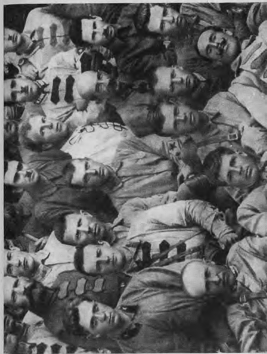
Комбриг К. К. Рокоссовский (сидит в центре) среди командиров и политработников — участников разгрома банд барона Унгерна в 1921—1922 гг.