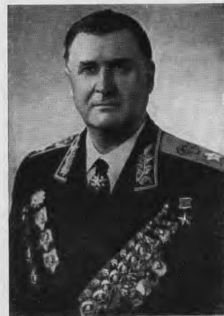
Маршал Советского Союза В. Д. Соколовский.