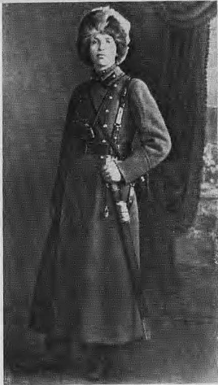
Выпускник Первых артиллерийских курсов Н. Н. Воронов. 1920 г.