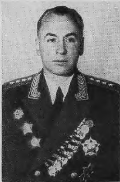
Генерал армии А. И. Антонов.