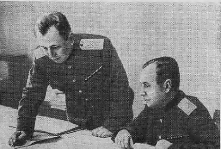
А. И. Антонов (справа) и С. М. Штеменко за изучением обстановки на фронтах, 1943 г.