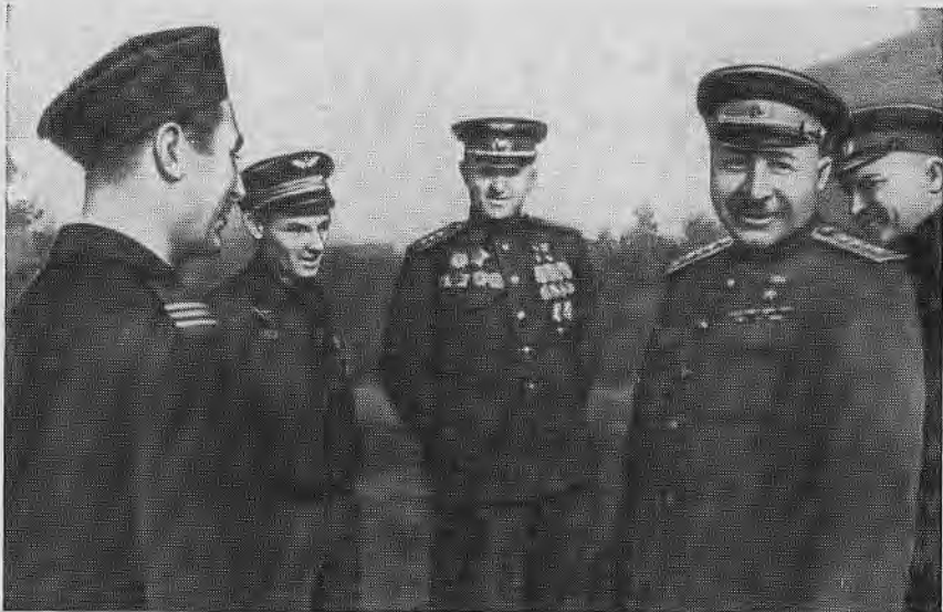
Командующий войсками Первого Прибалтийского фронта генерал армии И. Х. Баграмян и генерал-полковник авиации Т. Т. Хрюкин среди французских летчиков-добровольцев полка «Нормандия — Неман».

На приеме у главнокомандующего Военно-Воздушных Сил Советской Армии Главного маршала авиации А. А. Новикова в связи с отъездом французских летчиков-добровольцев из полка «Нормандия — Неман» на родину. Второй слева стоит генерал Т. Т. Хрюкин.