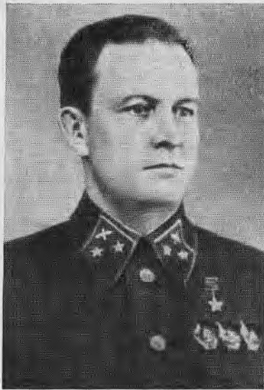
Генерал-майор Т. Т. Хрюкин.

Военный совет Четвертого Украинского фронта. Слева направо: генерал-лейтенант авиации Т. Т. Хрюкин, начальник штаба фронта генерал-лейтенант С. С. Бирюзов, член Военного совета фронта генерал-майор Н. Е. Субботин, командующий войсками фронта Ф. И. Толбухин.