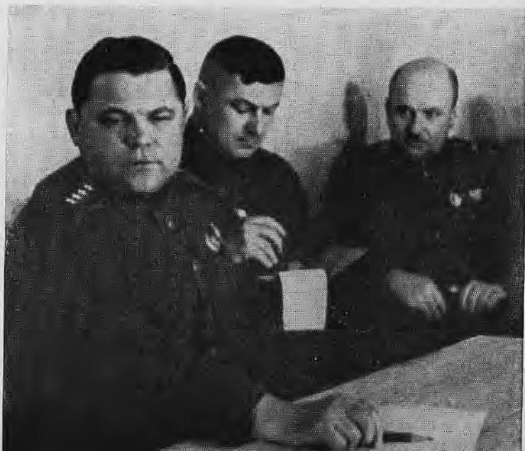
Под Сталинградом. Слева направо: командующий войсками Юго-Западного фронта генерал армии Н. Ф. Ватутин, член Военного совета фронта генерал-майор А. С. Желтов, командующий воздушной армией генерал-майор авиации С. А. Красовский. 1943 г.