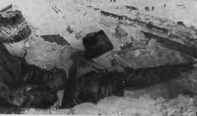
Командующий Донским фронтом генерал-полковник К. К. Рокоссовский и член Военного совета фронта К. Ф. Телегин на НП командующего Шестьдесят пятой армией. 30 января 1943 г.