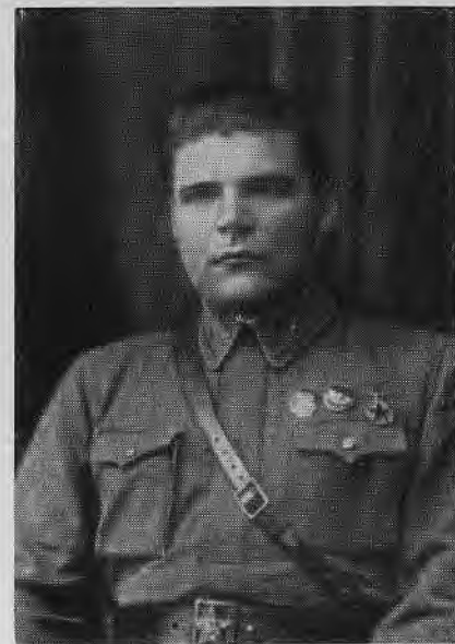
Комбриг Р. Я. Малиновский.