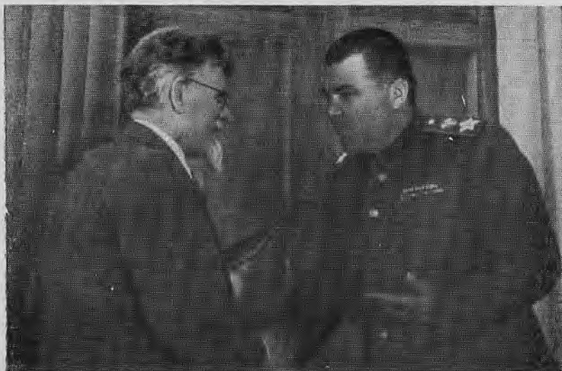
М. И. Калинин вручает правительственную награду Маршалу Советского Союза Р. Я. Малиновскому.

пулемета и несколько десятков стрелков, неприятелю удалось окружить. Но и в окружении никто не дрогнул. Бойцы почти сутки дрались героически, пока подоспевшее подкрепление не отбросило наседавшего противника. Отличившиеся в бою храбрецы получили награды Франции. Среди удостоенных французского военного креста был и начальник пулемета Родион Малиновский.