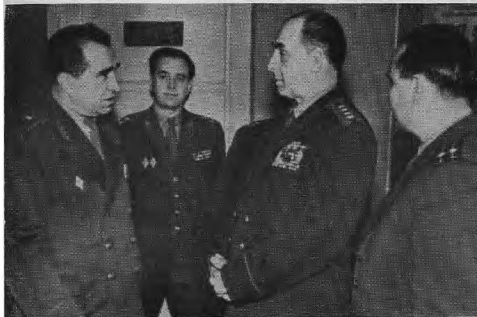
Генерал армии А. И. Антонов на встрече с воинами-избирателями.