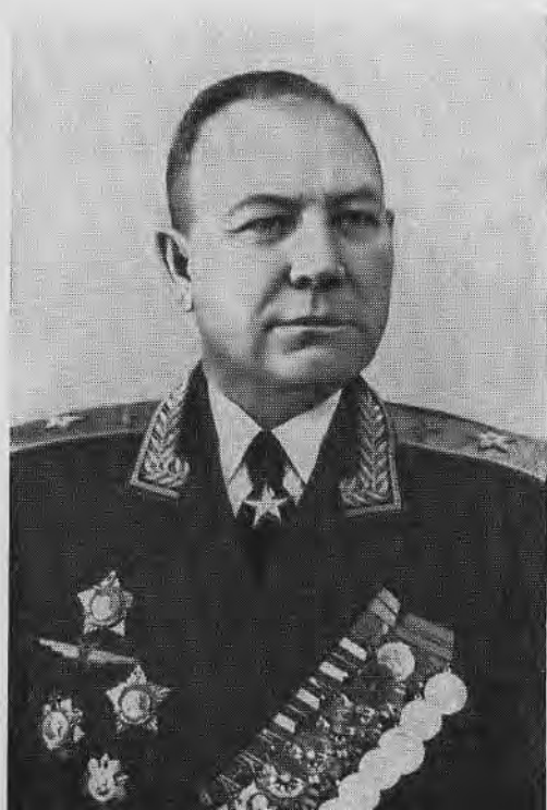
Маршал авиации С. Ф. Жаворонков.