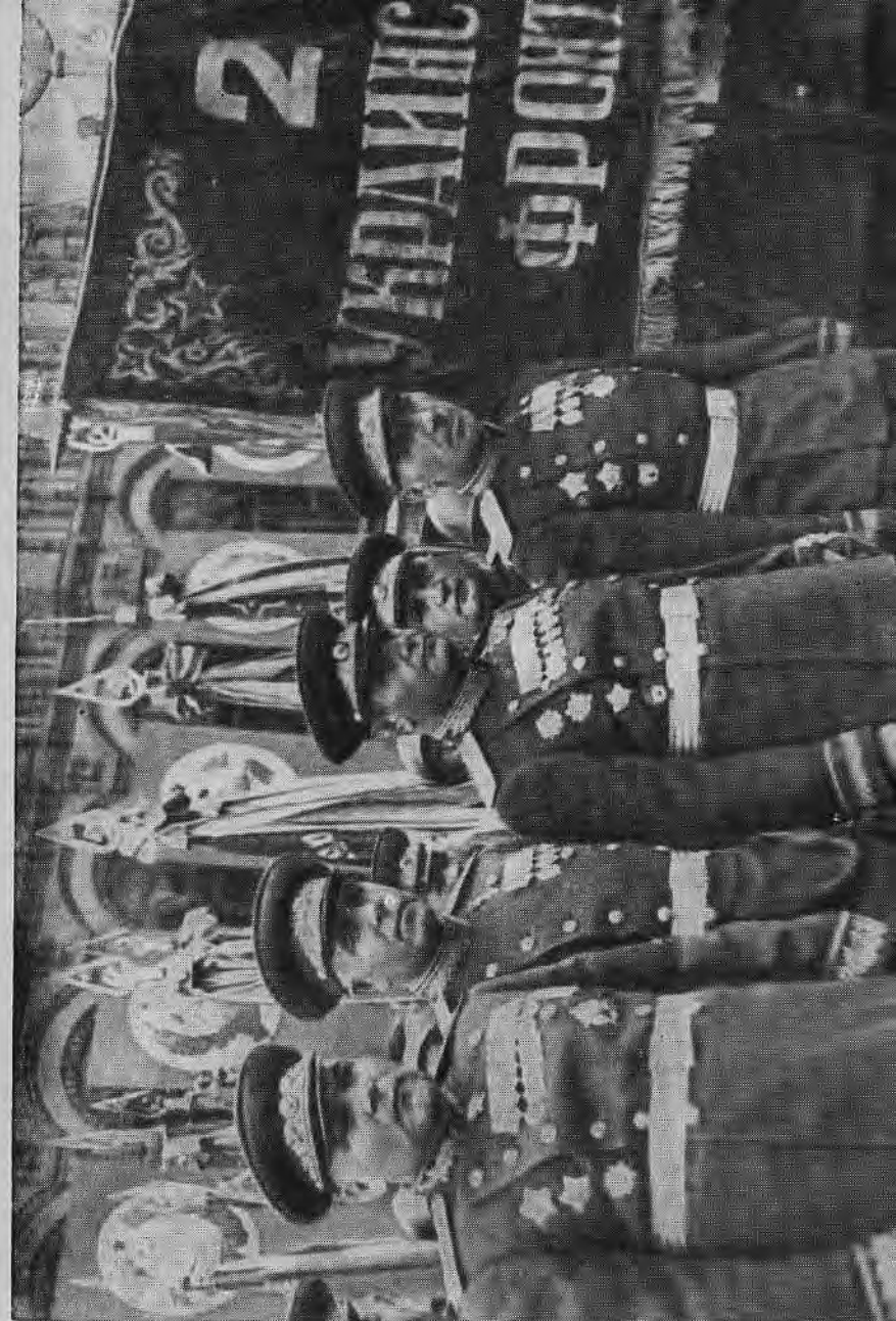
Сводный полк Второго Украинского фронта во главе с Р. Я. Малиновским на параде Победы. Москва, 24 июня 1945 г.

Андрей Васильевич расценивал обеспечение армии не как хозяйственную, снабженческую функцию, а как оперативно-стратегическую деятельность, как важнейшую государственную задачу. Став начальником тыла Советской Армии, генерал Хрулев интересовался буквально всеми деталями работы сложнейшего тылового организма, спускался до самых «низов», принимал энергичные меры, направленные на лучшее снабжение войск всем необходимым.