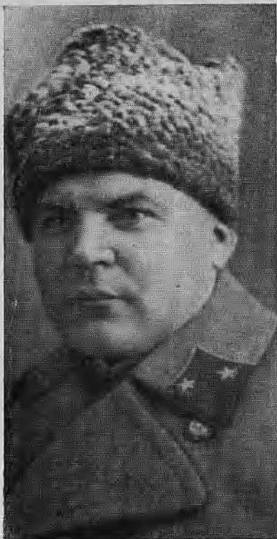
Генерал-майор Р. Я. Малиновский.