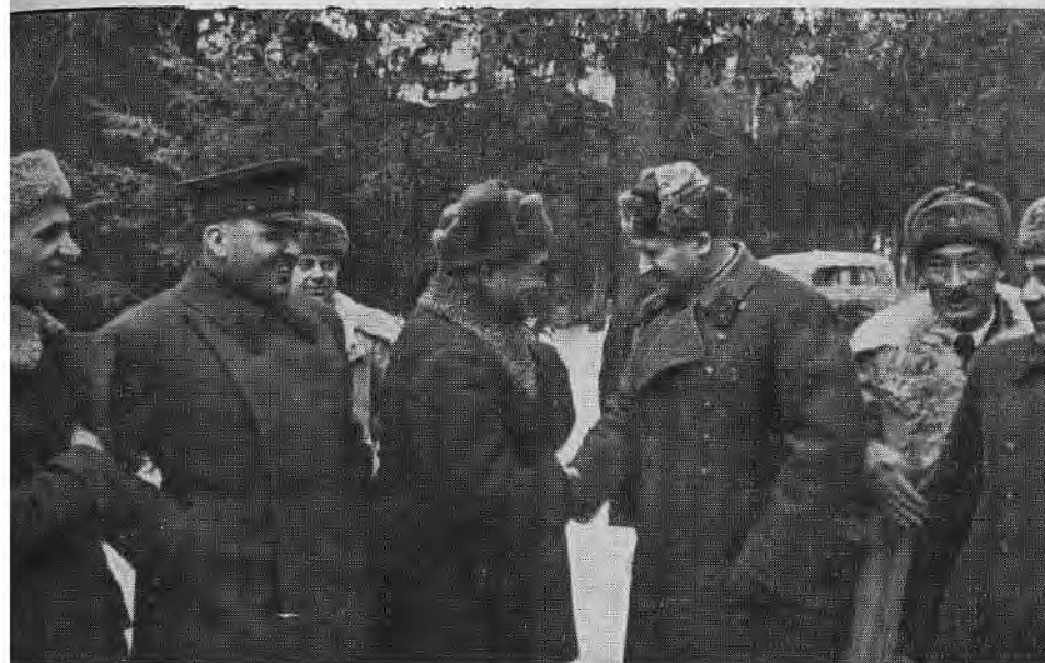
В. Д. Соколовский на Западном фронте. 1942 г.