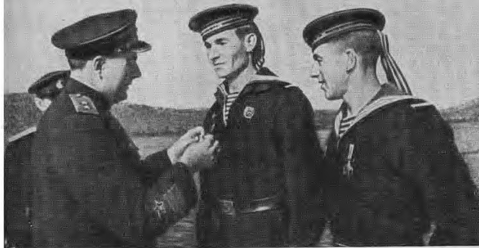
Командующий Северным флотом адмирал А. Г. Головкин вручает награды морякам «Гремящего».