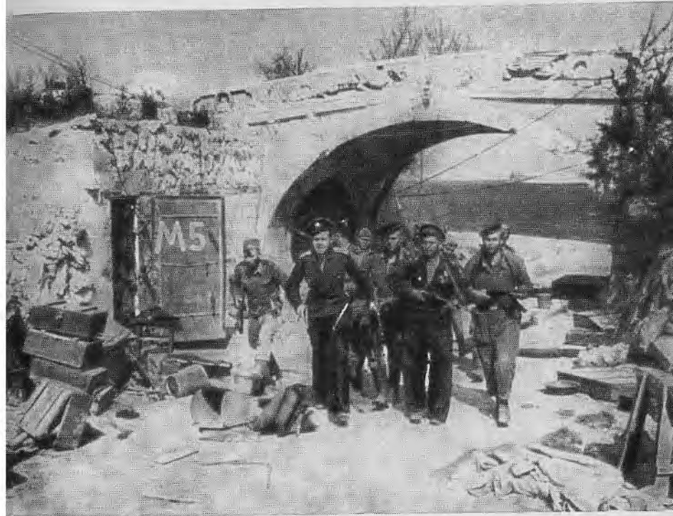
В освобожденном Севастополе.