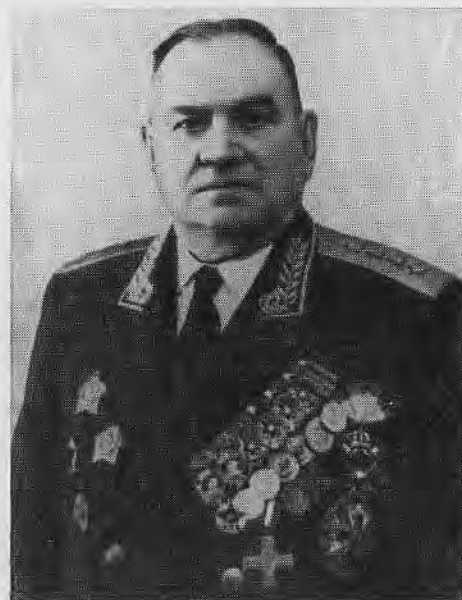
Генерал армии А. В. Хрулев.