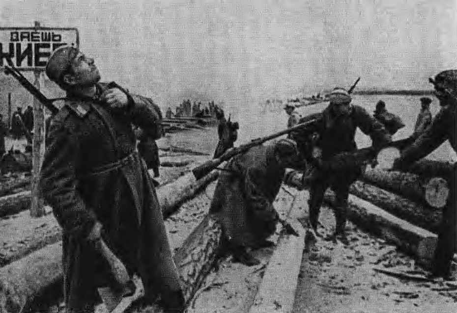
Первый Украинский фронт. Подготовка к боям за освобождение столицы Украины Киева. Саперы наводят переправу. 1943 г.