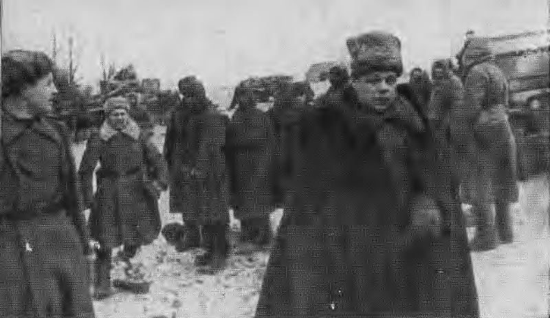
Командующий Третьей танковой армией П. С. Рыбалко. Польша, 1944 г.