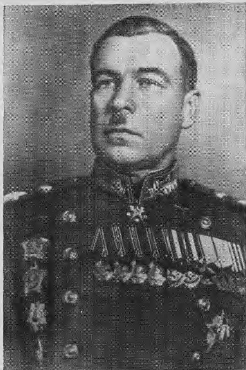
Маршал Советского Союза Л. А. Говоров.

На Ленинградском фронте. Над освобожденной Гатчиной поднят красный флаг.