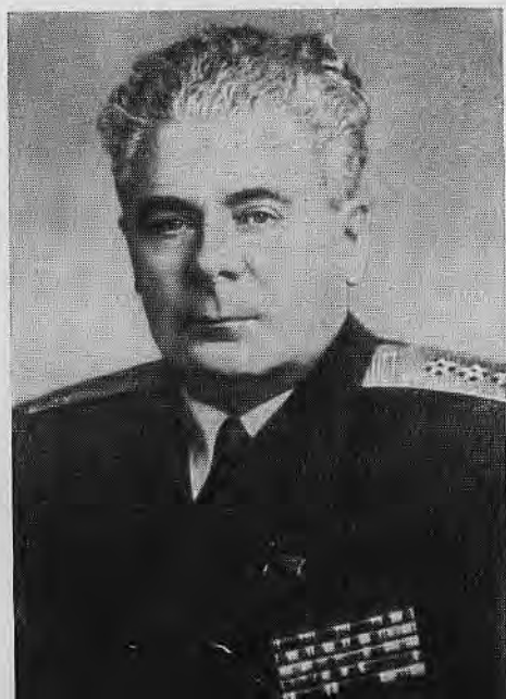
Адмирал А. Г. Головко.