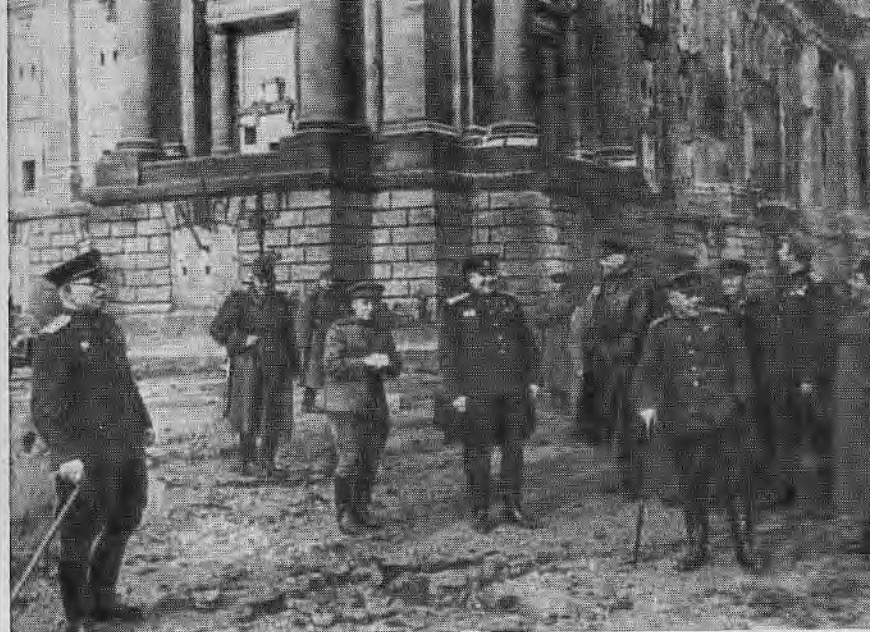
Командарм П. С. Рыбалко с группой генералов и офицеров у стен поверженного рейхстага. 2 мая 1945 г.