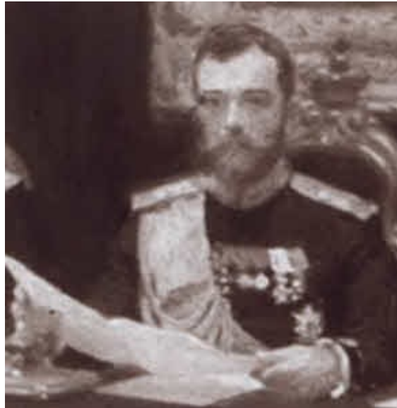
Император Николай II. Фрагмент