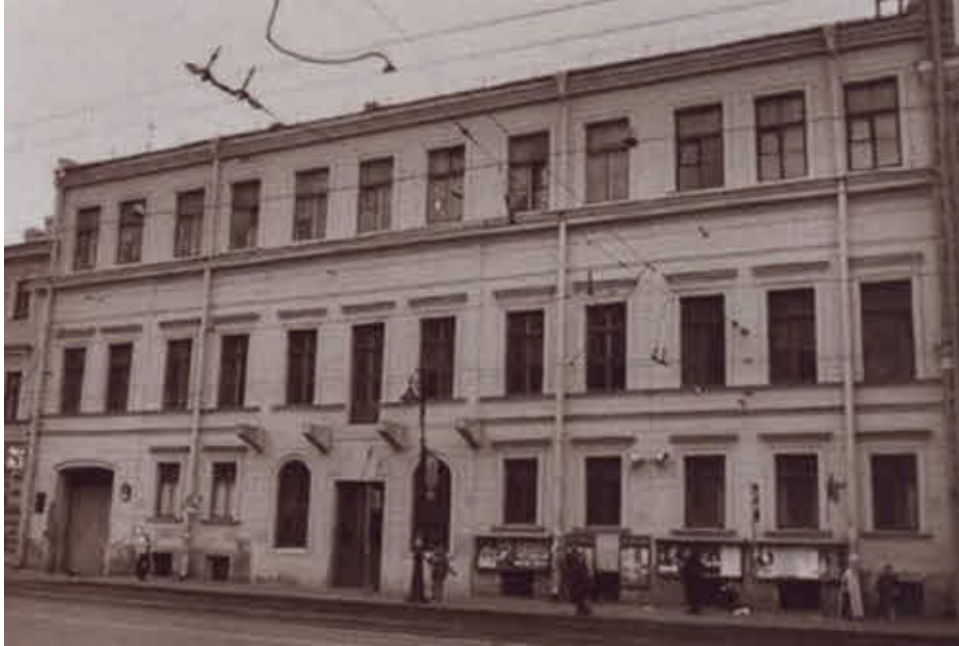
Дом обер-прокурора Святейшего синода в Санкт-Петербурге на Литейном проспекте.