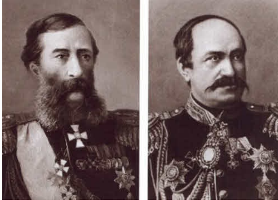
Министр внутренних дел Михаил Тариелович Лорис-Меликов и его преемник Николай Павлович Игнатьев