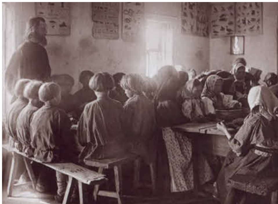
Столовая для крестьянских детей в церковно-приходской школе.