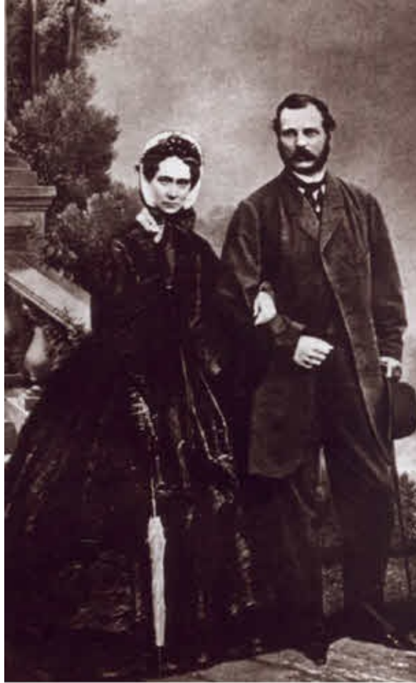
Император Александр II и императрица Мария Александровна.