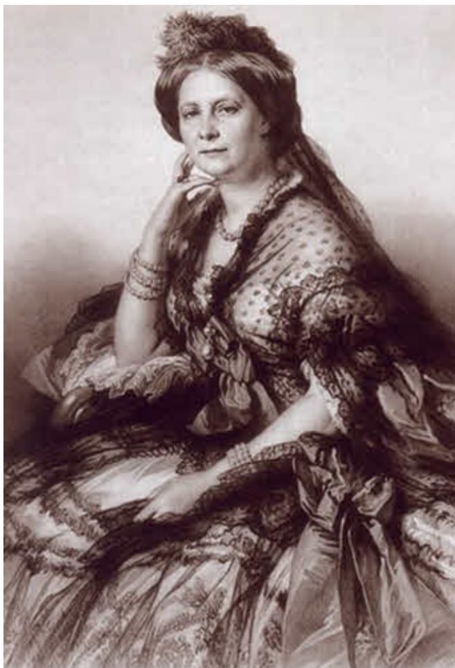
Великая княгиня Елена Павловна.