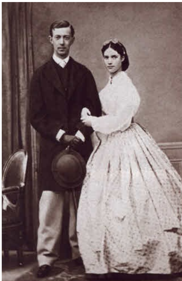
Воспитанник Победоносцева наследник престола Николай Александрович с невестой, датской принцессой Дагмарой (будущей императрицей Марией Федоровной).