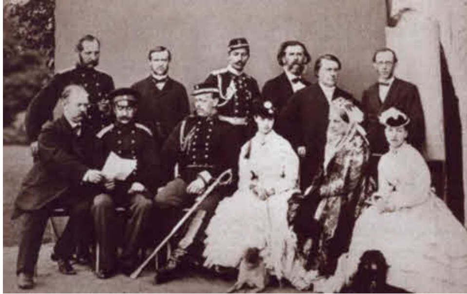
Наследник престола Александр Александрович с супругой Марией Федоровной (в центре) со свитой во время путешествия по Волге. Крайний справа во втором ряду — Победоносцев.