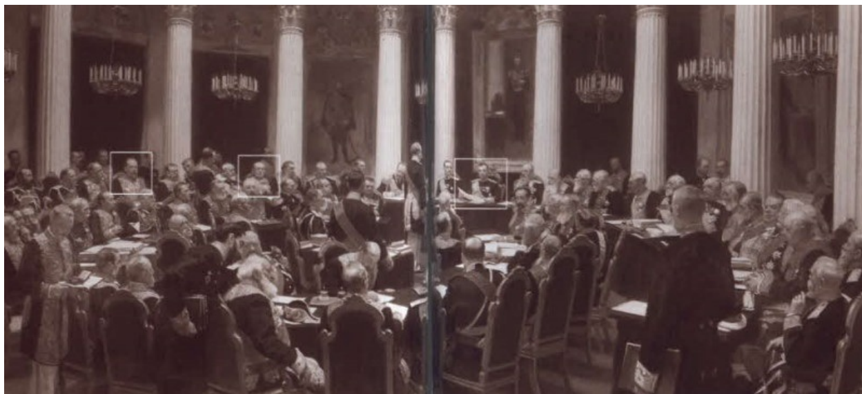
Торжественное заседание Государственного совета 7 мая 1901 года в день столетнего юбилея со дня его учреждения.