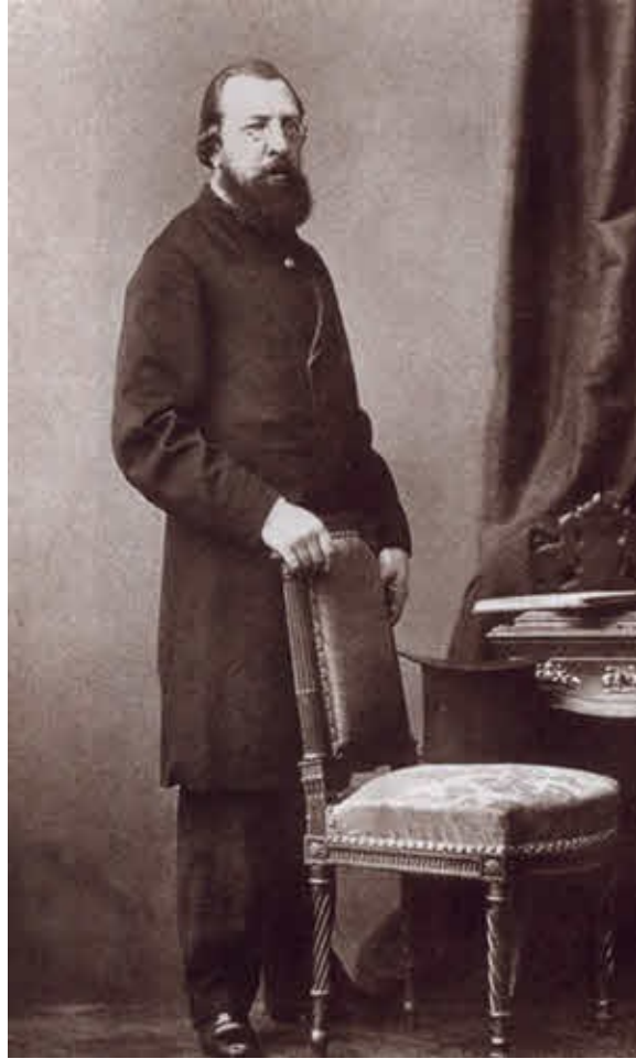
Славянофил Иван Сергеевич Аксаков.