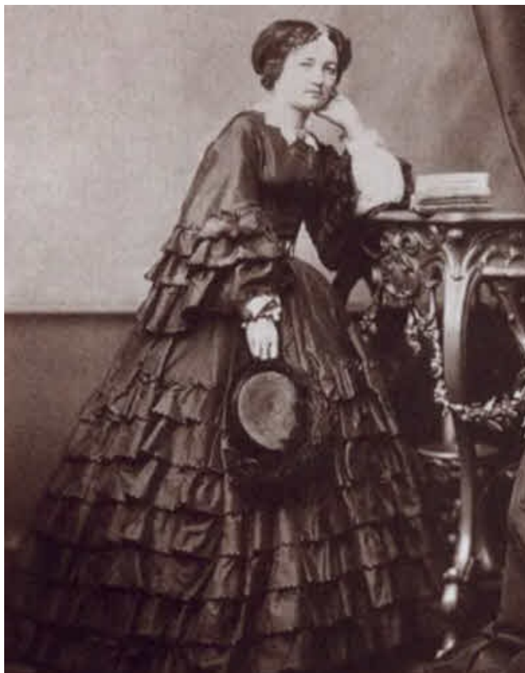
Анна Федоровна Тютчева. 1862 г.