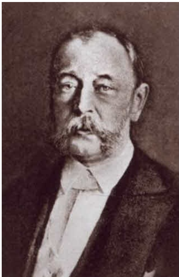
Министр внутренних дел Дмитрий Андреевич Толстой