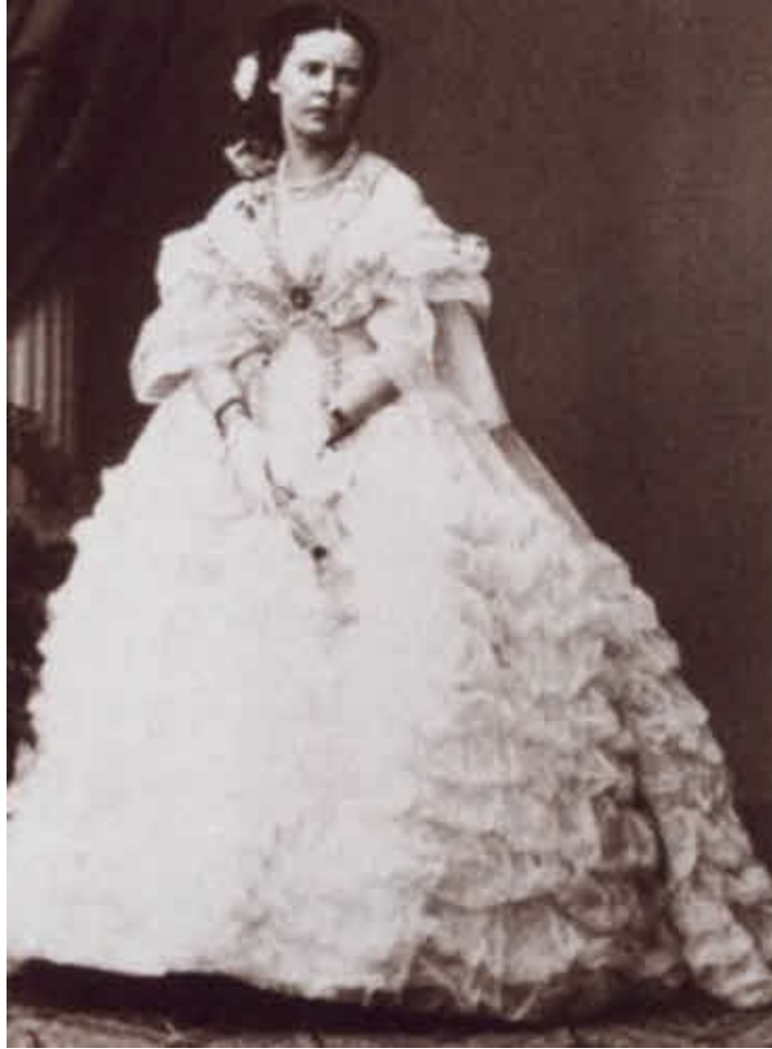
Екатерина Федоровна Тютчева. 1863 г.