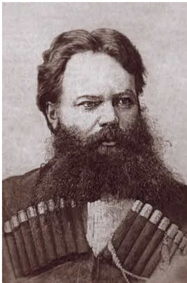
«Атаман вольных казаков» Николай Иванович Ашинов