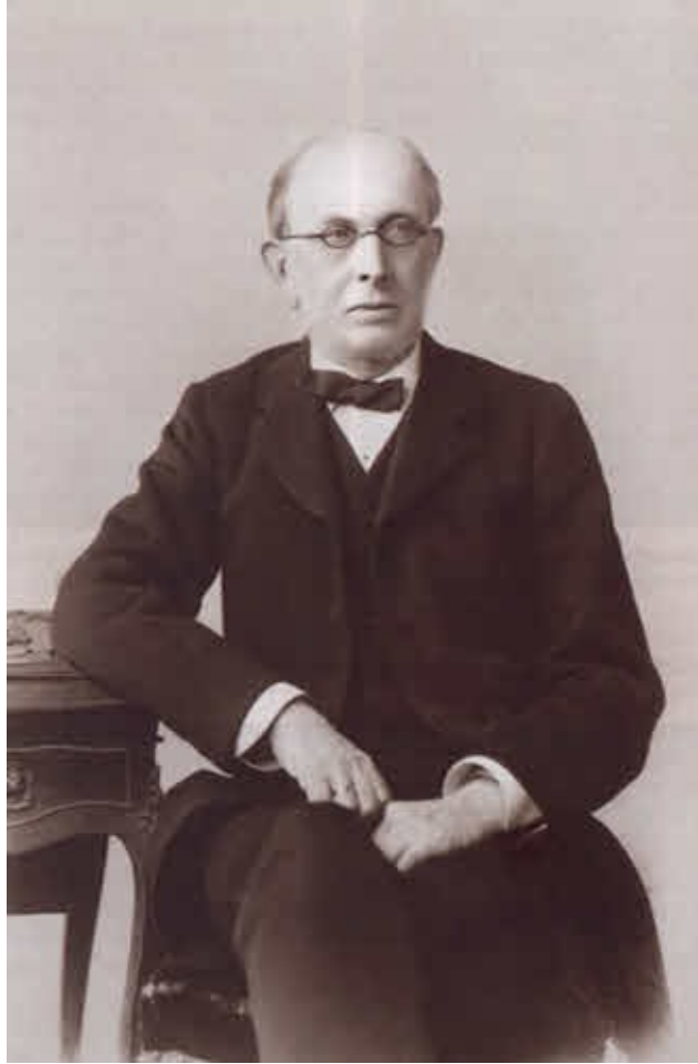
Победносцев — всемогущий обер-прокурор Синода