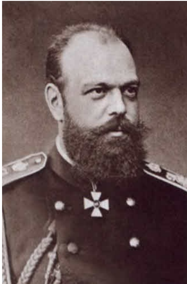
Император Александр III

Гравюра из французского журнала «Юниверс иллюстре». 7 (19) марта 1881 г.