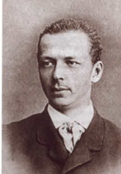
Консервативные публицисты Михаил Никифорович Катков и князь Владимир Петрович Мещерский