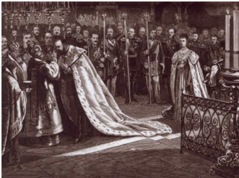
Миропомазание Александра III во время коронации 15 мая 1883 года.