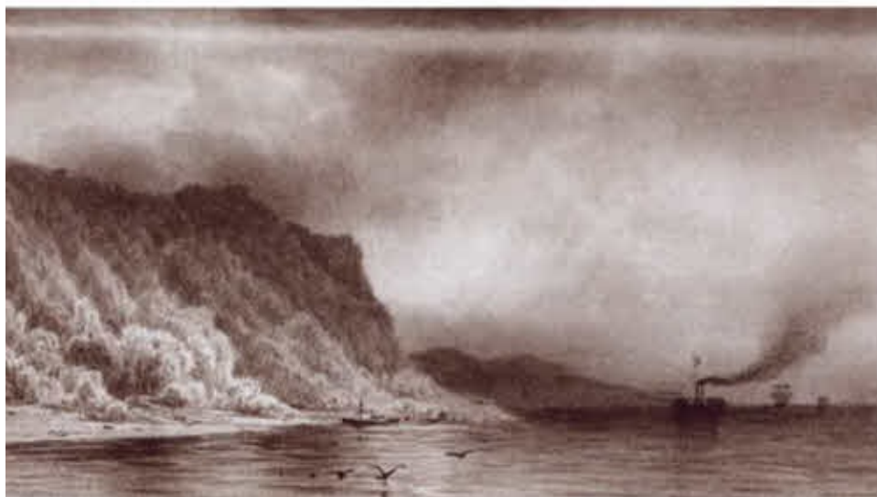
Во время путешествия цесаревича Николая от Петербурга до Крыма в 1863 году художник А. П. Боголюбов делал зарисовки окрестностей. Вверху — вид Самары. Внизу — Жигулевские горы