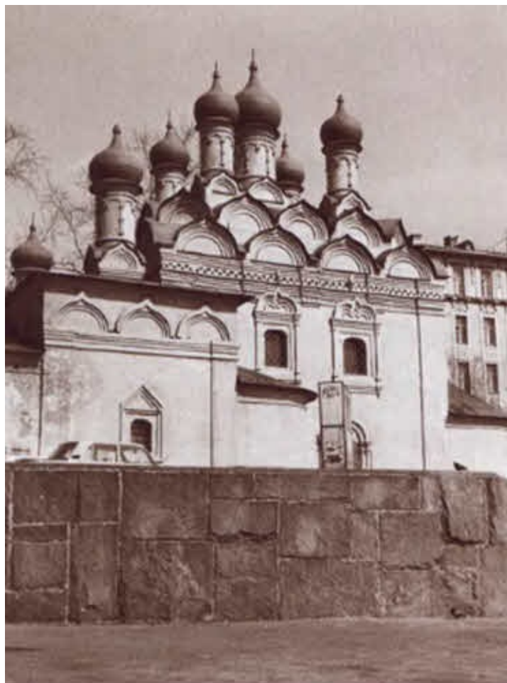
Церковь Симеона Столпника на Поварской улице — приходской храм семьи Победоносцевых