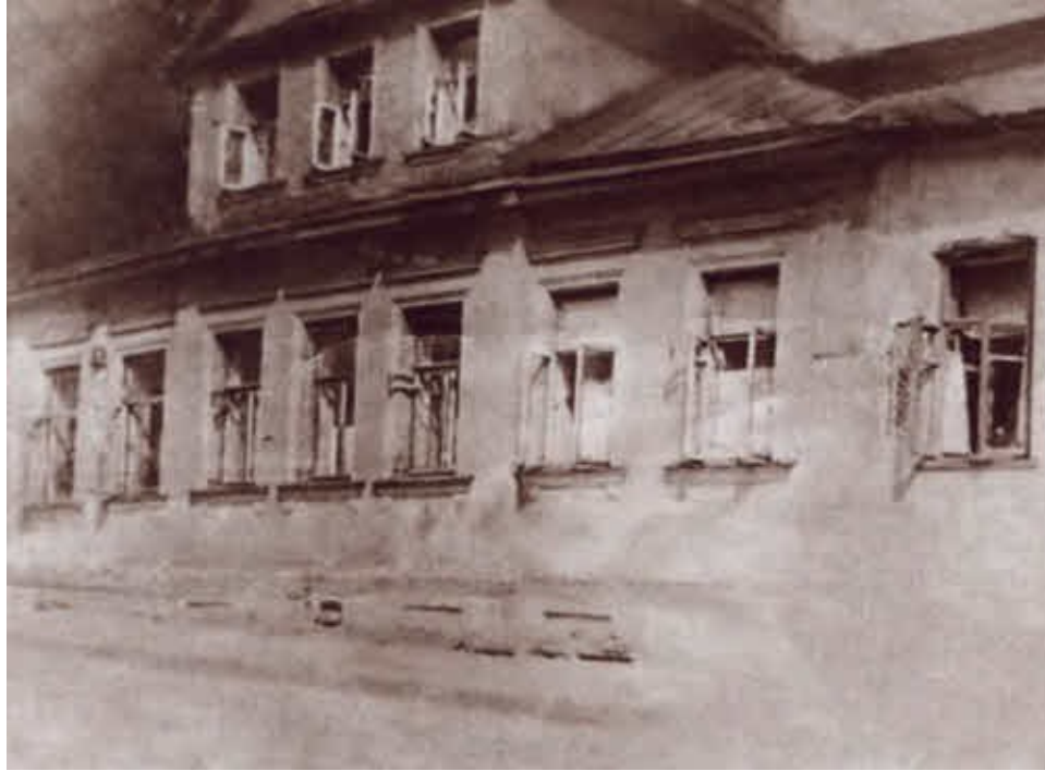
Дом Победоносцевых в Хлебном переулке (не сохранился). 1954 г.