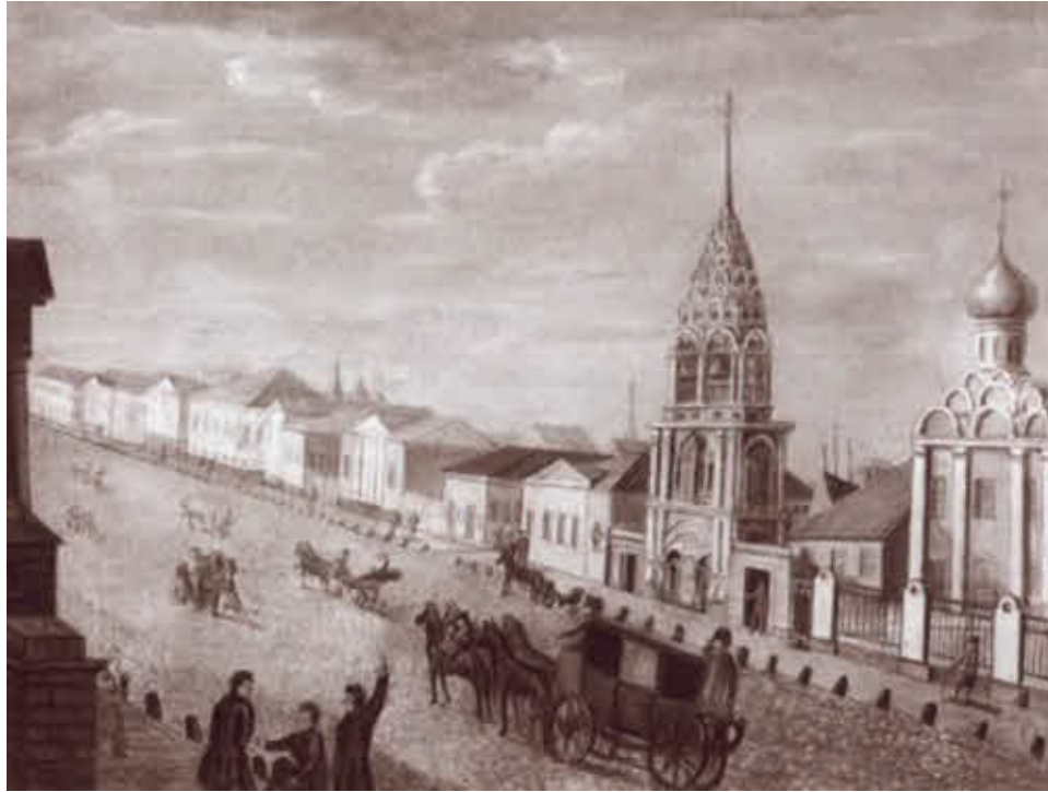
Арбат. Первая половина XIX в.