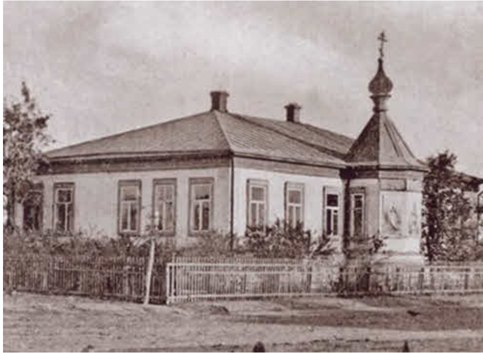
Церковно-приходская школа Христорождественской церкви села Урюпина Донской области