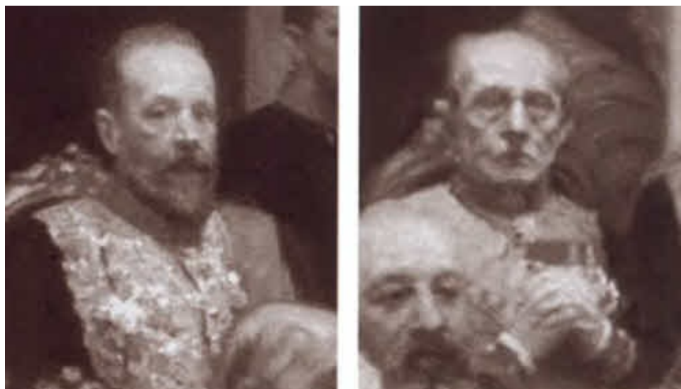
(слева) Министр финансов Сергей Юльевич Витте. Фрагмент