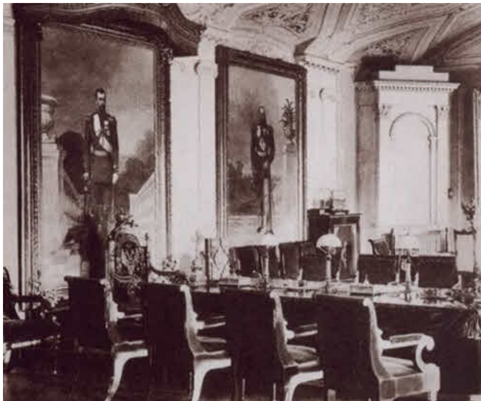
Зал заседаний присутствия Святейшего синода