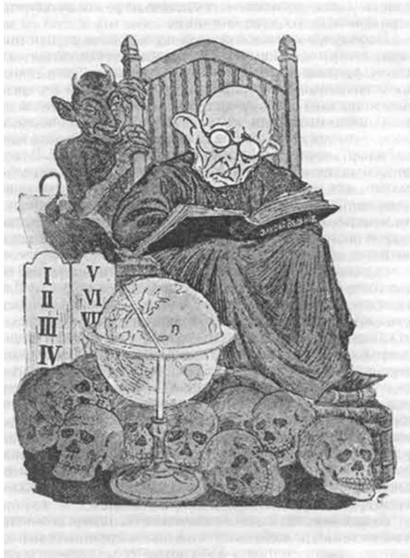
Почтовая открытка с карикатурой на К. П. Победоносцева «Как обратить Русь в христианство». 1905–1907 гг.

Необычайная настойчивость и упорство в отстаивании своих взглядов на протяжении многих десятилетий — качества, в начале XX века уже нечасто встречавшиеся у высокопоставленных чиновников, — также вызывали интерес к Победоносцеву. «Все знали его за человека, абсолютно неподкупного ничем: ни деньгами, ни властью, ни честолюбием, — писал автор одного из некрологов. — Он знал только «идею», которой и служил