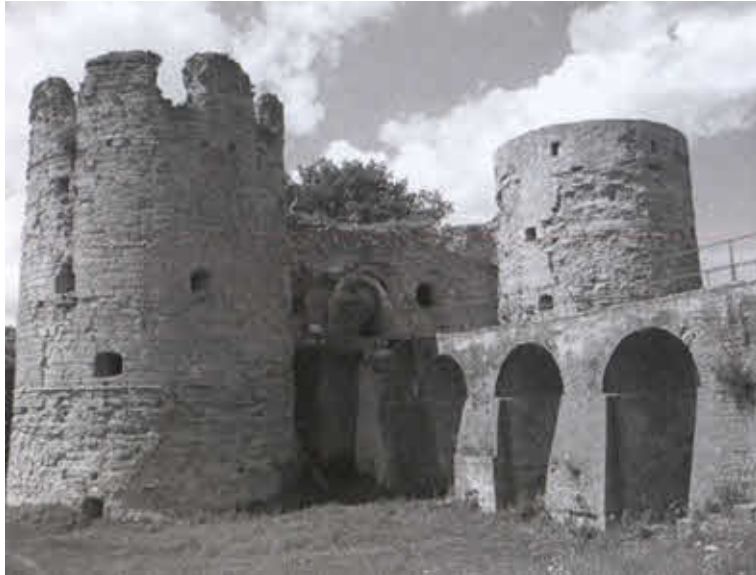
Крепость в Копорье. Современный вид