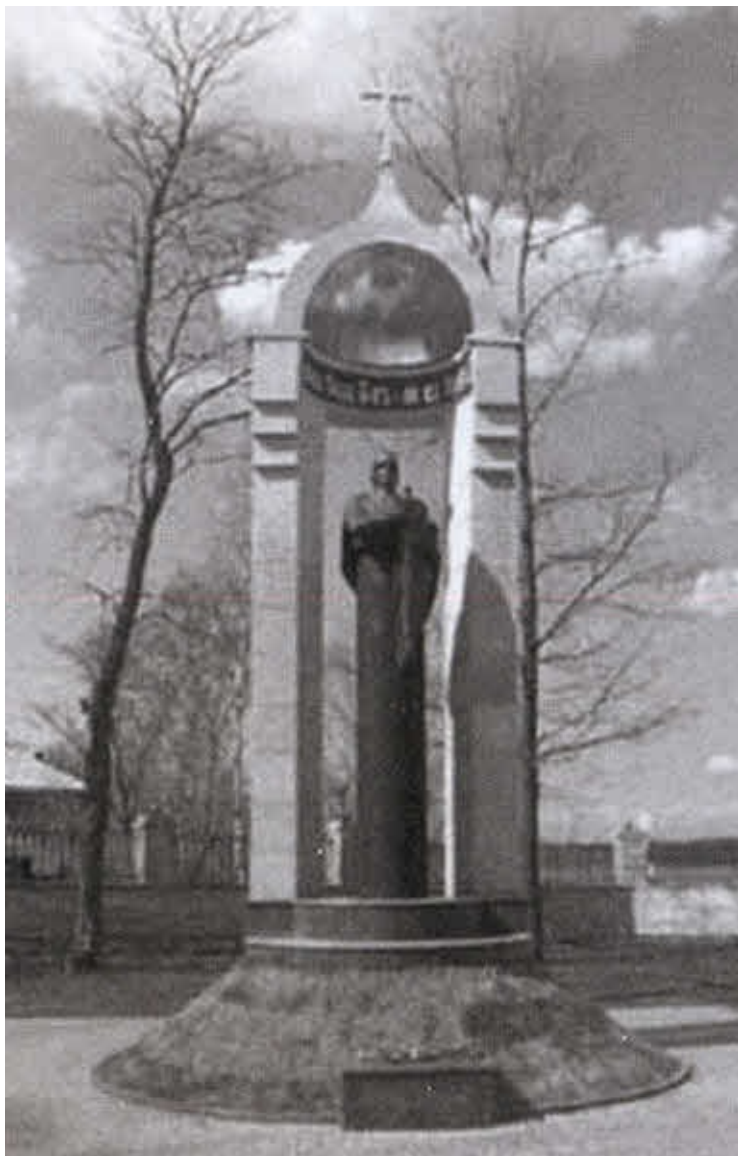
Памятник-часовня Александру Невскому в Усть-Ижоре, на месте Невской битвы