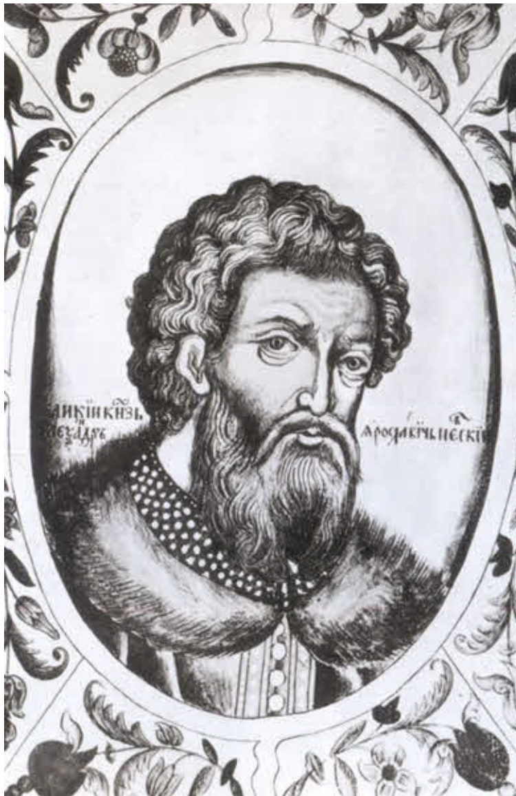
Великий князь Александр Ярославич Невский.