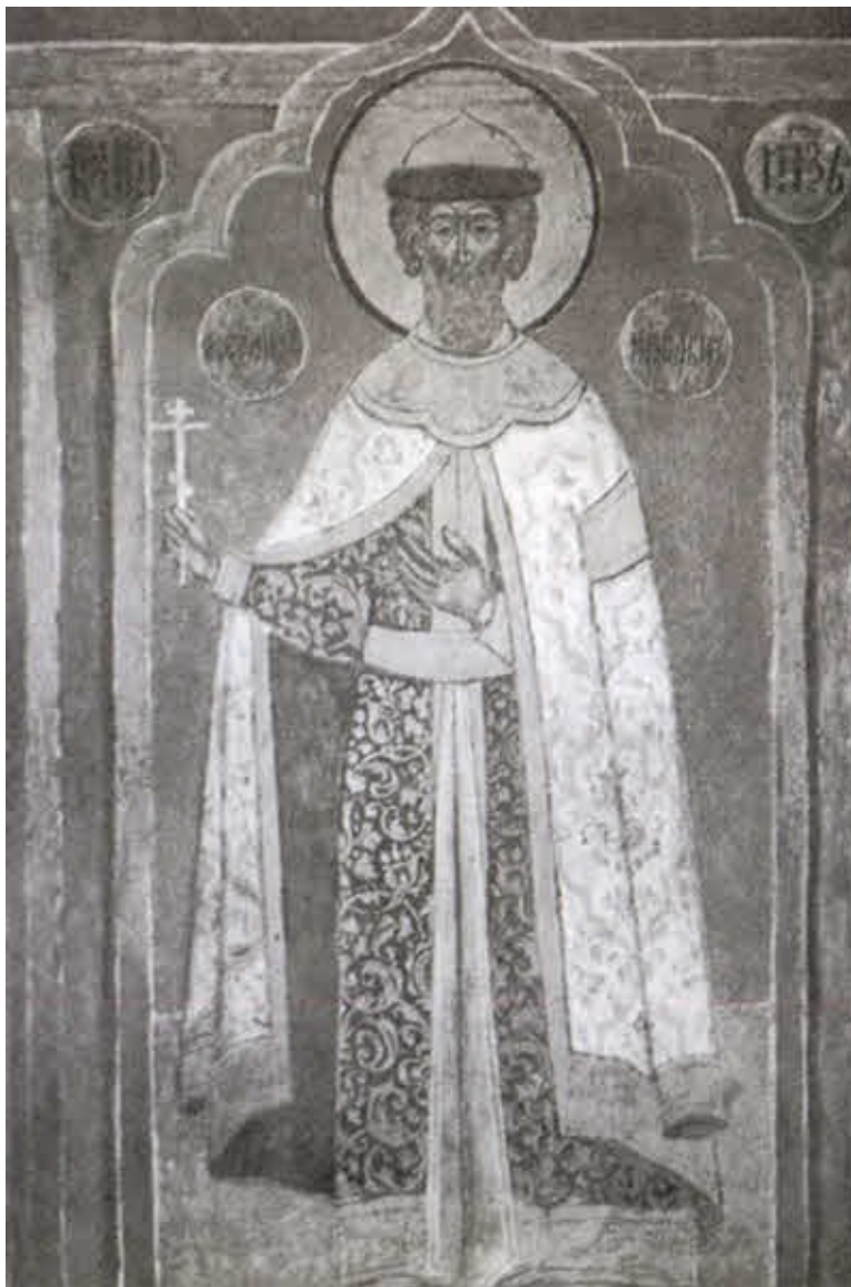
Святой и благоверный великий князь Александр Ярославин.

Фреска Архангельского собора Московского Кремля. 60-е гг. XVI в.