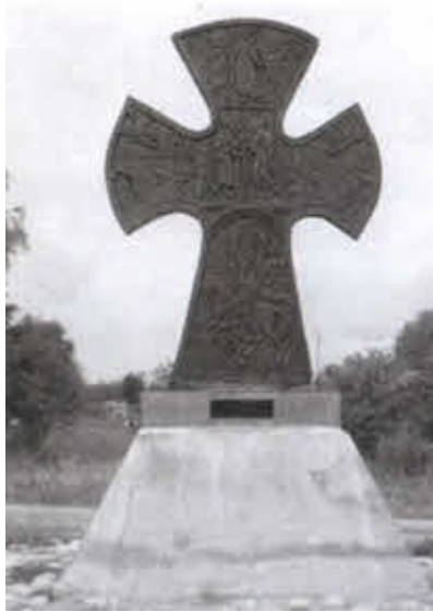
Памятный крест в честь победы русского воинства в Ледовом побоище. Кобылье городище на Чудском озере