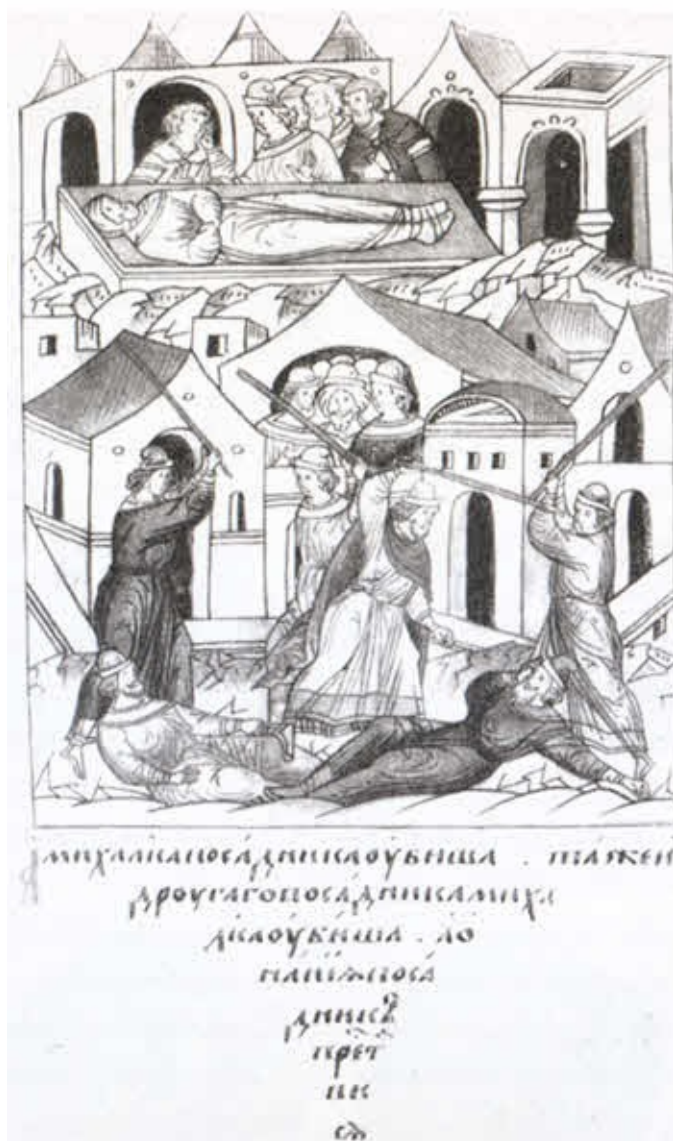
Расправа над участниками новгородского мятежа 1257 года.