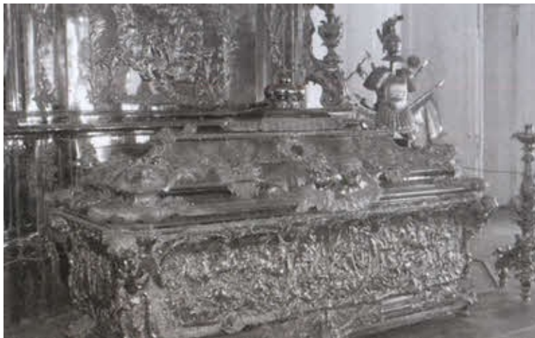
Серебряная гробница князя Александра Невского из Александро-Невской лавры.