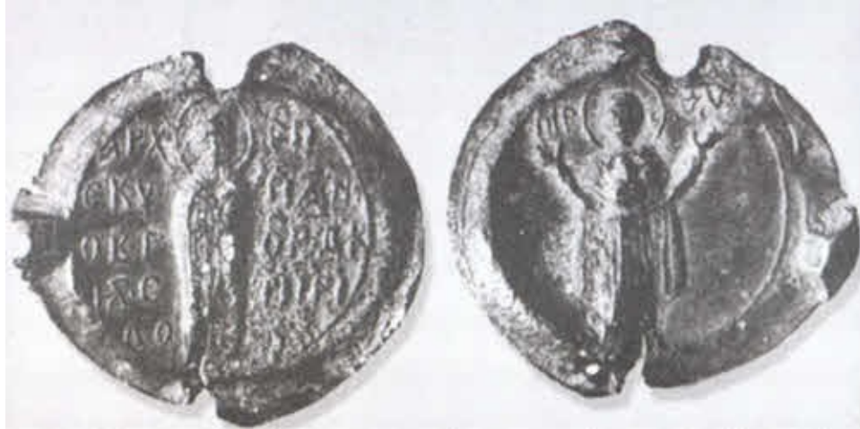
Печать новгородского архиепископа Спиридона