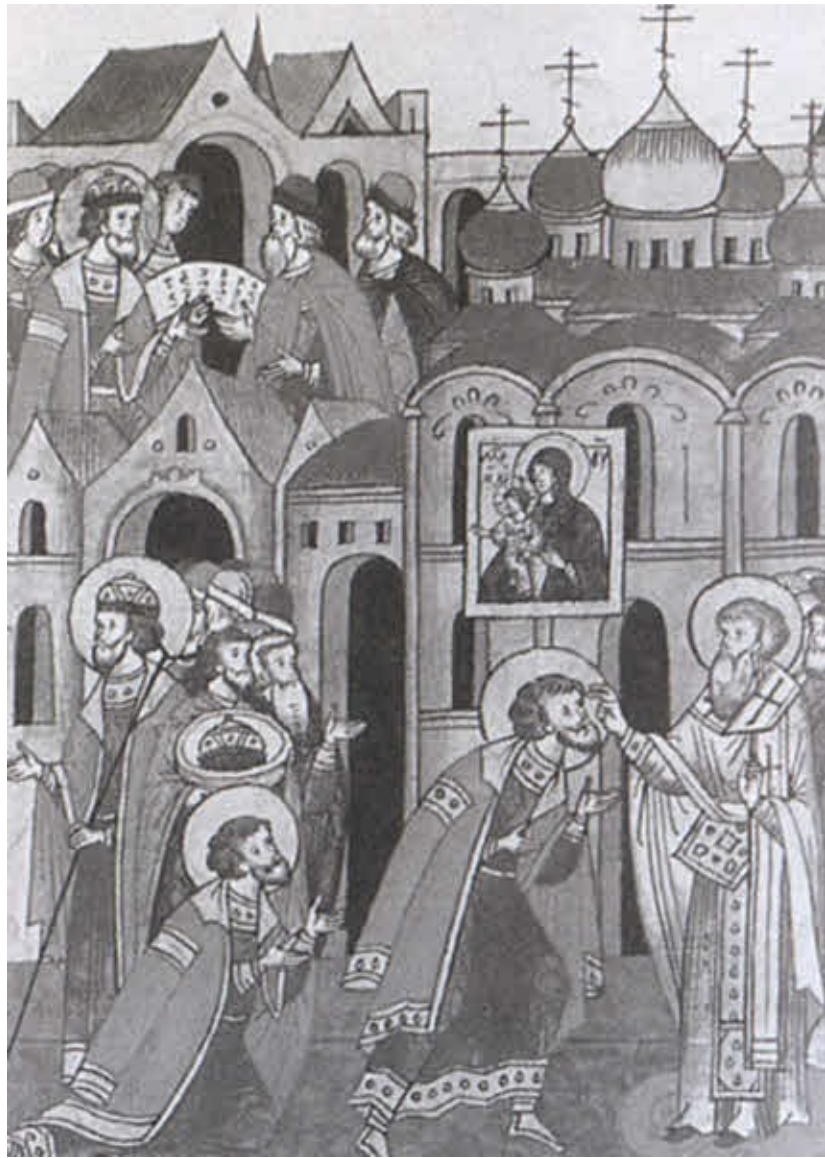
Молитва князя Александра Ярославича накануне Невской битвы.