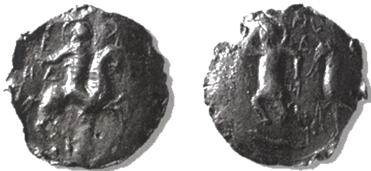
Печать князя Александра Ярославича