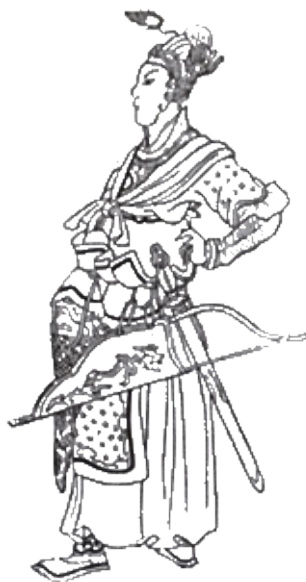
Батый. Китайский рисунок XVII в.