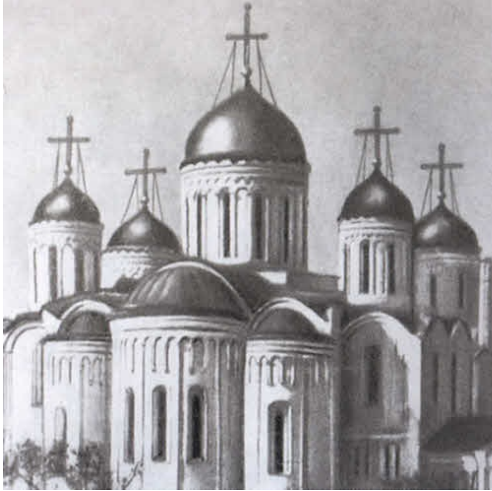
Успенский собор во Владимире. Современный вид