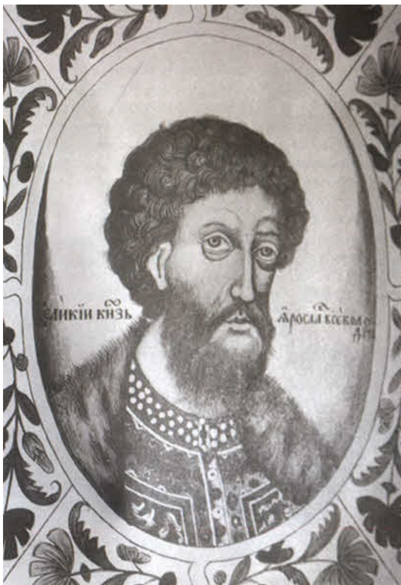
Великий князь Ярослав Всеволодович.