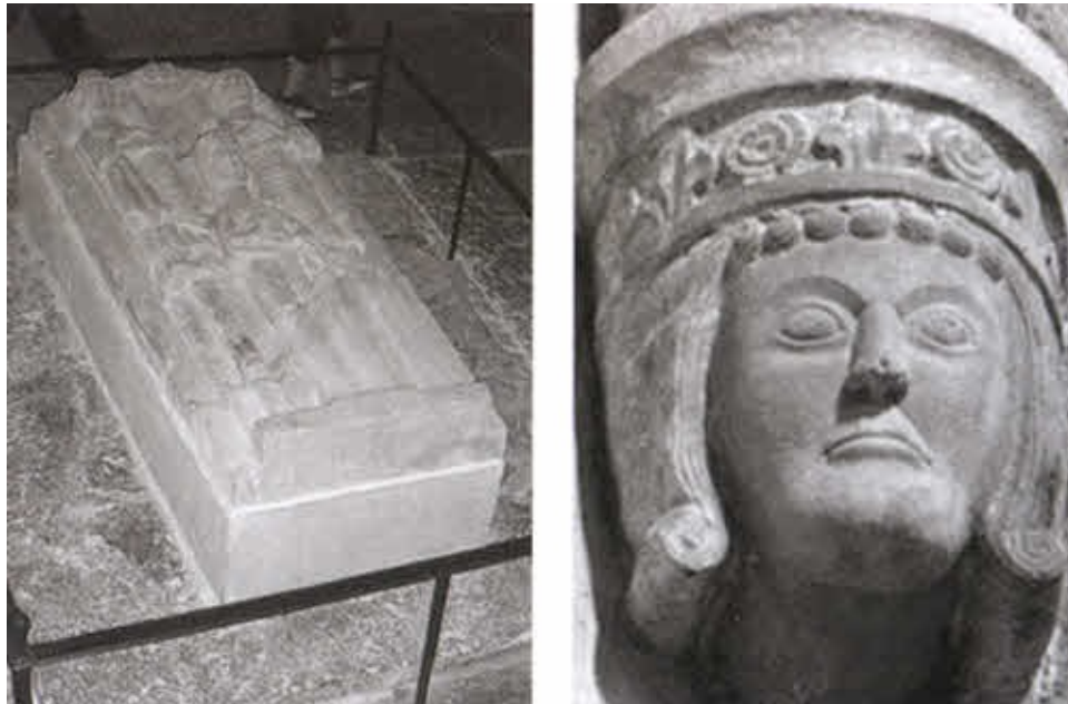
Ярл Биргер Магнуссон. Скульптурное изображение и надгробие в монастыре Варнхем в Вестергётланде