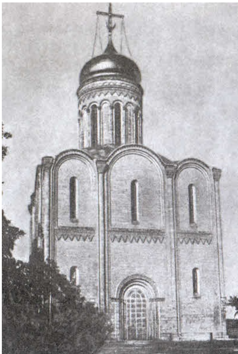
Рождественский собор Владимирского Рождественского монастыря (после реставрации XIX века)