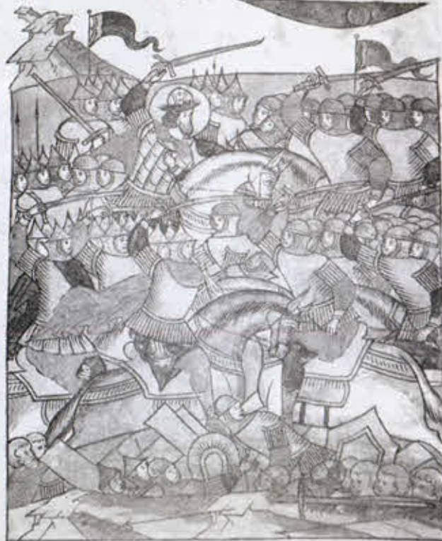
Ледовое побоище. Миниатюра Лицевого летописного свода

Къзалазѣири, мноствохъ рабѣи. ꙗко древоу дѣрѣи да. сиѣи крѣици. Тако шѣи великаго къзалазѣири. исповниши дѣрѣи рабѣи. каждѣо срѣиѣи крѣици. пришло испѣи плашѣи шѣи. цѣи си. ꙗко при си крѣици. положи глави си възѣи вѣи шѣи крѣици. ꙗко зѣи роуци си въннѣи шѣи. сѣи крѣици рабѣи дѣи при шѣи. ꙗко зѣи крѣи рѣи шѣи шѣи си. ꙗко зѣи рабѣи шѣи крѣици лиси. ꙗко рабѣи шѣи дѣи шѣи рабѣи. ꙗко си дѣи рабѣи шѣи