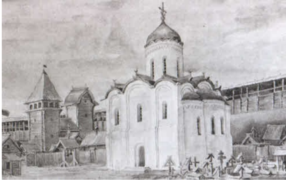
Переяславль-Залесский. Спасо-Преображенский собор с окружающей застройкой в XII веке.