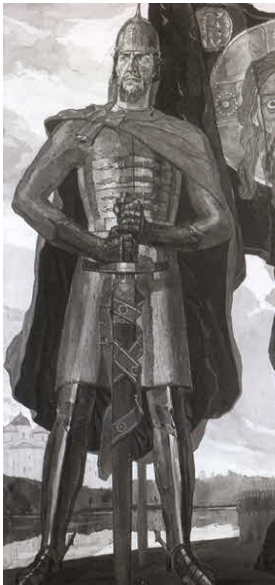
Александр Невский. П. А. Корин. 1942 г.