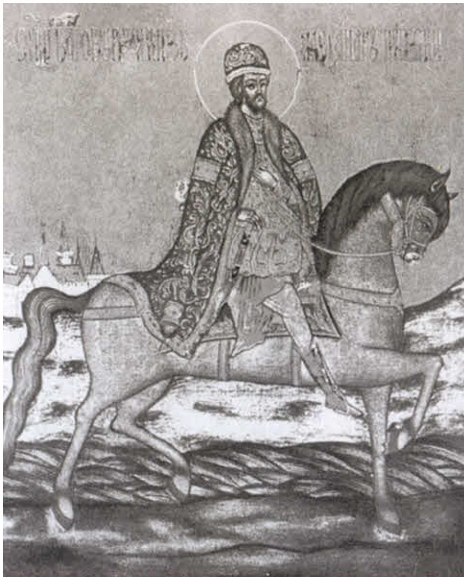
Святой и благоверный великий князь Александр Невский.