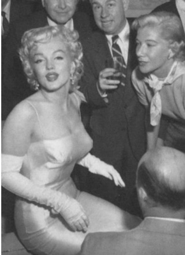
Пресс-конференция, где Мэрилин Монро объявила о создании собственной продюсерской компании. 7 января 1955 г.