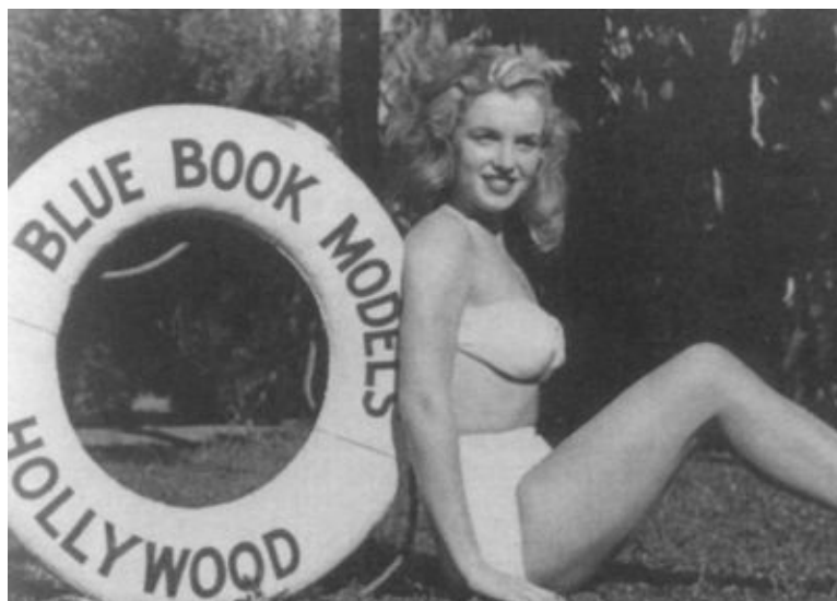
Любимица фотографов агентства «Блу Бук». 1945 г.