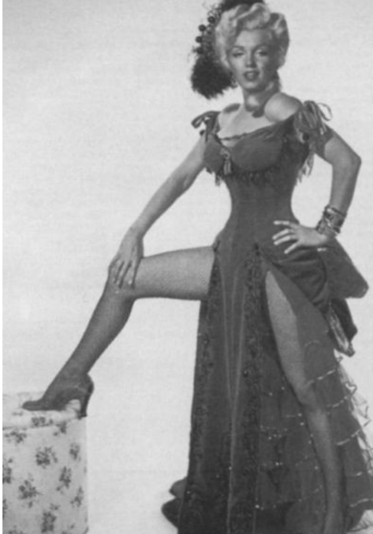
Роль Кей Уэстон в фильме «Река, не текущая вспять». 1954 г.