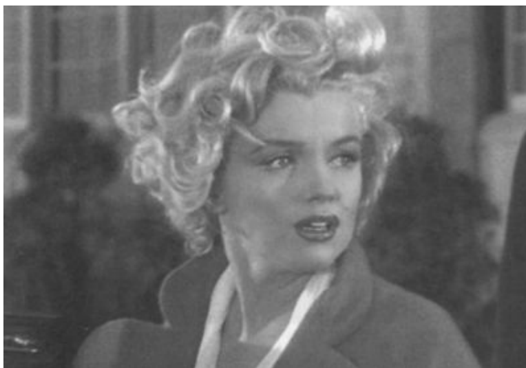
Кадр из фильма «Ниагара». 1953 г.