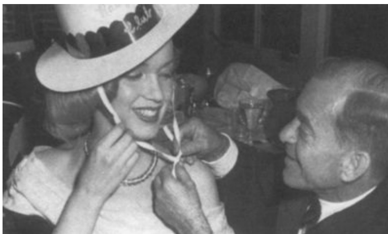
Мисс Монро и доктор Хайд. 1949 г.