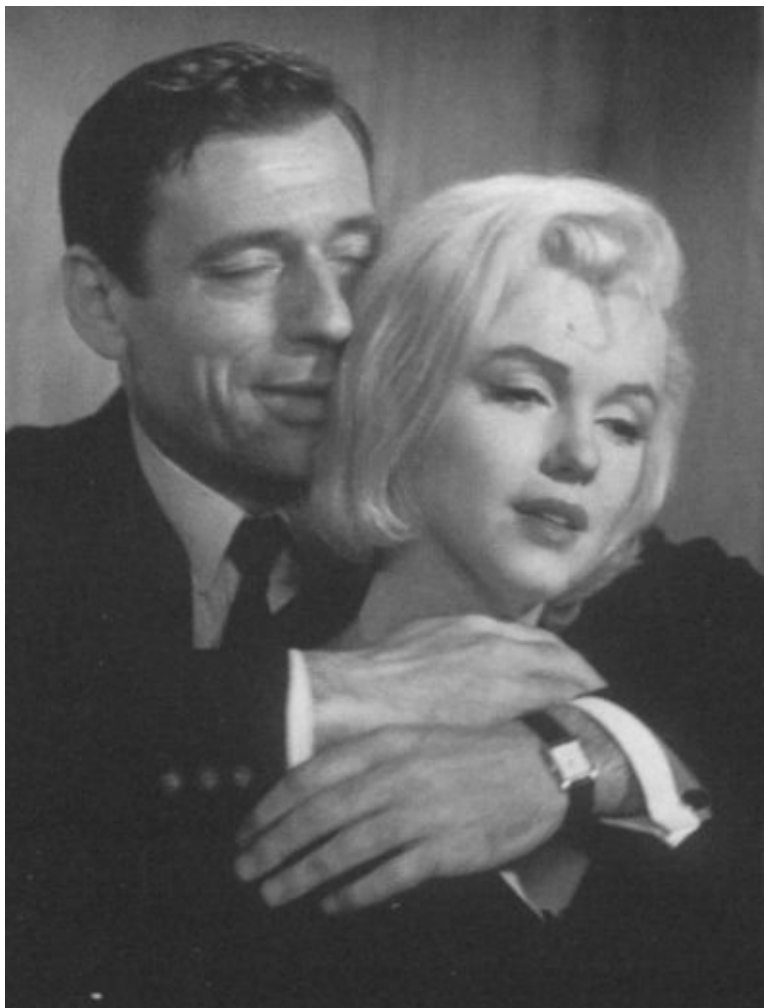
Кадр из фильма «Займемся любовью». Мэрилин Монро и Ив Монтан. 1960 г.