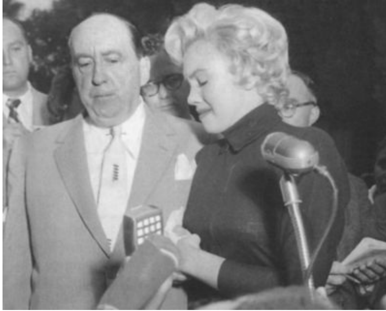
Публичное сообщение о разводе с Джо Ди Маджио. Сентябрь 1954 г.