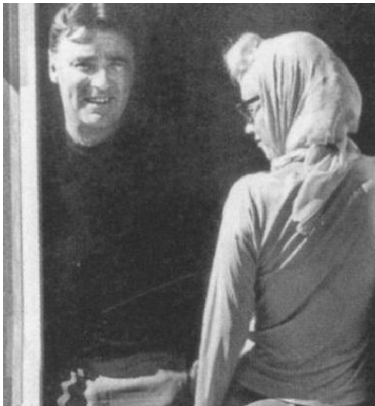
Мэрилин с Питером Лоуфордом. Июль 1962 г.