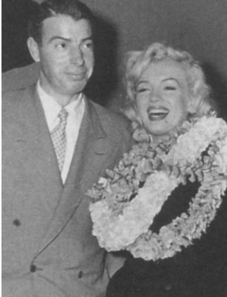
Прибытие Джо Ди Маджио с супругой в Токио на показательные игры по бейсболу. Февраль 1954 г.