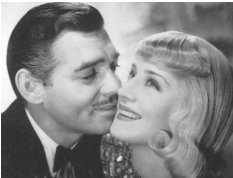
Кумиры Глэдис Бейкер, Грейс Макки и Нормы Джин — актеры Кларк Гейбл и Джин Харлоу