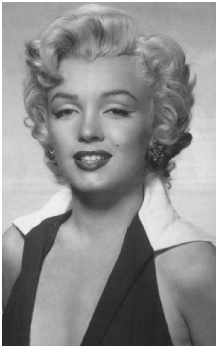
Незабываемая Мэрилин Монро