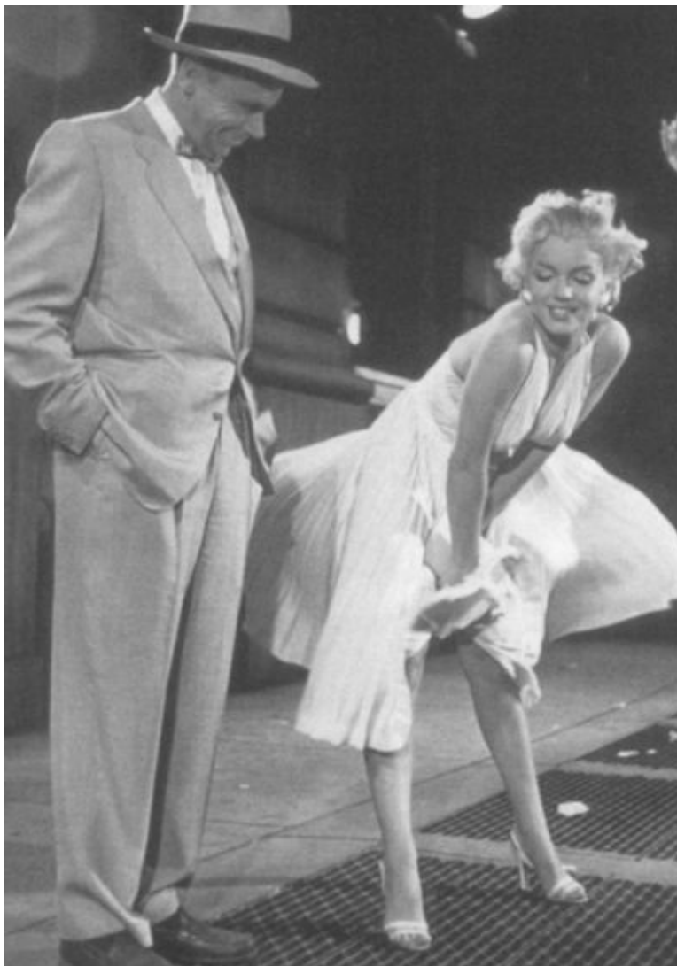
Знаменитая сцена с «летающей» юбкой из фильма «Семь лет желания». Мэрилин Монро и Том Юэлл. 1955 г.