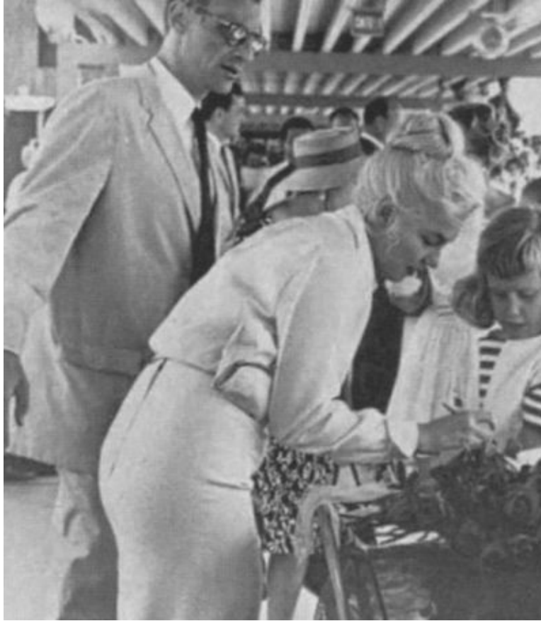
Мэрилин прилетела в Рено, штат Невада, для съемок «Неприкаянных». Июль 1960 г.