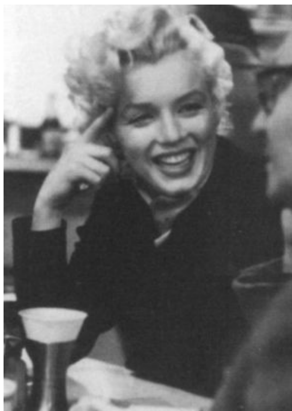
Мэрилин с Ли Страсбергом в кафе на Бродвее. 1955 г.