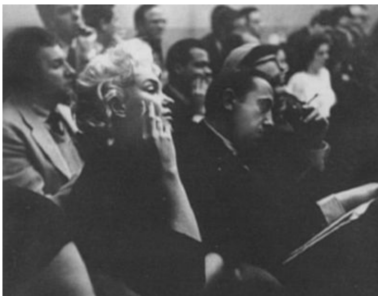
На занятиях Актерской студии. 1955 г.