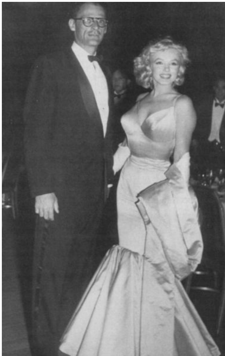
Мэрилин и Артур Миллеры на премьере фильма «Принц и танцовщица». 13 июня 1957 г.