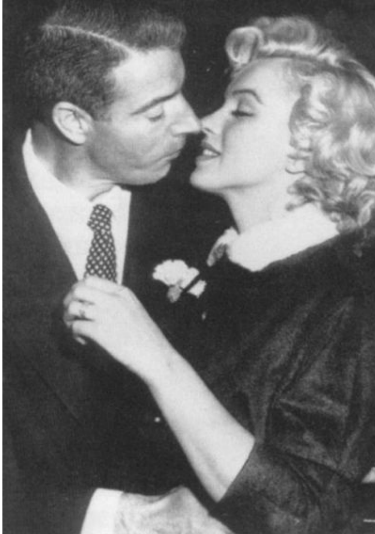
Свадьба с Джо Ди Маджио. 14 января 1954 г.