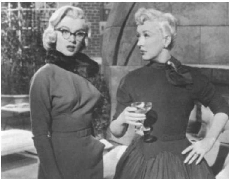
Кадр из фильма «Как выйти замуж за миллионера». Мэрилин Монро и Бетти Грейбл. 1953 г.