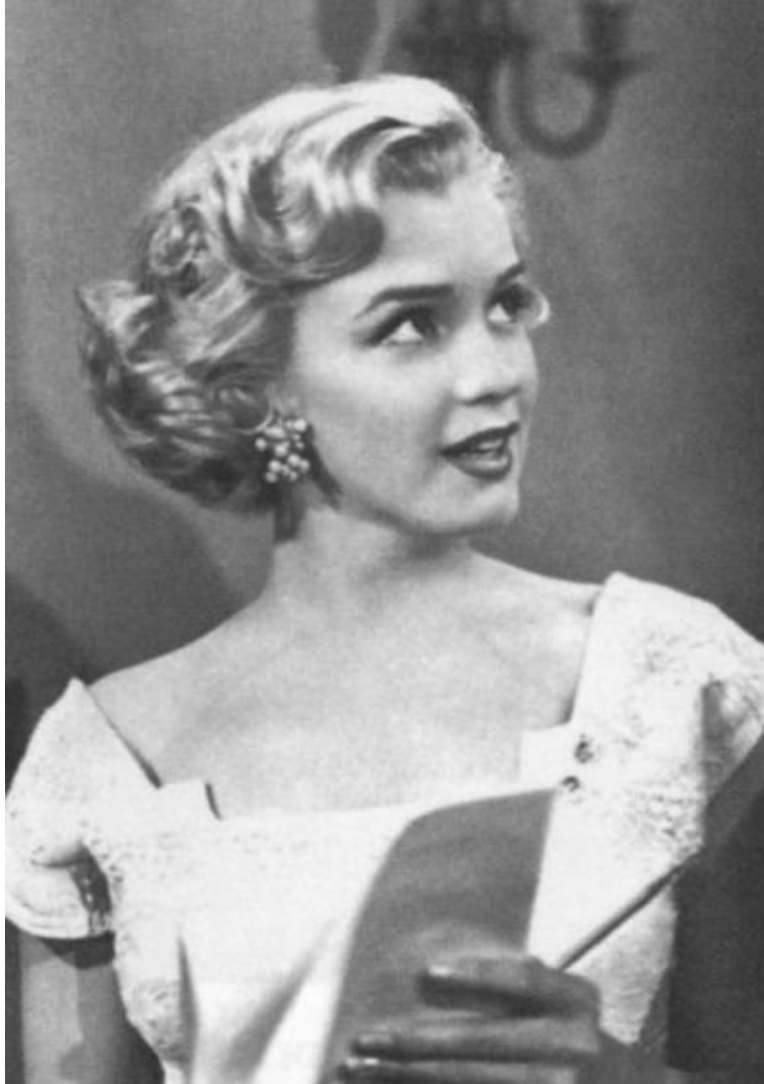
Стереотипная блондинка-секретарша в фильме «Моложе себя и не почувствуешь».1951 г.