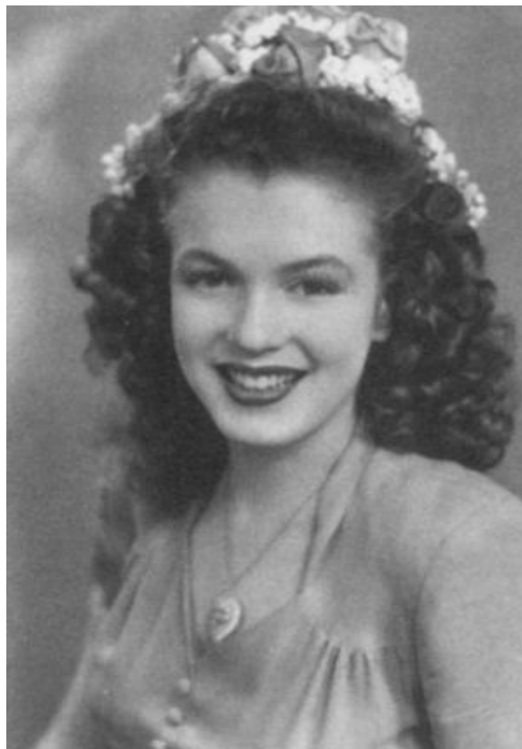
Начинающая фотомодель Норма Джин Бейкер. 1945 г.