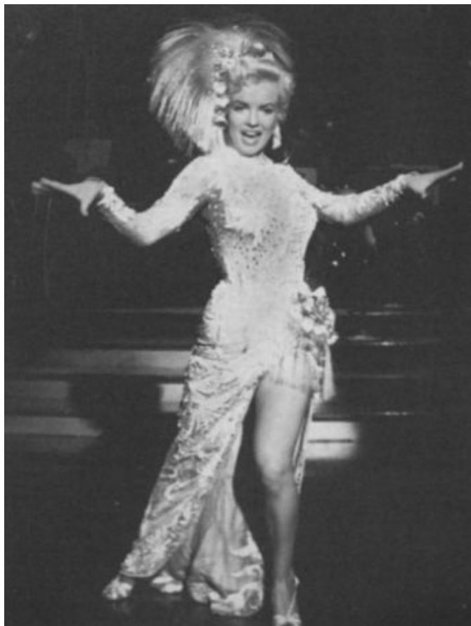
Роль Виктории в фильме «Нет лучше бизнеса, чем шоу-бизнес». 1954 г.