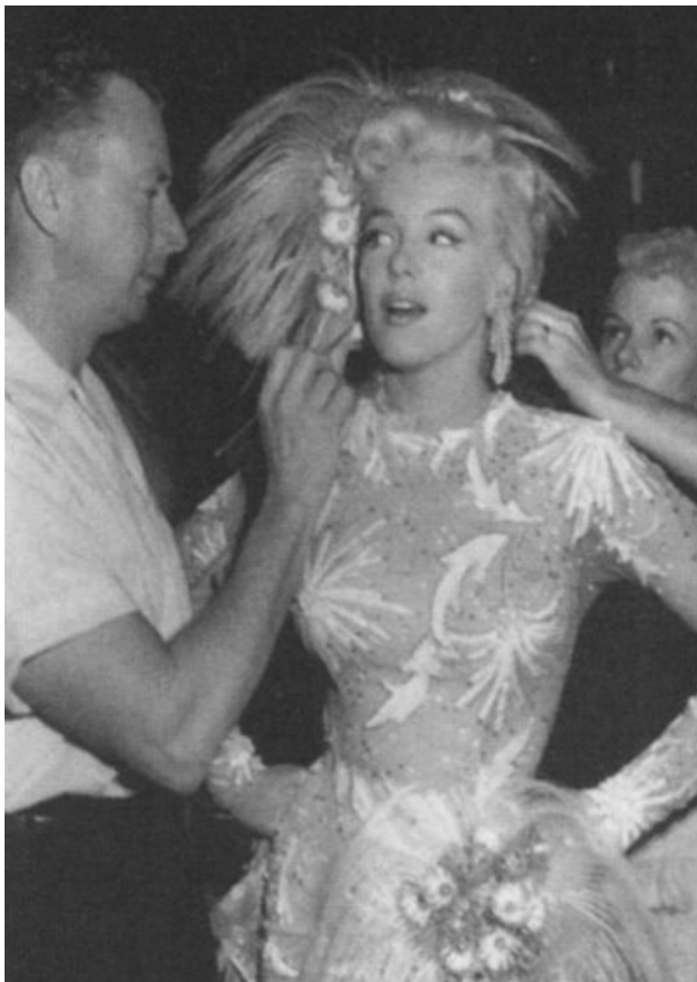
Подготовка к фильму «Нет лучше бизнеса, чем шоу-бизнес». 1954 г.