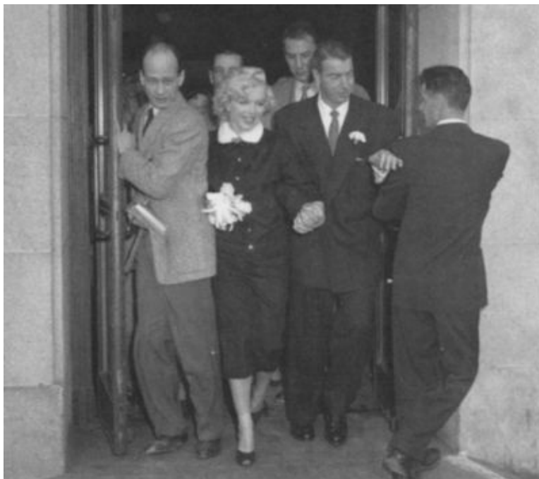
После бракосочетания в городской мэрии Сан-Франциско