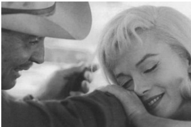
Кадр из фильма «Неприкаянные». Мэрилин Монро и Кларк Гейбл. 1960