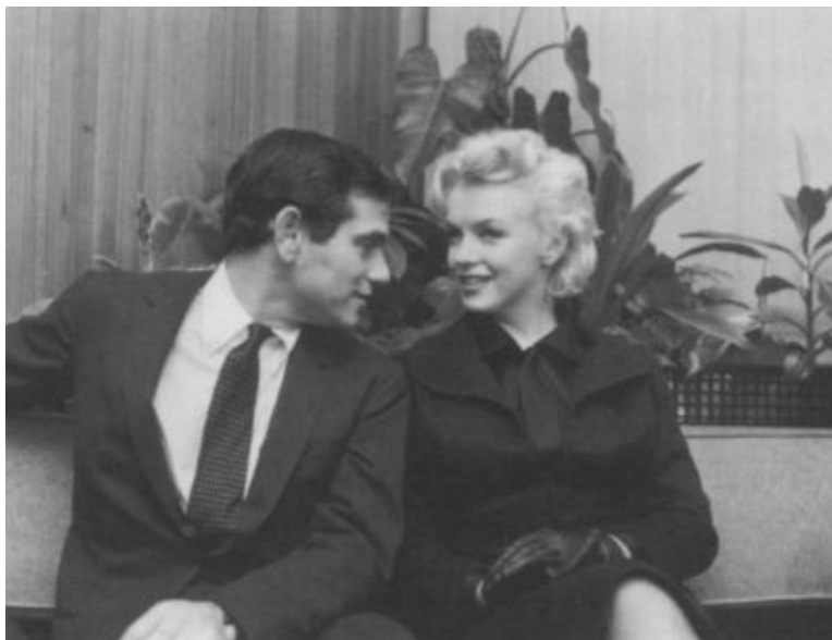
Совладельцы «Мэрилин Монро Продакшнс» — Мэрилин Монро и Милтон Грин. 1956 г.