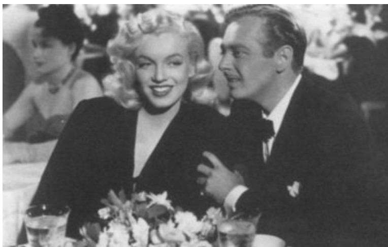
Кадр из фильма «Хористки». Мэрилин Монро и Рэнд Брукс. 1948 г.