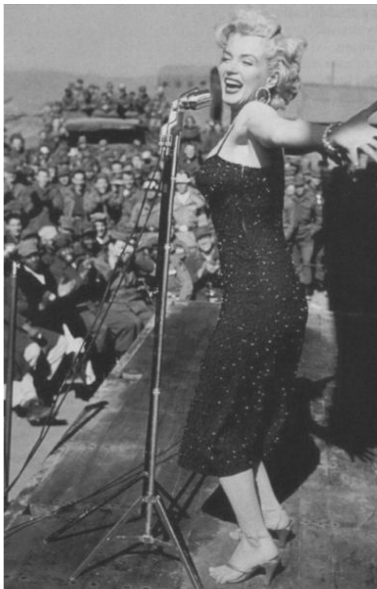
Выступление Мэрилин Монро в Корее под оглушительный рев сотен тысяч солдат и морских пехотинцев. Февраль 1954 г.