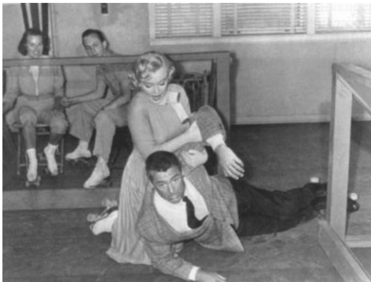
Очередная секретарша в фильме «Обезьяньи шалости» с Кэри Грантом. 1952 г.