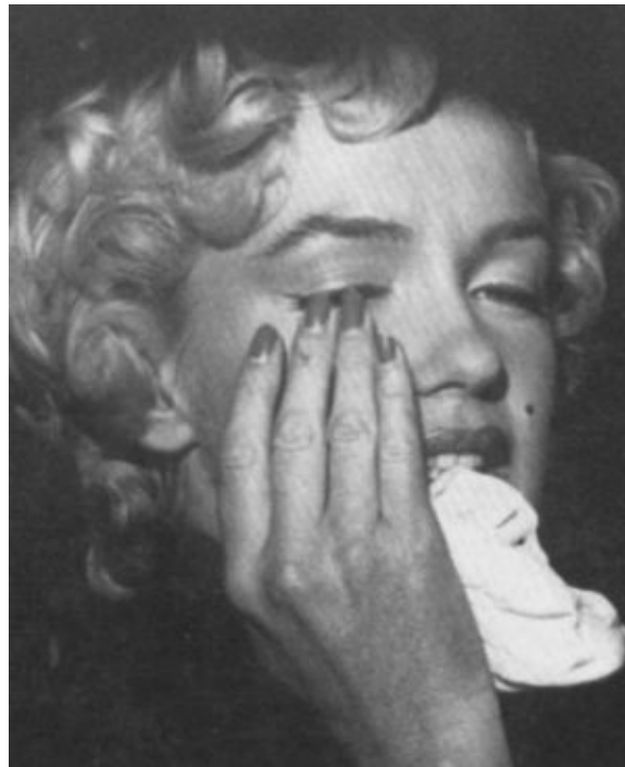
Мэрилин неподдельно страдает от разрыва с Ди Маджио. Сентябрь 1954 г.