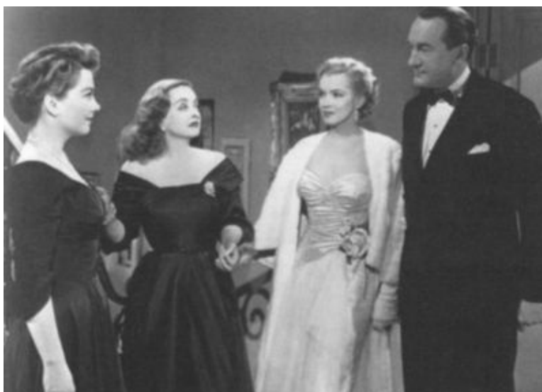
Кадр из фильма «Всё о Еве». Слева направо: Энн Бакстер, Бетт Дэвис, Мэрилин Монро, Джордж Сандерс. 1950 г.