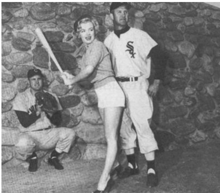
Мэрилин с бейсбольной битой. 1952 г.