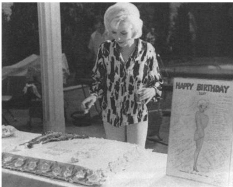
36-й день рождения на съемках фильма «Что-то должно случиться». 1 июня 1962 г.