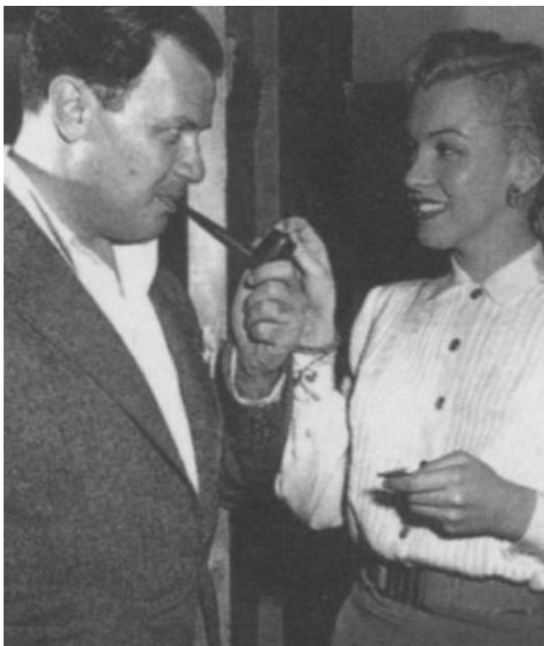
Мэрилин и режиссер Джозеф Л. Манкевич. 1950 г.