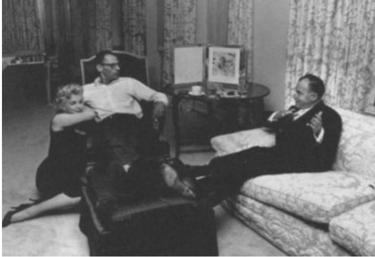
В нью-йоркской квартире Мэрилин. 1958 г.