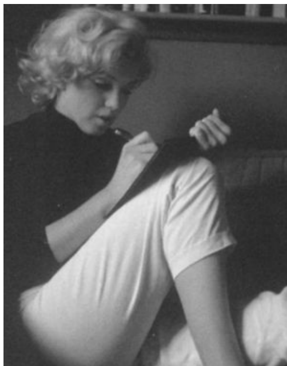
Подготовка к занятиям в студии. 1955 г.