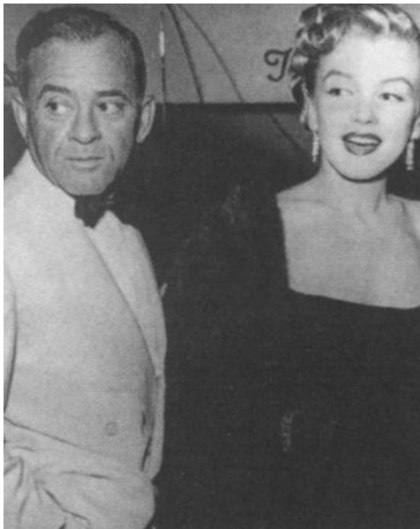
Мэрилин с Джонни Хайдом в последний год его жизни. 1950 г.