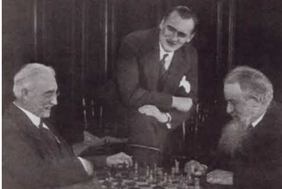
П. Н. Милюков играет в шахматы с П. Б. Струве в присутствии шахматного чемпиона А. А. Алехина.