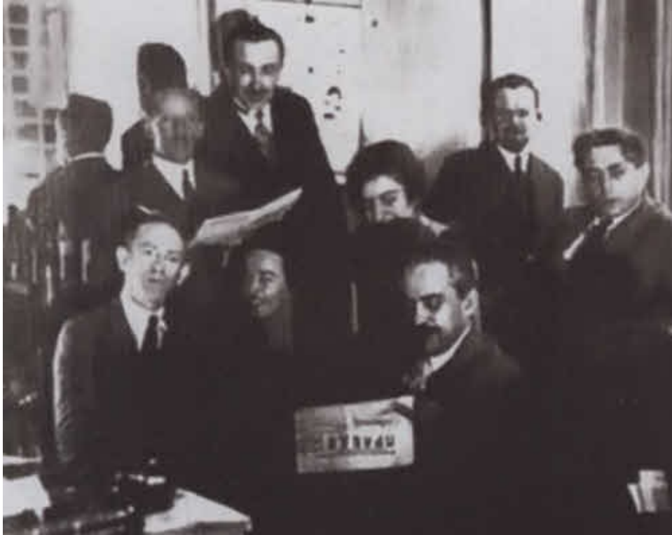
Члены редакции «Последних новостей» читают советскую газету «Правда»