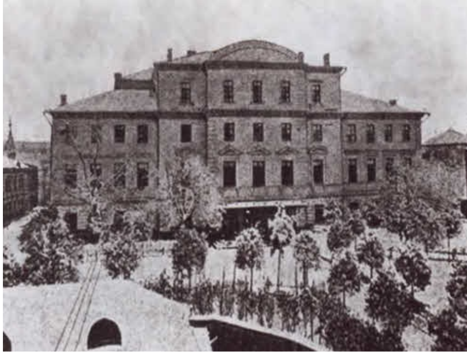
1-я Московская мужская гимназия. Фото 1904 г.