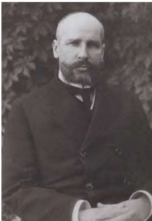
Премьер-министр и министр внутренних дел Петр Аркадьевич Столыпин