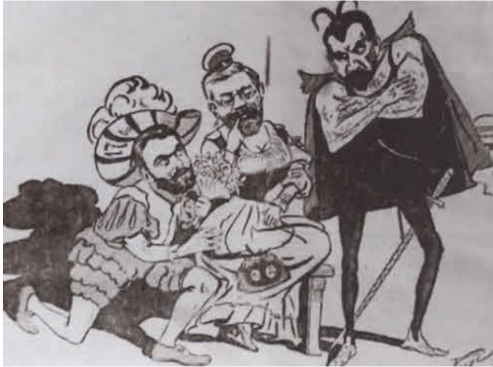
А. И. Гучков, П. Н. Милюков и М. А. Стахович играют «Фауста»