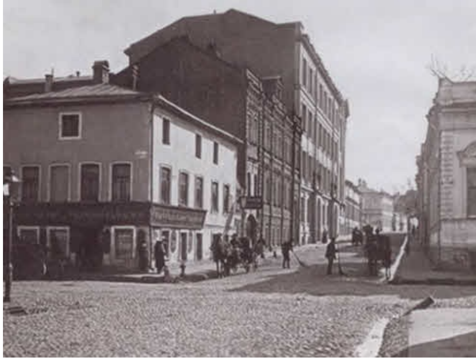
В доме на углу Сивцева Вражка и Староконюшенного переулка Милуков провел детство. Фото начала XX в.