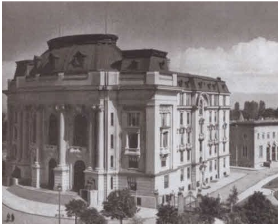
Софийский университет. Фото начала XX в.

Обнаруженная Милюковым в 1898 году охридская надпись царя Самуила — один из древнейших памятников кириллической письменности