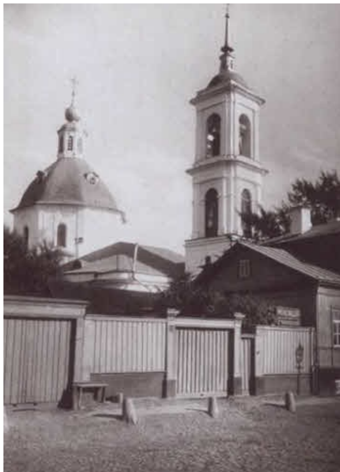
Московская церковь Усекновения главы Иоанна Предтечи в Кречетниках, где был крещен Павел Милюков. Фото 1881 г.