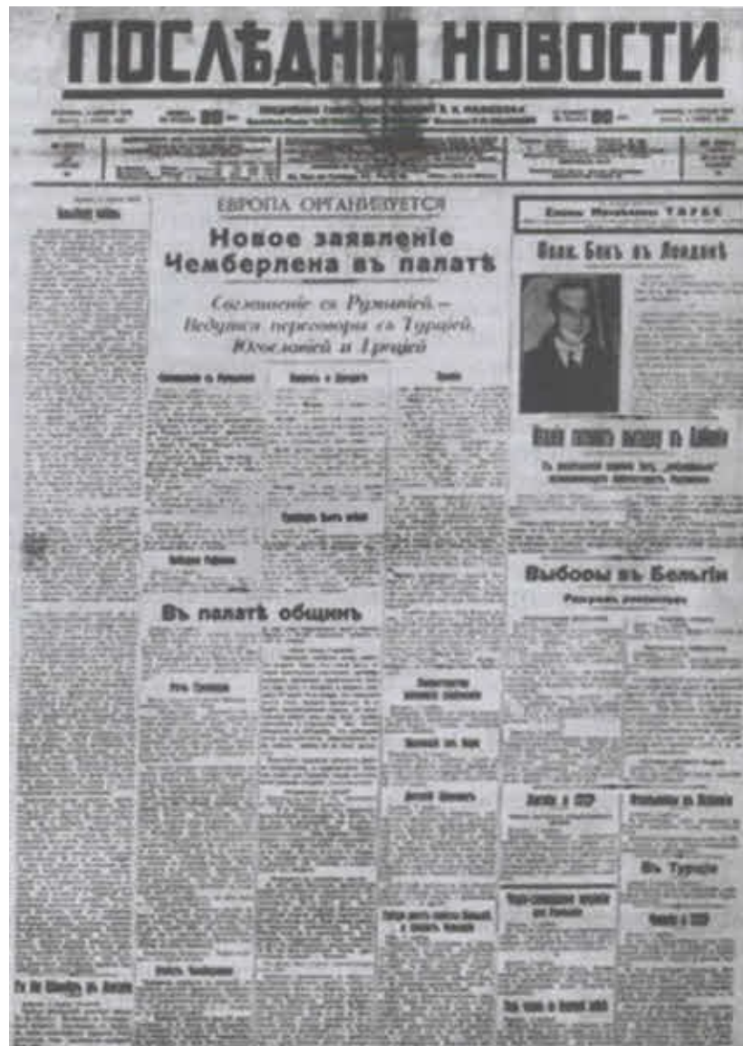
Газета «Последние новости». 1939 г.

Как показал исследователь Е. П. Нильсен, Милюков и в следующие годы продолжал придерживаться таких взглядов на сущность московских процессов. Даже после гибели Троцкого от рук сталинского агента в августе 1940 года он не ставил под сомнение его соучастие «в самой криминальной части конспирации, покаранной процессом 1938 г.» [905] .