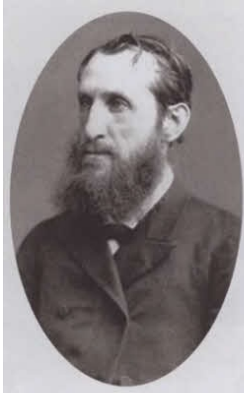
Университетский профессор всеобщей истории Владимир Иванович Герье