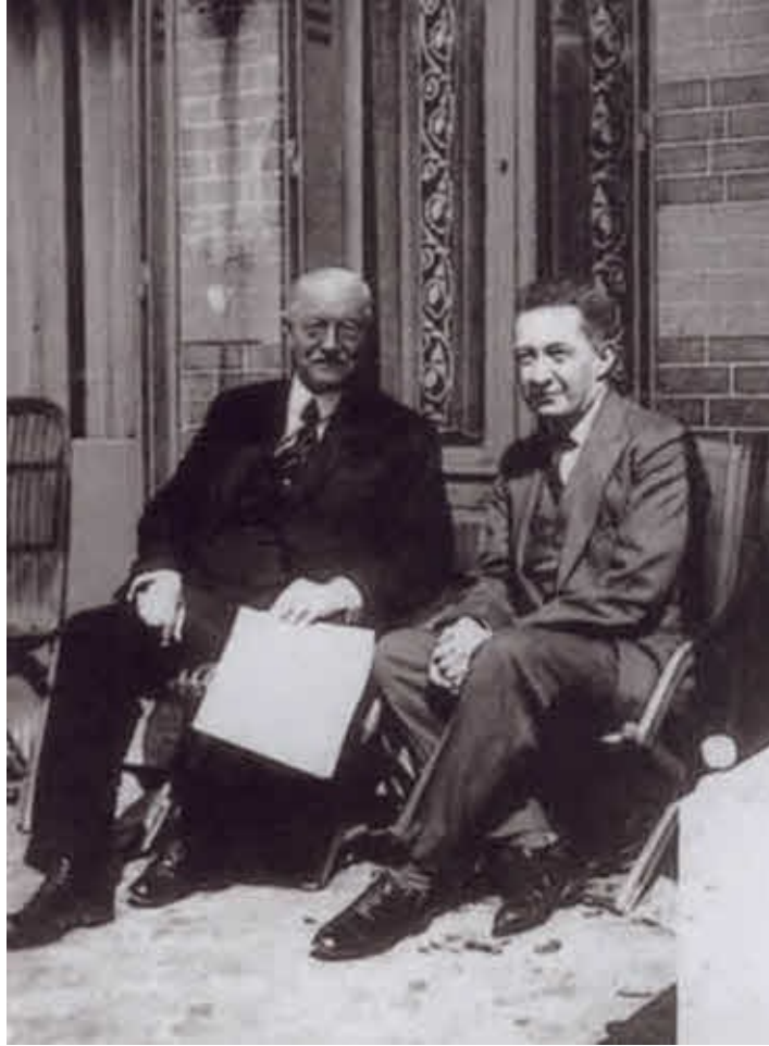
П. Н. Миллюков и А. Ф. Керенский.