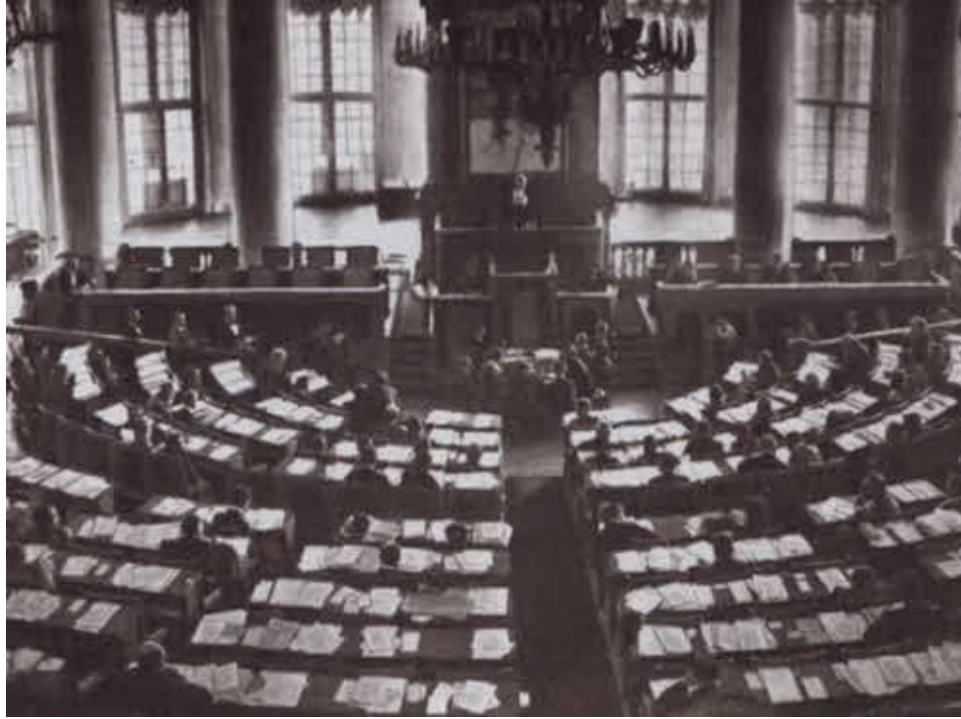
Зал заседаний Думы.