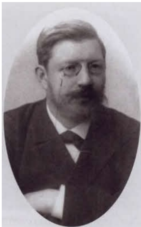
Приват-доцент Павел Николаевич Милуков.