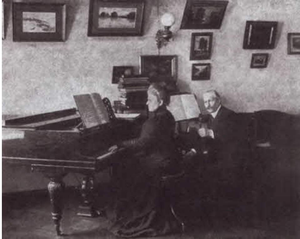
Павел Николаевич и Анна Сергеевна Милюковы музицируют.