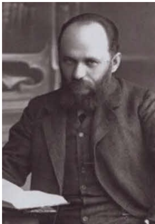
Один из лидеров кадетов Максим Моисеевич Винавер. 1906 г.