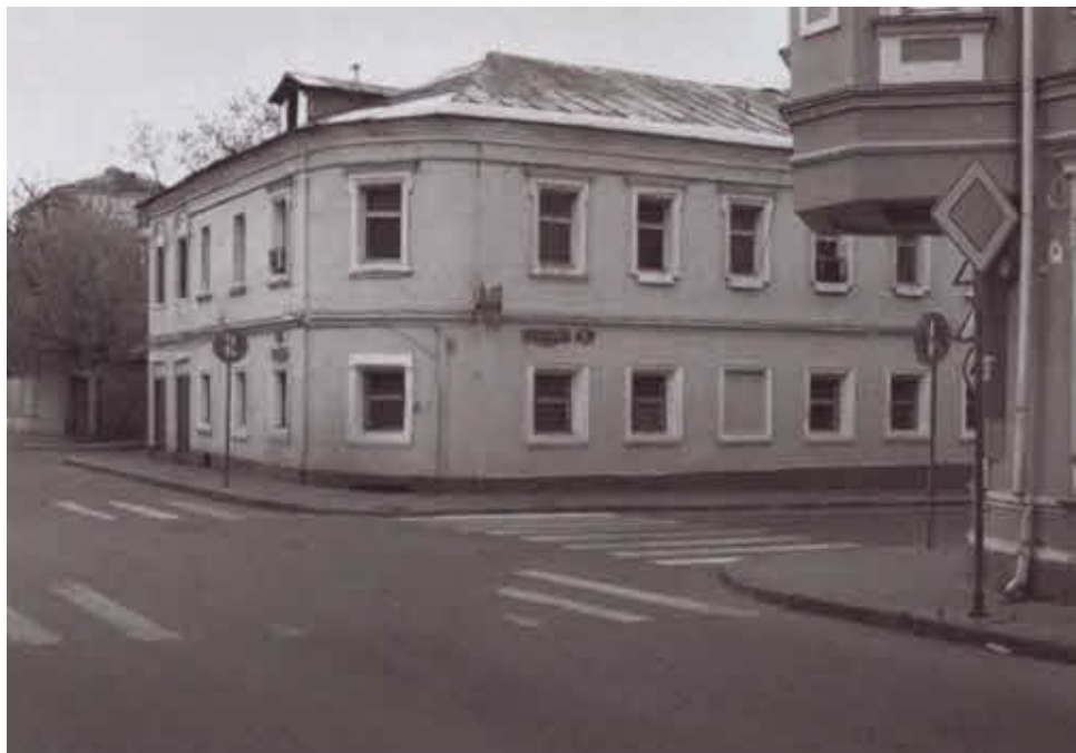
В доме Ключевского на Малой Полянке проводились семинары