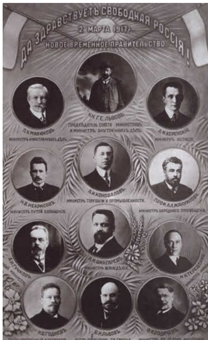
Первый состав Временного правительства.