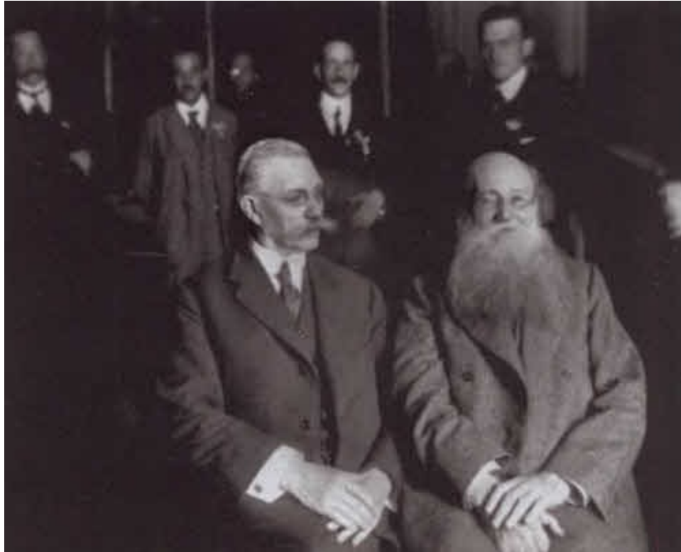
Павел Николаевич Милюков и Петр Алексеевич Кропоткин — участники Государственного совещания в Москве.