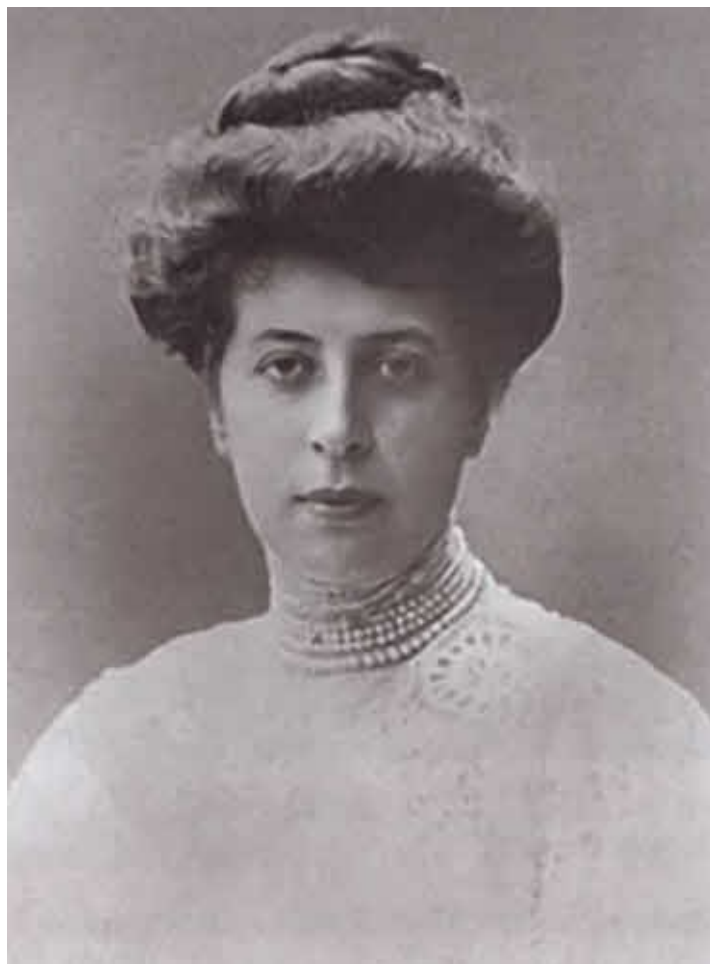
Меценатка Маргарита Кирилловна Морозова