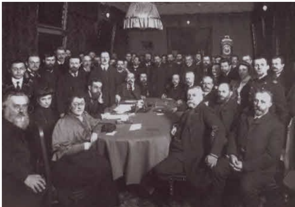
Депутаты распущенной Первой Государственной думы на Выборгском вокзале.