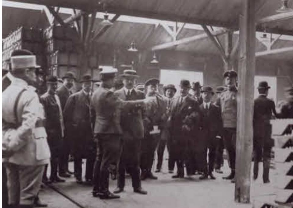
Милюков в составе делегации посещает завод в Гавре.