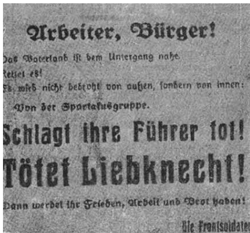
Погромный плакат с призывом к убийству Карла Либкнехта