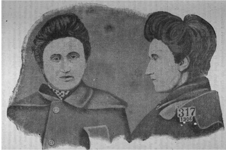
Роза Люксембург о Варшавской тюрьме.

Но ошибку подчинения социал-шовинистам он 4 августа 1914 г. сделал, и благодаря этому, конечно, замедлилось дело сплочения сил пролетариев-интернационалистов. Эту ошибку Либкнехт разделил со всеми (или почти всеми) германскими «левыми». Это была не его личная ошибка, а ошибка целой группы, недостаток не его личный, а целого направления.,