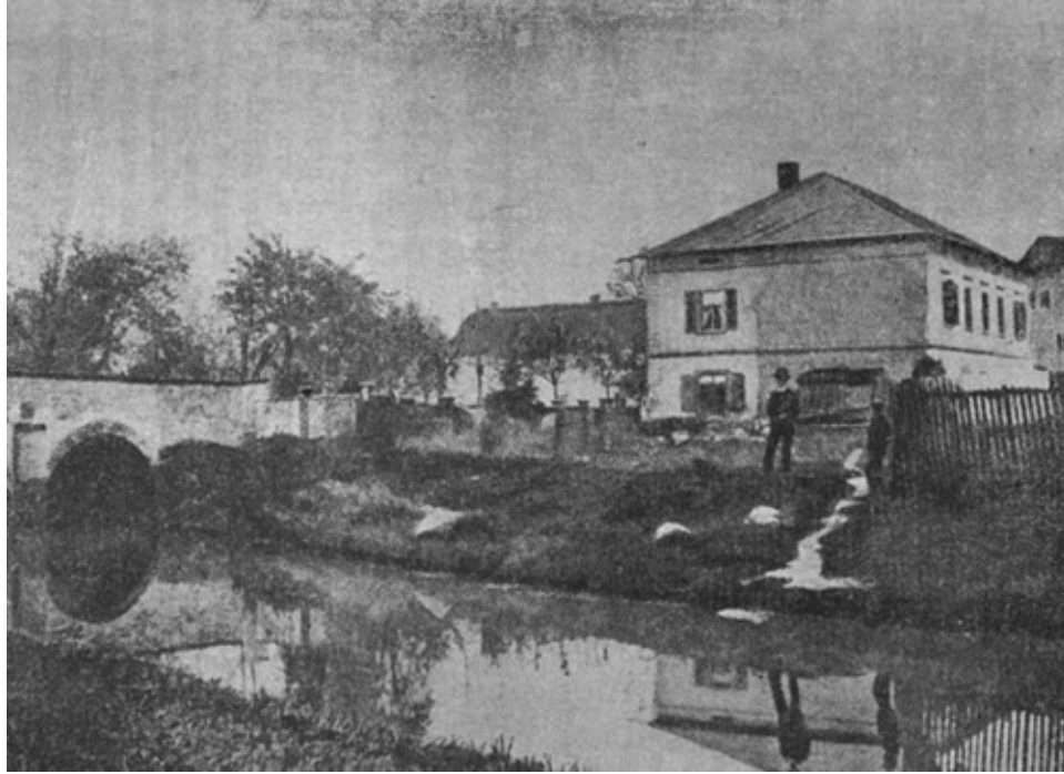
Борсдорф. Здесь жил Карл Либкнехт мальчиком

Дети Вильгельма Либкнехта посещали школу попережнему в Лейпциге, ибо в Борсдорфе хороших школ не было. Ездить надо было почти каждый день. Это было трудно, да и стоило денег. В школе детям Вильгельма Либкнехта, в том числе и Карлу, приходилось терпеть всевозможные преследования. Имя Либкнехта было уже тогда самым ненавистным для германской буржуазии именем. «Человек без отечества» пользовался дурной славой и у многих наиболее тупых и ограниченных «образованных» мещан. Травля детей Либкнехта в школе велась больше именно на почве защиты «патриотизма». Уже мальчиком Карл умел показывать зубы своим гонителям. Он проявлял большую стойкость и независимость уже в самой ранней юности. В школе у него было несколько школьных товарищей, с которыми он крепко дружил. С ними он сохранил, к слову сказать, прочные личные связи и в зрелом возрасте. По отношению же к тем, кто, поддакивая наихудшим из учителей, участвовал в травле, — Карл держался гордо и независимо. «В юности, — вспоминает впоследствии Карл, — и мне пришлось испытать много политических нападков и в школе и в других местах, но я переносил их с гордостью,