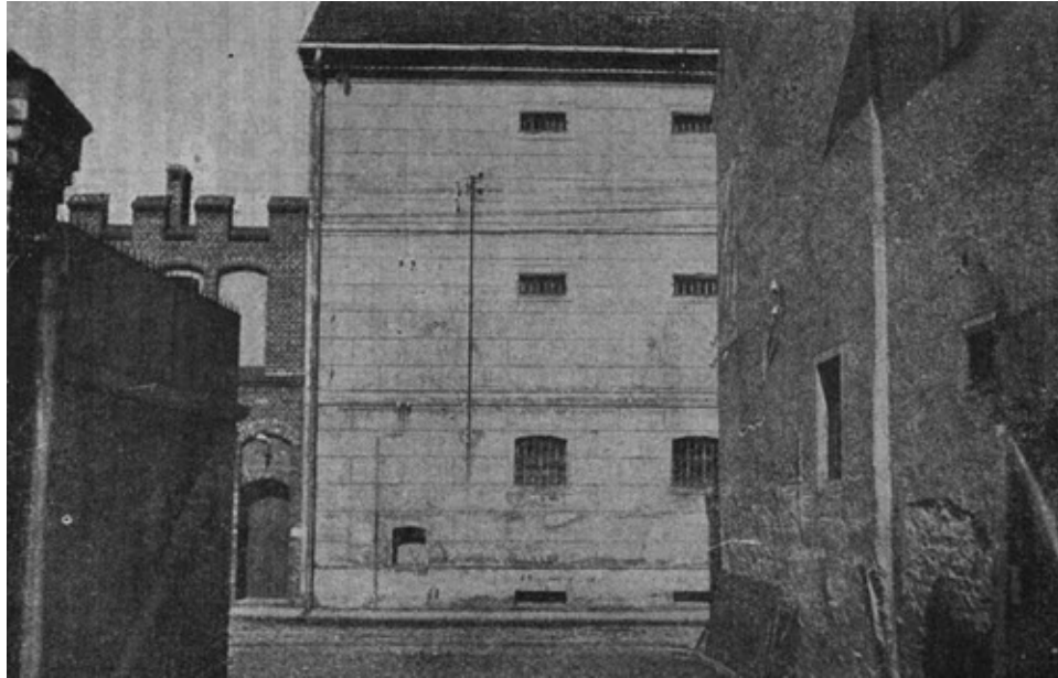
Внутренний вид тюрьмы в Люкау.

революционные бои. Жадно ловит он каждую весточку с воли. А ему в это время приходится в тюрьме заниматься исследованием о «законах движения».