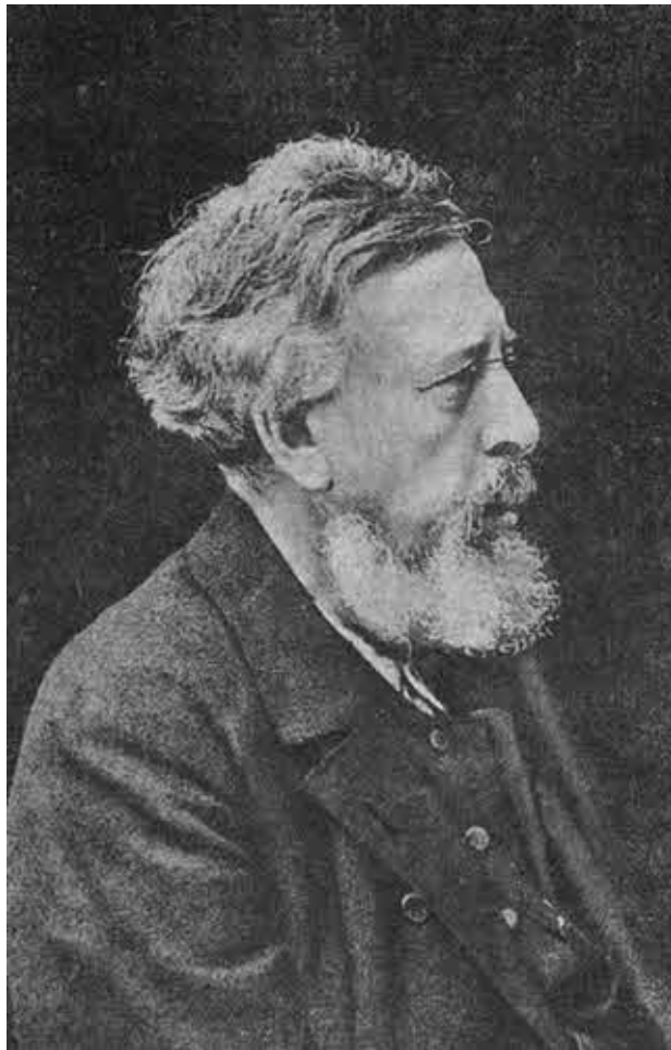
Один из последних портретов Вильгельма Либкнехта

борьбу за свои принципы. Никогда я не искал никаких личных преимуществ. А если личные интересы когда-либо сталкивались с моими принципами, я немедленно жертвовал первыми в пользу вторых. Если после неслыханных обрушившихся на меня преследований я попрежнему беден, то этим я только горжусь, ибо это — (самое красноречивое свидетельство в пользу моей чести. Еще раз: я не являюсь заговорщиком по профессии или конспиратором из любви к искусству. Если хотите, назовите меня солдатом революции ; против этого я возражений не имею. С ранней моей молодости мною владели два идеала: свободная и единая Германия и эмансипация трудящегося народа , т. е. устранение классового господства, что равносильно освобождению: человечества. За эту двойную цель я по мере сил боролся и буду бороться до последнего издыхания. Этого требует долг». Так говорил Либкнехт на суде.