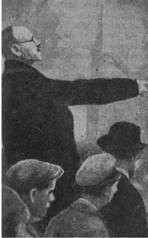
Карл Либкнехт на трибуне.

А когда 11 ноября собирается Берлинский совет рабочих и солдатских депутатов, Либкнехта лично приветствуют горячо и с великим энтузиазмом, но предложений его группы не принимают. И Либкнехт остается тут почти один. Его речи внимают сначала благоговейно. Его самого готовы носить на руках, в буквальном смысле слова. Но когда он в конце речи требует убрать с дороги Эберта и К°, толпа отвечает возгласами: « Единство, единство, единство! » (Там же, стр. 156). И когда спартаковцы пробуют провести в первый Исполком Розу Люксембург, они терпят поражение.