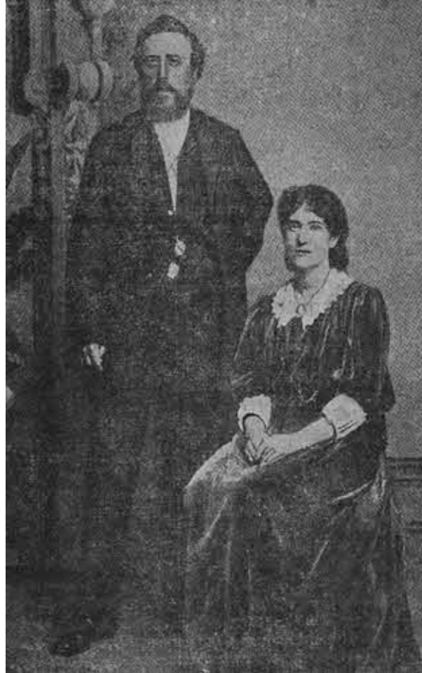
Вильгельм Либкнехт с дочерью Карла Маркса, Элеонорой Маркс-Эвелит

Приведем тут же один из наиболее резких отзывов Маркса о Вильгельме Либкнехте. В письме от 10 августа 1869 г. Маркс писал Энгельсу о В. Либкнехте в крайней досаде по поводу мелкобуржуазных иллюзий последнего в вопросе о «народном государстве», «демократии» и т. п. «Это животное, — пишет «ласково» Маркс о Либкнехте, — верит в будущее «государство демократии». Ему оно мерещится то в виде конституционной Англии, то — буржуазных Соединенных штатов, то жалкой Швейцарии». «Оно (т. е. опять-таки животное), верящее в демократию) и не подозревает о какой-либо революционной политике», т. е. о политике революционного насилия, политике пролетарской диктатуры. Вот с какой резкостью бичевал Маркс даже своих ближайших сотрудников,