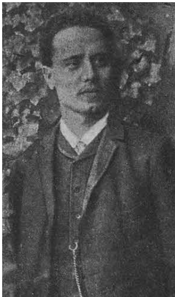
Карл Либкнехт в молодости

Радек, знавший Карла Либкнехта в ранние годы последнего, пишет о нем: «Смельчак, человек хороший, как говорят поляки, и для выпивки, и для перестрелка, полный энергии, веселый, любимец рабочих, любимец женщин, всегда на ногах, всегда бодрый, полный планов. Не забуду никогда, как этот человек во время лейпцигского съезда германской социал-демократии в течение 6 дней после работ съезда, после вечерних массовых митингов, ночью, в продолжение всей недели «крутил» с нами, молодыми, до белого утра, сидел в кафе за стаканом вина, в красной фригийской шапке из бумаги — тогда в Лейпциге была известная лейпцигская ярмарка, — как, с испугом заломив руки, смотрел на него его серьезный брат Теодор. Во всяком своем жесте Карл Либкнехт был сыном своего отца — великого