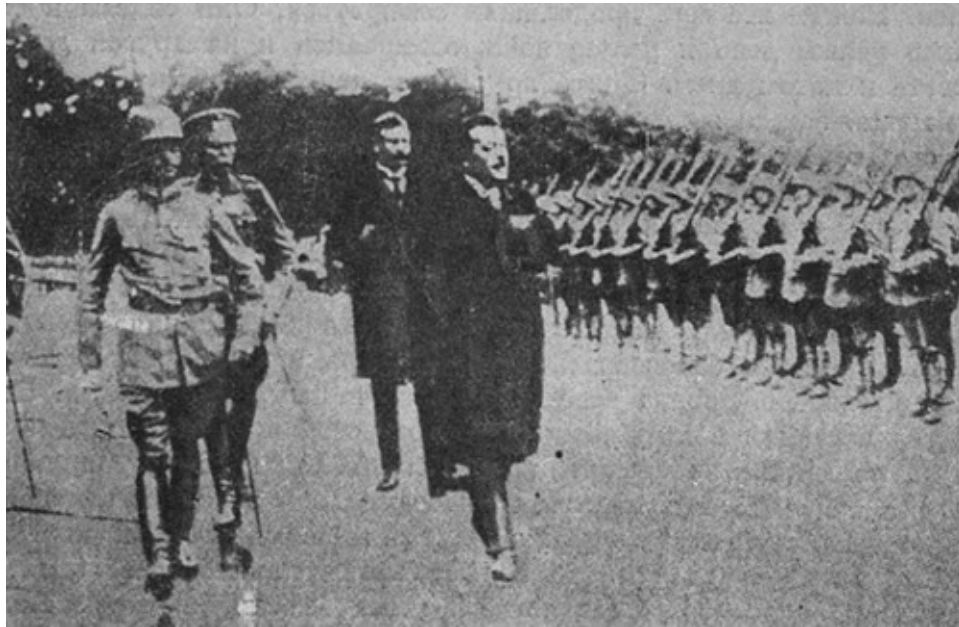
Эберт принимает парад белогвардейских войск

обеспечить руководство в такой обстановке. Тут нужна была сплоченная и закаленная в боях коммунистическая партия. А ее-то и не было. Даже палач Носке вынужден был впоследствии признать, что «если бы эта толпа имела решительных и дельных вождей... она уже утром этого дня могла бы овладеть Берлином».