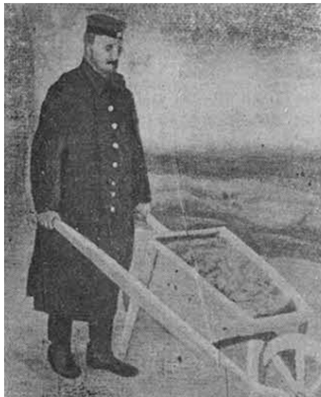
Карл Либкнехт на фронте.

«Там мы работаем до часу ночи; в два часа начинаем обратный поход к квартире. Приходим в три часа. Пьем кофе. Затем — в «постель», т. е. ложимся на солому в ледяном сарае, кутаясь в холодные шинель и одеяло. Сегодня было два градуса ниже нуля.