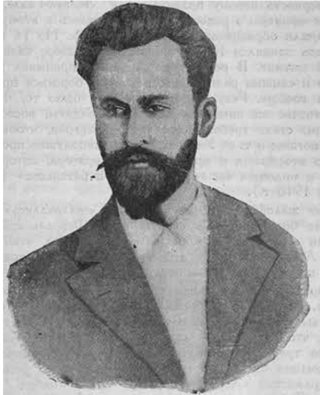
Леон Тышко (Иогихес).

Карла Либкнехта, сказанные им несколько часов назад в цирке Буша рабочим и солдатам: «Контрреволюция находится среди вас», — были слишком справедливы.