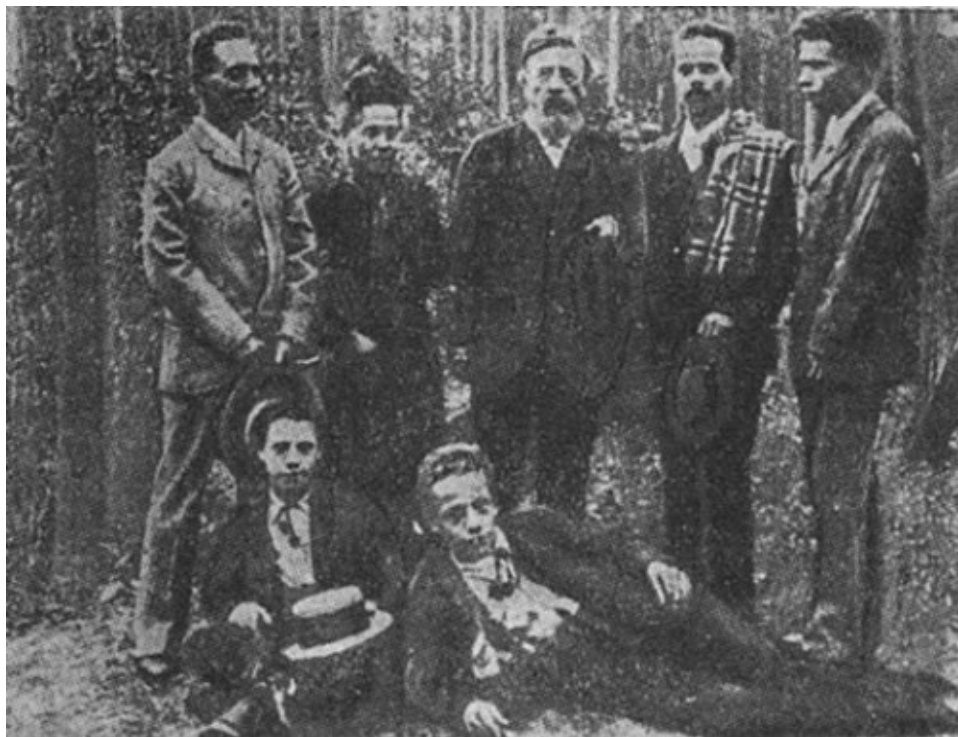
Редкий снимок семьи Либкнехт. В середине — В. Либкнехт, слева — Карл, справа — его брат