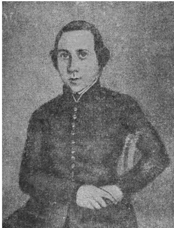
Вильгельм Либкнехт в 1848 г. добровольцем в революционном отряде.

который должен-де на обоих штыках «принести республику» в Германию. За эту идею ухватился и 22-летний Либкнехт. В своих воспоминаниях о Марксе Либкнехт рассказывает, что Маркс был решительно против этого искусственного плана создания «иностранных легионов» и видел в нем даже отчасти интригу французских буржуазных республиканцев, желавших таким образом прежде всего избавиться от революционных иностранных, рабочих и беспокойных эмигрантов. От практического участия в этом предприятии Либкнехта избавила болезнь. «Легион» Гервега был рассеян еще раньше, чем мог приступить к каким-либо серьезным действиям, а Либкнехт, поднявшись после продолжительной болезни, отправился из Парижа назад в Цюрих. Но ненадолго. Движение нарастало. Через несколько недель Либкнехт очертя голову бросился в борьбу.