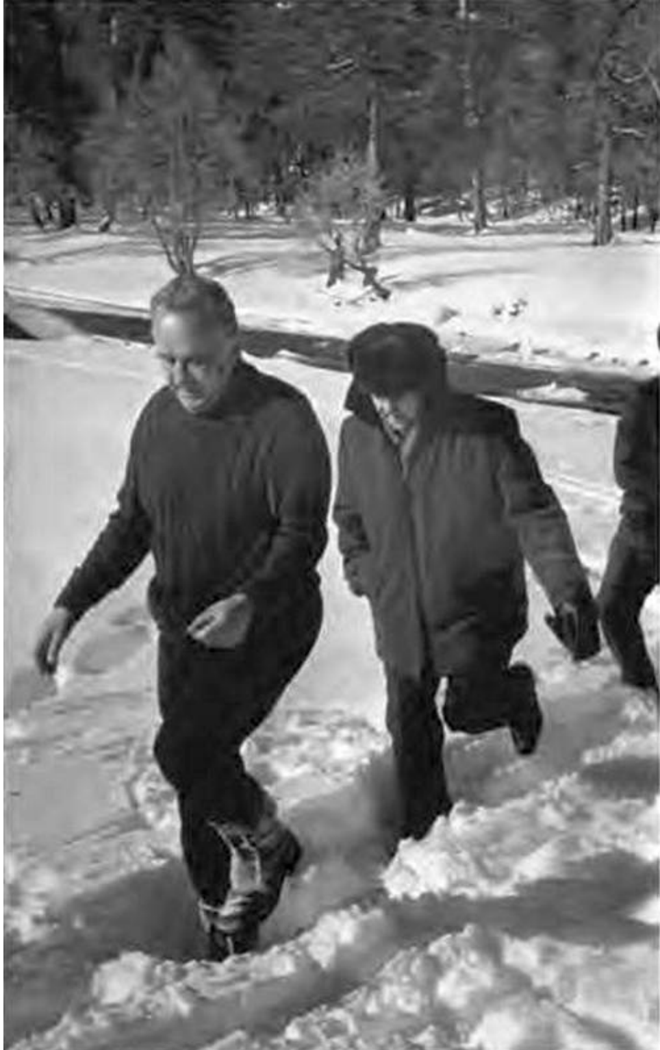
Смотрите, кто идет за Косыгиным! Узнали Горбачева?