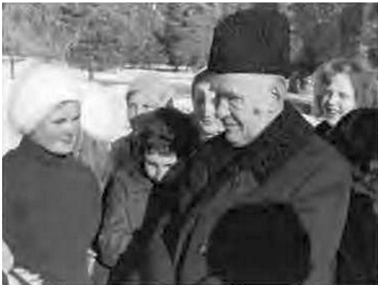
Косыгин и в отпуске не оставался один.