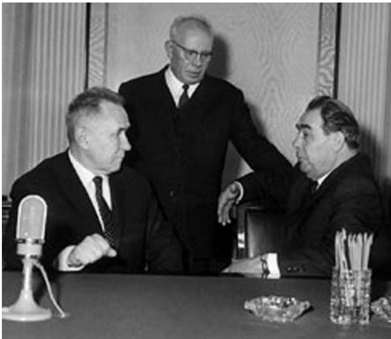
Триумвират: Генеральный секретарь ЦК КПСС Леонид Ильич Брежнев, Председатель Президиума Верховного Совета СССР Николай Викторович Подгорный, Председатель Совета Министров СССР Алексей Николаевич Косыгин.