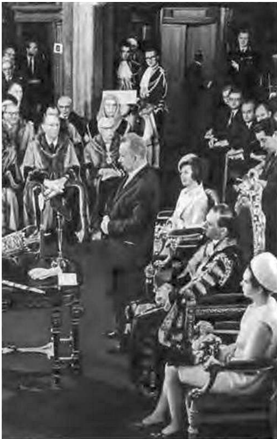
Председатель Совета Министров СССР А. Н. Косыгин выступает в Вестминстерском дворце — парламенте Великобритании во время официального визита. Лондон. 1967 г.