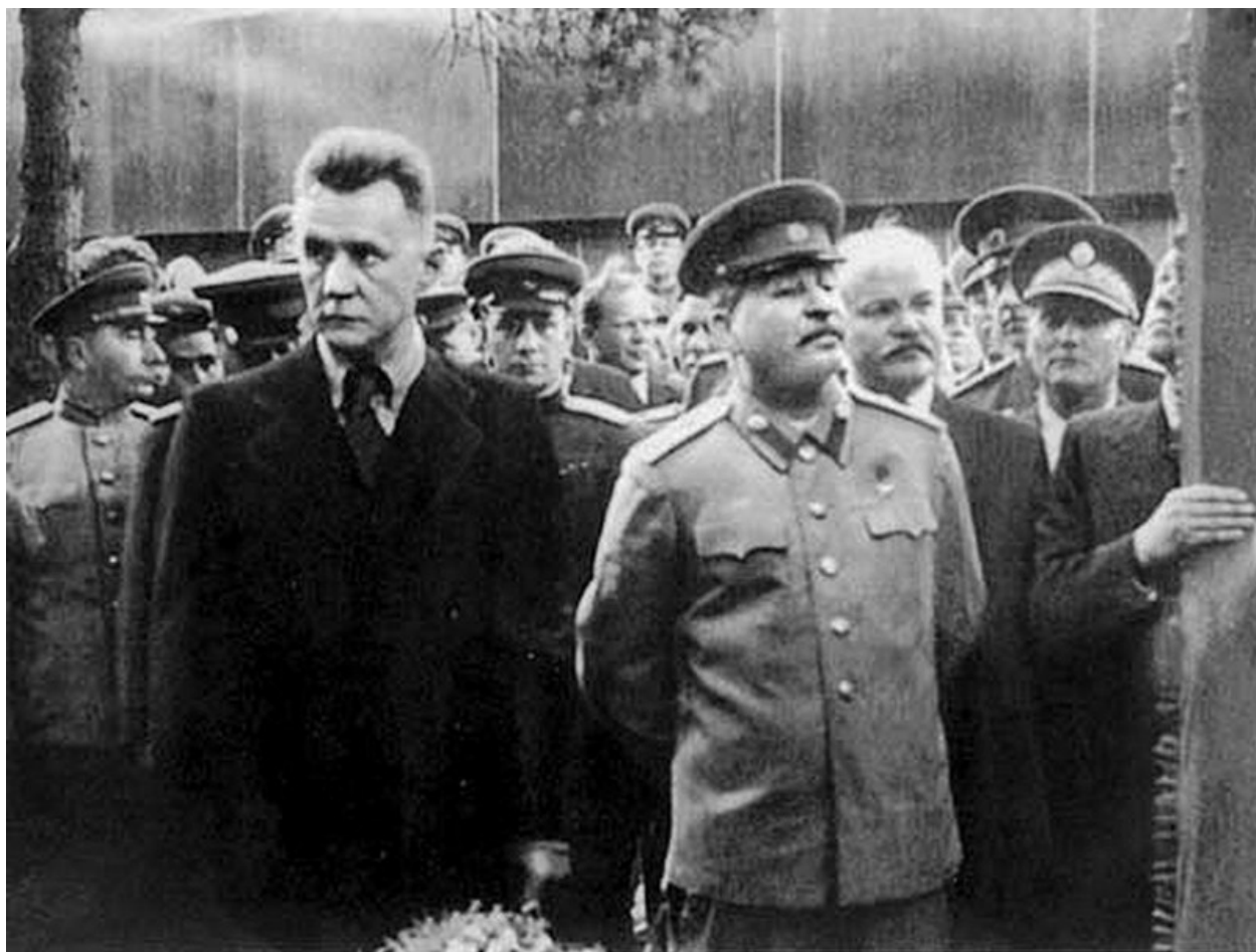
Косыгин не часто стоял рядом со Сталиным.