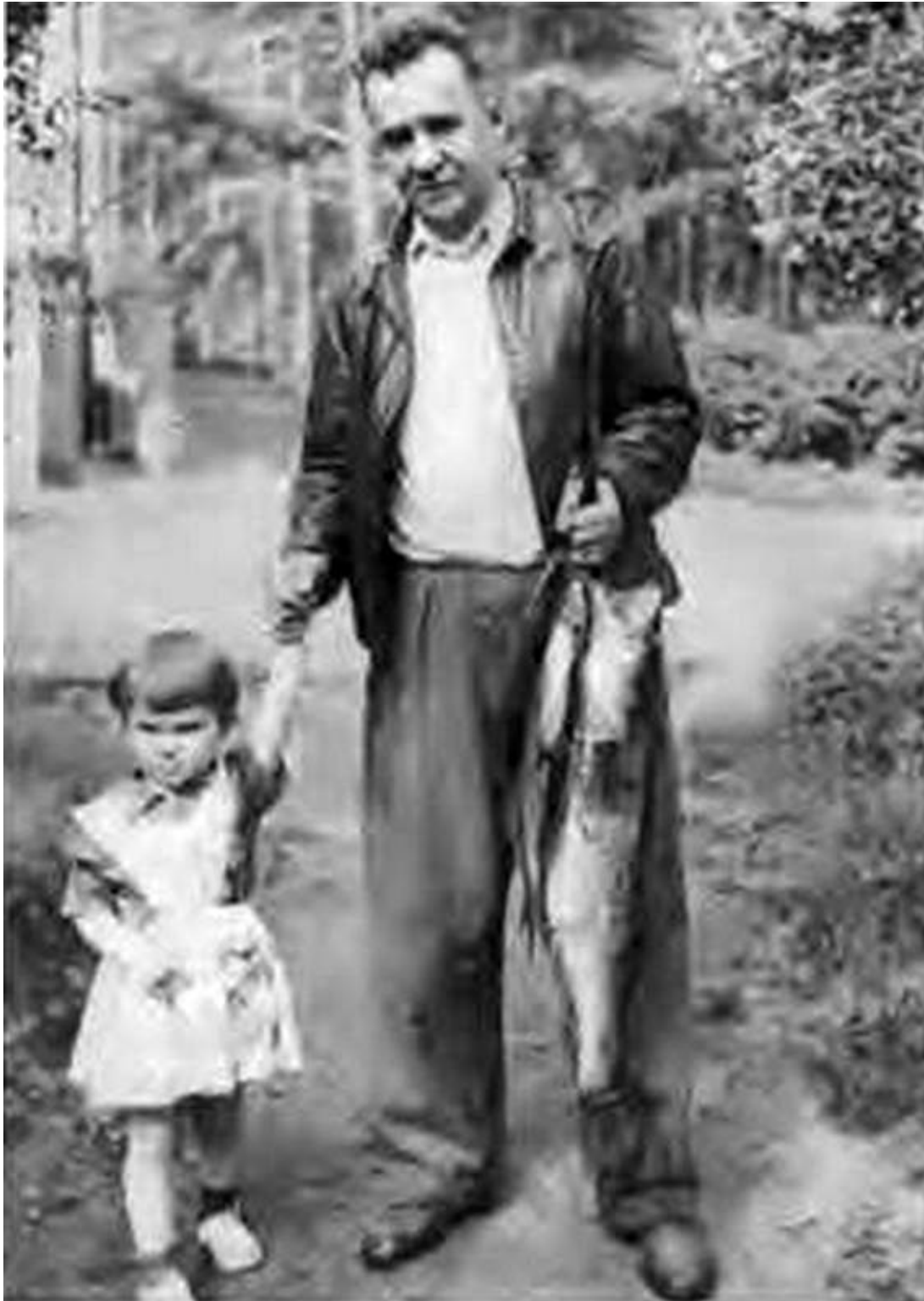
Дед и внучка после удачной рыбалки Архангельское, 1956 г.