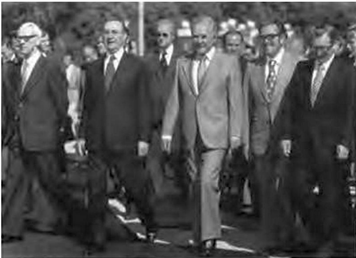
Председатели правительств социалистических стран перед заседанием Совета Экономической Взаимопомощи в Варшаве. 1978 г.