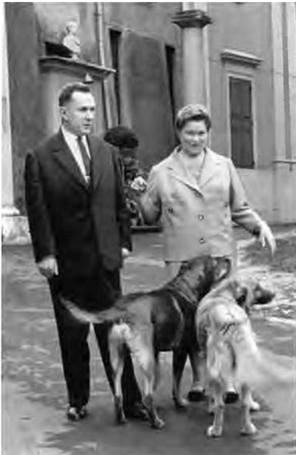
Алексей Николаевич и Клавдия Андреевна Косыгины в Риме. Вилла посольства СССР. Май 1960 г.