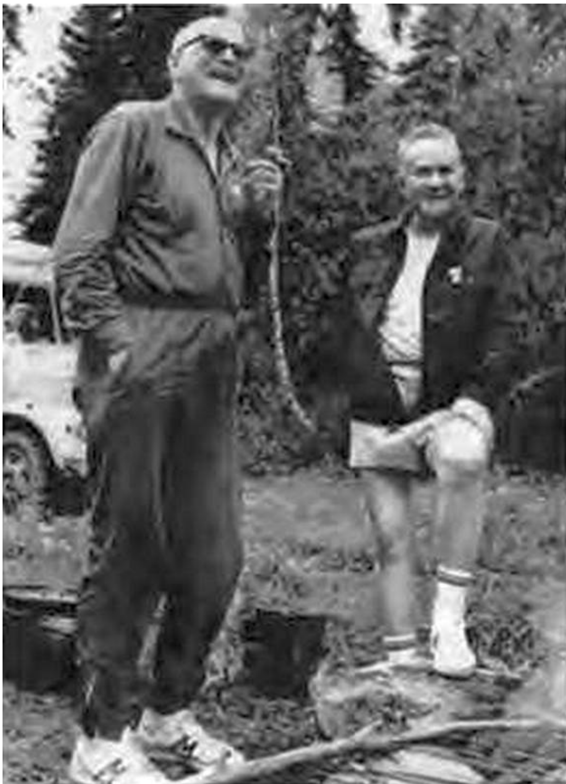
... но неофициальная программа ему больше по душе. С Урхо Кекконеном на Кавказе и на рыбалке в Финляндии.