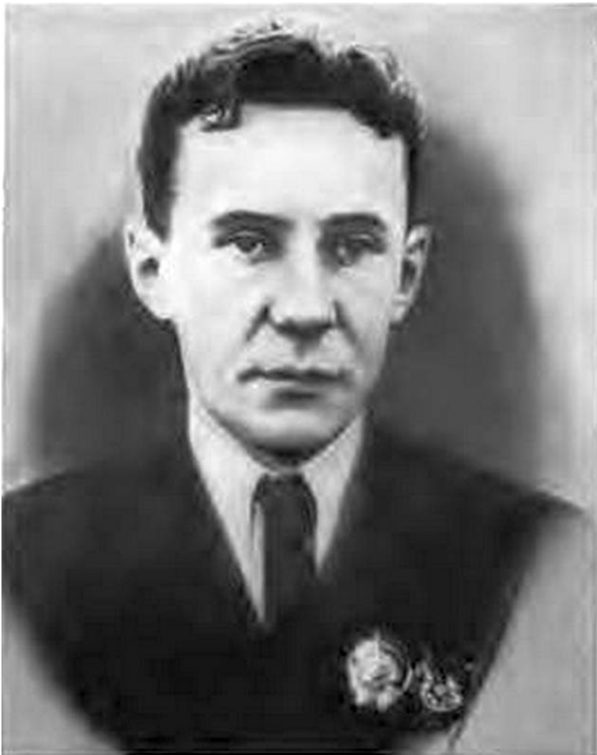
Этот снимок со своим автографом Уполномоченный ГКО в блокадном Ленинграде Косыгин подарил родному институту в 1942 году.