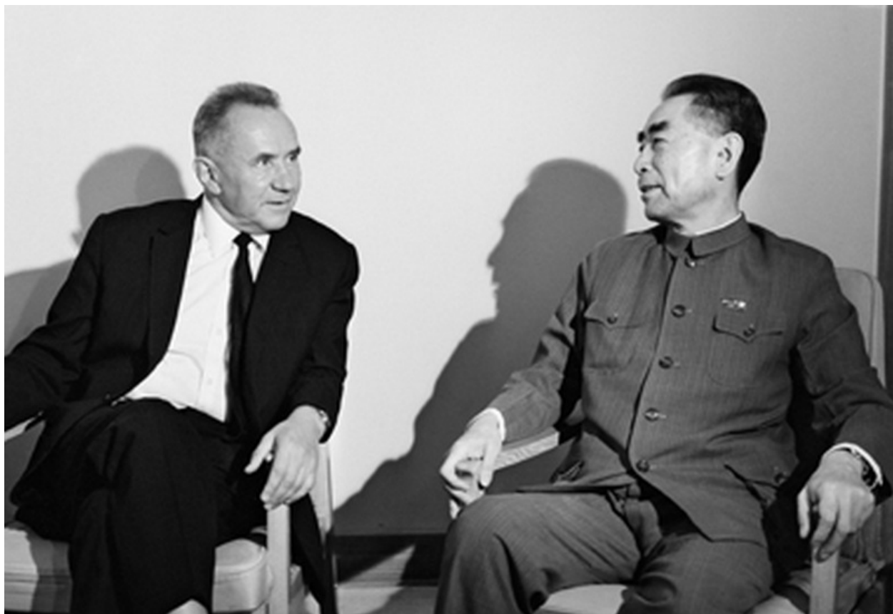
Трудный диалог с Чжоу Эньлаем в Пекине...