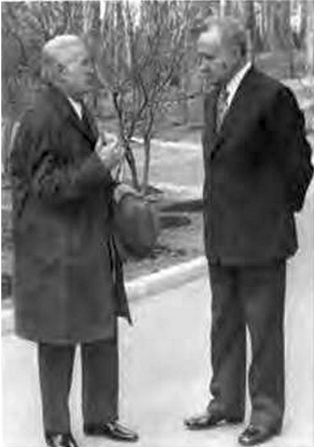
Премьер внимательно прислушивался к ученым — слева от Косыгина академик Челомей.