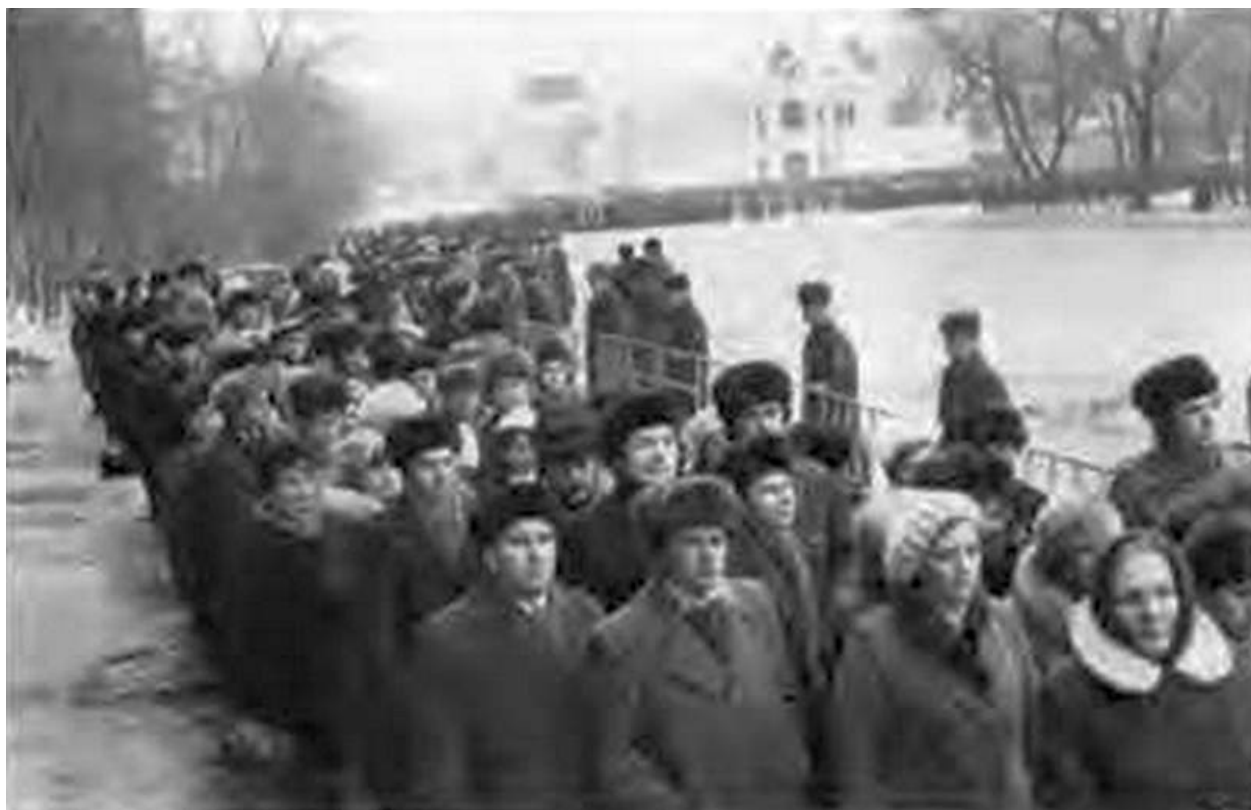
С Косыгиным страна прощалась не по разрядке.