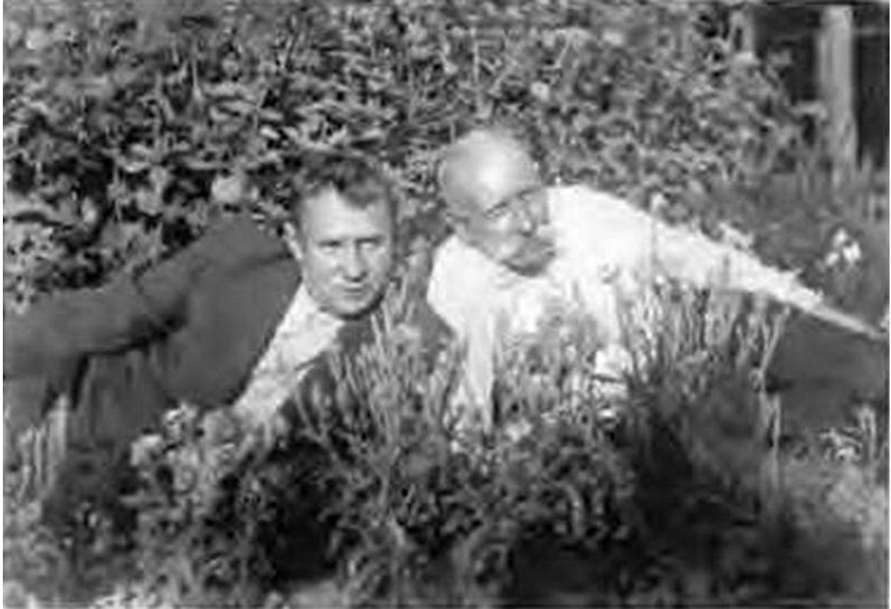
Отец и сын. Это их последний совместный снимок. Архангельское, 1955 г.