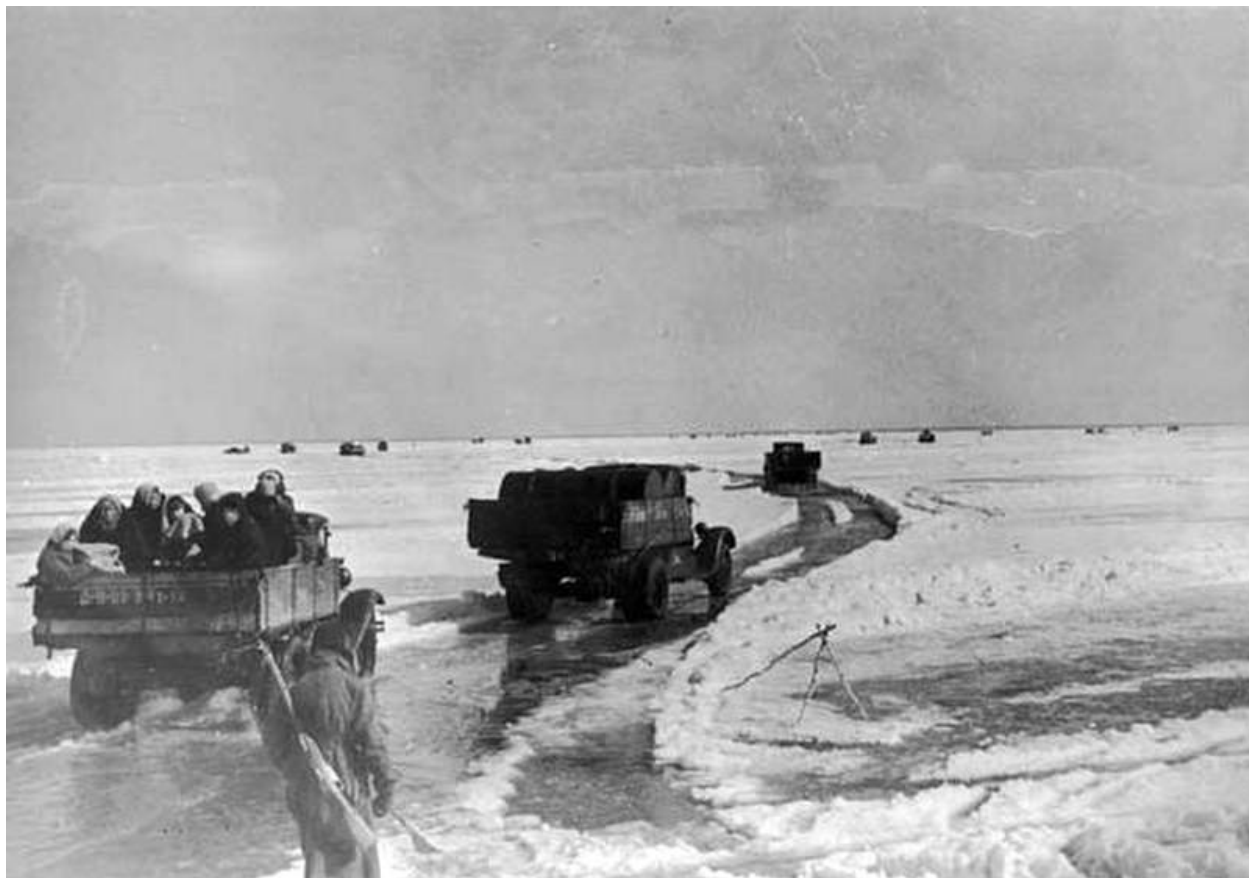
Ленинград. «Дорога жизни», 1942 год. В этой дороге — воля, труд и мужество тысяч ленинградцев. И — Алексея Николаевича Косыгина.