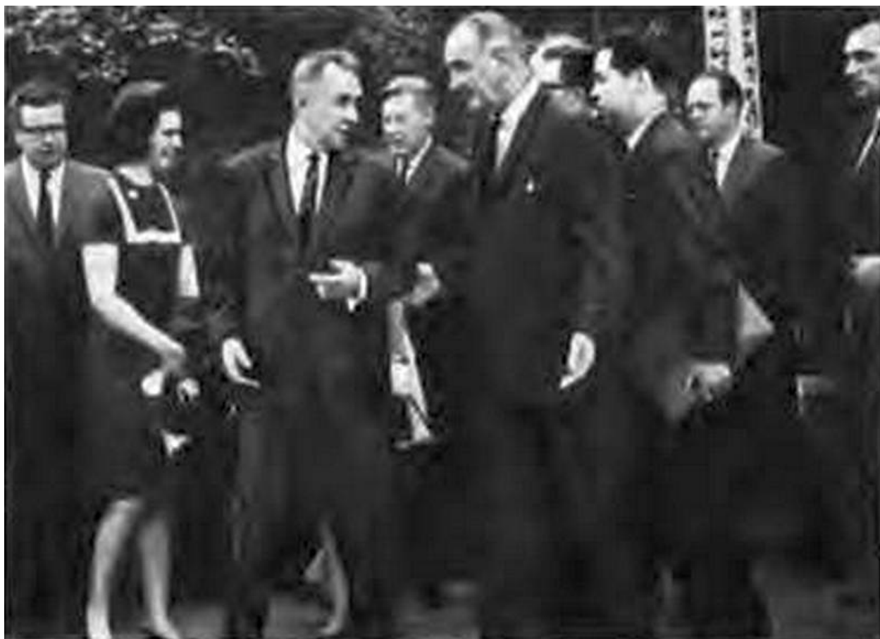
...и с президентом США Джонсоном в Гласборо.