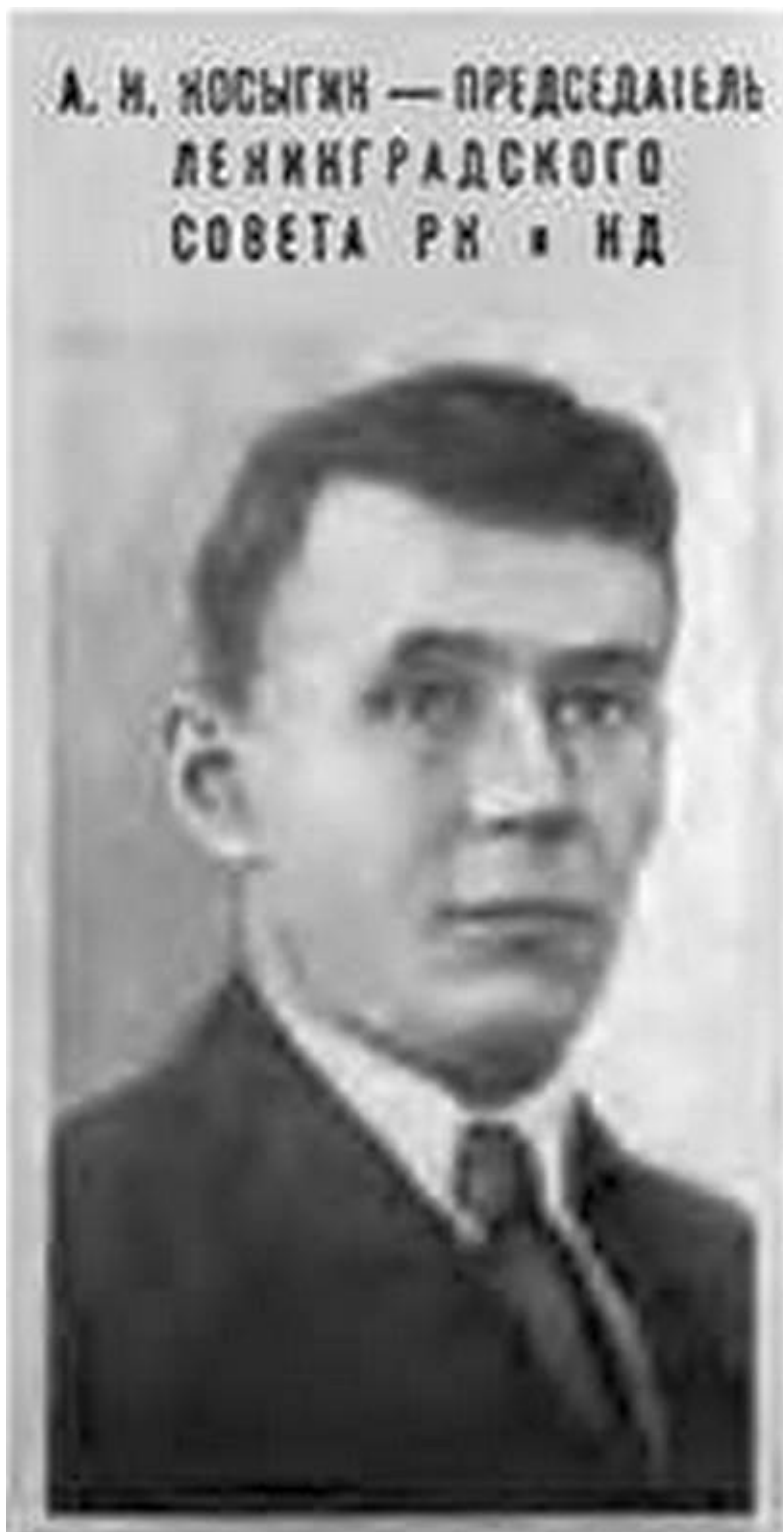
Так «Ленинградская правда» представила нового председателя Ленсовета. 1938 г.