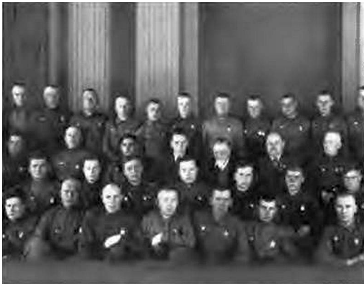
После вручения орденов участникам обороны Москвы. В центре в третьем ряду Косыгин и Калинин, Председатель Президиума Верховного Совета СССР. Кремль. Декабрь 1941 г.