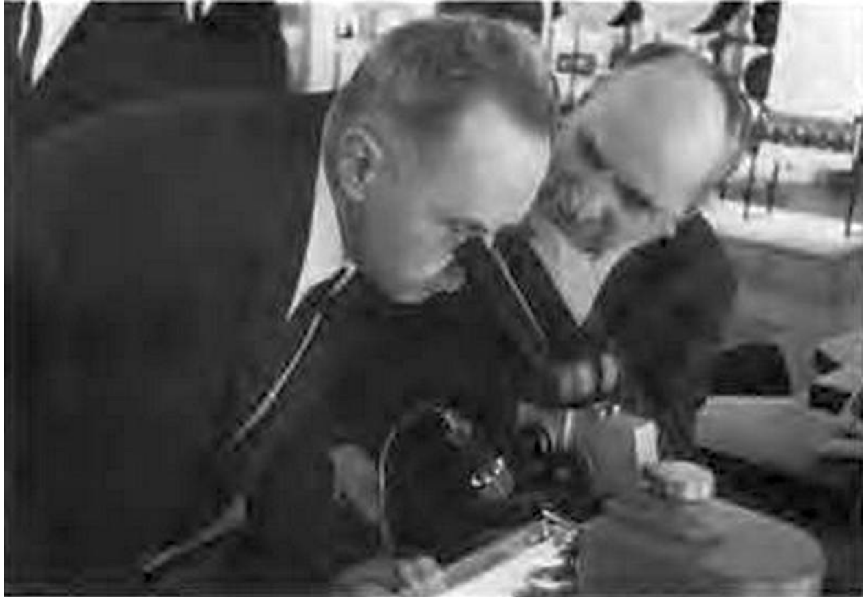
На снимке справа внизу министр электронной промышленности СССР А. И. Шокин.