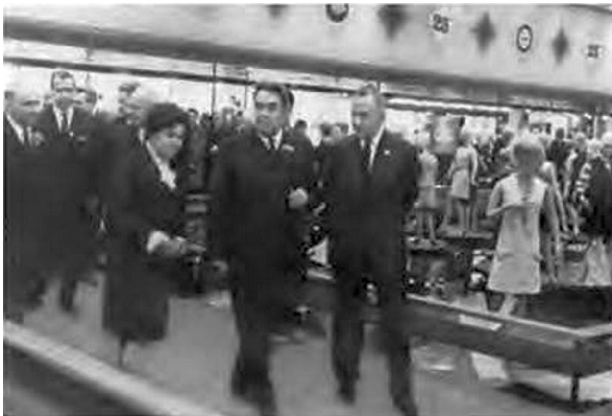
Л. И. Брежнев и А. Н. Косыгин на открытии юбилейной выставки Болгарии. Сзади Т. Живков и Н. В. Подгорный. Москва. ВДНХ. 1969 г.