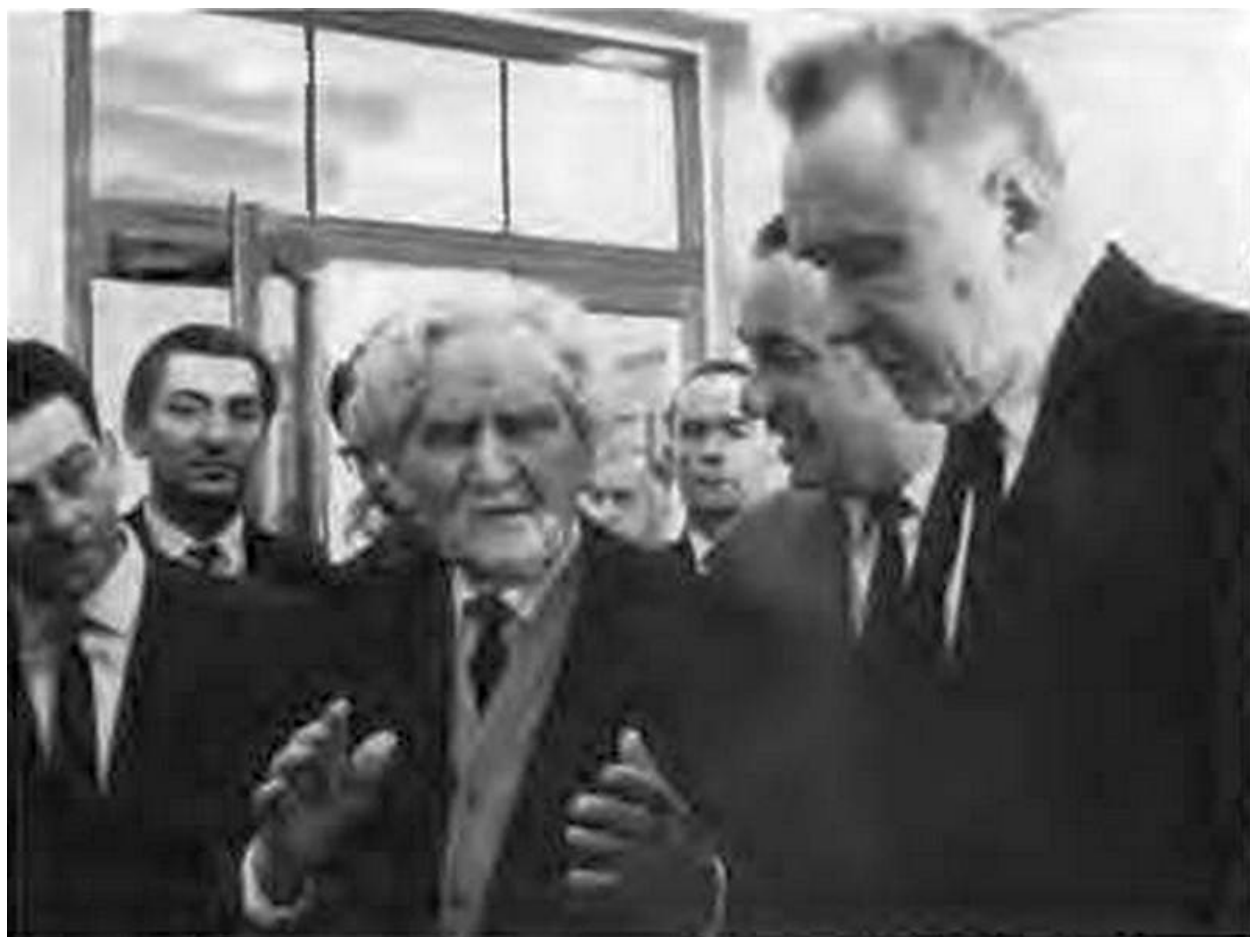
В гостях у Мартироса Сарьяна.