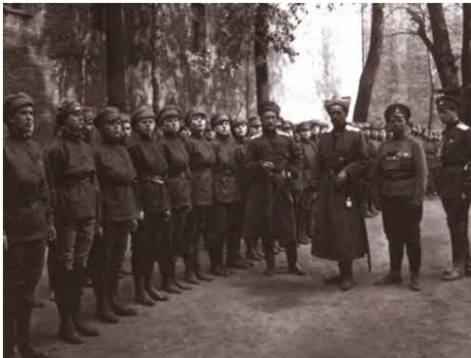
Командующий Петроградским военным округом генерал П. А. Половцов проводит смотр частей женского батальона М. Л. Бочкаревой.