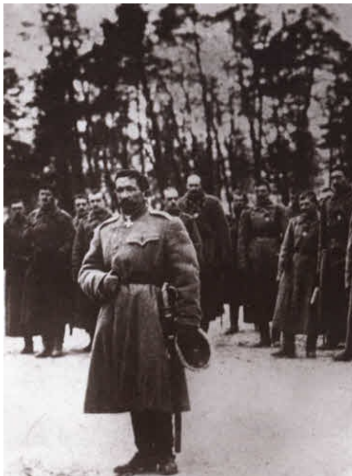
Молитва о России. Л. Г. Корнилов перед строем 25-го армейского корпуса. 1916.