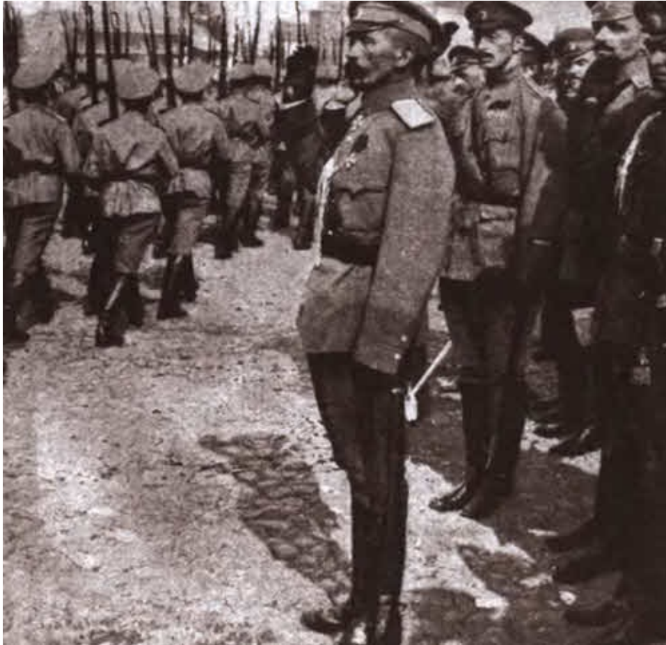
Генерал от инфантерии Л. Г. Корнилов принимает парад юнкеров Александровского военного училища 13 августа 1917 года в Москве.