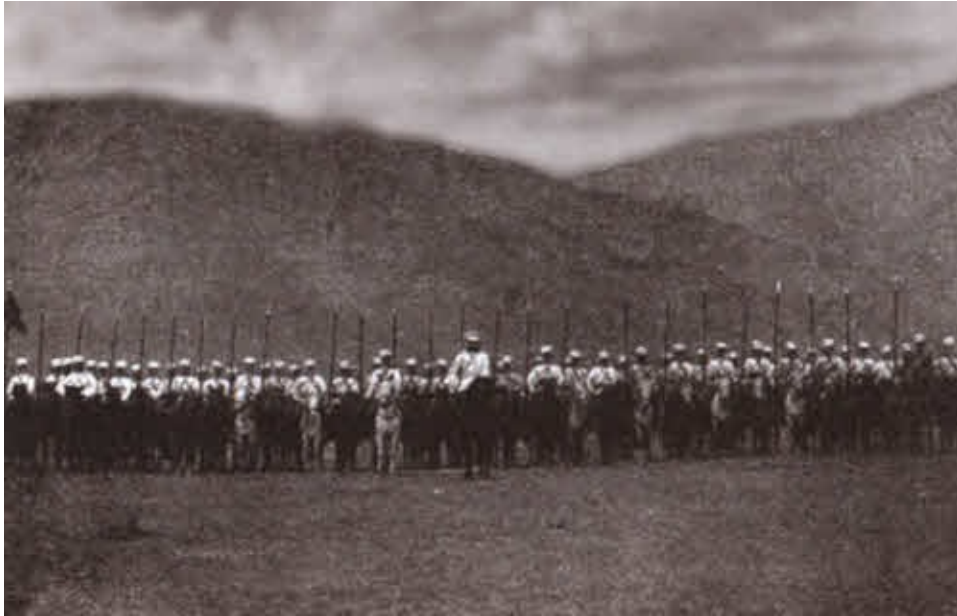
Фото конца XIX в.