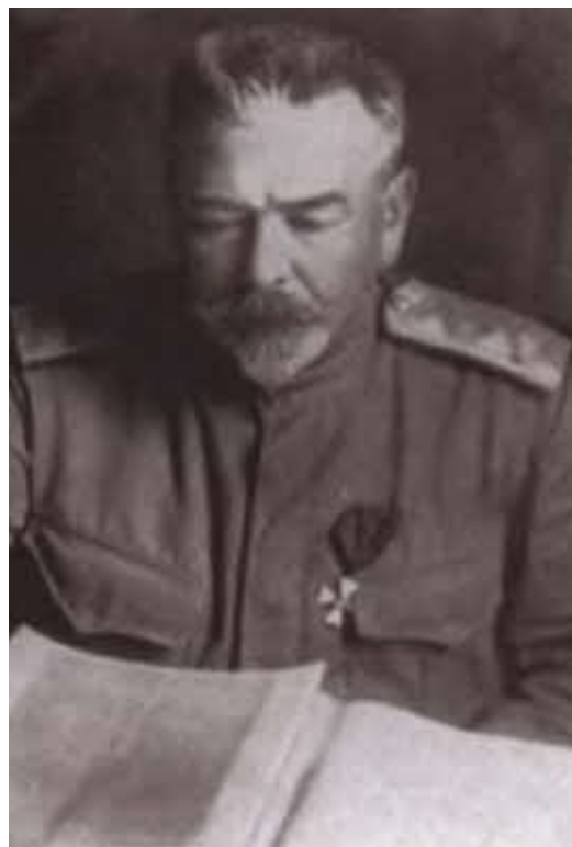
Генерал-лейтенант А. С. Лукомский.