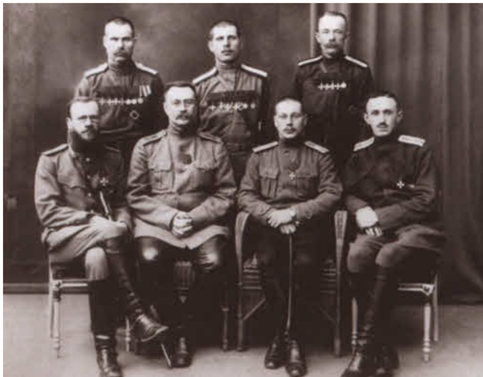
Группа георгиевских кавалеров.