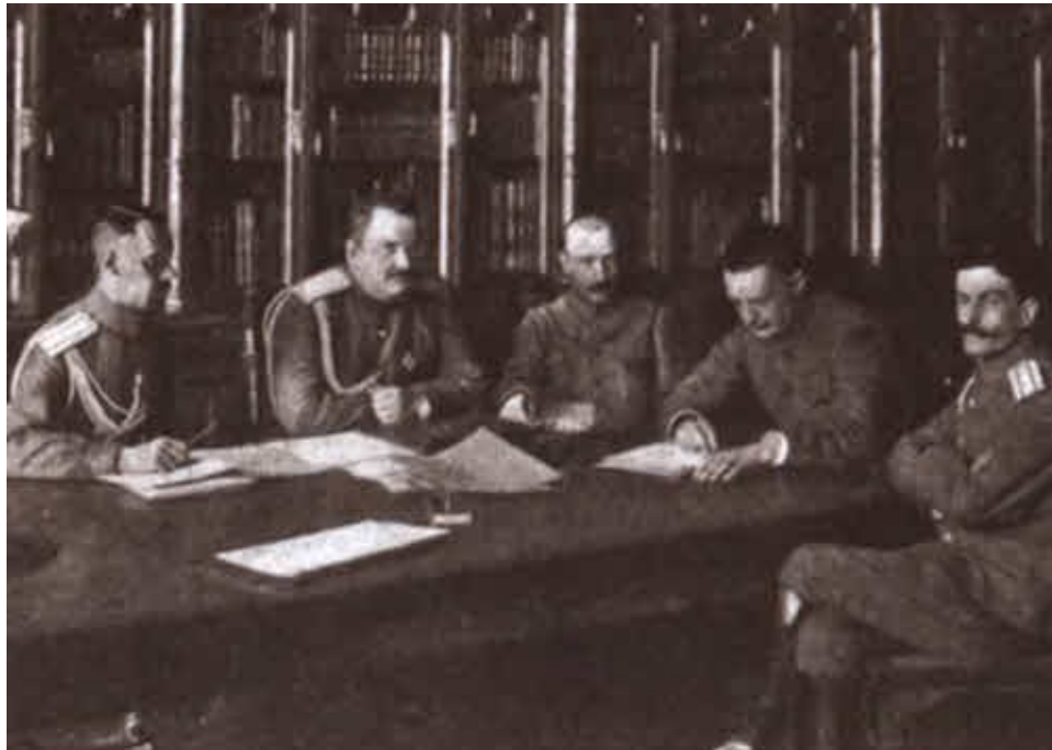
Глава Временного правительства А. Ф. Керенский (второй справа) с ближайшими помощниками в бывшей царской библиотеке Зимнего дворца (третий слева — Б. В. Савинков).