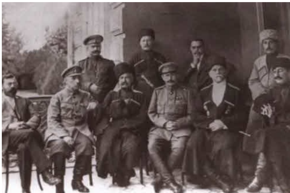
Открытка начала XX в.