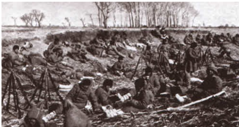
Отдых русских солдат в Маньчжурии. 1904.