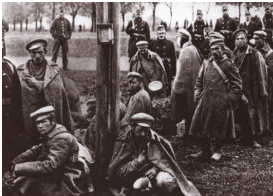
Русские солдаты в австрийском плену.