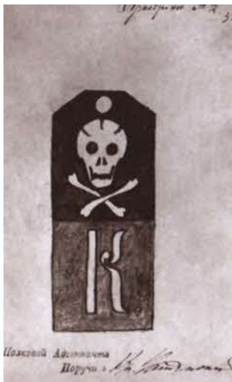
Проект погона рядового Корниловского ударного полка.