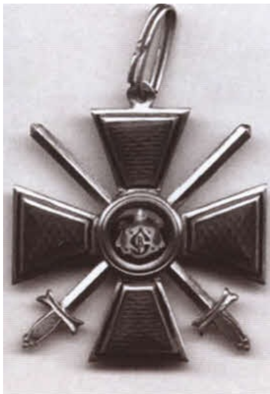
Знак ордена Святого Владимира III степени с мечами.