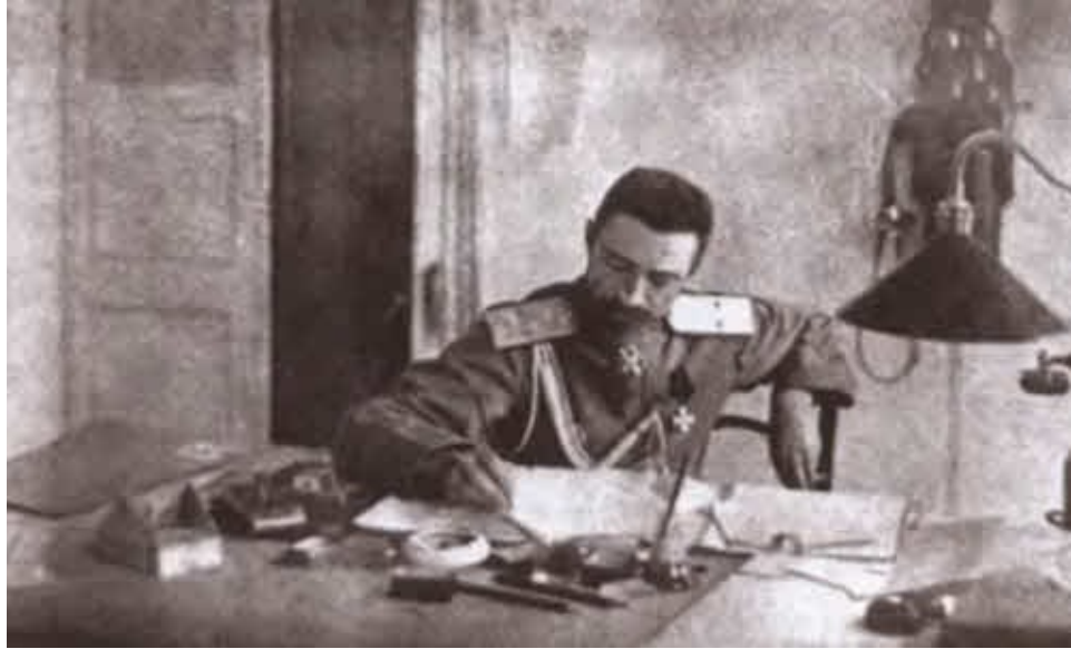
Генерал-лейтенант С. Л. Марков.