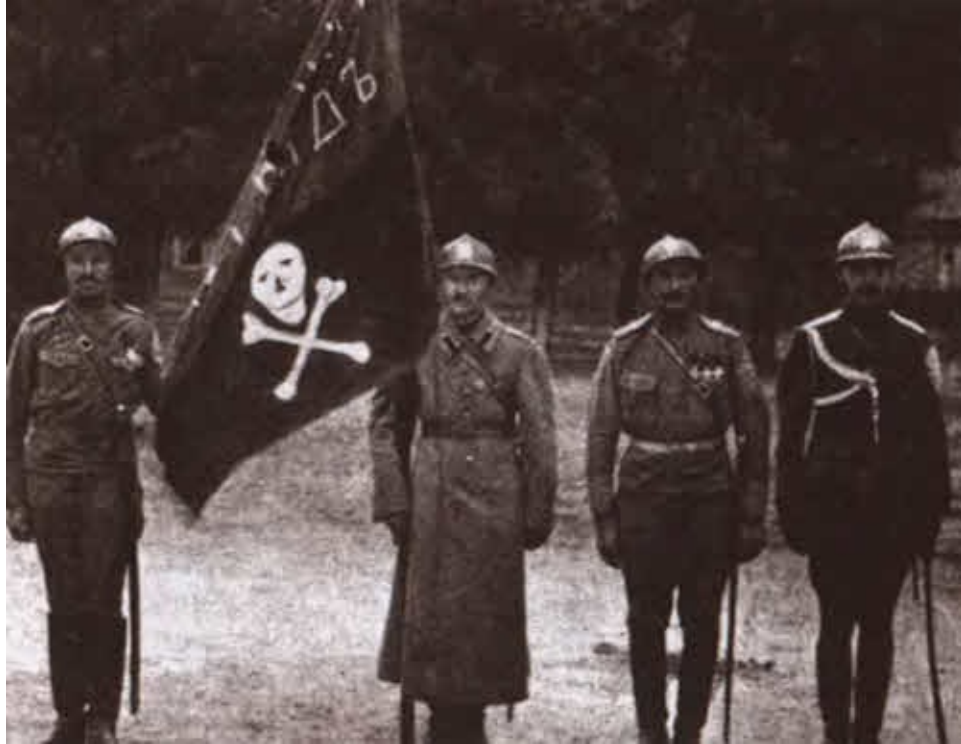
Знаменщик и почетный караул Корниловского ударного полка.