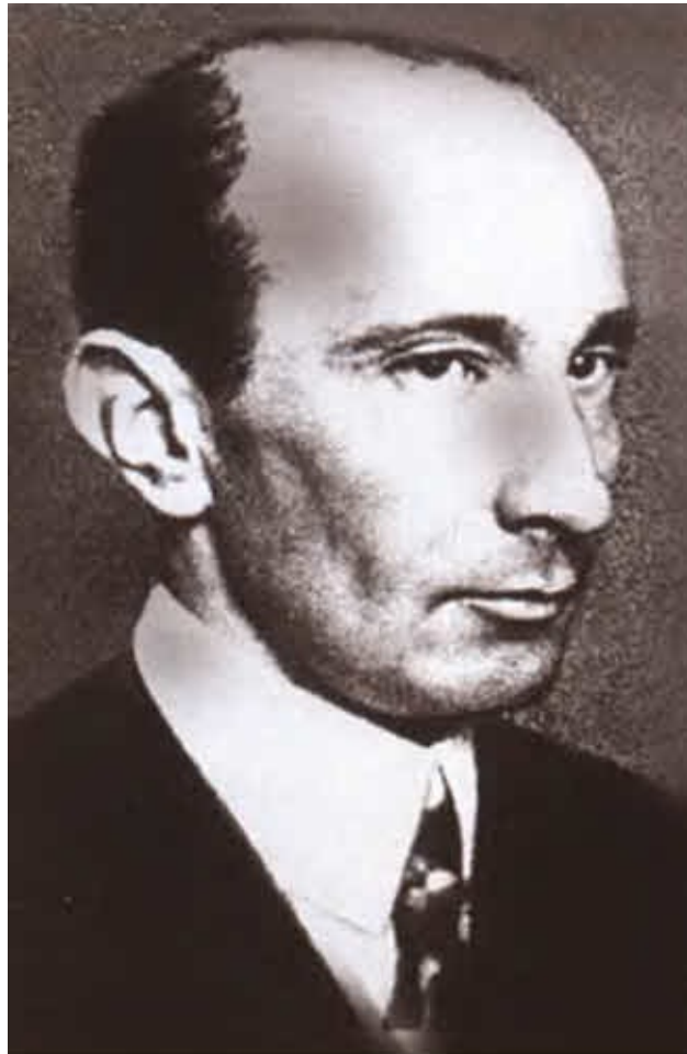
Б. В. Савинков.

В окопах позиционной войны летом 1917 года.