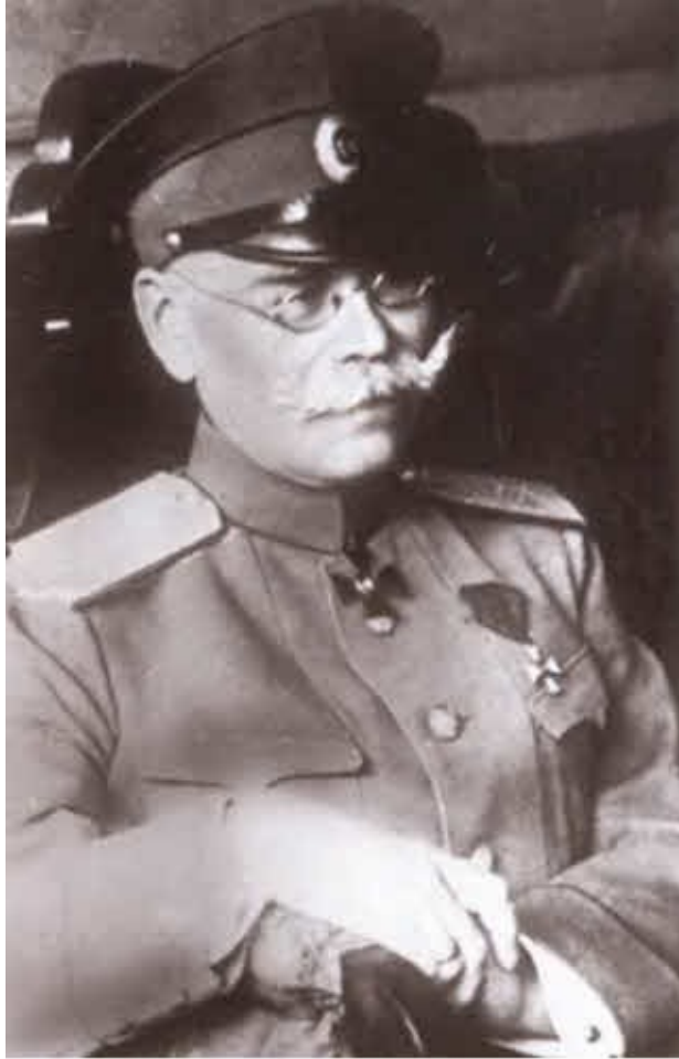
Верховный руководитель Добровольческой армии генерал от инфантерии М. В. Алексеев.