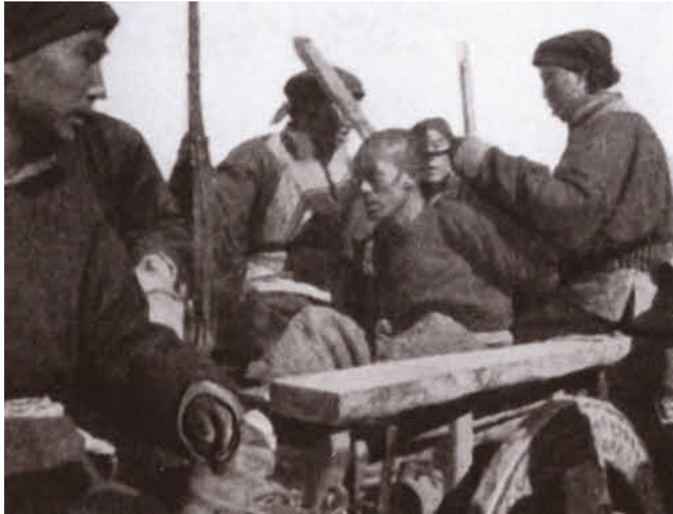
Пленные китайские хунхузы.