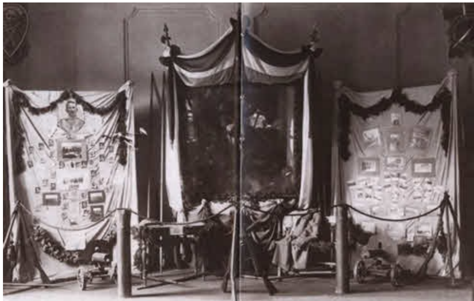
Публикуется впервые.

Центральная экспозиция выставки, посвященной памяти Л. Г. Корнилова в Таганроге летом 1919 года.