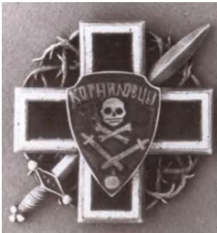
Знак Корниловского ударного полка. Утвержден председателем Русского общевойинского союза 12 июля 1931 года в Париже.