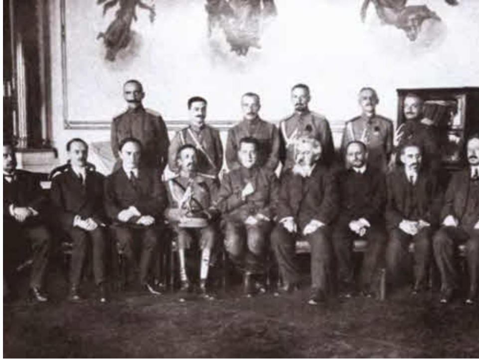
Временное правительство чествует генерала Корнилова.