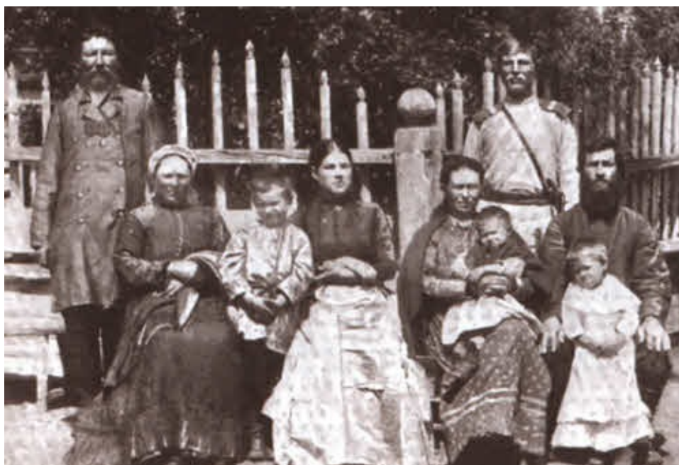
Фото конца XIX в.