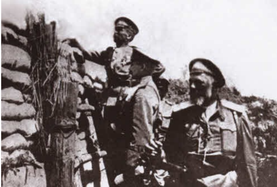
Генерал-лейтенант Л. Г. Корнилов на наблюдательном пункте. 1916.