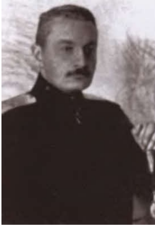
Генерал-лейтенант И. П. Романовский.