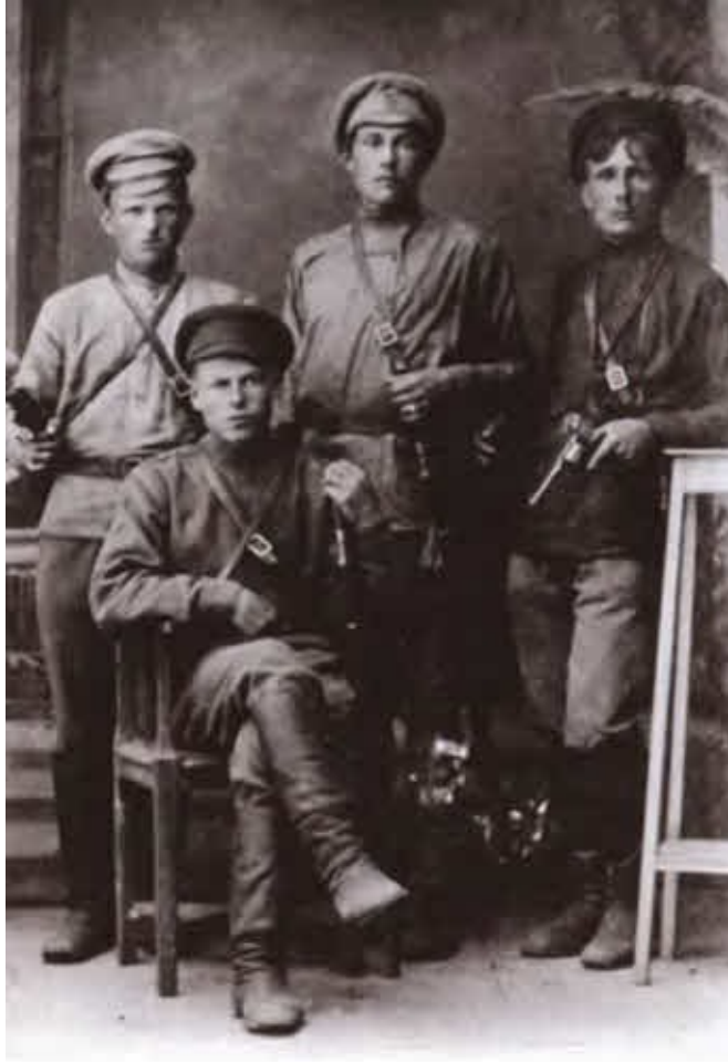
Молодые кубанские красноармейцы. 1918.