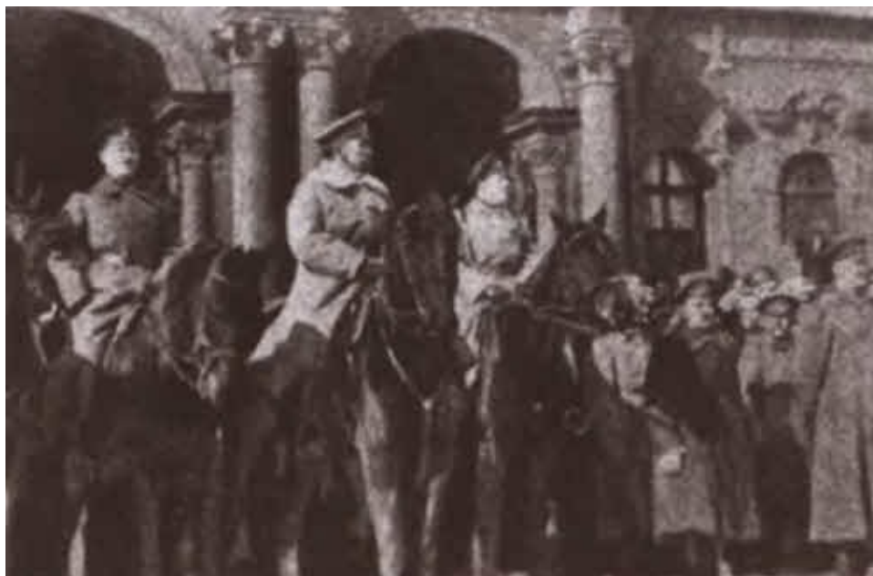
Главнокомандующий Петроградским военным округом генерал-лейтенант Л. Г. Корнилов