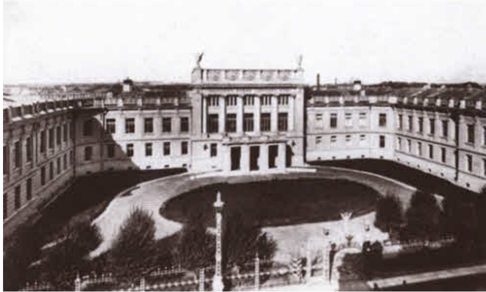
Николаевская Академия Генерального штаба.