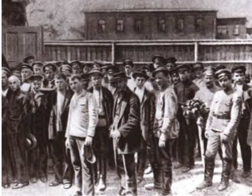
Мобилизация рабочих для отпора Корнилову в августе 1917 года.