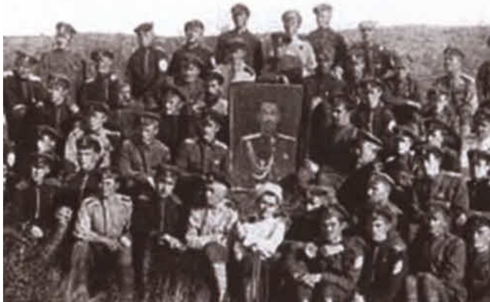
Группа корниловцев в эмиграции. 1921.