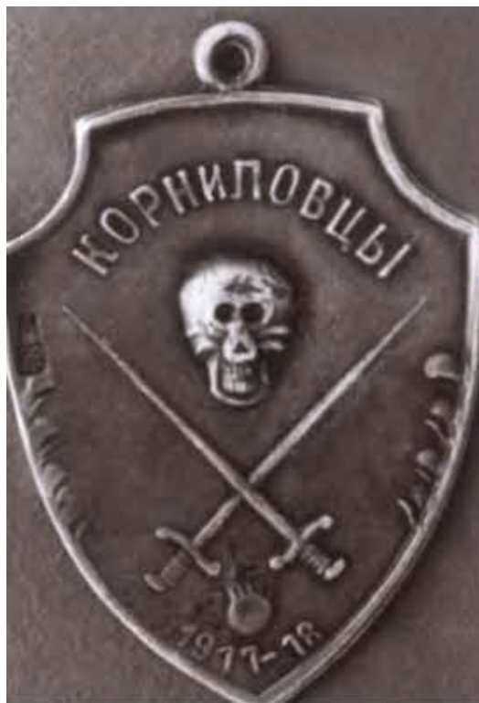
Памятный жетон, продававшийся на передвижной выставке, посвященной памяти Л. Г. Корнилова.