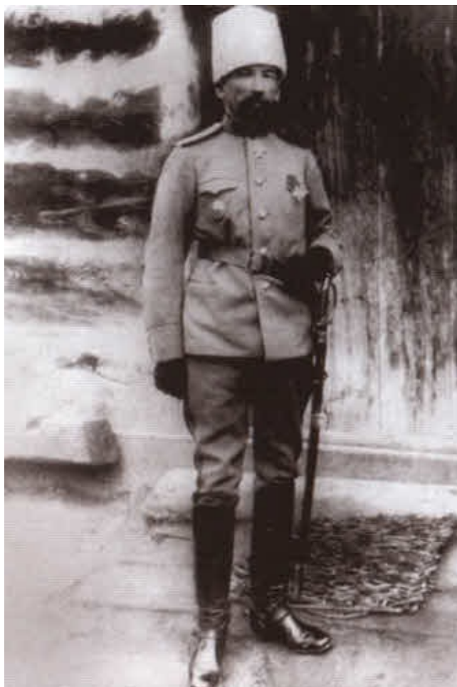
Генерал-лейтенант Л. Г. Корнилов после побега из австрийского плена. 1916.