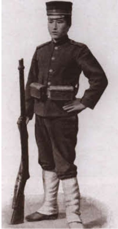
Японский пехотинец. 1904.