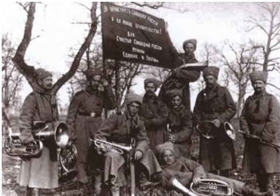
Так встречали Февральскую революцию на фронте.