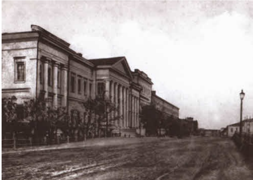
Сибирский кадетский корпус в Омске.