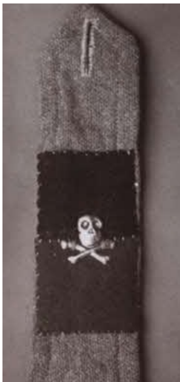
Самодельный погон рядового Корниловского полка.