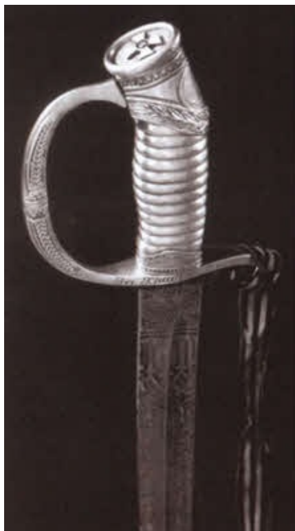
Награды Корнилова: знак ордена Святого Георгия III степени, Золотое оружие «За храбрость».