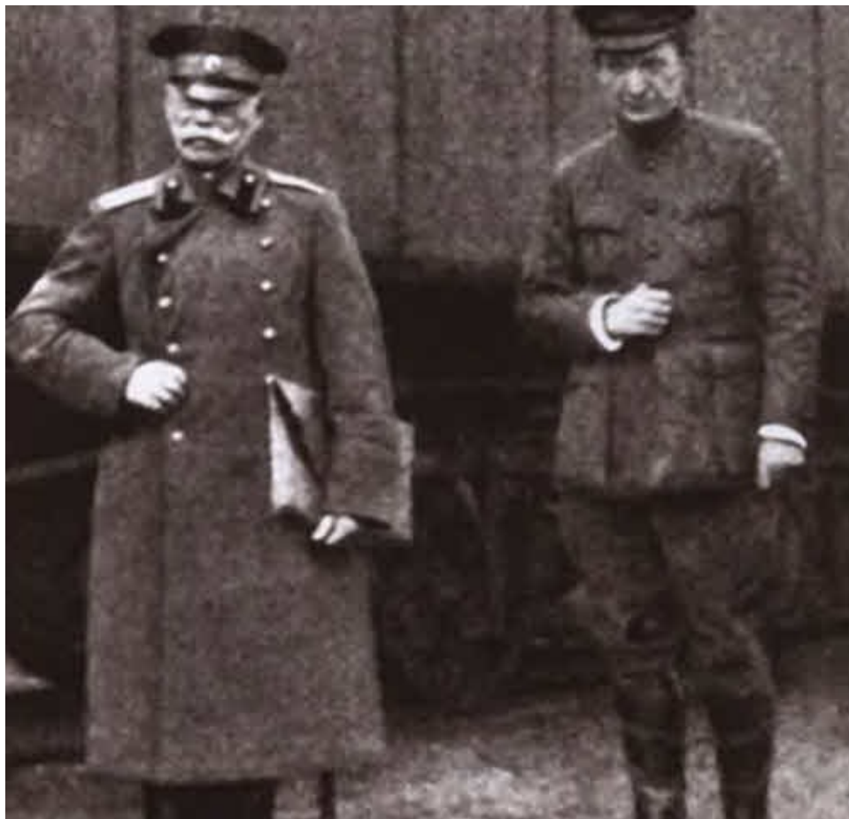
Начальник Генерального штаба М. В. Алексеев и А. Ф. Керенский летом 1917 года.