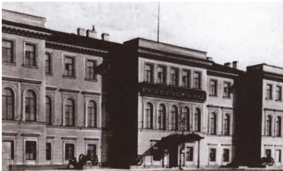
Открытка конца XIX в.