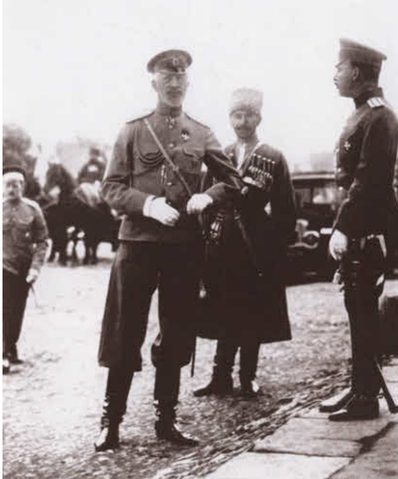
Главнокомандующий русской армией великий князь Николай Николаевич (слева). 1914.