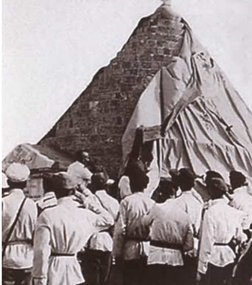
Открытие памятника Белому движению в Галлиполи. 1921