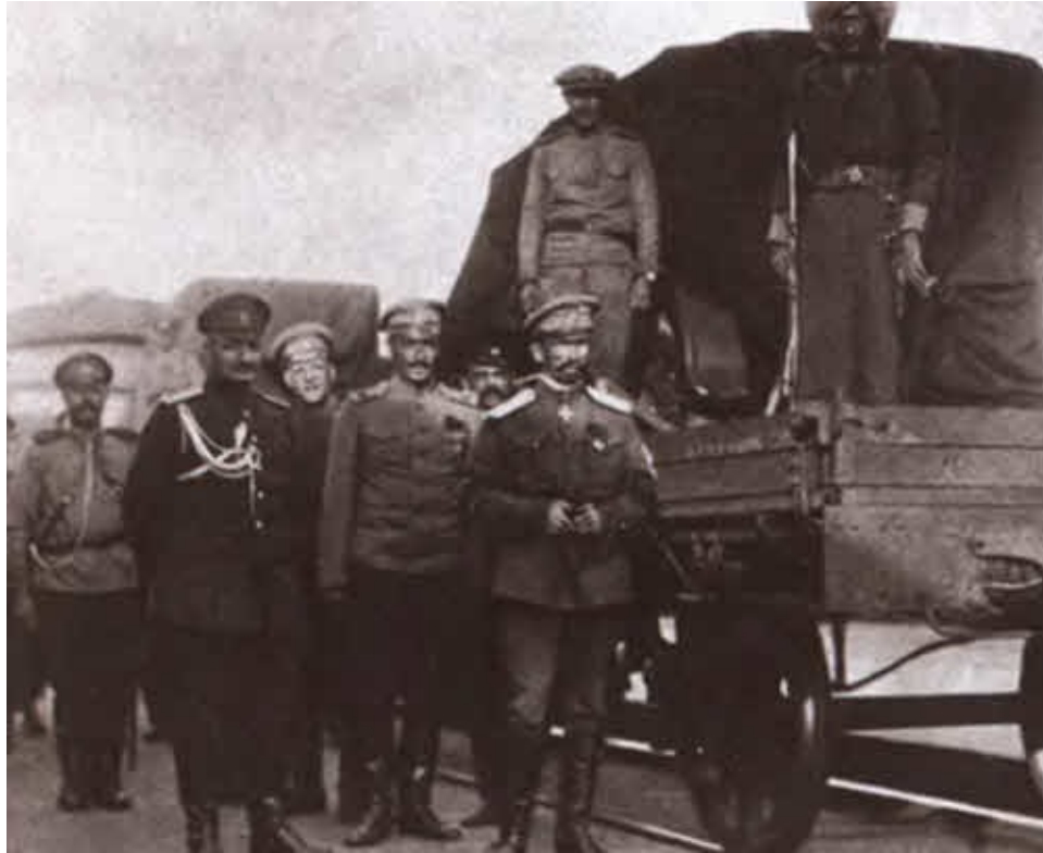
Корнилов в Москве в августе 1917 года.