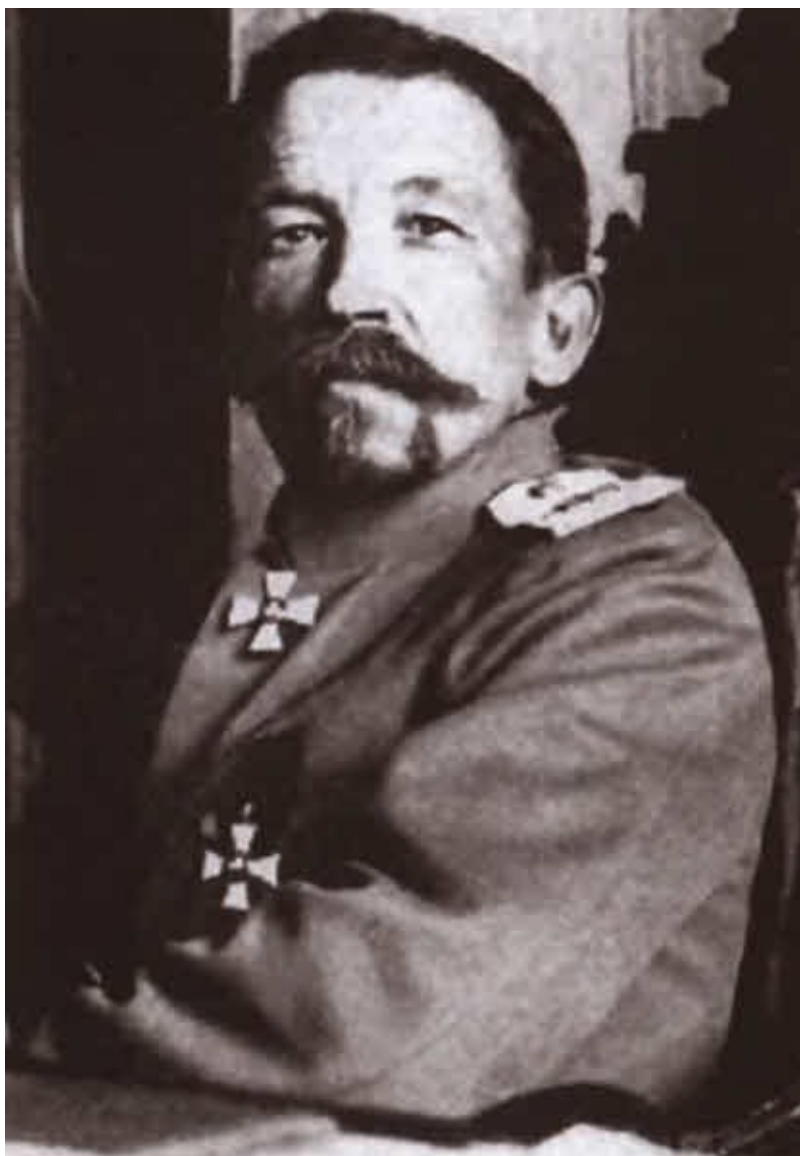
Первый командующий Добровольческой армией генерал от инфантерии Л. Г. Корнилов.