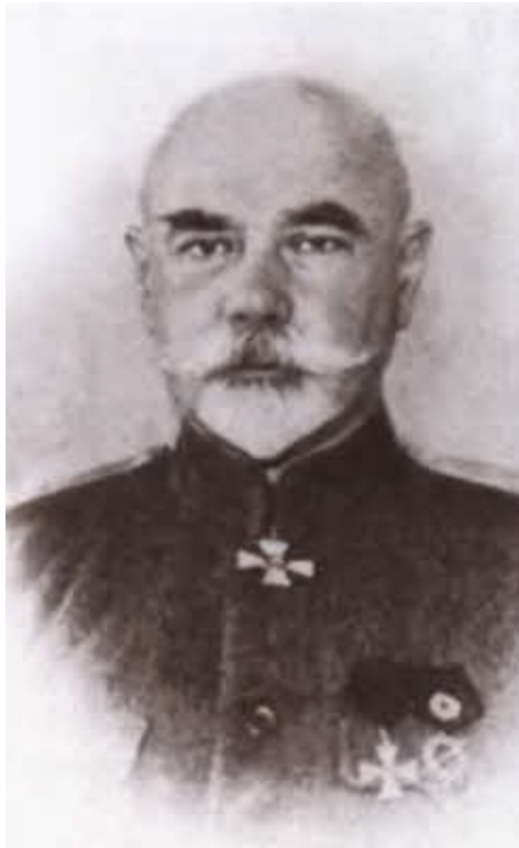
Открытка начала XX в.