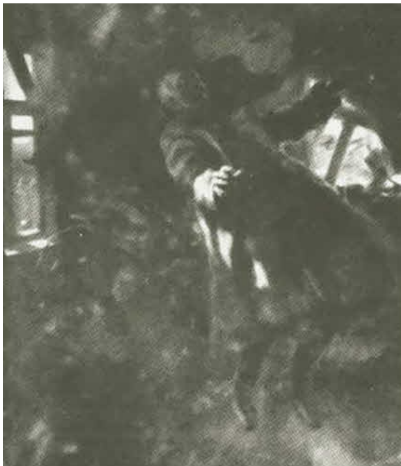
Смерть генерала Корнилова.

Картина неизвестного художника, составлявшая центр экспозиции передвижной выставки, посвященной памяти Л. Г. Корнилова. 1919.