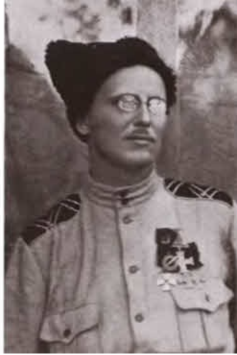
Участники Ледяного похода генералы Е. Ф. Эльснер и Н. С. Тимановский.