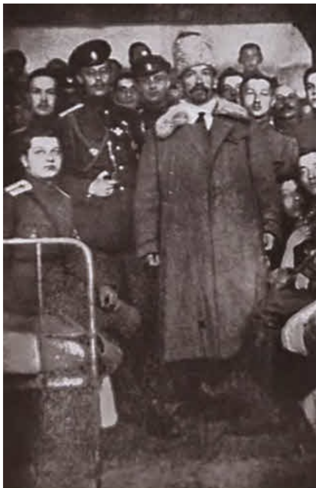
Л. Г. Корнилов в офицерской казарме в Ростове-на-Дону.