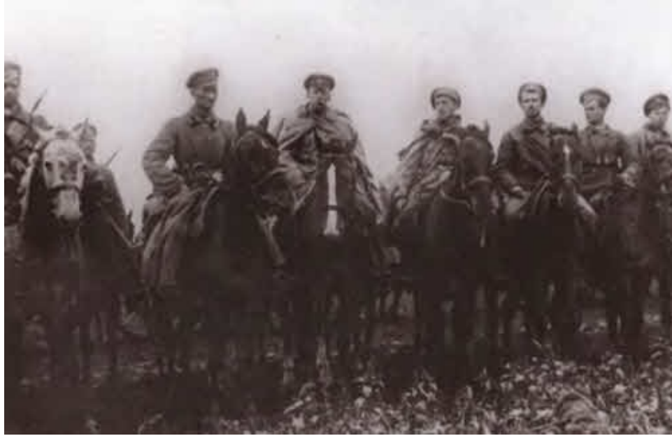
Группа командиров частей Красной гвардии на Дону.