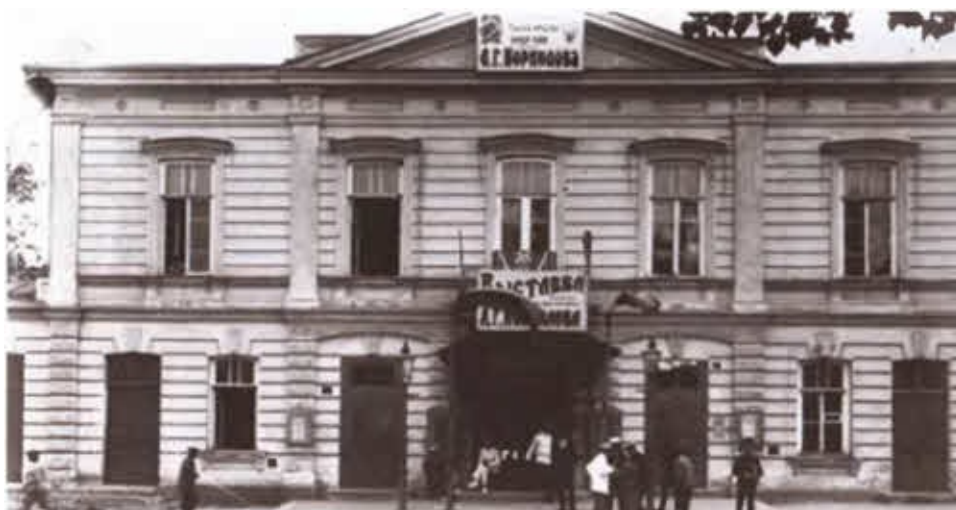
Здание в Таганроге, в котором летом 1919 года проходила выставка, посвященная памяти Л. Г. Корнилова.