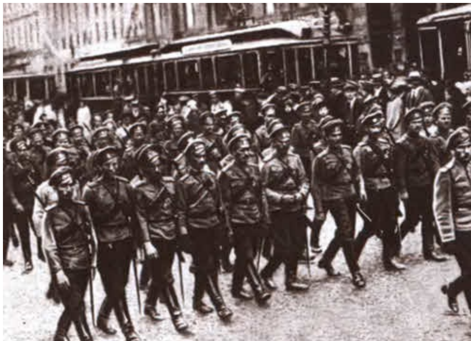
Верные правительству части, вызванные в июле 1917 года с фронта для подавления беспорядков.