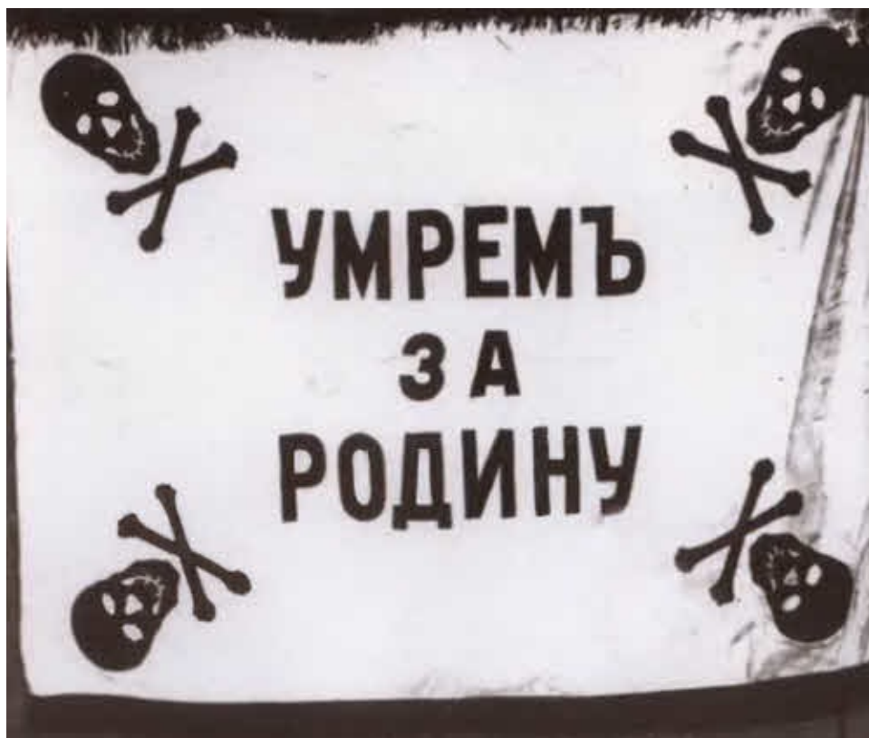
Знамя одного из «полков смерти». 1917–1918 гг.