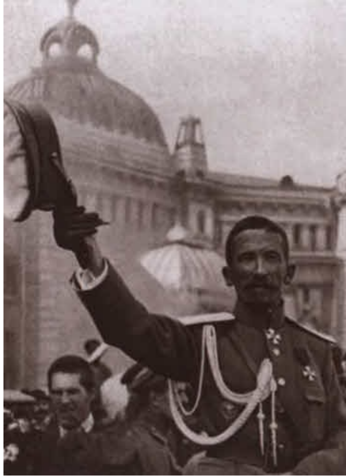
Лавр Георгиевич Корнилов в 1917 году.