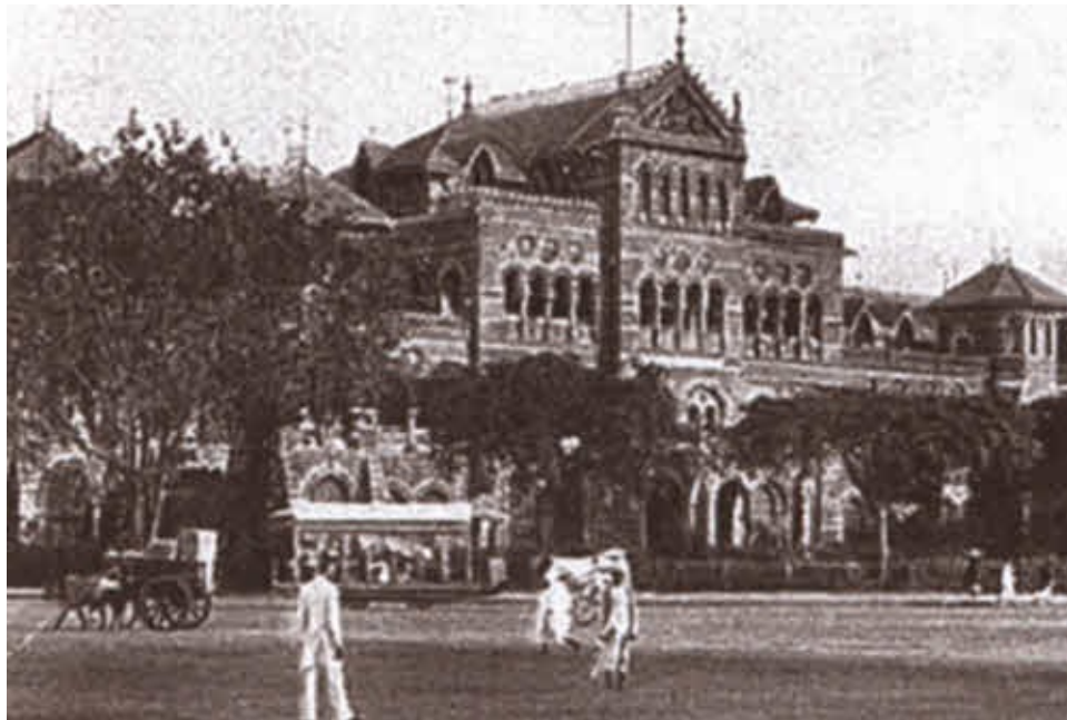
Административное здание в Бомбее.