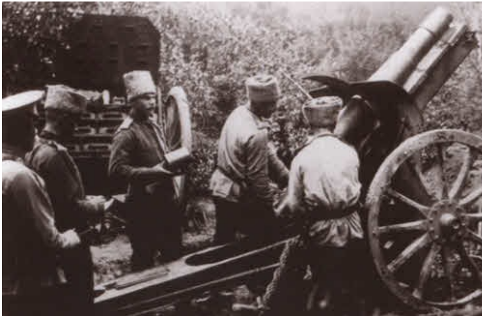
Русская артиллерия встречает австрийскую пехоту.