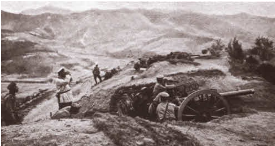
Русская артиллерия на позиции. 1904.