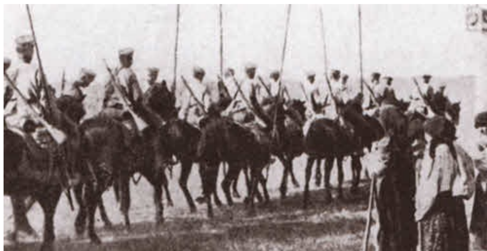
Русская кавалерия пересекает границу австрийской Галиции в 1916 году.