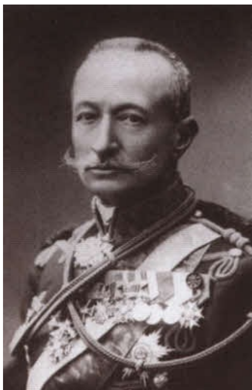
Командующий Юго-Западным фронтом генерал от кавалерии А. А. Брусилов.