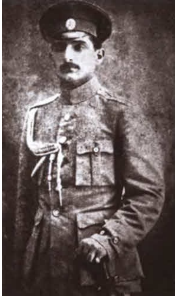
Поручик Р. Хаджиев, адъютант Л. Г. Корнилова. 1917.